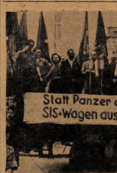
Niemiecka Republika Demokratyczna — to najbardziej wysunięty oddział obozu pokoju...