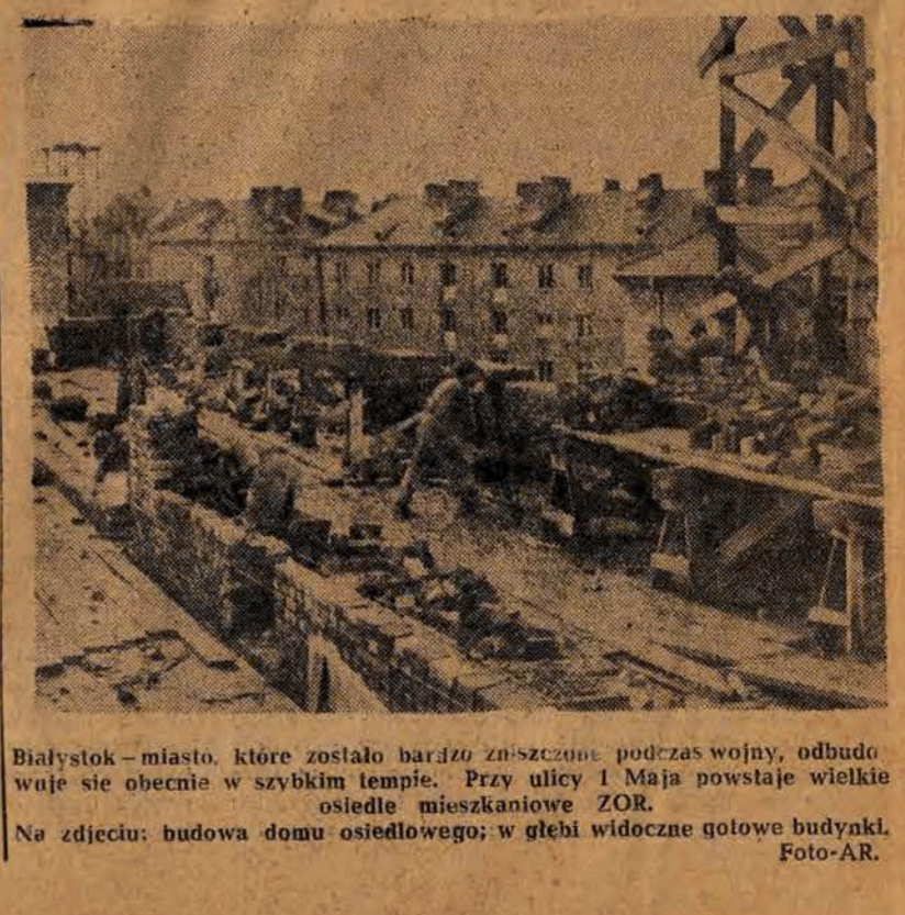
Białystok — miasto, które zostało bardzo zniszczone podczas wojny, odbudowę się obecnie w szybkim tempie...

Zobowiązania, których wykonanie przewidywano na 25 bm., zostały realizowane już w dniu 18 bm., to znaczy 7 dni przed terminem.