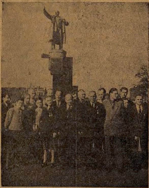
Delegacja chłopów polskich pod pomnikiem Lenina w Leningradzie

Propozycja wyjazdu do Związku Radzieckiego przyszła zupełnie niespodziewanie. Komitet Wojewódzki PZPR w Poznaniu zawiadomił członków naszej spółdzielni produkcyjnej, że mamy wybrać spośród siebie jedną osobę, która weźmie udział w wycieczce chłopów polskich do ZSRR. Chętnych było wielu, a prawdę mówiąc każdy z nas chciałby na własne oczy przekonać się, jak żyją i pracują ludzie w Związku Radzieckim.