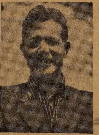
Laurent Premii Stalinowskiej — A. Surkoc — bawił w Warszawie na zjeździe literatów polskich.

Przewidywaliśmy tylko 6 kolchozów, bo na więcej czasu nie wystarczyło. Ale w podróży, z okien wagonów i autokarów, oglądaliśmy setki innych, a na polach tysiące ludzi, szczęśliwych i zadowolonych, pracujących z uśmiechem i pieśnią na ustach, dobrze ubranych, nawet przy codziennej pracy.