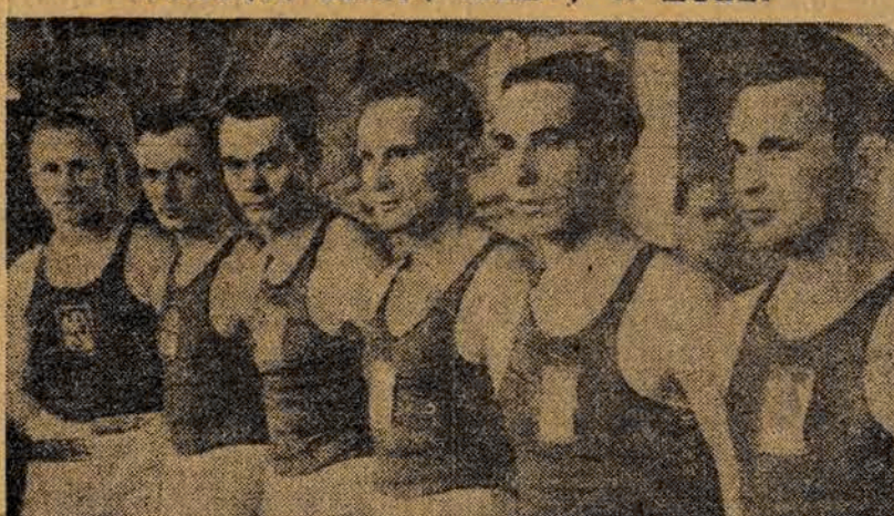
AZS (Wrocław) zdobywca I miejsca

Drugi dzień turnieju akademików w siatkówce męskiej obok dwóch spotkań w tej konkurencji przyniosł również dodatkowo mecz szermierczy, rozegrany pomiędzy AZS Łódzkim i ŁKS-Włóknierzem. Zawody te przyniosły zwycięstwo 12:4 ŁKS-Włóknierzowi.