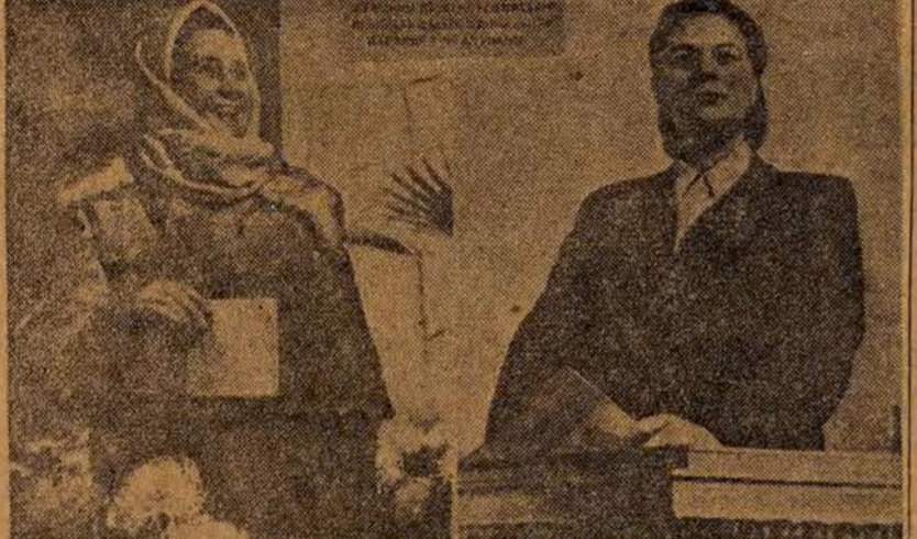
„Niech żyją równouprawnione kobiety ZSRR” — głosi afisz wyborczy do Rady Najwyższej Związku Radzieckiego. Wszystkie kobiety radzieckie wiedzą dobrze, że nie jest to jakiś tzw. „slogan wyborczy”, lecz głęboka prawda, wzięta z radzieckiej rzeczywistości.