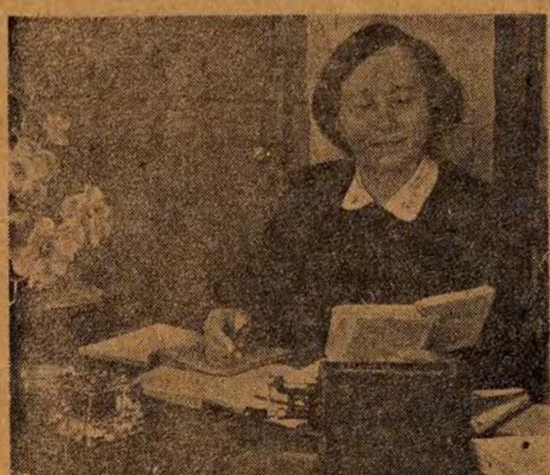
Kobiety radzieckie stanowią blisko 50 procent tzw. specjalistów z wyższym wykształceniem...