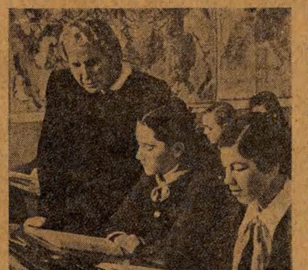
Przeszło 2.000.000 kobiet radzieckich pracuje w szkołach nad upowszechnieniem oświaty...