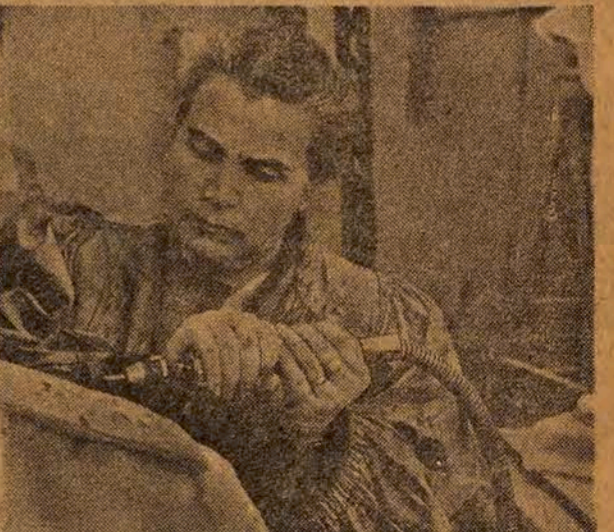
Kobiety radzieckie stanowią przeszło połowę ogółu pracowników frontu kulturalno-artystycznego...