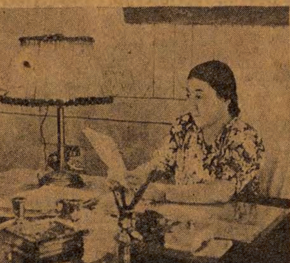
Doktor Alia Umarowa piastuje wysokie stanowisko zastępcy ministra ochrony zdrowia Uzbekkiej SRR.