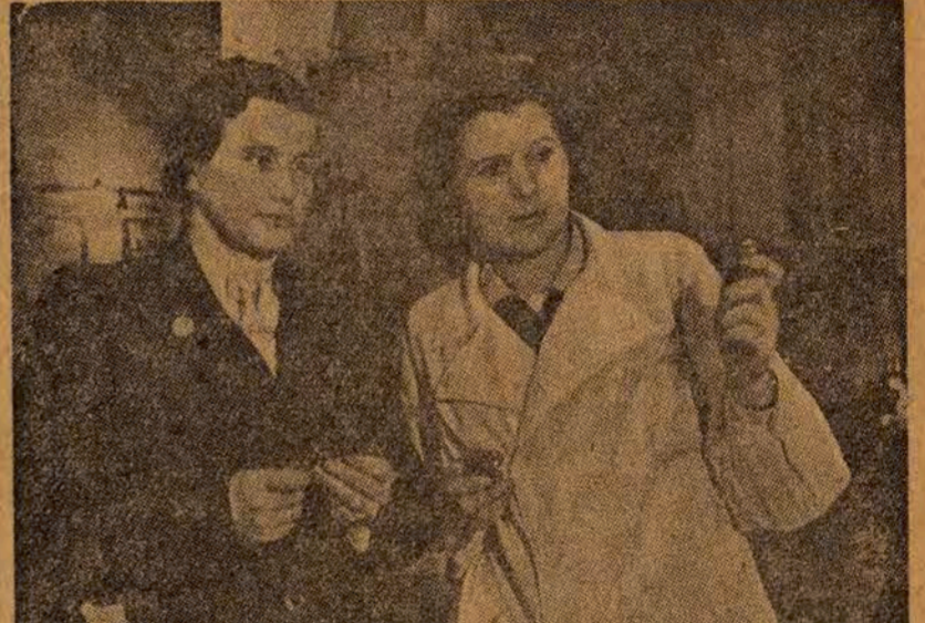
300.000 kobiet radzieckich zajmuje stanowiska inżynierów, techników i majstrów...