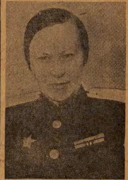
General Zenaida Troicka