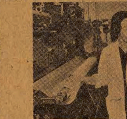
W samym tylko przemyśle włókienniczym 1814 kobiet radzieckich zajmuje stanowiska naczelnych dyrektorów, inżynierów, techników i majstrów...

Tysiące kobiet radzieckich zajmuje odpowiedzialne stano-