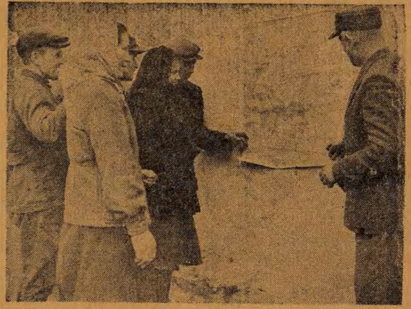
W bieżącym roku powstała jako pierwsza w powiecie Jędrzejowskim, woj. kieleckiego...