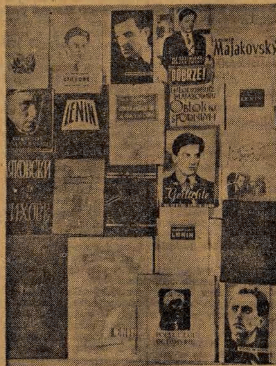
Dzieła Majakowskiego, stanowią cenną pozycję w literaturze świata.

W nowej Polsce, Polsce wolnej, dążącej ku socjalizmowi, — Majakowski stał się jednym z najbardziej popularnych poetów polskiej klasy robotniczej, polskich mas pracujących. P. Juriew.