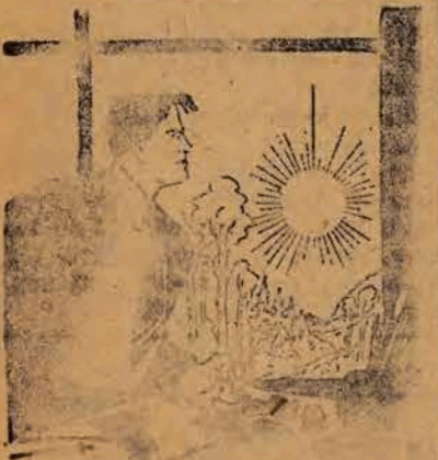
Majakowski rysuje plakat ROSTY (rysunek poety).

W roku 1911 zmarł wielki malarz rosyjski W. Sierow. Na łamach moskiewskiego dziennika „Russkoje Slowo” ukazała się wówczas wzmianka, w której bodajże po raz pierwszy zamieszczono, zostało nazwisko Włodzimierza Majakowskiego: