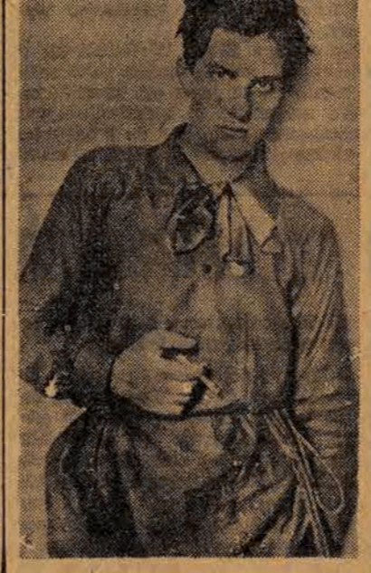
W. Majakowski w okresie uczęszczania do Szkoły Rzeźby, Sztuki i Architektury w Moskwie. (Zdjęcie z r. 1911).

Włodzimierz Majakowski był członkiem związku artystów-plastyków. Obok słynnego malarza rosyjskiego, Korowina, pisał o nim godność przedstawiciela malarzy moskiewskich w Piotrogrodzkiej Radzie Artystycznej.