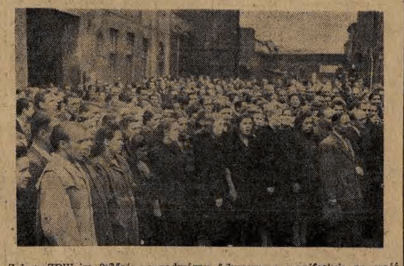
Załoga ZPW im. 9 Maja na podwórzu fabrycznym manifestuje na cześć 33 rocznicy Rewolucji Październikowej.