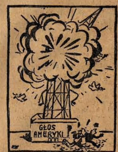
Eksplozja „bomby kłamstw”

Jedną z anten radiowych „Głosu Ameryki” pękła na skutek nie wyjaśnionej eksplozji.