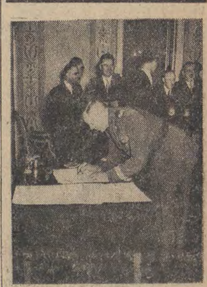
Na zdj.: Marszałek Konstanty Rokossowski składa podpis w księdze audiencyjnej 1 stycznia 1951 r. w Belwederze.

Tego poparcia polityce ZSRR udziela ją wszyscy uczeni ludzie na świecie.