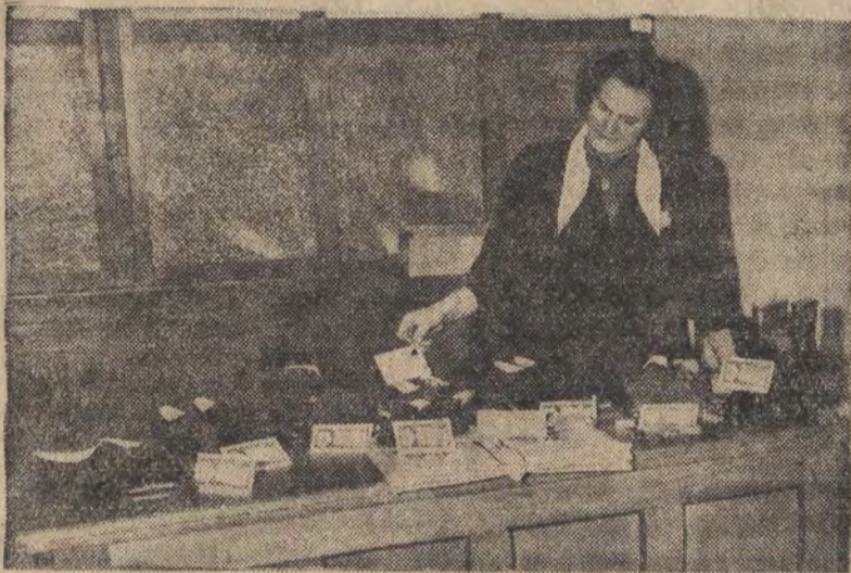
Ekspedientka w sklepie uspołecznionym zmienia kartki z cenami. Pantofle męskie na „słoninie” kosztują 240 zł. (dotychczas 300 zł.), damskie — 216 (270), teczka ze świńskiej skóry zamiast jak dotąd 450 zł. — kosztuje obecnie 360 zł.