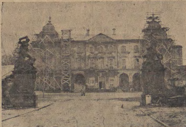
W bieżącym roku rozpoczęła pracę w Białymstoku druga z kolei wybudowana uczelnia — Akademia Lekarska.

Na zdj.: odbudowywany obecnie zabytkowy Pałac Branickich, w którym mieści się Akademia.