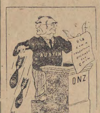
DWULICOWY JANUS Z WASHINGTONU

Posiedzenie Sejmu Ustawodawczego R.P. odbędzie się w dniu 18 stycznia 1951 r. o godz. 10-ej.