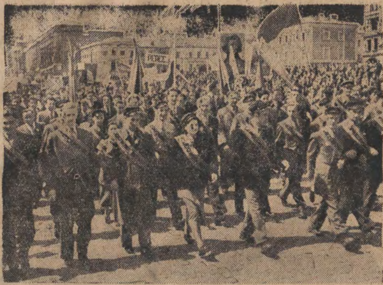
Z manifestacji 1-majowej w Warszawie.

Zdjęcie u góry: przodownicy nauki Politechniki Warszawskiej w pochodzie.