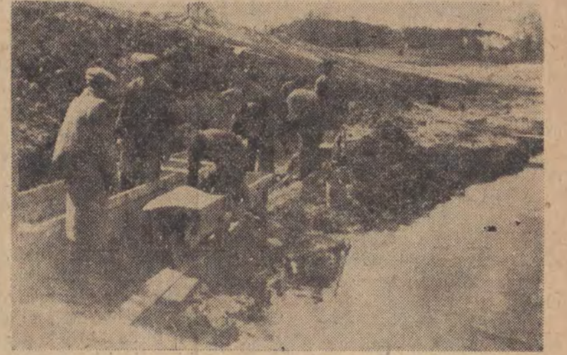
Prace przy budowie stawu i plaży w Rudzie Pabianickiej postępują szybko naprzód. Może więc już w tym roku będziemy mogli zażywać tu ożywczego kąpielii...