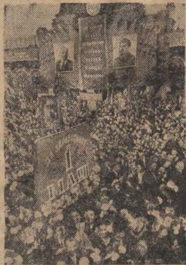
Manifestacja mas pracujących w Moskwie 1 Maja 1951 r. Na zdjęciu: masy pracujące Moskwy na Placu Czerwonym.