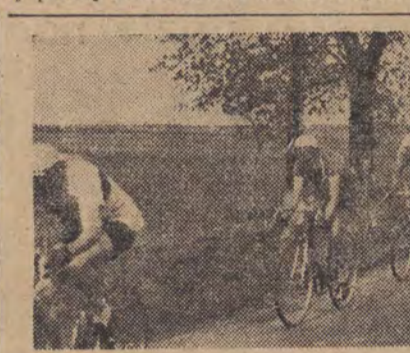
Naprzód! Różnobarwny węz kolarzy rozwinął się na szosie. Który z nich pierwszy przybędzie do Warszawy?

Przed zakończeniem etapu odbył się na stadionie pokaz tańców ludowych w wykonaniu 400-osobowej grupy młodzieży szkół zawodowych. Gimnastycy ZKS Stal ze Świdnicy wykonali szereg efektownych ćwiczeń. Następnie na stadion wkroczyły poczty sztandarowe zrzeszeń sportowych, które ustawiły się przed trybuną główną. Kierownik grupy złożył meldunek przewodniczącemu ORZZ i członkowi Wojewódzkiego KOP pos. Łódź-Sowińskiemu.