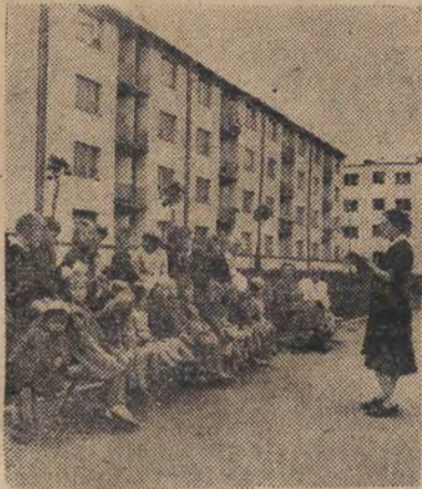
Rada Kobieta Osiedla WSM - Zolibórz w Warszawie zorganizowała zbiorowe spacerki dla dzieci nieobjętych akcją przedszkoli. Na zdjęciu: Dzieci słuchają z zaciekawieniem opowiadania czytanego przez przedszkolankę.

W szkołach odbędą się uroczyste zebrania poświęcone Międzynarodowemu Dniu Dziecka.