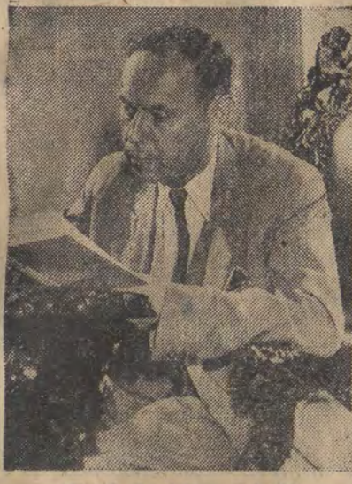
Prof. dr Adam Schaff.