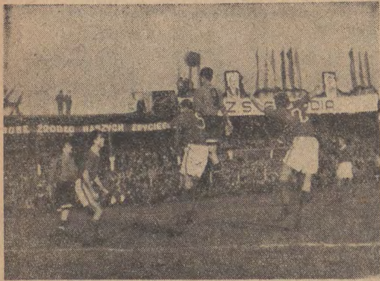
Kraków przeżywał wielki dzień, gdy drużyna piłkarska Dynamo - Tbilisi