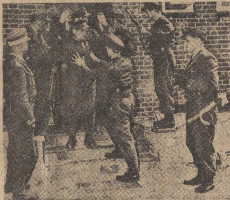
Najemne wojska zachodnio-niemieckie na rozkaz swych amerykańskich panów odbywają ćwiczenia wojskowe. Żołnierze ci ćwiczą... walki uliczne. Cel jasny — głównym wrogiem imperialistów jest lud niemiecki i z nim trzeba przede wszystkim walczyć. Na zdjęciu: fragment „ćwiczeń”.

Zagadnieniu temu będzie poświęcone jeszcze w bieżącym tygodniu specjalne posiedzenie rady ministrów.