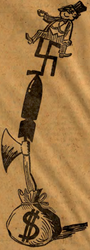
PODŻEGACZ WOJENNY: Mnie się nie może stać nic złego, ja mam przecież punkt oparcia...

Tak się zaczęła „polityczna czystka fryzjerów” w Milwaukee, stan Wisconsin.