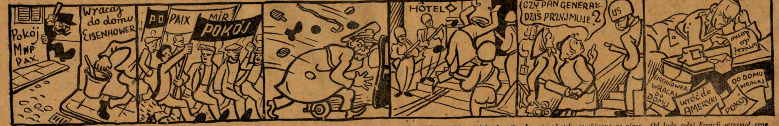
Pięknie był udekorowany Paryż na przybyte gen. Eisenhowera. Liczne delegacje pospieszyły powitać nóżko gościa. Generał obsypało mnóstwem cennych podarków. Gość w skromności swojej schronił się przed owacjami do hotelu. Lecz i w hotelu oczekivano na niego z owacjami. Od ludu całej Francji otrzymał generał wiele serdecznych życzeń.