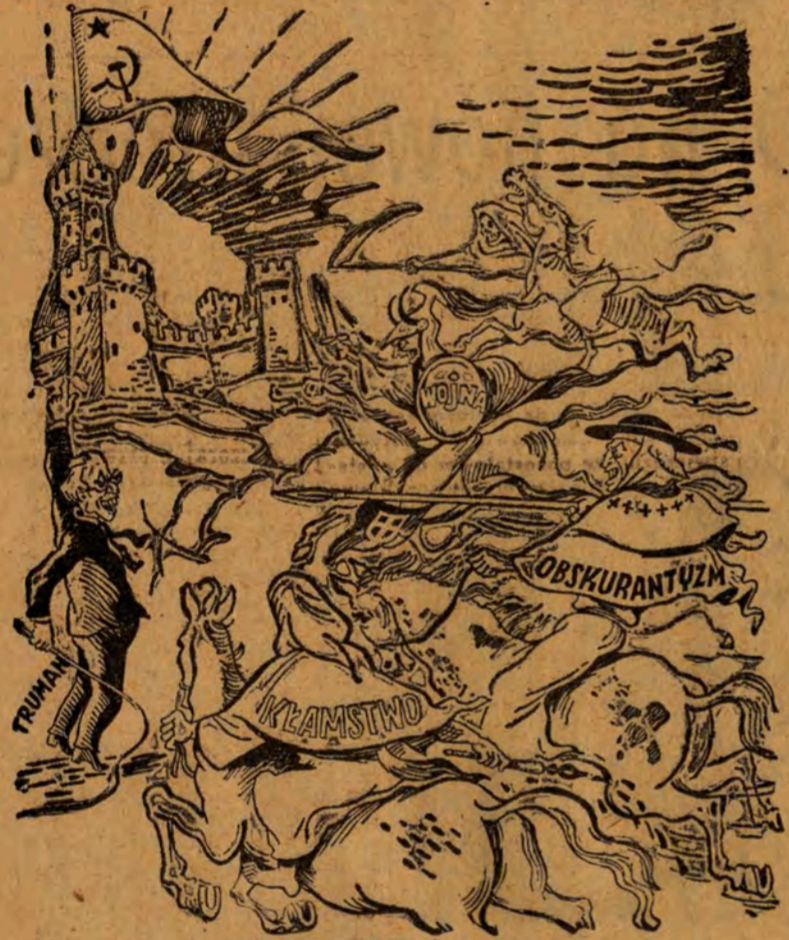
TRUMAN I JEGO „KAWALERIA”

Co prawda, w Federalnym Biurze Śledczym, na czele którego stoi sławiony Hoover, nie znalazł się odesków palców Beethovena, które ujawniłby jego próby podrywania amerykańskiego sposobu życia. Nie pozostały również ich ślady i na tych klawesynach, na których genialny twórca nigdy grywał.