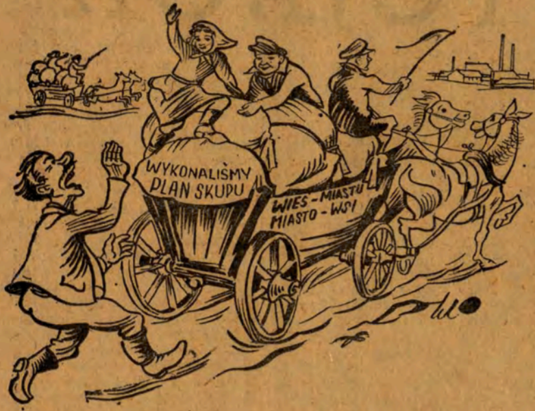
KULAK: Zatrzymajcie się, czego się spieszcziel!