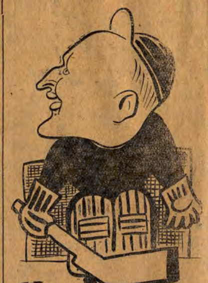
Styczyński — bramkarz LKS „Włókniarz”