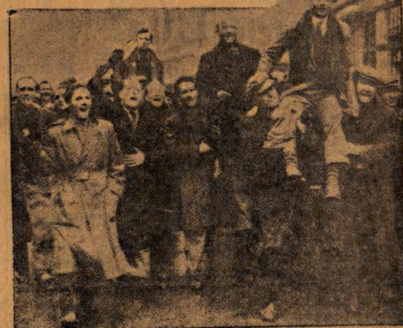
Strajkujący dokerzy londyńscy niosą przez ulice miasta swych towarzyszy, zwolnionych z aresztu na skutek masowych demonstracji i protestów.