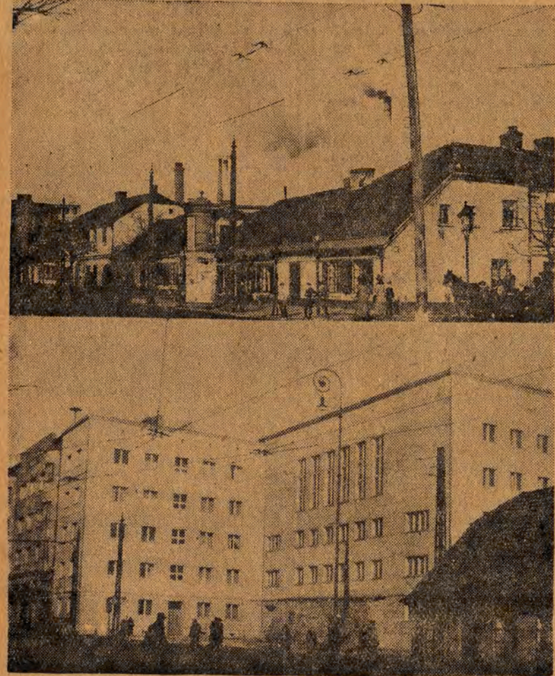
Fragment ul. Piotrkowskiej, róg Brzeźnej przed laty i dziś.

Jakież konkretne zadania możemy zlecić do wykonania sportowcom, członkom koła? Przeprowadzenie pogadanki na ściśle określony temat zorganizowania porannej gimnastyki w internacie zakładowym, omówienie spotkania z innym zespołem w siatkówce, dekoracja lokalu koła, prowadzenie książki rekordów koła, prowadzenie kroniki sportowej koła, opracowanie referatu na wieczornicę, przygotowanie recytacji, obsadzenie kasy i przygotowanie biletów na płatną imprezę koła, zakontraktowanie spotkania z innym zespołem, opracowanie trasy wycieczki niedzielnej koła i dziesiątki innych podobnych zadań. Konkretne zadania nie przerażają nikogo, gdyż w założeniu noszą cechy wykonalności i przez to są chętnie podejmowane, nawet przez mniej wyrobionych członków koła. Na konkretnych zadaniach uczymy członków koła odpowiedzialności i sumienności za wykonanie prac zleconych. Konkretne zadania stanowią najlepszą drogę do wychowania sobie licznych kadr organizatorów, bez których koło nie może należycie się rozwijać. Umiejętność rozdzielania konkretnych zadań jest gwarancją powodzenia pracy w kole. Na tę zasadę zupełnie słusznie zwraca wielką uwagę N. Makarczew.