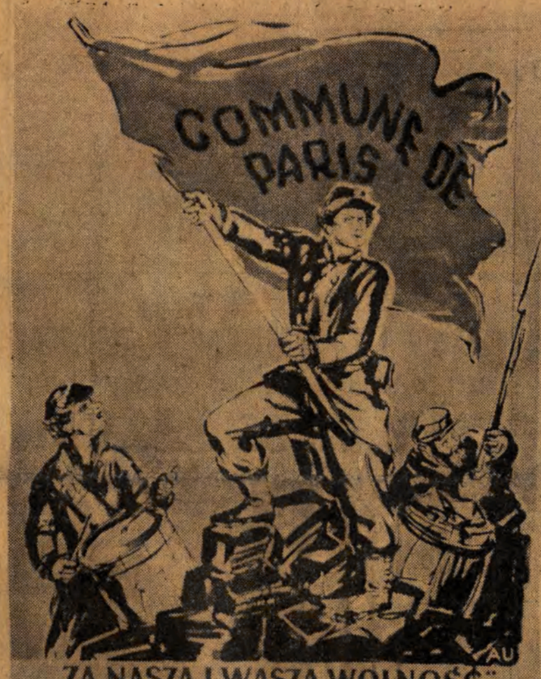
„ZA NASZĄ I WASZĄ WOLNOŚĆ“ WALCZYLI POLACY NA BARYKADACH KOMUNY PARYSKIEJ 1871-1951