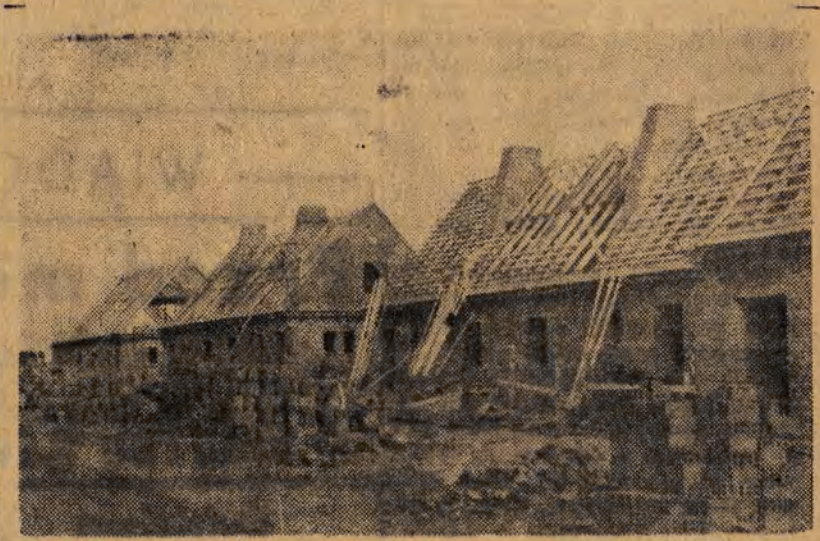
W szybkim tempie prowadzona jest budowa robotniczych domków jednorodzinnych w Osiedlu im. Marchlewskiego.