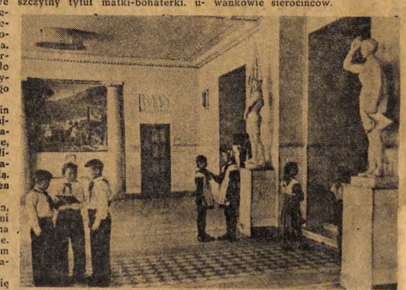
Pałac pionierów w Astrachaniu