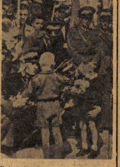
Dzieci kwiatami obdarowują żołnierzy Ludowego Wojska Polskiego, tegorocznego obrońcę „Głosu Robotniczego” Armii Radzieckiej, wywalczyli nam wolność.