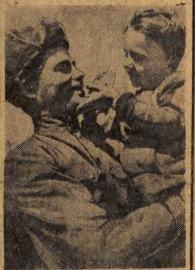
Gorąco miłością pełną serca milionów dzieci do żołnierzy bohaterów Armii Radzieckiej, która stoi na straży ich szczęścia i radosnej przyszłości.

Prosimy o wycięcie powyższego kuponu i zgłoszenie się z nim jutro w najbliższym kiosku, do odbiór niedzielnej gazety.