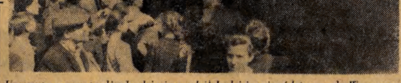
Wojewódzki zjazd ligi przyjaźni żołnierza

W. W. Uroczysty moment odjazdu dzieci ze szkoły Łodzi i województwa — do Warszawy.