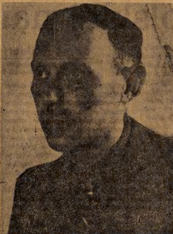
Prof. dr ADAM SCHAFF Uniwersytet Warszawski