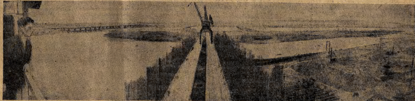
Ogólny widok potężnej cymlińskiej tamy wodnej. Na dalszym planie stare koryto Donu. Na przedzie Don płynie nowym korytem poprzez tamę, na której stanęły turbiny wielkiej elektrowni.