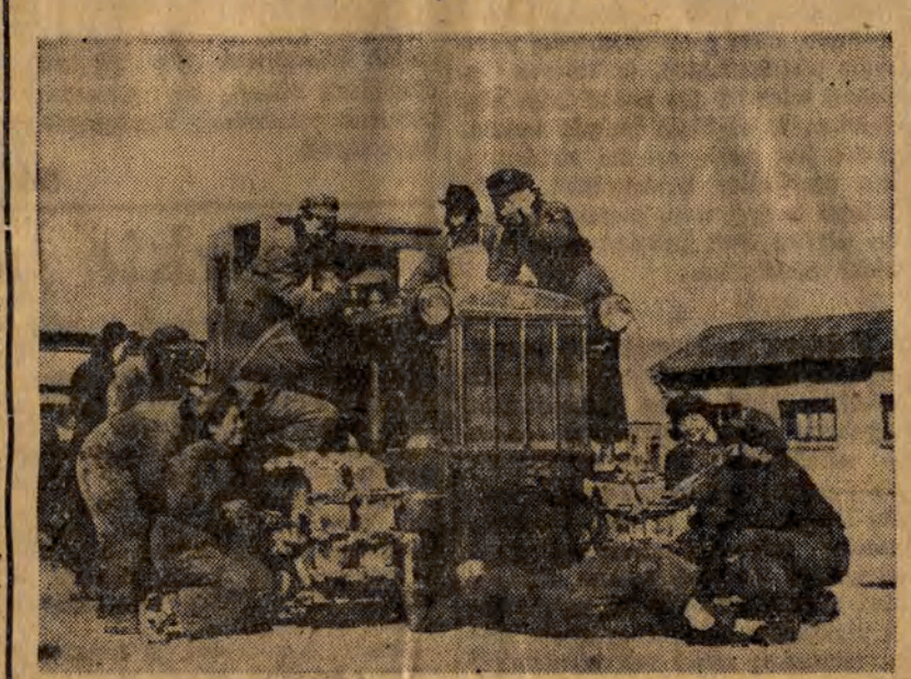
We wszystkich prowincjach Chin Ludowych zostały zorganizowane kursy rolnicze, na których utracony chiński przechodził zsiadłość...