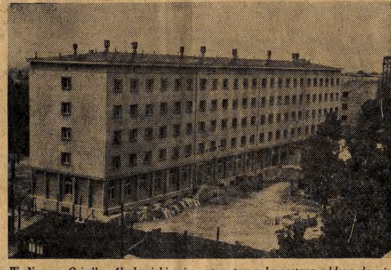
W Nowym Osiedlu Akademickim jeszcze w tym roku zostaną oddane do użytku 4 dalsze domy.

ponad 63 proc. młodzieży studiuje go roku akademickiego. W sobotę, 29 bm., w godzinach wieczornych, capstrzyk studencki przeciągnie ulicami: Narutowicza, Piotrkowską, Stalina na Plac Zwycięstwa. W niedzielę, 30 bm., przez cały dzień odbywać się będą liczne imprezy, or-