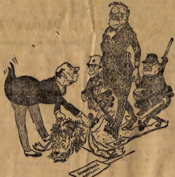
BRITYSKA SUWERENNOŚĆ („O trwały pokój, o demokrację ludową”).

konkretnie postanowienia co do ulepszenia metod pracy.