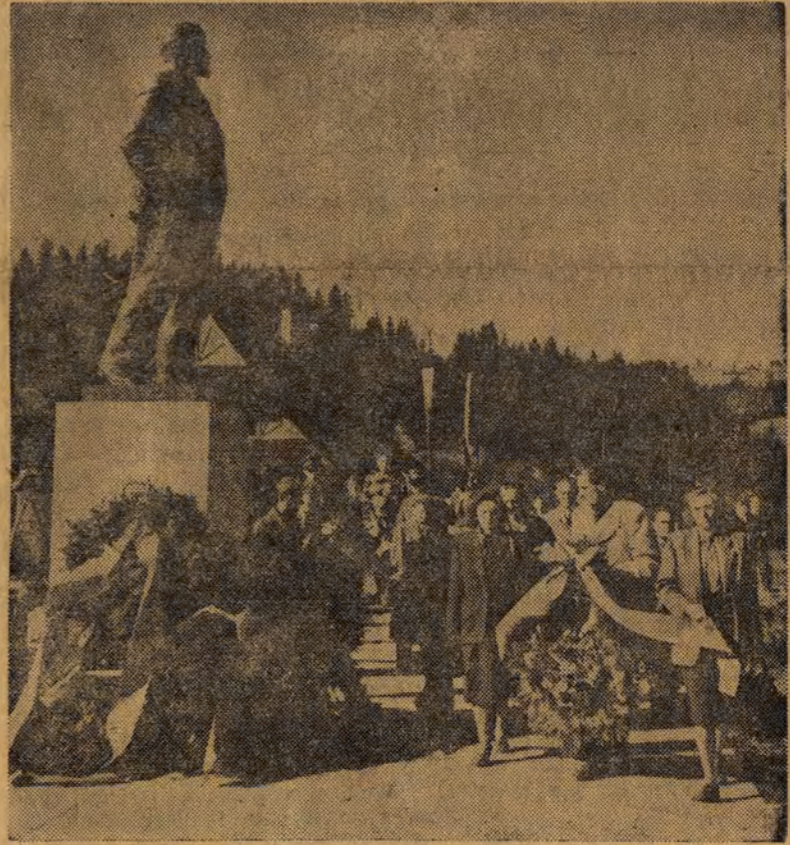
W ramach Miesiąca Pogłębiania Przyjaźni Polsko-Radzieckiej delegacje urzędów i organizacji Zakopanego złożyły wieniec i kwiaty pod pomnikiem Lenina w Poroninie.