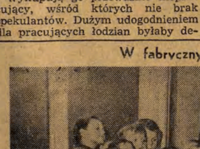
Przez radiowęzeł w Zakładach im. Marchlewskiego transmitowany był występ dzieci z przedszkola, pragnących w ten sposób umilić swoim rodzicom przerwy obiadowe.