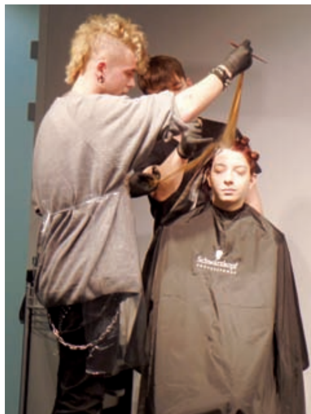
Szkolenie dotyczyło technik koloryzacji, strzyżenia i stylizacji.

W gminach, których nie uwzględniliśmy w powyższym zestawieniu, terminy zebrań są jeszcze odległe. mak