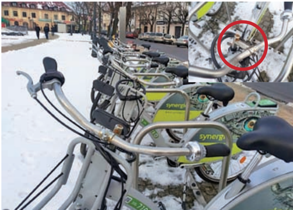
Na rowerach jest już widoczna rdza, pojawiła się ona przy „mostku” mocującym kierownicę, co lepiej widać na zbliżeniu (w prawym górnym rogu).

Dlatego tym bardziej może martwić, w jakim stanie technicznym rowery będą za kolejnych kilka miesięcy, wiosną – bo przecież liczone na to, że wtedy zaczną być intensywnie użytkowane – a w jakim po kilku takich sezonach, w wilgoci na przemian z mrozem. Bo przypomnijmy, że jednym z głównych założeń pro-