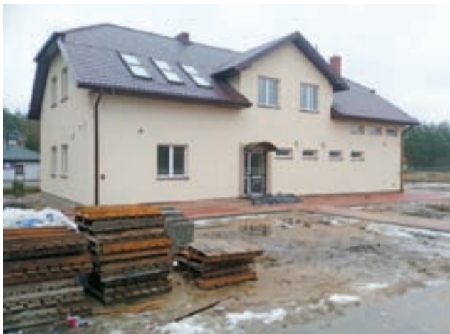
Budynek świetlicy wiejskiej w Dzierzówku na kilka dni przed odbiorem – na zdjęciu widać palety stojące przed budynkiem i niezagospodarowane trawniki.

– Wokół świetlicy panuje bałagan, jakby nadal prowadzono prace, pierwszy raz się spotykam z takim podejściem wykonawcy,