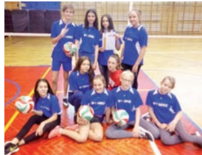
Złote siatkarki z SP 1 Łowicz.

Turniej półfinałowy odbył się 24 stycznia w Skierniewicach. W zawodach miały prawo startu mistrzynie powiatów z rejonu rawskiego. Ostatecznie do gry przystąpiły cztery szkolne reprezentacje, które zagrały systemem