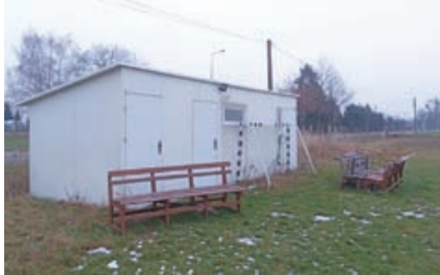
Jedynym obiektem, jaki stoi na boisku, jest blaszany barak, na którym nie ma nawet nazwy LZS Fenix.

Kolejną zmianą było wprowadzenie nowego zadania – wykonanie wspomnianego oświetlenia na boisku w Boczkach Chełmońskich. Gmina starać się będzie o dotację w wys. 100 tys. zł z Urzędu Marszałkowskiego. Pieniądze na wkład własny, 120 tys. zł, pochodzą ze zmniejszenia planowanych wydatków na remont Szkoły