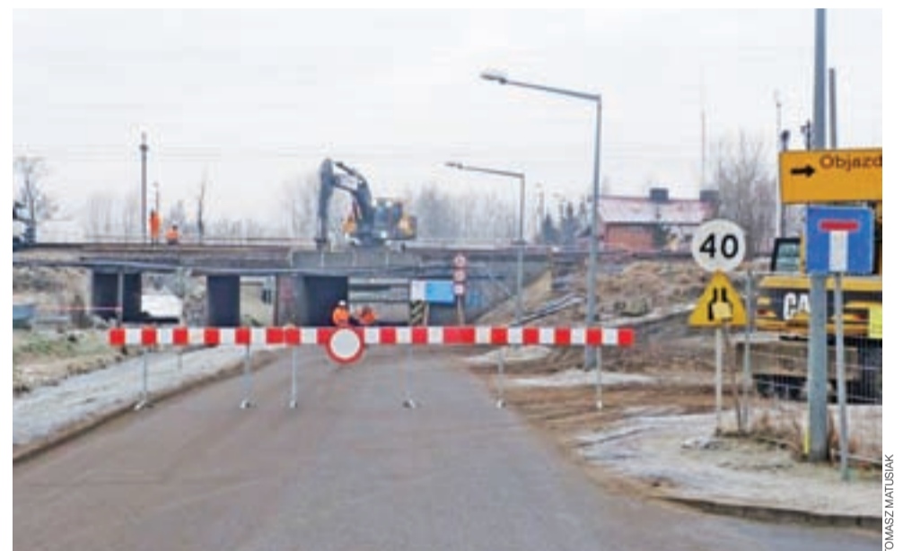
Ulica Arkadyjska kilka minut po zamknięciu dla ruchu odcinka pod tunelem.

Trwają też rozmowy z dzierżawcą targowiska dotyczące ostatecznej decyzji o rozmieszczeniu handlujących, którzy na czas robót będą zmuszeni opuścić pierwszą alejkę. Rozważanym wariantem jest przesunięcie i ściśnienie alejek tak, aby na wolnej od prac przestrzeni zmieściła się jeszcze jedna. Ostatecznej decyzji jednak jeszcze nie podjęto. tb