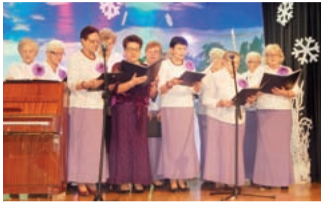
Zespół Wokalny Wrzосу w czasie jubileuszowego koncertu.