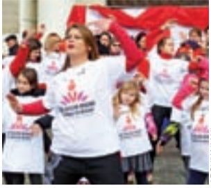
Zdjęcie z jednej z poprzednich edycji akcji „One Billion Rising” (w Polsce jako „Nazywam się Miliard”).