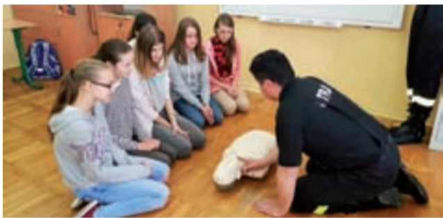
Uczniowie ze SP w Bąkowie Górnym z uwagą słuchają, jak należy właściwie przeprowadzać resuscytację.

W drugiej części zaprezentowali jak postępować z poszkodowanym – układanie w pozycji bezpiecznej, pokazali jak wygląda resuscytacja z wykorzystaniem automatycznego defibrylatora ze-