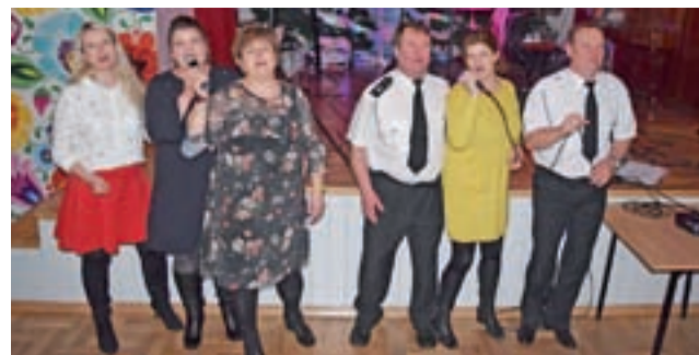
Karaoke było okazją do zaprezentowania talentów wokalnych.

Na koniec spotkania był tort urodzinowy oraz toast za zespół, którego członkowie, chcąc nacieszyć się jubileuszem, już nie występowali, ale słuchali swojego śpiewu z wcześniej zarejestrowanych nagrań. mwk