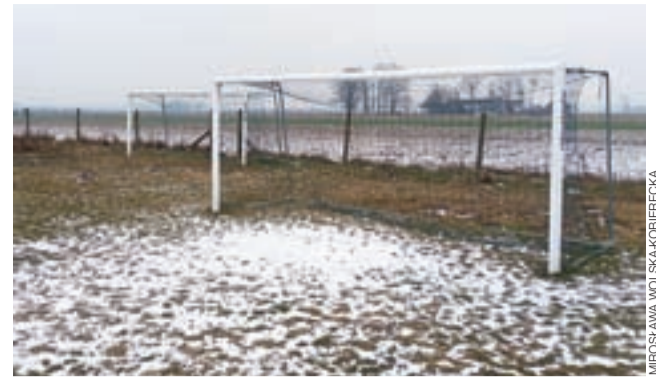
Gdyby nie bramki, to jadąc przez Boczki boisko można byłoby minąć, nie rozpoznając, że jest to obiekt sportowy.