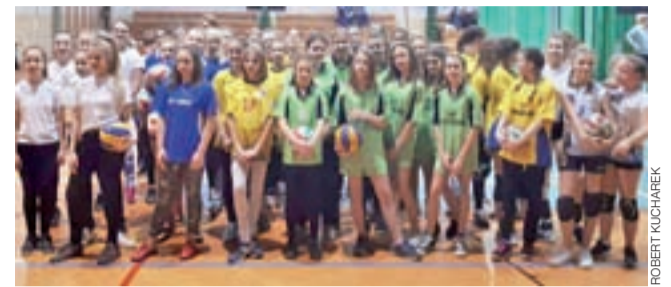
Uczestnicy Powiatowych Igrzysk Dzieci w siatkówce dziewcząt.

■ Grupa B: SP Bednary – SP w Kocierzewie 2:0, SP nr 1 w Łowiczu – SP w Bednarach 2:1, SP w Kocierzewie – SP nr 1 w Łowiczu 0:2.