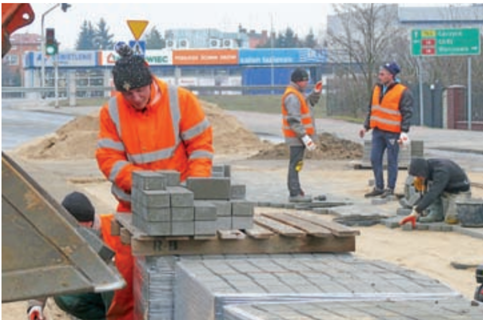
W miejscu, gdzie na ulicy Piaskowej był głęboki wykop została tymczasowo ułożona kostka, wiosną zastąpi ją asfalt.

Gospodynie KGW obawiają się biurokracji - i nie sięgają po rządowe pieniądze. str. 11