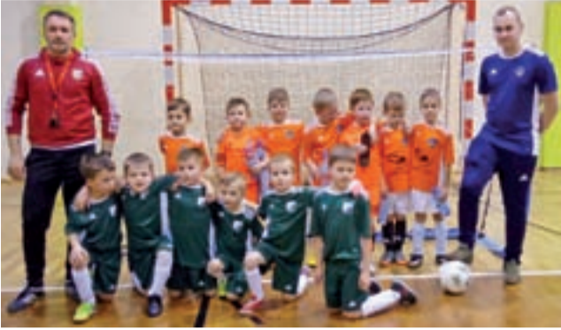
W sparingu MLKS Widok Skierniewice – UKS Soccer Kids nie zwracano uwagi na wynik.