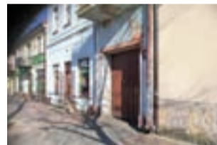
Wejście do kamienicy, w której wybuchł pożar.

Pożar wybuchł na parterze trzypiętrowego budynku wielorodzinnego położonego między Nowym Rynkiem a ul. Konopackiego, z bramą od strony Nowego Rynku. Z okien powypadały szyby, co sugeruje, że mogło dojść w środku do wybuchu (ale też mogły one popękać pod wpływem temperatury). Na szczęście nikt nie ucierpiał, pożar zniszczył natomiast jedno pomieszczenie wraz z okopconymi ścianami i całkowicie spalonym wyposażeniem, na które składały się m.in. łóżko, regał, dwie sofy, telewizor. Straty są wstępnie szacowane na około 15 tys. zł. Strażacy wynieśli też na zewnątrz butlę na propan-butan, która na szczęście nie wybuchła. Pożar został przez strażaków ugaszony zanim zdołał wy-