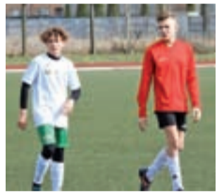
Zespół MUKS Pelikan 2005 przegrał z Ceramiką 1:4.

Pelikan 2005 przystępował do tego meczu po bardzo dobrym występie w próbie generalnej w Gąbinie, gdzie łowiczanie rozegrali się z rywalami, zwyciężając aż 9:0. W tym meczu zespół Pelikana 2005 „przespał” początek meczu ponieważ Ceramika strzeliła gole w 10. i 20. minucie meczu co w pewnym sensie ułożyło spotkanie w kolejnych minutach jego trwania.