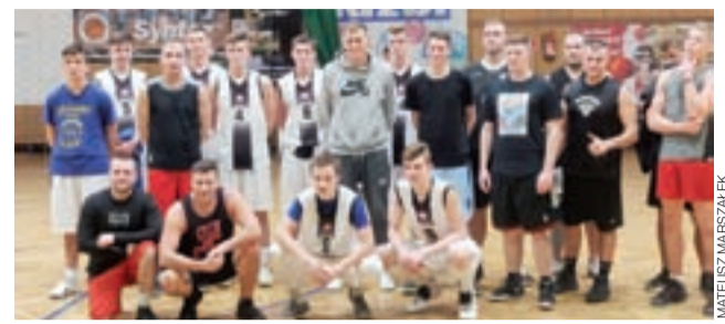
Fanklub Księżaka Syntex Łowicz po meczu z łowickimi juniorami.

Nasz Fanklub w tym sezonie pokazał kilka razy na co go stać. W Pruszkowie na pewno będzie