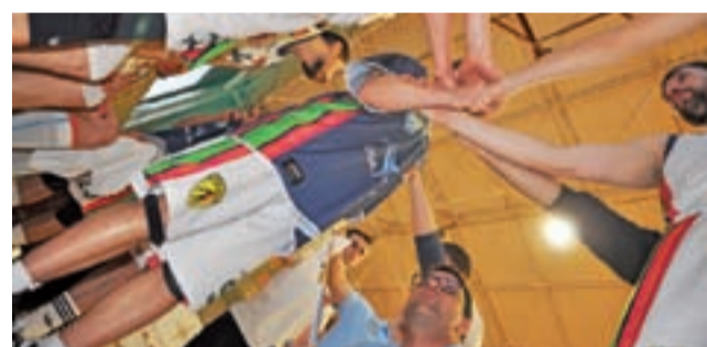
Na walkę o utrzymanie musi być pełna mobilizacja w zespole.

FutureNet Śląsk Wrocław okazał się najlepszym zespołem run-