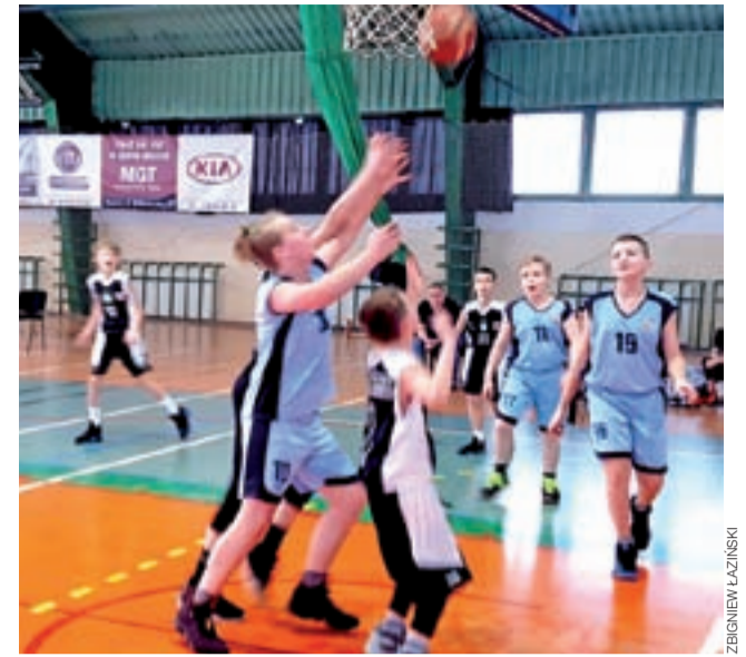
Młodzi koszykarze walczyli, ale przegrali dwa mecze.