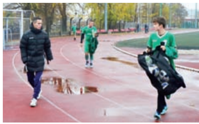
Pelikan 2004 nieudanie zainaugurował rozgrywki ligowe.

– Trzeba przyznać, że to będzie jedna z najmocniejszych drużyn w tej II lidze wojewódzkiej. Przewyższała nas pod względem siłowym, motorycznym, pod takimi aspektami, których nie możemy pokonać, bo mamy takie uwarunkowania biologiczne, jakie mamy i trzeba podjąć dwa razy takie zaangażowanie, żeby wygrać, a u nas zabrakło tego zaangażowania. Zabrakło dyscypliny taktycznej. Dostaliśmy wiadro zimnej wody na głowę. Niestety nic nie udało się zrealizować z tego, co funkcjonowało w dwóch ostatnich sparingach i funkcjonowało na dobrym poziomie. Chłopcy chyba nie wytrzymali presji tego, że to już jest mecz ligowy. Złe funkcjonowała obrona, źle funkcjonował środek pomocy. Wynik też nie do końca odzwierciedla to co działo się na boisku, bo przy stanie 0:3 zaryzykowałem, zostawiłem trzech obrońców i chciałem szukać ja-