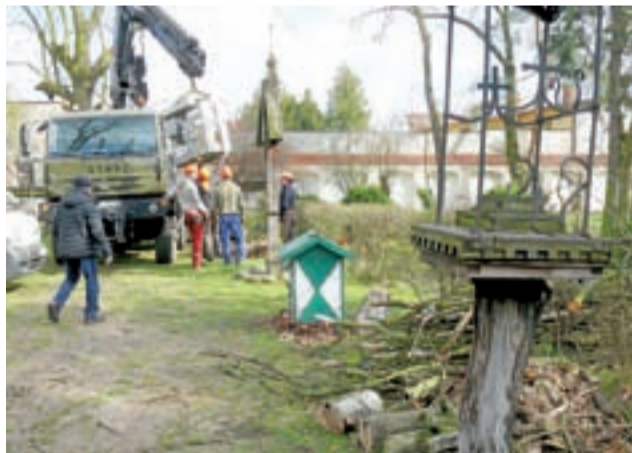
Pracownicy Makro-Flory usunęli z parku przy skansenie muzealnym 10 spróchniałych drzew.

Wykonane prace były kolejnymi przeprowadzonymi na drzewostanie w obrębie muzeum – nie tak dawno wycięto bowiem kilka