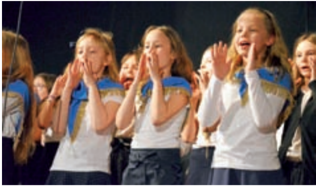
Dzieci ze scholi „Anielskie echo” z Krakowa Rakowic podczas otwartego występu w sobotę.