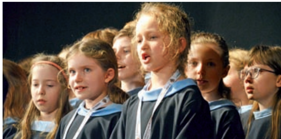
Dzieci z Schola Królowej Pokoju zaśpiewała „Golgotę” oraz „Rozpięty na ramionach”.

W przygotowania zaangażowani są też rodzice – część z nich pomagała organizacyjnie na miejscu, np. przygotowywali wraz z animatorami posiłki, inni upiekli ciasta itp. W tym roku animatorzy z Pijarskiego Liceum pracowali pod