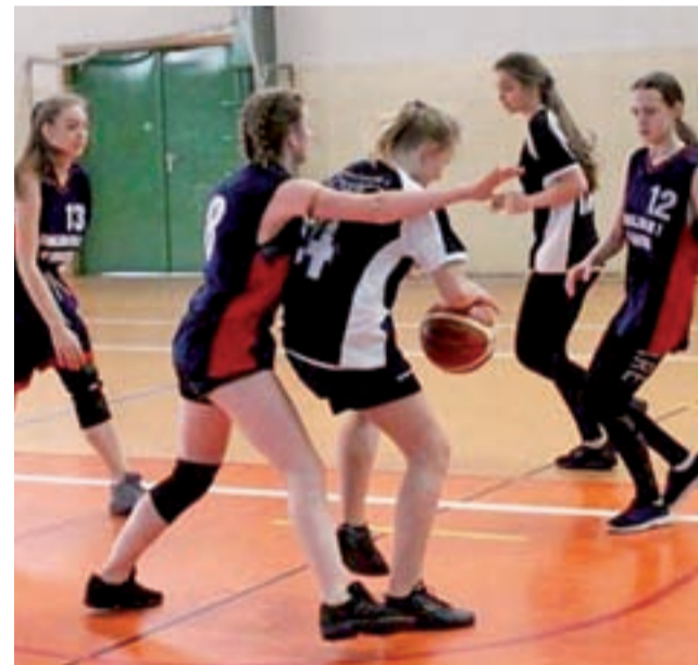
Dziewczyny walczyły o każdą piłkę, ale poziom był zróżnicowany.

■ Mecz o 3. miejsce: Pijarska SP w Łowiczu – SP 1 w Łowiczu 13:10 ■ Mecz o 1. miejsce: SP nr 2 w Łowiczu – SP 4 w Łowiczu 16:19