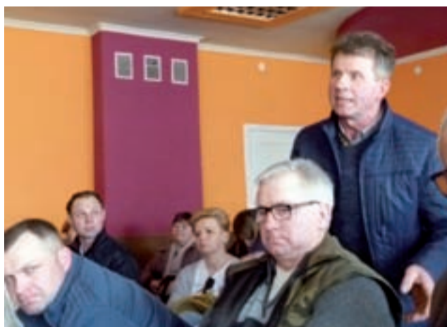
Jeden z mieszkańców gminy Bielawy przedstawia problemy, z jakimi boryka się w związku z przebudową DW 703.

dojazdowych do pól, montaż kraężników zamiast chodników, wykorzystywanie betonowych rowów stwarzających zagrożenie dla dzieci, budowa wąskich wysep przy wjazdach do poszczególnych miejscowości, a wreszcie nieuwzględnienie w projekcie przebudowy DW 703 ścieżek rowerowych. Spotkanie rozpoczęło się od prezentacji harmonogramu prac, jakie zrealizowane zostaną w najbliższym czasie. Podobnie jak rok temu, przedstawił go Kamil Kołtun, kierownik budowy, będący