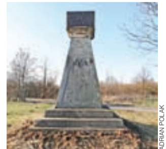
Słup w Patokach po ostatnich pracach porządkowych.