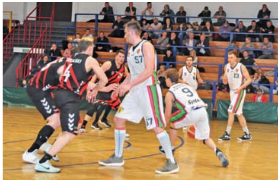
W ostatnim meczu więcej pograli zawodnicy rezerwowi.

– Najważniejszym dla mnie w tym meczu było, żeby dobrze rozdystrybuować minuty po podstawowi graczech, bo ten mecz nie miał już żadnego znaczenia w sensie wyniku. I to było głównym założeniem. Ale przyczyną naszej porażki była trzecia kwarta, w której mieliśmy masę strat, grając dobrą pierwszą połowę. Od połowy trzeciej kwarty zaczął się festiwal strat po naszej stronie. A mało tego, zamiast te straty odrobić mocną obroną, pogubiliśmy jeszcze obronę, co Słupsk wykorzystał i wyszedł na przewagę doświadczonego zawodnika. Powiększył ją jeszcze