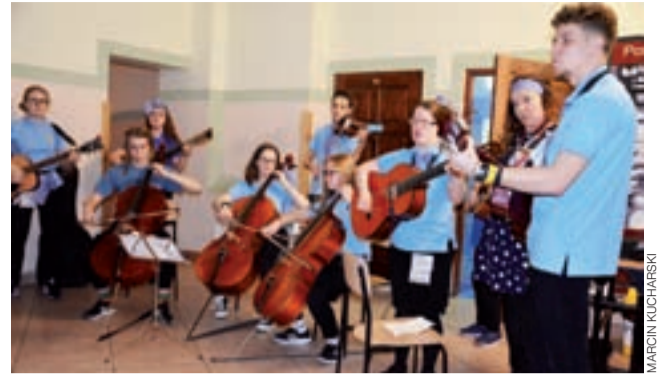
Sekcja muzyczna scholi z Bolesławca ćwiczyła przed występem na jednym ze szkolnych holi.

Łowicz | V Ogólnopolski Przegląd Scholi Pijarskich