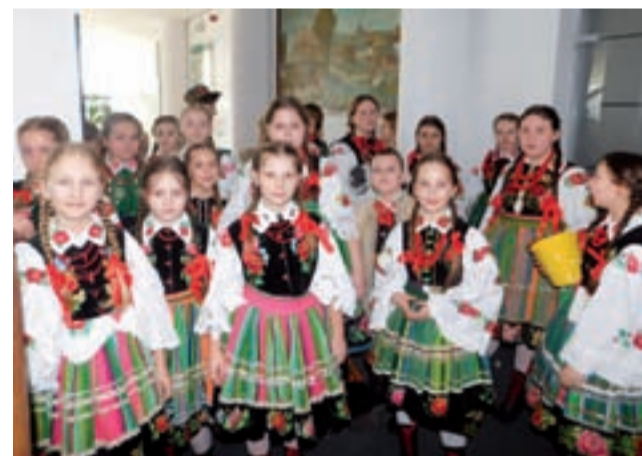
Dziecięcy Zespół Ludowy „Kocierzewiaczy” wytańczył i wyśpiewał II miejsce podczas VI Kasztelańskich Spotkań Folklorystycznych w Sierpcu.