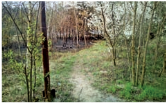
Nieduży pożar w tym rejonie był również kilka dni temu, stąd też podejrzenie podpalenia.