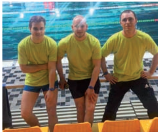
Reprezentanci OSP-RW Łowicz i zarazem przedstawiciele ścisłej czołówki ostatnich Mistrzostw w Nurkowaniu Sprawnościowym.