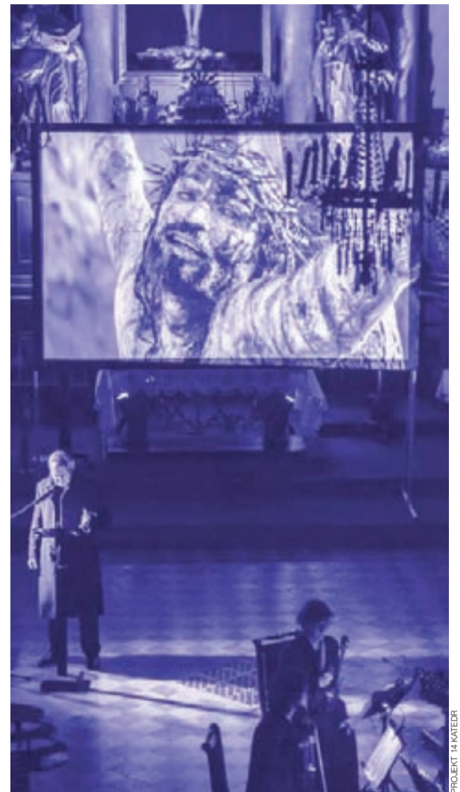
Koncert pasyjny z cyklu „14 katedr” w Sanktuarium Matki Bożej Bolesnej w Radomsku, 02.03.2018 r.

Wstęp na wydarzenie jest wolny, początek o godzinie 17.00. tm