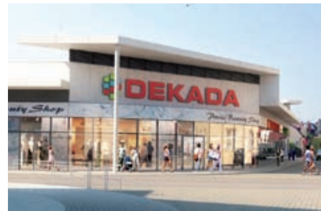
Tak miała wyglądać galeria Dekada w wersji jednokondygnacyjnej.

przyszłość. Ponowną chęć zainwestowania w tym miejscu spółka wyartykułowała w 2015 roku. Spółka jednak zweryfikowała swoje pomysły i zamiast budynku 3-kondygnacyjnego z poddaszem chciała postawić tam budynek 1-kondygnacyjny. Nie pozwalał jednak na to plan zagospodarowania. Radni miejscy dyskutowali nad zagospodarowaniem działki 30 stycznia 2015 r. Burmistrz Krzysztof Kaliński po rozmowach z Walczakiem przedstawił im wtedy dwie możliwości: budowę galerii handlowej po dokonanej zmianie w planie zagospodarowania przestrzennego lub urządzenie