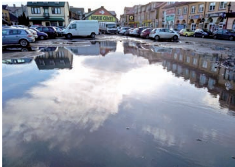
Tak wyglądał dziki parking u zbiegu ul. Podrzecznej i Koziej w Łowiczu w co bardziej deszczowe dni.