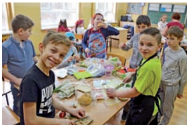
Podczas zajęć kulinarnych humory wszystkim dopisywały.

Parafia przygotowuje się już do kolejnego, ważnego dla niej wydarzenia – w dniach 12-16 czerwca będzie miała w niej miejsce renowacja misji po peregrynacji obrazu NMP Jasnogórskiej. W Kościele pojęcie „renowacja misji” to powrót misjonarza na teren swojego działania, aby zobaczyć po latach efekty pracy. W tym przypadku chodzi o misję poprzedzającą peregrynację obrazu w 2017 roku. tm