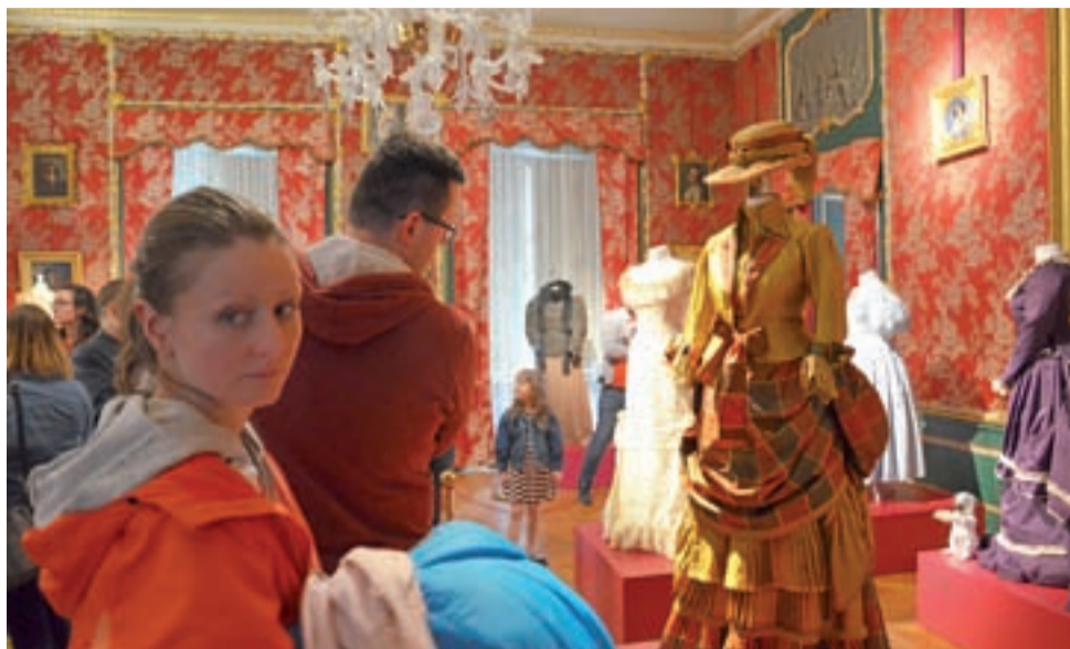
Wiele osób zdecydowało się w niedzielę odwiedzić Park i Muzeum w Nieborowie. Popularnością nadal cieszy się wystawa pn. „Moda nieborowskich dam”.