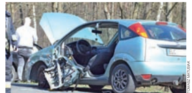
W wypadku uszkodzona została kobieta jadąca Fordem.

Czy można wyprzedzić rower na skrzyżowaniu? Zgodnie z art. 24 kodeksu drogowego zabrania się wyprzedzania pojazdu silnikowego na skrzyżowaniu, z wyjątkiem skrzyżowania o ruchu okrężnym lub na którym ruch jest kierowany. Rower nie należy do pojazdów silnikowych, więc prawo nie zabrania wyprzedzania rowerzysty na jakimkolwiek skrzyżowaniu. Często jednak zdarza się, że rowerzyści nie sygnalizują zamiaru skrętu w lewo, bądź robią to zbyt późno i tym samym wjeżdżają wprost pod koła wyprzedzającego ich samochodu. Jak było tym razem, ustalić mają policjanci z dochodzeniówki. Uczestnicy zdarzenia byli trzeźwi. mak