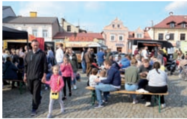
Szczególnie dużo osób przyszło na Złot Foodtrucków w niedzielę, kiedy pogoda była najładniejsza podczas całego weekendu.