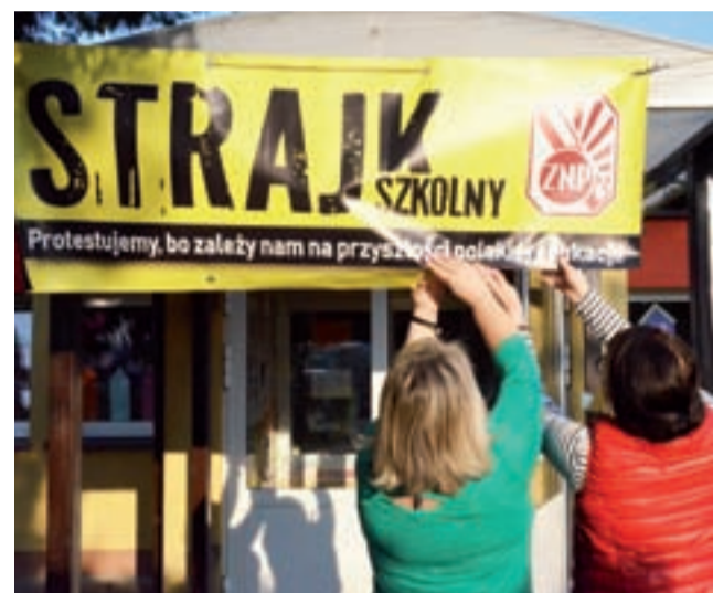
Poniedziałkowy poranek rozpoczął się w Przedszkolu nr 4 w Łowiczu od wywieszenia plakatu o przystąpieniu do strajku.