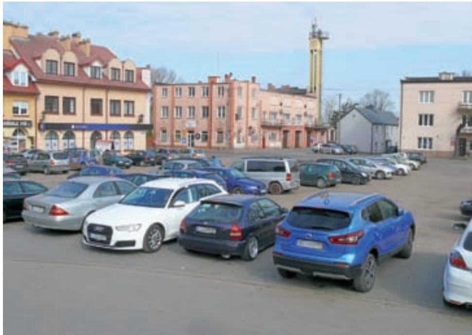
Plac w narożniku ulic Koziej i Podrzecznej (widziany od strony ul. Sybiraków), już niedługo zmieni swoje oblicze, ubita i błotnista po deszczu ziemia zostanie zastąpiona drobnym kamieniem.