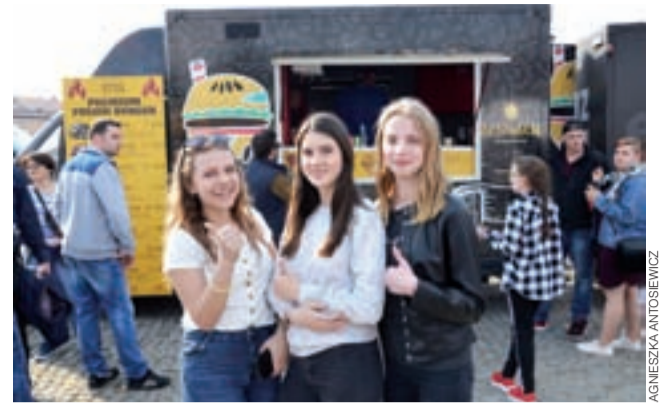
Dziewczynom ze zdjęcia, Złot Foodtrucków podobał się tak bardzo, że były na nim codziennie, by poprobować różnych specjałów.