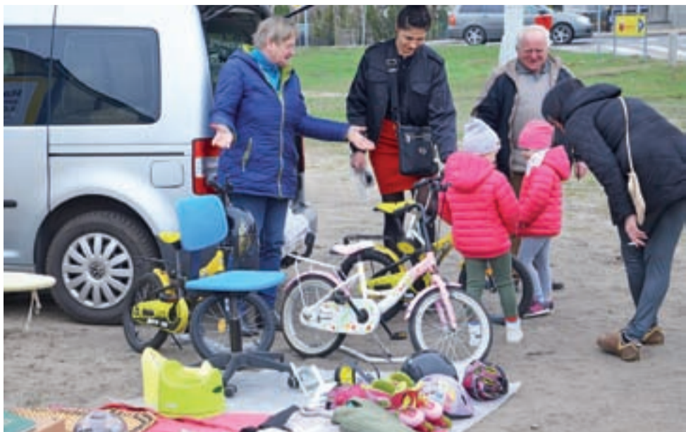
Pierwsza w tym roku wyprzedaż garażowa na osiedlu Górki odbyła się w ostatnią sobotę marca, kolejna zaplanowana jest w najbliższą sobotę, 13 kwietnia.