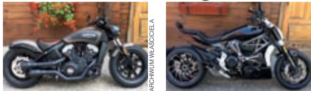
Oto dwa najbardziej charakterystyczne spośród skradzionych motocykli. Policja nadal nie wpadła na ślad włamywaczy.

Właściciel, mieszkaniec Łowicza, zauważył kradzież następnego dnia, kiedy poszedł do garażu, by zabrać jedną z maszyn, by dokonać przeglądu przed sezonem motocyklowym. Kradzież została zgłoszona na policję. Ponadto właściciel motocykli oraz środo-