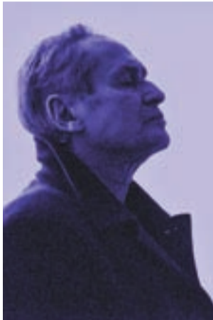
Jerzy Zelnik. Kościół św. Alberta Chmielowskiego w Zielonej Górze, 23.03.2018 r.

fragmentów „Pasji” Mela Gibsona. Spektakl ma więc oddziaływać na różne zmysły. Liczba 14 w tytule nawiązuje do liczby stacji drogi krzyżowej. Wydarzenie organizowane jest przez Fundację „Zatrzymać czas”, we współpracy z partnerami i z dofinansowaniem Ministerstwa KiDN. Ten sam program, ale w innych miejscach, był już prezentowany podczas Wielkiego Postu w 2017 i w 2018 roku.