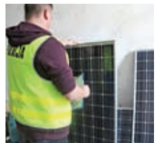
Dwa spośród 4 paneli fotowoltaicznych o wartości ponad 1 tys. złotych były już zamontowane na dachu domu jednego z 19-latków.

Do zdarzenia doszło w nocy z wtorku na środę, z 2/3 kwietnia. Policjanci ruchu drogowego patrolujący ten rejon zobaczyli zaparkowanego Fiata Pandę, który posiadał ślady włamania. Zainteresowali się samochodem sprawiającym wrażenie porzu-