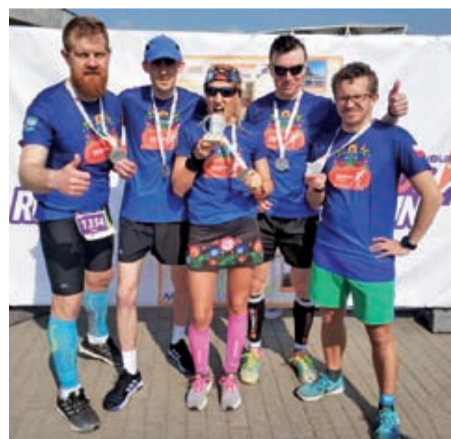
Seba Team Łowicz to mocna ekipa.