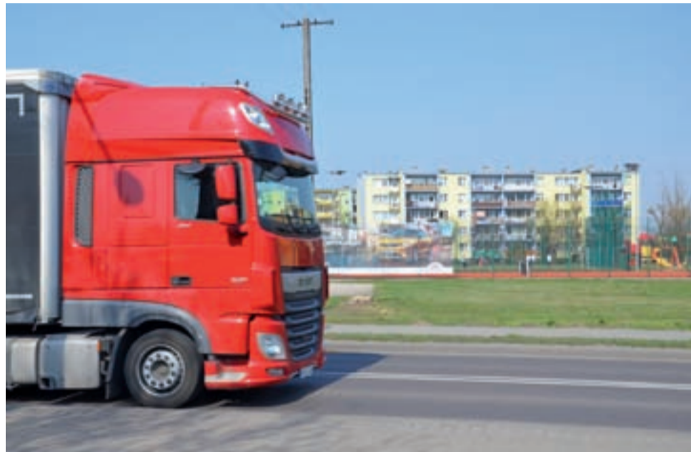
Mieszkańcy osiedla Zatorze w Łowiczu chcą badań jakości powietrza i natężenia hałasu.