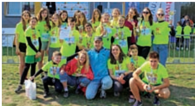
Mocna i kolorowa ekipa Pijarskiej po biegu w Poznaniu.