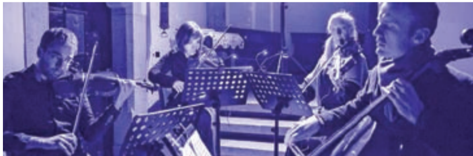
Baltic Neopolis Ensemble. Bazylika Kolegiacka św. Małgorzaty w Nowym Sączu, 24.02.2018 r.