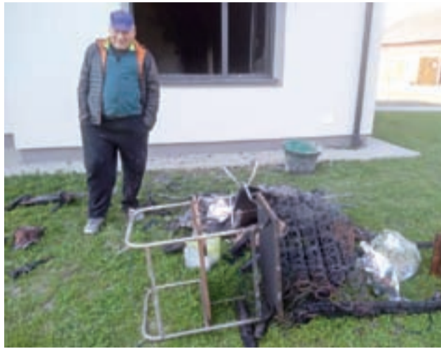
Pożar został szybko opanowany. Spaleniu uległy m.in. stare meble, telewizor, fotel itp.

Na miejsce zadysponowana została jednostka OSP Bednary oraz dwa zastępy JRG straży zawodowej z Łowicza. Pożar został szybko opanowany – zanim jeszcze zdążył się wyostać poza pomieszczenie na parterze. Spaleniu uległy m.in. stare meble, telewizor, fotel itp. – wszystko, co było zgromadzone w tym pokoju.