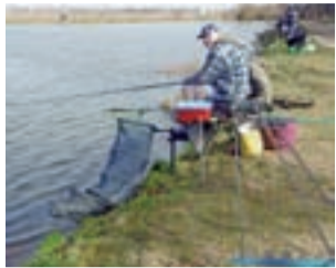
Zawody rozegrano w jednej czterogodzinnej turze, bez podziału na kategorie wiekowe.