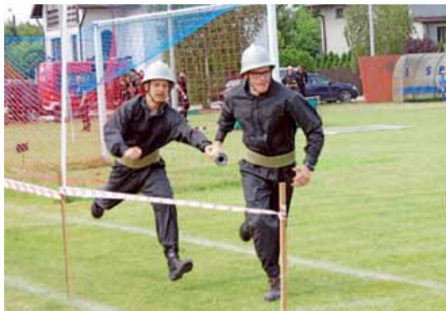
Tradycyjnie zawody sportowo-pożarnicze w Bolimowie rozpoczęły się sztafetą.

rozdzielaczu, a przez jej brak łatwiej było połączyć węże i nie tracić cennego czasu. Gdy Łasieczniki złożyły protest tej sprawie, sędziowie go uznali. Pozwoli jednak drużynie z Bolimowa na założenie uszczelki i ponowne wykonanie sztafety. Wystartowali, uzyskując nieco gorszy wynik niż za pierwszym razem. Dodatkowo sędziowie dali im 10 pkt. karnych za przekroczenie linii mety z węzownicą. Po zadaniu bojowym w wykonaniu drużyny OSP Łasieczniki to strażacy z Bolimowa zgłosili protest w sprawie pod-