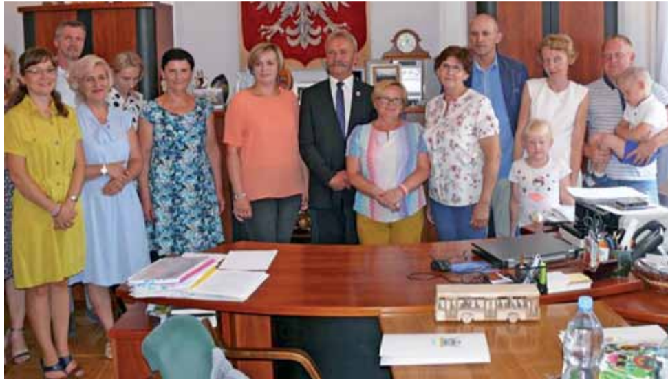
Laureaci i uczestnicy konkursu Zielone Miasto, tuż po wręczeniu nagród przez burmistrza Łowicza.

Laureaci konkursu otrzymali nagrody pieniężne w wysokości odpowiednio 600, 400 i 250 zł w pierwszej i drugiej kategorii oraz 350, 250 i 150 zł w trzeciej kategorii. Pieniądże te mogą wy-