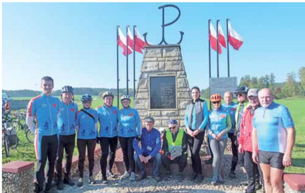
Uczestnicy patriotycznego rajdu, który odbył się w październiku 2018 roku, m.in. kolarze z Łodzi, pod pomnikiem cichociemnych w Czatolinie.

Czatolin | „Gniazdo” wesprze ciekawą inicjatywę