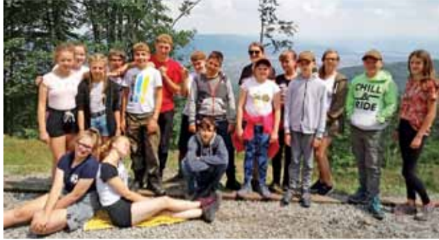
Odpoczynek podczas górskich wędrówek.