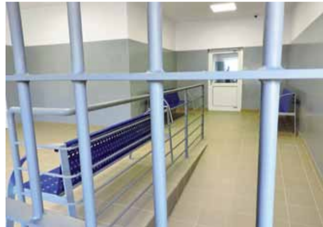
Nowa poczekalnia dla oczekujących na odwiedzinie w Zakładzie Karnym w Łowiczu.

warsztatu naprawczego, generalny remont przechodził jeden z oddziałów mieszkalnych, a budynek administracji w ubiegłym roku przechodził termomodernizację, przebudowano też ogrodzenia zewnętrzne więzienia, wraz z wymianą bramy awaryjnej otwieranej przez mechanizm automatyczny. Obecnie na terenie zakładu powstaje też hala produkcyjna, w której zatrudnienie znajdują więźniowie, trwa też remont centrum penitencjarnego. oprac. tm