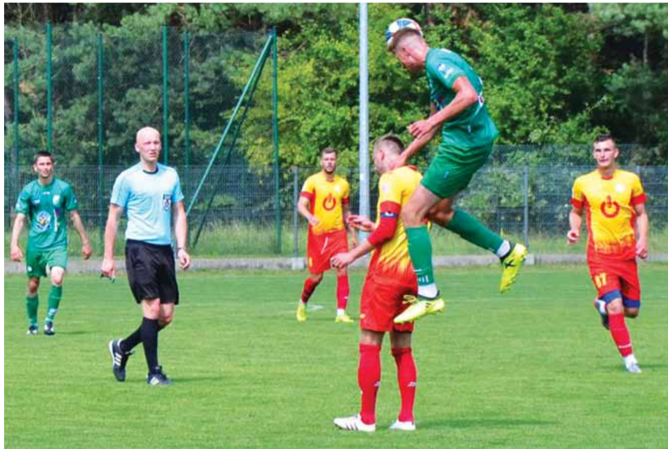
Do przerwy biało-zieloni stracili trzy bramki, choć rozpoczęli bardzo dobrze.

Po tej bramce Znicz przejął inicjatywę i ruszył do ataku. Pruszkowianie dwa razy strzelali jednak wprost w Humerskiego – bram-