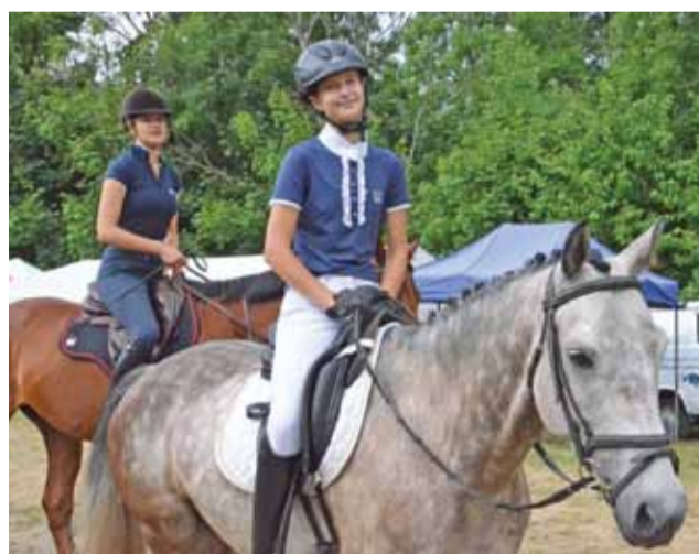
Przed startem w Krajowych Zawodach we Wszechstronnym Konkursie Konia Wierzchowego.

Do rywalizacji zakwalifikowanych zostało około 80 zawodników z całej Polski, którzy startowali w poszczególnych konkuren-