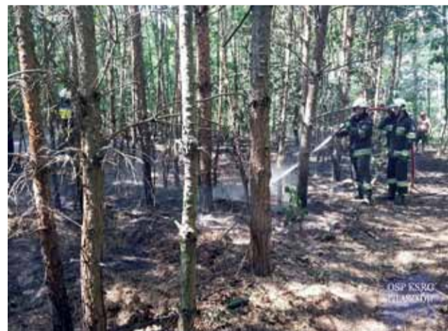
W akcji gaszenia pożaru ściółki leśnej w Guźni udział brali strażacy z Bochenia i Pilaszkowa.

Taka była też przyczyna pożaru, który wybuchł tego sa-