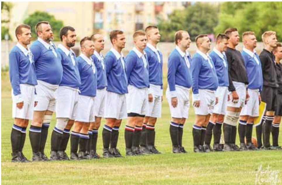
Łowicka drużyna KS 10. PP tuż przed meczem w Kutnie.

– Cieszymy się ze zwycięstwa, ale martwi nasz fakt, że w Łowi-