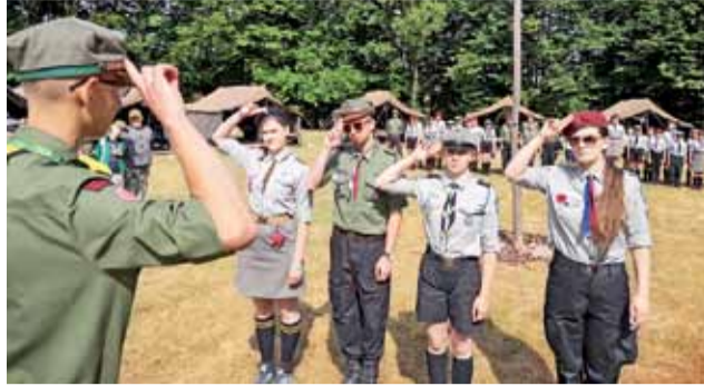
Musztra harcerska w obozie w Wapienicy.

Harcerstwo | Obóz łowickiego hufca w Wapienicy