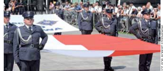
Kompania reprezentacyjna – a w niej sześciu funkcjonariuszy niosących flagę.

■ Krzysztof Wiśniewski (nowy radny) na koniec 2018 r. zadeklarował zgromadzone 5 tys. zł oszczędności. Posiada w dzierżawie 30-hektarowe gospodarstwo, wart 1,2 mln zł, z którego w 2018 r. uzyskał 150 tys. zł przychodu, a jego dochód wyniósł 50 tys. zł. Z tytułu diety radnego pobrał 700 zł. Na koniec minionego roku nie posiadał mienia ruchomego ani zobowiązań o wartości powyżej 10 tys. zł. ■