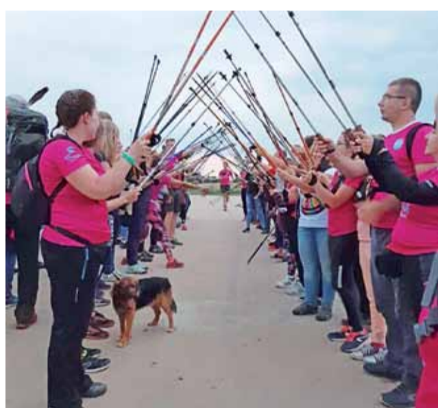
„Szuranie w pełni” było piątą tego typu inicjatywą grupy Frost Team. Wzięły w niej udział 84 osoby.

Każdy uczestnik może zabrać ze sobą swój sprzęt do robienia baniek, a jeśli takiego nie posiada, będzie miał możliwość zakupu sprzętu na miejscu. aa