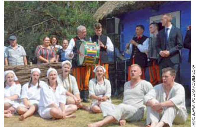
Regionalny Zespół Pieśni i Tańca Boczki Chełmońskie w czasie występu w zagrodzie w skansenie śpiewała ludowe pieśni.