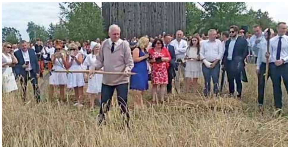
Wicepremier Jarosław Gowin na Łowickich Żniwach, na polu, z kosą w ręku.

Chyba jeszcze nigdy na imprezie na naszym terenie nie było tak licznego udziału polityków jak na Łowickich Żniwach, które pod zmienioną nazwą – „Folklor ludowy szyty na miarę” – zostały zorganizowane 21 lipca w skansenie w Maurzycach. Na zaproszenie władz powiatu łowickiego na żniwa przyjechali m.in. wicepremier i minister szkolnictwa wyższego Jarosław Gowin.