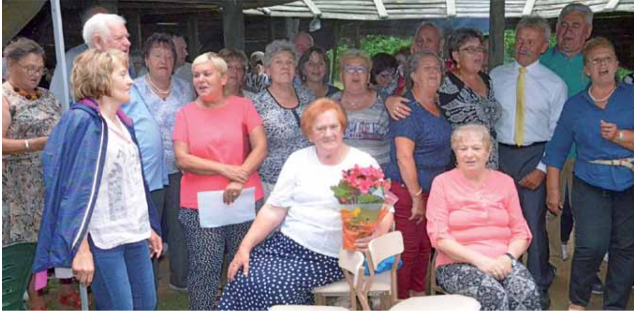
Piknik integracyjny na polanie w lasu miejskim, w którym uczestniczyło ponad sto osób, trwał od godz. 15 do 21.

Zmarł 19 grudnia 2018 r., w wieku 69 lat. Spoczywa w grobie rodzinnym na cmentarzu Emaus. aa