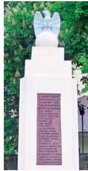
Orzeł na domaniewickim pomniku wciąż pozostaje pozbawiony korony. Niebawem ma się to zmienić.