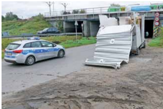
Jesień 2018 roku – po prawej jeden z ostatnich, przed trwającym obecnie remontem, samochodów dostawczych, który nie zmieścił się pod wiaduktem nad ul. Arkadyjską.

200 tys. zł nie trafi do PKP PLK czyli inwestora trwającej przebudowy wiaduktu nad ul. Arkadyjską.