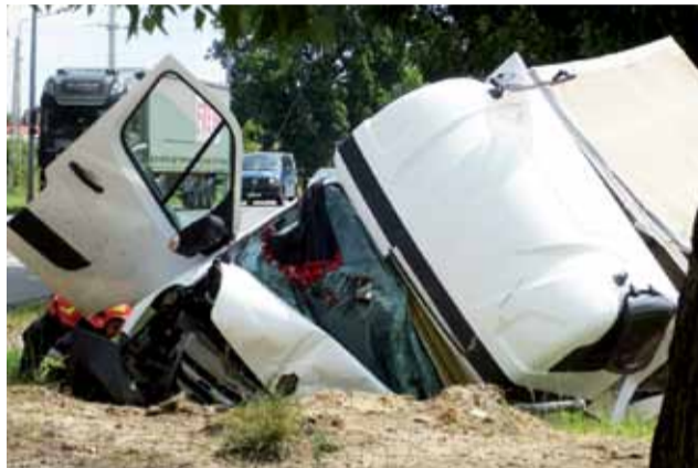
Final wypadku był tragiczny, ponieważ samochód przewrócił się akurat tak, że zmiążdżone zostało miejsce kierowcy.

maczenie zjechania na przeciwny pas ruchu, a następnie z drogi – pogoda, a zatem i widoczność, była dobra, nawierzchnia drogi krajowej także, a samochód – przynajmniej zdaniem naocznego świadka – jechał z normalną, dopuszczalną prędkością. W wypadku nie uczestniczył żaden inny pojazd ani uczestnik ru-