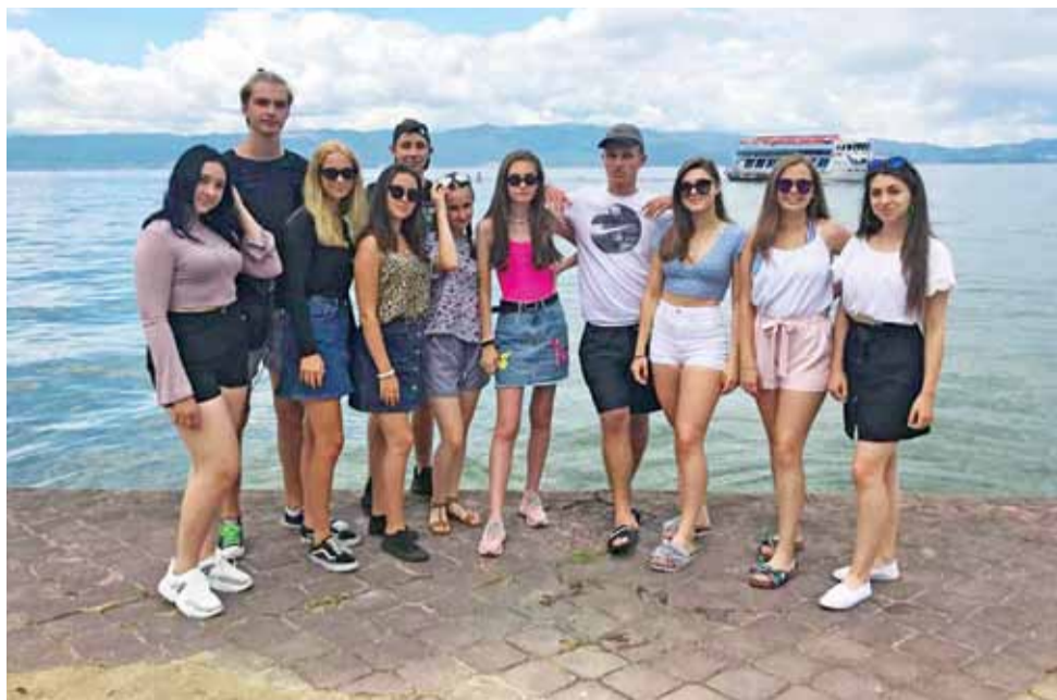
Członkowie Dziecięco-Młodzieżowego Zespołu Ludowego „Koderki” wypoczywali w malowniczej Macedonii.