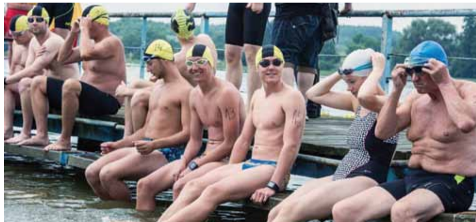
25 osób popłynęło w Maratonie im. Pawła Pioruna w Rawie Mazowieckiej.