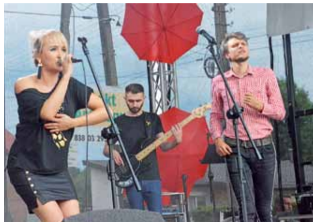
Na scenie wystąpił m.in. Stars Roxette Tribute Band, wykonujący covery nie tylko zespołu Roxette.

Była to 21. edycja imprezy, która wcześniej odbywała się pod nazwą Dni Bolimowa, a jej program faktycznie rozłożony był na dwa dni. W ramach Dni Bolimowa w latach 2011-2014 i 2016 na rynku odbywał się cieszący się dużą popularnością Festiwal Rzemiosła Dawnego. Zrezygnowano z niego ze względu na koszty. Z tego też powodu przez minione dwa lata imprezy w ogóle nie było. Stała ona też pod znakiem zapytania w tym roku. Ostatecznie jednak zdecydowano się, aby się odbyła.