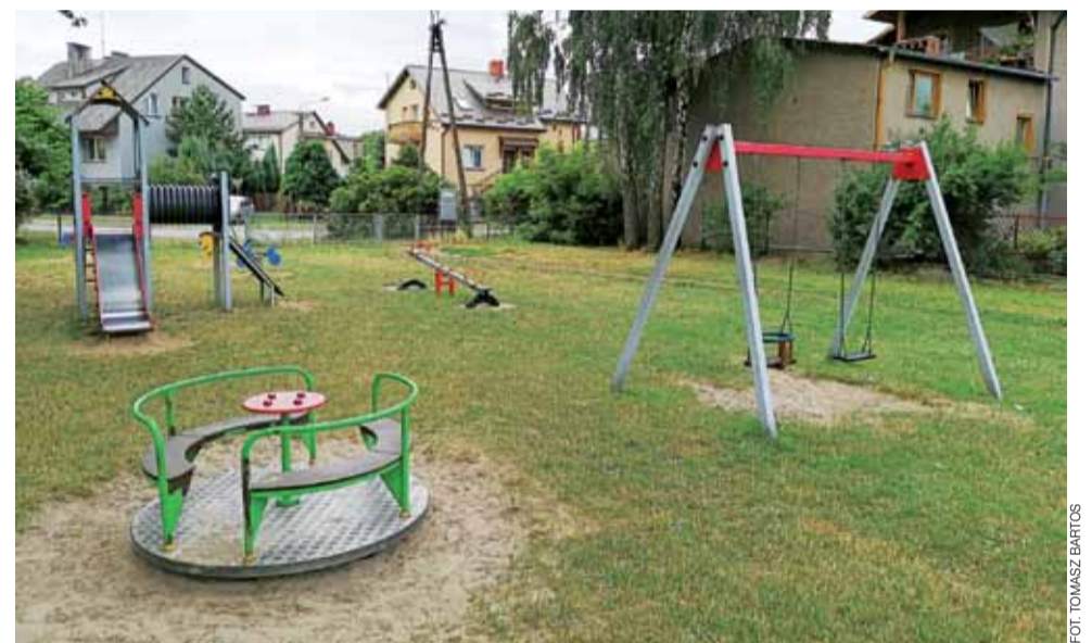
Plac zabaw na osiedlu Przedmieście przy ul. Włókienniczej.