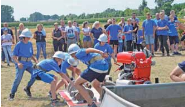
Drużyna OSP Róźce, podobnie jak inne MDP, startowała w jednolitych strojach. Tutaj uchwyciliśmy młodych druhów w zadaniu bojowym.