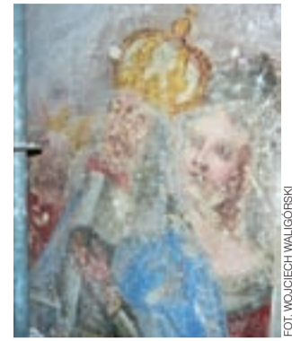
To prawie na pewno oni:

W ciszy pijarskiego kościoła, w przeciwniejszej, wschodniej nawie, na podobnym rusztowaniu jak Waleria, także za zasłoną z folii, także przy świetle ledowych