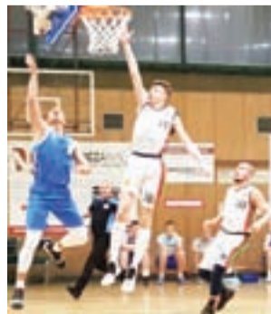
Juniorzy starsi Książaka zaczęli sezon od porażki.