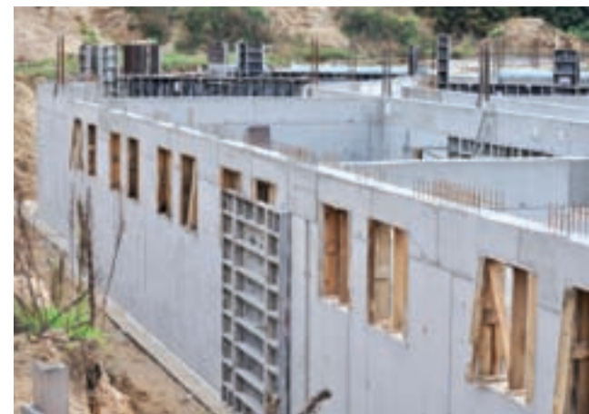
Dom Mocarzy ma już wymurowane piwnice, a siostry zbierają pieniądze na kolejne kondygnacje.

W Domu Mocarzy przebywać będą osoby od 26 roku życia. Prawo jest bowiem tak skonstruowane, że w takich placówkach jak mocarzewska (szkoła specjalna i ośrodek wychowawczy), podopieczni mogą przebywać najpóźniej do 25. roku życia. Osoby, którymi opiekują się siostry, nie dość, że są często w poważnym stopniu upośledzone, pochodzą z różnych środowisk. Bywa, że nie są jedynymi niepełnosprawnymi w rodzinie, bywa, że rodzice są już w takim wieku, że nie są w stanie opiekować się niepełnosprawnym synem czy córką. – Niektórzy z nich nie mają gdzie wrócić. Czasami nie czeka na nich w domu rodzinnym nawet łóżko – opowiadała siostry. Często nie wynika to ze