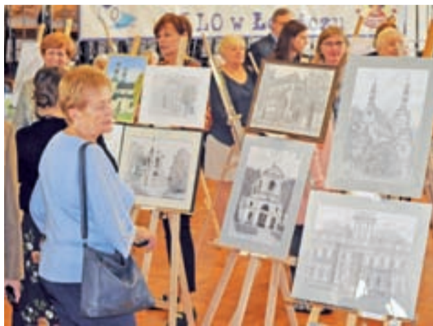
Każdy z rysunków, które powstały na wrześniowym plenerze, został wyceniony na co najmniej 25 złotych.