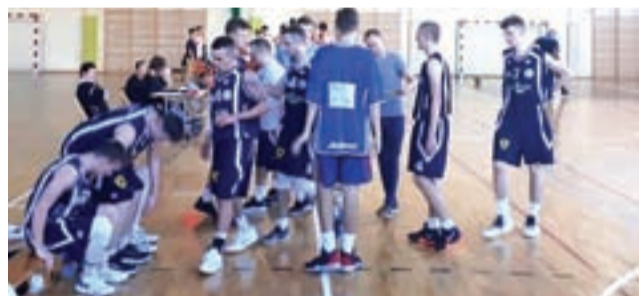
W Skierniewicach Książacy udanie zainaugurowali III ligę.

W ubiegłym sezonie Bródka startował wykorzystując na zawody i zgrupowania urlop a także zamieniając się służbami z kolegami z PSP w Łowiczu. Startując w Tomaszowie Mazowieckim w pierwszym od lat Pucharze Świata rozgrywanym w Polsce panczenista z Domaniewic zszedł prosto ze służby by za kilka godzin rywalizować z najlepszymi zawodnikami na świecie. Przygotowując się w takich warunkach trudno odnosić spektakularne sukcesy. Miedzy innymi z tego względu najbliższy sezon będzie wolny od startów. Nie będzie za to wolny od treningów. Bródka będzie nadal trenował na tyle aby być w dobrej dyspozycji, aby w przyszłości łatwiej mu było powrócić do formy startowej. Na nudę na pewno nie będzie narzekał gdyż często jest zapraszany do udziału w imprezach promujących sport. Będzie mógł wreszcie więcej czasu spędzać z rodziną i najbliższymi. Tafel