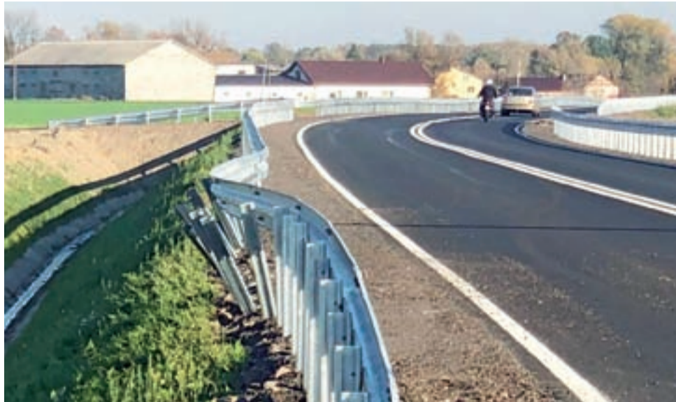
Zniszczone bariery energochłonne po uderzeniu samochodu, którym jechał nietrzeźwy mężczyzna.

Jeden z mieszkańców gminy Bielawy skontaktował się z nami w sprawie kolizji. W przesłanym e-mailu zwrócił uwagę,