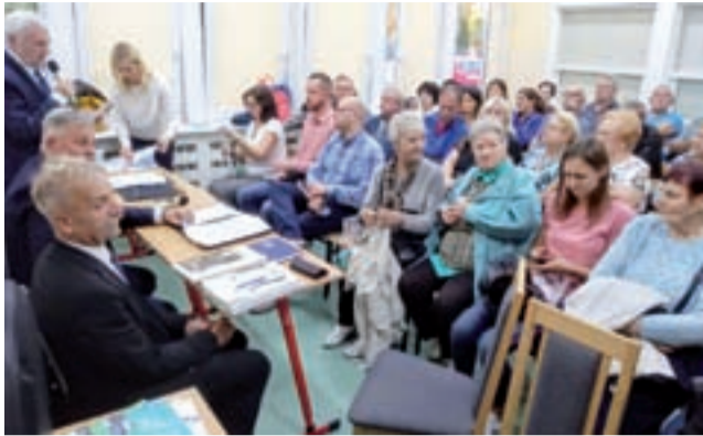
W spotkaniu na Bratkowicach uczestniczyło około 70 mieszkańców dzielnicy.