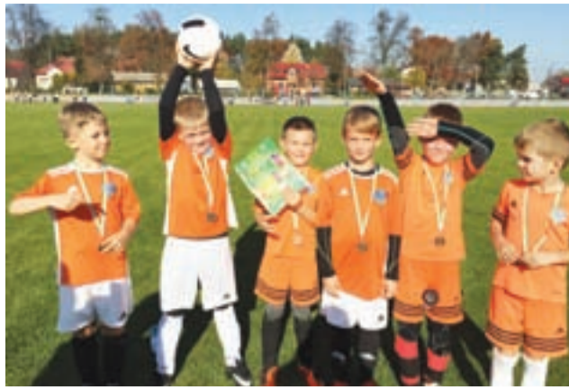
Soccer Kids pewnie wygrał turniej Pucharu Tymbarku.

Byliśmy zdecydowanym faworytem turnieju i pewnie pokonaliśmy rywali. Byliśmy jedynym klubem piłkarskim, więc rywalizacja ze szkołami nie była dla przeciwników łatwa. Prawdziwa weryfikacja naszego udziału w turnieju „Z podwórka na stadion o Puchar Tymbarku” nastąpi dopiero podczas zmagani w Łodzi – opowiedział trener Filip Ziółkowski.