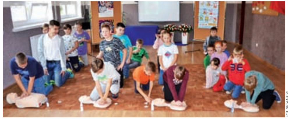
Akcja Fundacji WOŚP to nie tylko zabawa, ale przede wszystkim nauka umiejętności, które powinni mieć każdy.

W których przychodniach seniorzy 65+ mogą się bezpłatnie zaszczepić? Są to: NZOZ Przychodnia Lekarska „Medyk”, ul. Ułańska 2, NZOZ „Kaliska” sp. z o.o., Stary Rynek 16, NZOZ „Przychodnia Lekarska”, ul. Świętojańska 1/3B, NZOZ „Lekarz” ul. Podrzeczna 7A, Centrum Pediatryczne ul. Świętojańska 1/3B, NZOZ „WIGOR” ul. Batalionów Chłopskich, MediCenter ul. 3 Maja 15 oraz NZOZ „Academios” ul. Iłowska 1/3. mak