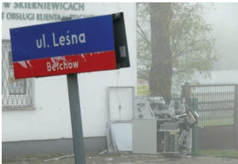
Zniszczony przez wybuch bankomat w Bełchowie.

Na miejscu potwierdziliśmy, że rabusiom nie wszystko się udało. Wysadzili co prawda bankomat, ale tylko jego górną część, gdzie znajduje się panel sterowania, wraz z płytą i urządzeniami odpowiedzialnymi za przyjmowanie kart i wypłatę pieniędzy. Znajdująca się poniżej szafa z kasetami, w którym znajdowały się pieniądze nie została otwarta, dlatego rabusiom nie udało się ich zabrać. Z naszej wiedzy wynika, że