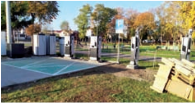
Stacja ładowania pojazdów elektrycznych przy stacji „Bliska” w Łyszkowicach. Zdjęcie jeszcze przed jej rozbudową.

cja ładowania na terenie naszego powiatu działa przy stacji Bliska w Łyszkowicach. Właśnie trwa jej rozbudowa – lada dzień będzie miała już 4 stanowiska ładowania w ultraszybkiej technologii (obsługa złącza typu: CHAdeMO, CCS oraz Type 2). Od pracowników stacji dowiedzieliśmy się, że zapotrzebowanie na ładowanie pojazdów jest duże, poza tym stale rośnie. Większość korzystających zajeżdża tam będąc przejazdem, najczęściej są to auta zjeżdżające z autostrady A2, bo na odcinku Stryków – Konotopa takich punktów na MOP-ach nie ma (pier-