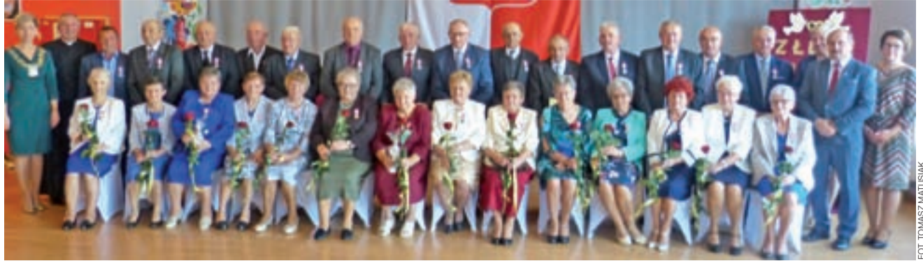
Odnaczone pary oraz organizatorzy imprezy pozują do wspólnego zdjęcia.