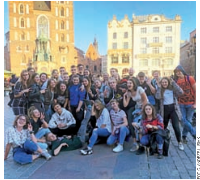
Łowicka grupa młodzieży pijarskiej na Rynku Głównym w Krakowie.

Mistrzostwa były nie tylko świetną okazją do zaprezentowania się z yoyo na scenie, ale również do nawiązania nowych znajomości zarówno z amatorami, jak i profesjonalistami. Uczestniczyła w nich kilkuosobowa grupa miłośników tego sportu z Czech. Wystartowali w kategorii open dla osób spoza Polski. Łowicz spodobał się im, chwalili organizację zawodów oraz chętnie wymieniali się kontaktami z machającymi yoyo rówieśnikami. mak