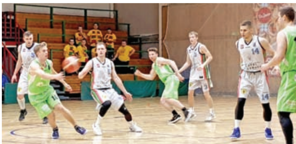
Kluczem do zwycięstwa była dobra obrona we fragmentach meczu.

– Nie było łatwo. Uważam, że ten mecz był bardzo dobry. Obie