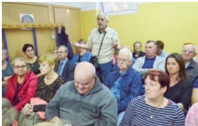
Podczas zebrania na osiedlu Zatorze wielu mieszkańców zabierało głos.