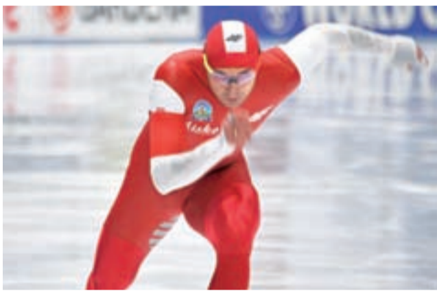
Zbigniew Bródka w Tomaszowie Mazowieckim w 2018 roku, podczas biegu na 1000 metrów. W tym roku go tam nie zobaczymy.

W Tomaszowie Mazowieckim nie zobaczymy także na torze Zbigniewa Bródki, który postawił sobie przerwę od startów. Nie oznacza to zakończenia kariery sportowej a jedynie roczną pauzę, po której Domaniewiczanki podejmą decyzję co będzie robił dalej.