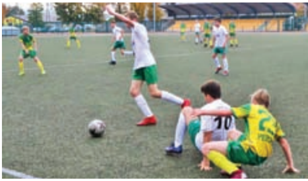
W meczu ze Sport-Perfect nie brakowało walki.