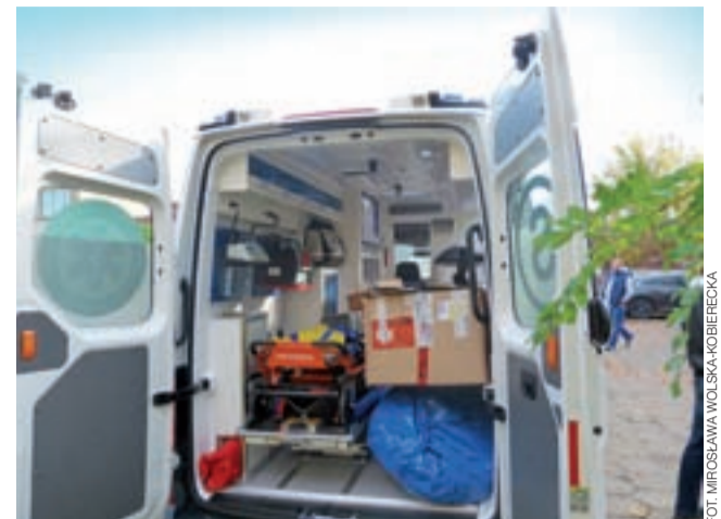
Nowa karetka została zakupiona wraz z pełnym wyposażeniem, które do Łowicza przyjechało jeszcze nie rozpakowane.