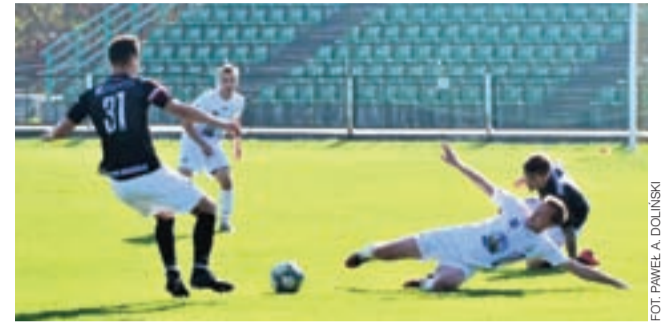
Biało-zieloni byli zdeterminowani i skoncentrowani.