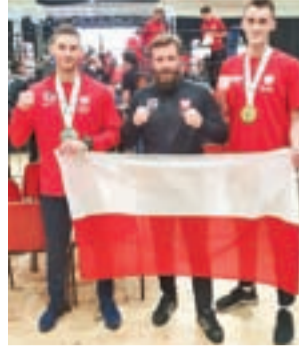
Reprezentanci Ziemi Łowickiej wrócili z medalami z Irlandii.

Turniej odbywał się w dniach 15-19 października w Cork w Irlandii i był adresowany do amatorów różnych stylów walki: K1, Muay Thai, Low Kick, Full Contact, light Ccontact i Kick Light. zł