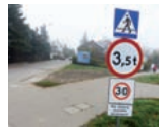
Z tej perspektywy ciąg pieszo-rowerowy rzeczywiście można pomylić z ulicą. Ale czy to jest powód tego, że wjeżdżają tam zbyt ciężkie samochody?

Nie wyeliminuje to ruchu całkiem – bo część kierowców zapewne przyzwyczaiła się do tej