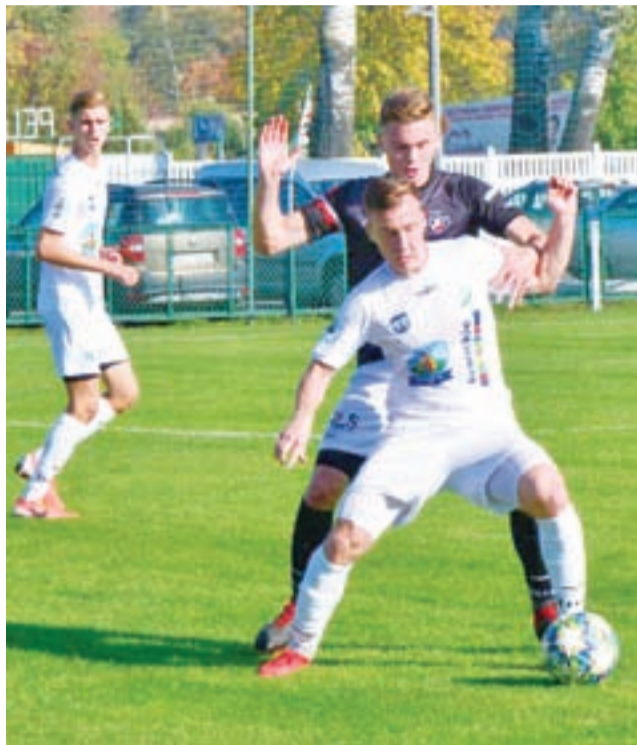
Pelikan ograł Polonię i zgrał trzy punkty.