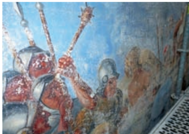
Ten fresk ujrzymy w nawie wschodniej: fragment sceny z drogi Jezusa na Golgotę.

Prace prowadzone są przez firmę AC Konserwacja Zabytków z Krakowa. Konserwacja malowideł w nawie zachodniej dofinansowana jest przez Ministerstwo Kultury i Dziedzictwa Narodowego, w nawie wschodniej w całości finansowana ze środków własnych zakonu pijarów, w wielkiej mierze pochodzących z ofiar składanych przez wiernych i darowizn od przyjaciół zakonu. ■