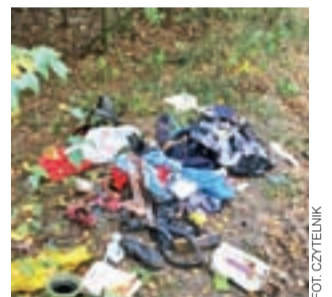
Śmieci znalezione w lesie w Strzelcewie.