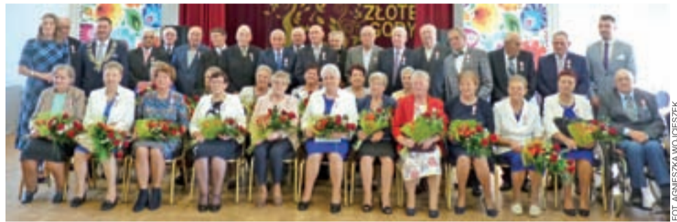
Tyle par małżeńskich od dawna nie świętowało Złotych Godów w Domaniewicach.