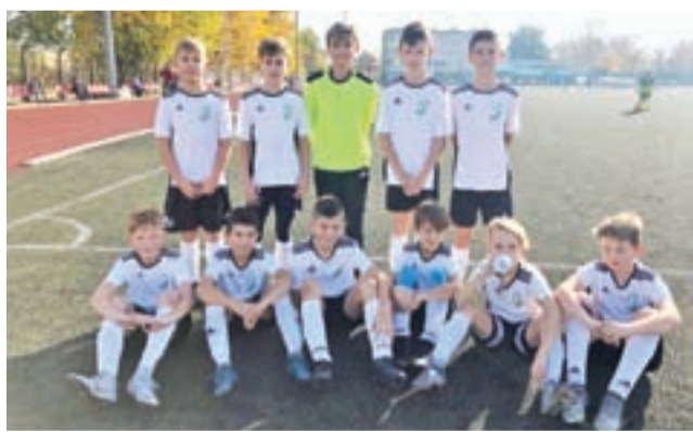
Drużyna Pelikana 2008 I po meczu z Orleńskimi.