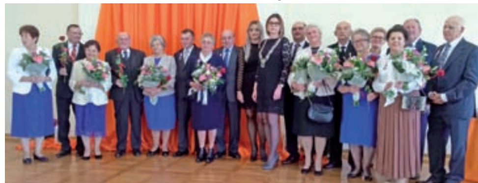
Złote Gody małżeństw z gminy Kiernozia odbyły się w sali Ochotniczej Straży Pożarnej w Kiernozie.