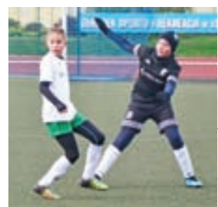
Pelikan-2007 przegrał u siebie z zespołem zajmującym obecnie ostatnie miejsce w tabeli aż 0:7