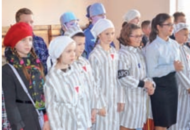
Po spektaklu „Z lat wojny i okupacji”, młodzi aktorzy zebrali duże brawa od publiczności.

– Ja grałem ojca chłopaka, który dostał powołanie do wojska. Tutaj była taka sytuacja, że w domu był jeszcze młodszy syn, bo gdyby był tylko jeden, to ojciec mógłby