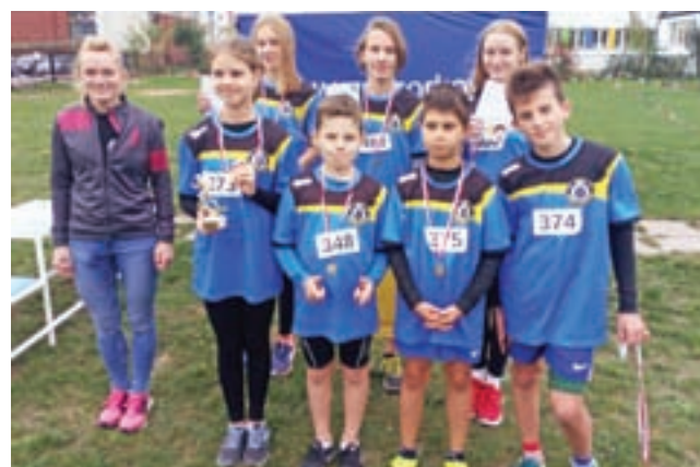
Młodzi biegacze z medalami w Ozorkowie.