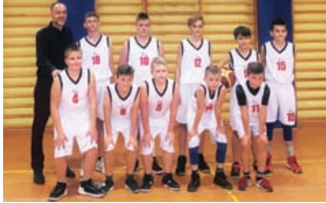
Ekipa młodzików KKS Bzury zaczęła sezon od wygranej.

Spotkanie rozgrywane było w Głownie. Zespół Bzury spokojnie rozpoczął mecz, rozpoznając przeciwnika i po pierwszej, minimalnie przegranej kwarcie meczu, rozpoczął odrabianie strat, dzięki czemu na przerwę zawodnicy schodzili z trzema punktami przewagi, wygrywając 38:25. Cały mecz miał zresztą wyrównany przebieg, ale to drużyna Bzury wykazała się w ostatniej kwarcie meczu lepszym opanowaniem i skutecznością rzutów, co przelo-