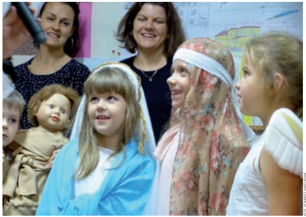
Każdy uczestnik zabawy mówił jakiego świętego wybrał – i dlaczego akurat tego?

Współorganizatorem jest sołectwo Ostrow, które udostępnią salę miejscowego Domu Ludowego. Podobne spotkanie ze wspólnym śpiewaniem odbyło się w ubiegłym roku. Ramy czasowe spotkania są nieograniczone. Na miejscu kawa, herbata, ciastka. Organizatorzy zapraszają wszystkich zainteresowanych, nie tylko mieszkańców Ostrowa i okolic. mak