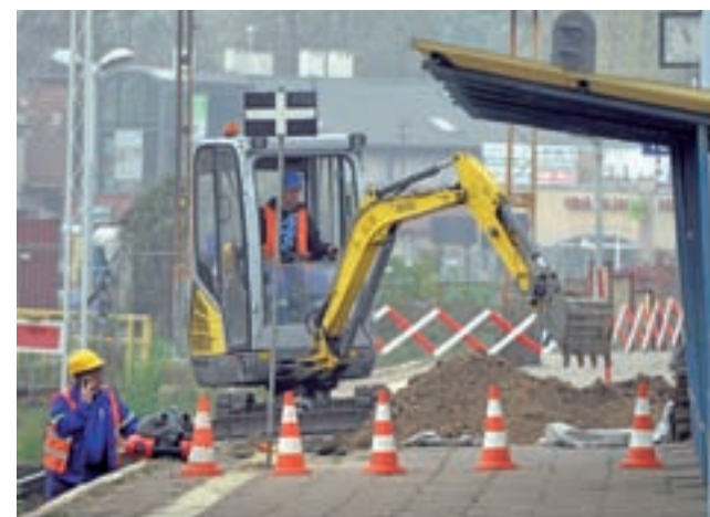
Pierwsze roboty na peronie 2 na dworcu Łowicz Główny rozpoczęły się pod koniec października.

W chwili zamykania tego numeru NŁ ważyły się natomiast losy zamknięcia przejazdu pod torami ulicą Arkadyjską. Najbardziej prawdopodobną datą za-