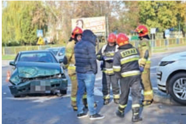
Kierujący Land Roverem 31-latek z Warszawy, jadąc ulicą Topolową w kierunku Starościńskiej, nie ustąpił pierwszeństwa przejazdu VW Polo.

Volkswagenem kierował 41-letni mieszkaniec powiatu łowickiego, który - jak się okazało - miał 0,11 mg/dm 3 alkoholu w wydychanym powietrzu. Razem z nim