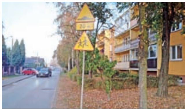
Gdyby ul. Młodzieżowa była poszerzana, trzeba by wyciąć większość drzew przed tym blokiem (nr 16).

Ponadto z przedstawionego przez naczelnika Pełkę projektu wynikało, że ulica miałaby zostać poszerzona z 4,5 do 6 metrów na całej długości (od skrzyżowania z ul. Papieską aż do skrzyżowania z Tuszewską), istniejące zatoki parkingowe przeniesione byłyby na drugą jej stronę i tam też (m.in. po stronie bloku nr 16) miałby powstać chodnik. Roboty te miałyby kosztować nawet ok. miliona złotych.