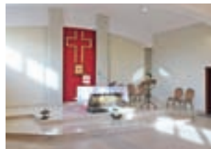
Wnętrze nowej kaplicy prezentuje się godnie i poważnie.

Przypomnijmy, że prace nad adaptacją dawnego budynku