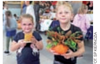
Na kiermaszu można było kupić jesienne kompozycje.

Podobną, ogólnoszkolną akcją połączoną z kiermaszem, szkoła w