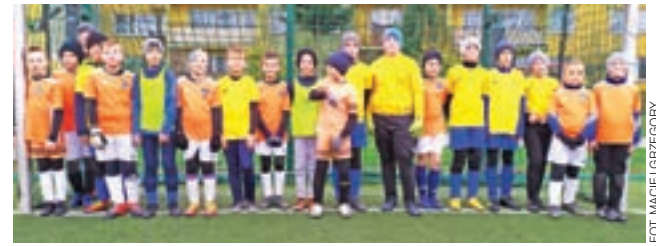
Soccer Kids-2010 udanie zagrało z Champions Rawa Maz. 2010.

■ 9. kolejka klasy A: Vagat Domaniewice – Dar Placencja 2:1; Astra Zduny – Mazovia Rawa Mazowiecka 3:1; Rawka Bolimów – Korona Wejście 2:5; Laktoza Łyszkowice