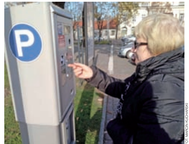
Do konieczności pobierania biletów z parkomatów trzeba było się przyzwyczaić, ale nie jest to duży kłopot.

Zniesienie strefy płatnego parkowania było jednym z punktów kampanii wyborczej komitetu Łowickie.pl w wyborach samorządowych w 2018 roku. Radni z tego stowarzyszenia uważają, że w momencie kiedy strefa przestała przynosić miastu zyski, dopłacanie do jej utrzymania straciło sens. Zwracają przy tym uwagę, że koniec umowy z dotychczasowym jej operatorem (a więc czas do końca roku) jest najlepszy dla podjęcia decyzji o likwidacji. Nie wykluczone, że poprą ich na sesji radni klubu PIS i Niezależni, a to przesądziłyby kwestię dalszych losów strefy.