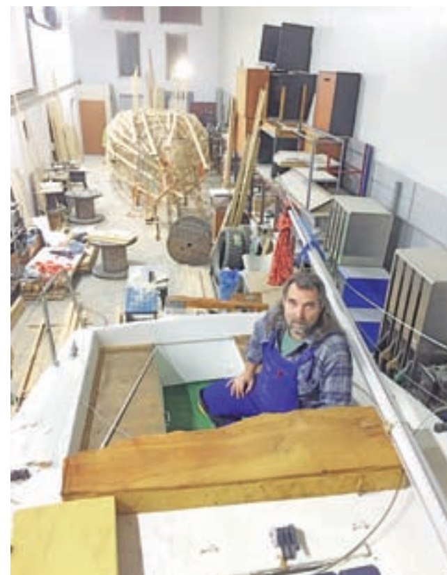
„Stocznia” na Warszawskiej. Na pierwszym planie bohater naszego tekstu w kokpicie swej „Lilu”, w głębi szkielet nowego jachtu.

Mimo wszystko zamierza on zabrać na pokład tratwę ratunkową, której podczas rejsu przez Atlantyk nie miał. A kontakt ze