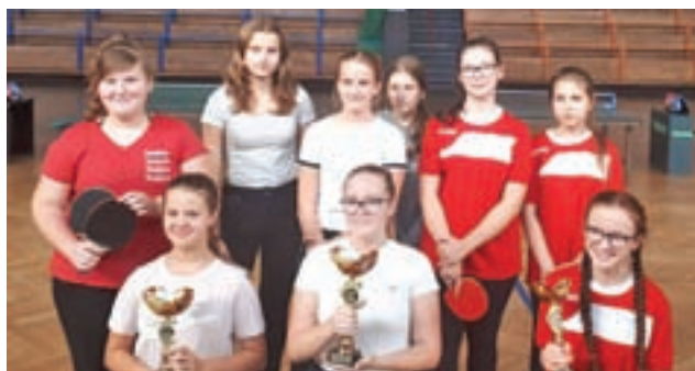
Tenisistki z powiatu łowickiego z pucharami za zwycięstwa.

■ Wyniki: SP 1 Łowicz – SP Nieborów 2:3, SP w Sobocie – SP Domaniewice 3:0, SP Nieborów – SP Sobota 2:3, SP w Bąkowie Górnym – SP 1 Łowicz 3:0, SP Sobota – SP Bąków Górny 0:3, SP w Domaniewicach – SP Nieborów 0:3, SP Bąków Górny – SP Domaniewice 3:0, SP 1 Łowicz – SP Sobota 2:3, SP w Domaniewicach – SP 1 Łowiczu 1:3, SP w Nieborowie – SP w Bąkowie Górnym 3:1.