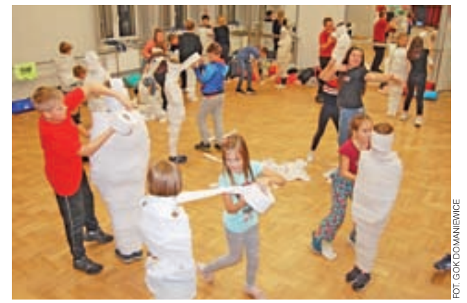
Zabawa w mumie na długo pozostanie w pamięci dzieci.