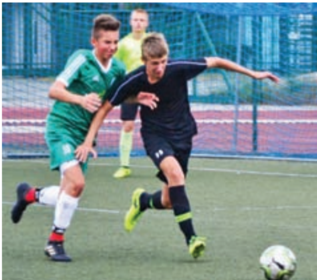
Pelikan 2005 awansował do I ligi wojewódzkiej.

Pelikan po tej wygranej zapewnił sobie awans do I ligi wojewódzkiej. Łowiczanie grali już przez jedną rundę w I lidze wojewódzkiej, teraz będzie to dla nich powrót na najwyższy szczebel rozgrywek w woj. łódzkim.