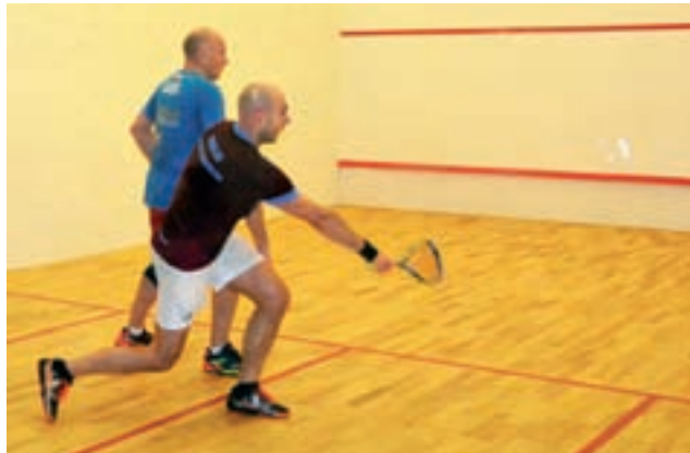
Turniej rozgrywany był na dwóch kortach. Wzięło w nim udział łącznie 19 zawodników.

Jego squash jest sportem bardzo wymagającym. Nawet nie