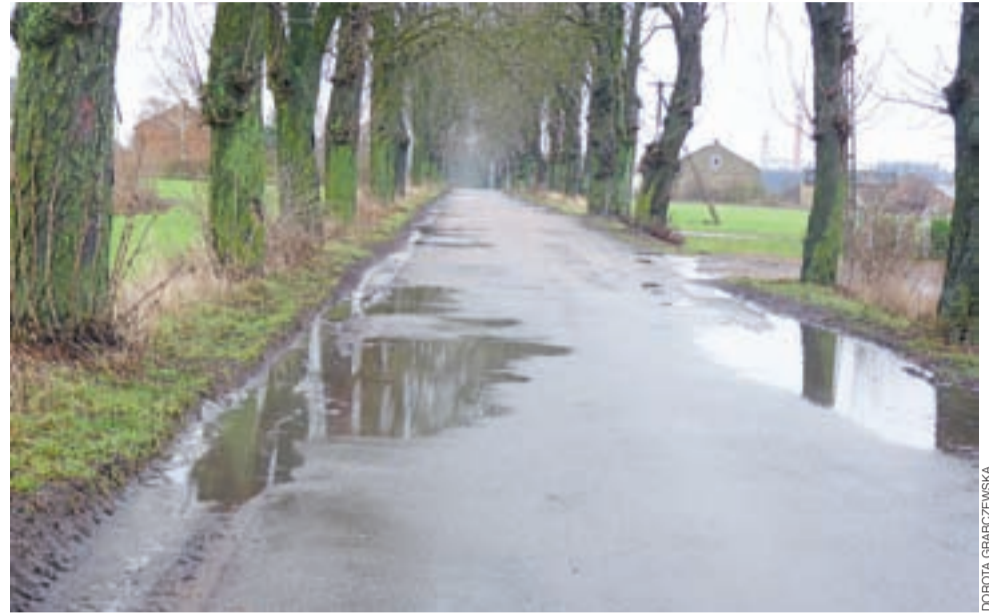
Na kompleksową modernizację drogi przez Drzewoszeki zlecono już opracowanie dokumentacji technicznej.