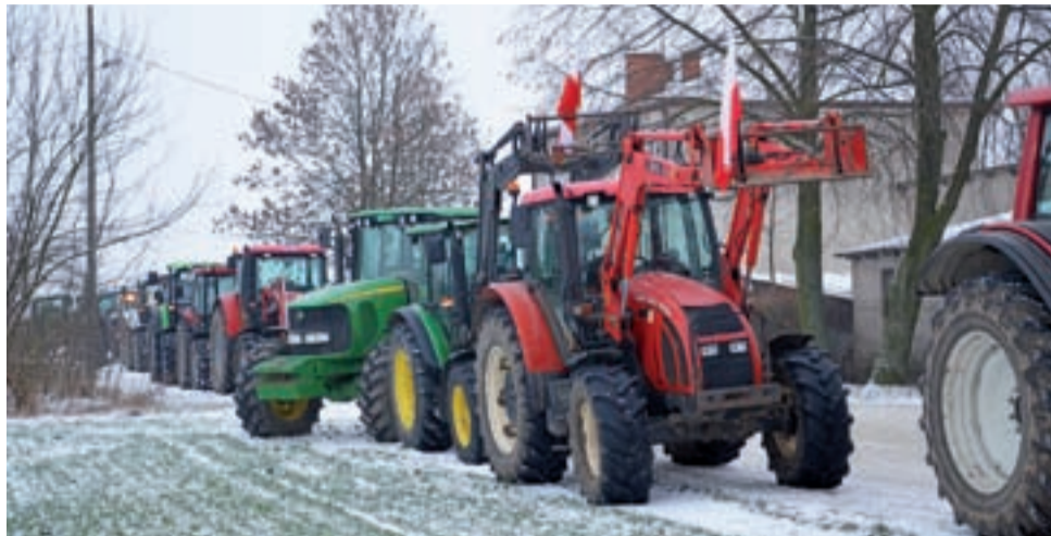
Protest rolników rozpoczął się przy szkole w Błędowie, przy której stało rzędem kilkadziesiąt ciągników.

W rozmowie z nami, jako najpilniejszą z tych spraw rolnicy wskazywali odstrzał dzików, który ich zdaniem jest konieczny, aby powstrzymać rozprzestrzenianie się ASF. Byli zaniepokojeni tym, że rząd, który najpierw zapowiedział odstrzał redukcyjny, pod wpływem opinii społecznej zaczął się z tych planów wycofywać, zapowiadając, że może nie będzie strzelania do próchnych macior.