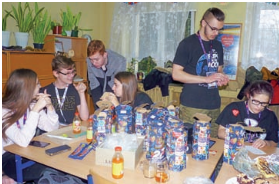
W sztabie żychlińskiego WOŚP w Zespole Szkół nr 1 wolontariusze mogli się posilić i liczyć pieniądze.