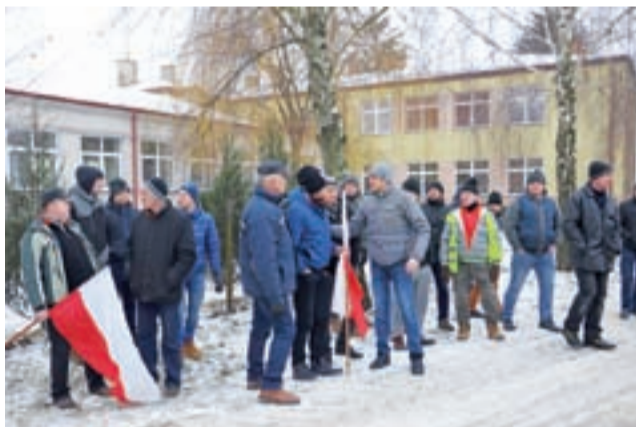
Rolnicy przed wyruszeniem na drogę ustalali plan działania, m.in. kto z nich spotka się ze starostą Marcinem Kosiorkiem oraz którymi drogami będą jechać.

Podczas spotkania rolnicy poruszyli także kwestie związane z prowadzeniem hodowli trzody chlewnej i ferm drobiu, takie jak: postulat znakowania produktów pochodzących z Polski flagą, kontrole sprowadzanego mięsa przez inspekcję, bioasekuracja, tucz nakładczy (formuła, w której cały proces wyhodowania tuczniaka przebiega zgodnie z kontraktem zawartym z dużym podmiotem), konsekwencje wstrzymania importu mięsa, terminy płatności na wystawianych fakturach, problemy związane z uzyskiwaniem pozwoleń przy prowadzeniu inwestycji w gospodarstwach rolnych. Mówiono też o odpowiedzialności podmiotów skupujących, bo są wśród nich takie, które zalegają rolnikom z wypłatami na bardzo duże sumy pieniędzy. mwk, tm