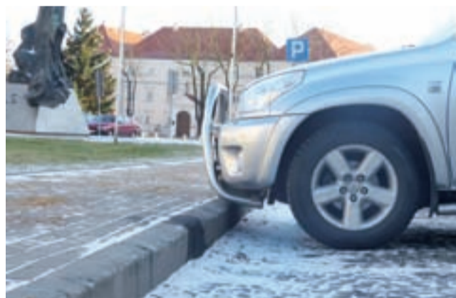
Jedynie samochody mające wysokie zawieszenie mogą na tych miejscach parkingowych na Starym Rynku parkować bezpiecznie.

Sam krawężnik może nie byłby problemem, gdyby nie to, że przed nim jest zadolenie w kostce brukowej. Niezorientowani lub mniej doświadczeni kierowcy, parkując wzdłuż tego krawężnika łatwo mogą sobie uszkodzić zderzak i pozostawić po sobie ślad na krawężniku. Dowodów na tym na krawężniku nie brakuje – w wielu miejscach jest on wylupany.