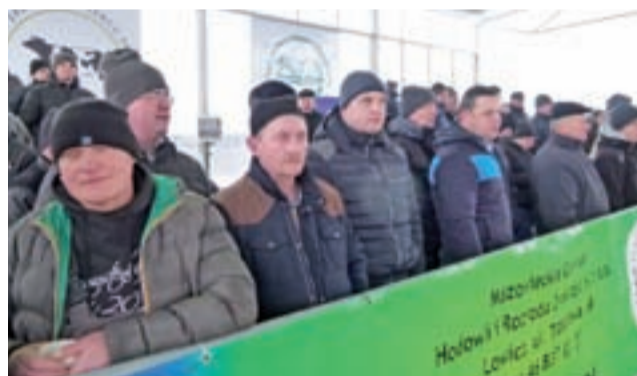
Trybuny na ringu podzielono na część dla zainteresowanych kupnem wystawionych na aukcję sztuk i część dla obserwujących. W tej pierwszej było zdecydowanie więcej osób.

Kolejne aukcje w Bratoszewicach planowane są już na 14 lutego i 14 marca, czyli każdy drugi czwartek miesiąca. Zmiana miejsca aukcji nie pociągnęła za sobą zmiany kosztów brania w niej udziału. ■