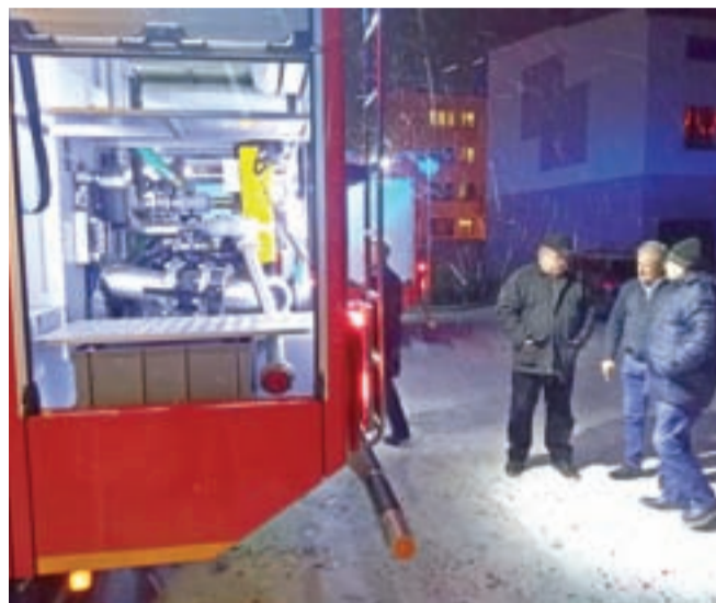
Jednym z atutów, choć nie jedynym, nowego samochodu strażackiego OSP Łowicz jest wysokowydajna pompa, która jest w stanie przepompować 4 tysiące litrów wody w ciągu jednej minuty.

Powitanie nowego samochodu wstępnie było planowane pomiędzy ubiegłorocznymi świętami Bo-