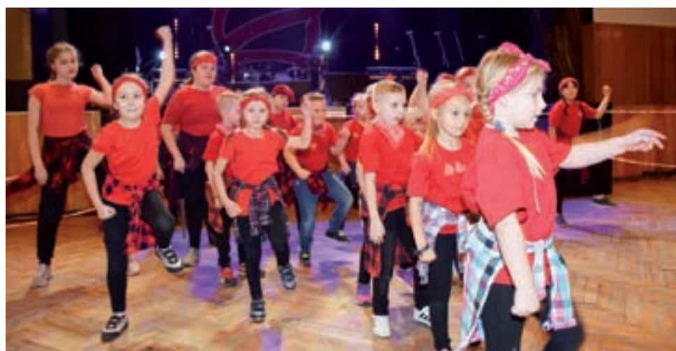
Grupa hip-hop w swoim układzie tanecznym.

W ramach bloku rodzinnego na scenie ŻDK zaprezentowały