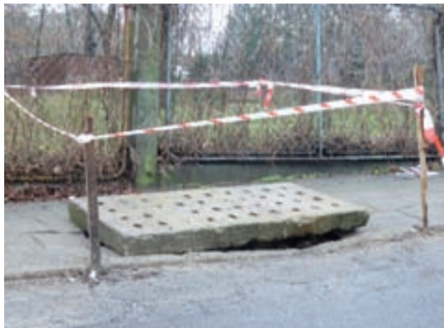
Na razie dziura w chodniku została przykryta płytą betonową, do czasu poprawy aury. Wtedy awaria zostanie usunięta. Pozostaje pytanie czy do tego czasu osuwisko się nie powiększy?

– Niebezpieczne miejsce zostało zabezpieczone do czasu poprawy aury (w domyśle możemy uznać, że czekamy do wiosny – przyp. red.), by możliwe były