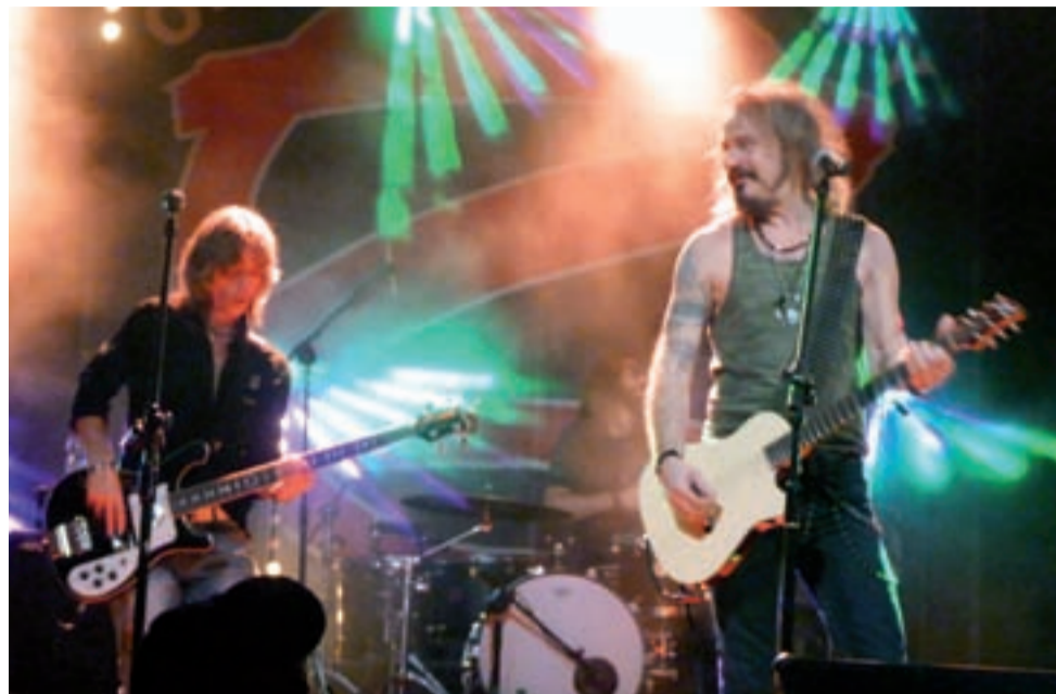
Gwiazdą WOŚP w Żychlinie był „Oddział Zamknięty”, który jednak nie porwał mieszkańców Żychlina.

Żychlin | Wielka Orkiestra Świątecznej Pomocy