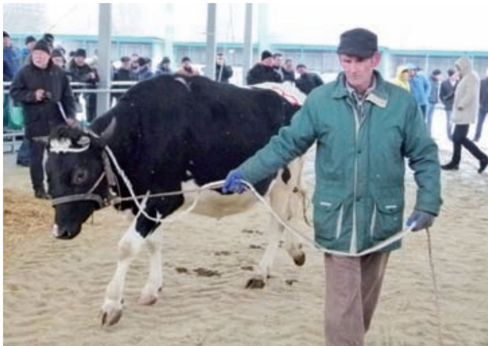
O ostatecznej cenie decydowała licytacja prowadzona w czasie prezentacji sztuki na ringu.

– Zainteresowanie zarówno sprzedających, jak i kupujących, jak na pierwszy raz oceniam jako dobre. Niestety na licytację nie dojechały dwie sztuki (...). Mamy tu dziś zarówno sztuki o wysokim statusie genetycznym z Ośrodka Hodowli Zarodowej z Dęboleki, ale i niewiele ustępujące im jałówki, które przywieźli ze swych hodowli rolnicy indywidualni – po-