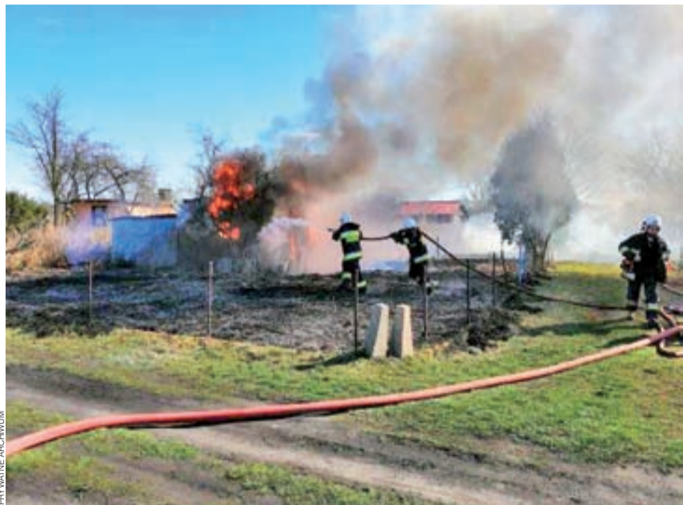
Tak wyglądała akcja gaśnicza w poniedziałek 1 kwietnia ok. godz. 15.00.