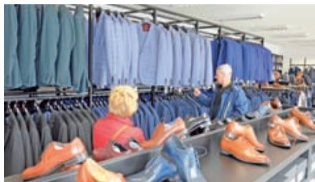
W sklepie przy ul. Jana Pawła II panowie mogą ubrać się kompleksowo, począwszy od obuwia a skończywszy np. na apasce pod szyją.

Wcześniej przykładem takiego rozwiązania był sklep eModo, również oferujący odzież męską, który mieści się przy drodze z Łowicza w kierunku Nieborowa – w zasadzie już w Mysłakowicach.