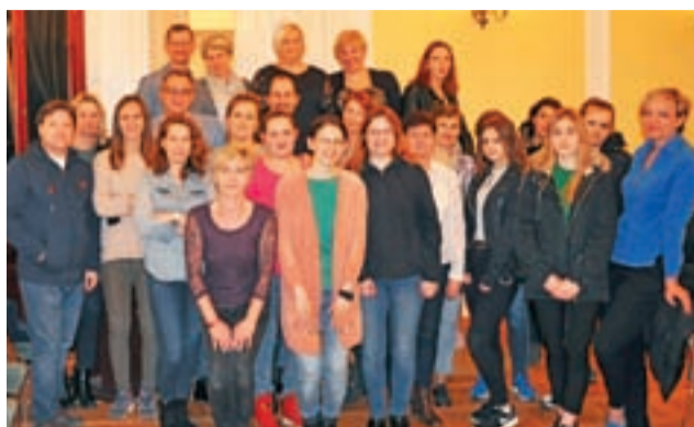
Spotkanie wolontariuszy biorących udział w trzeciej odsłonie akcji.

W tegorocznej odsłonie bierze udział 10 punktów gastronomicznych, 20 seniorów i taka sama ilość wolontariuszy. Co jednak ciekawe, udział w tej edycji za-