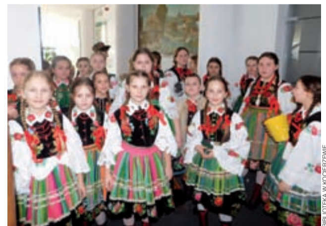
Dziecięcy Zespół Ludowy „Kocierzewiaczy” wytańczył i wyśpiewał II miejsce podczas VI Kasztelańskich Spotkań Folklorystycznych w Sierpcu.