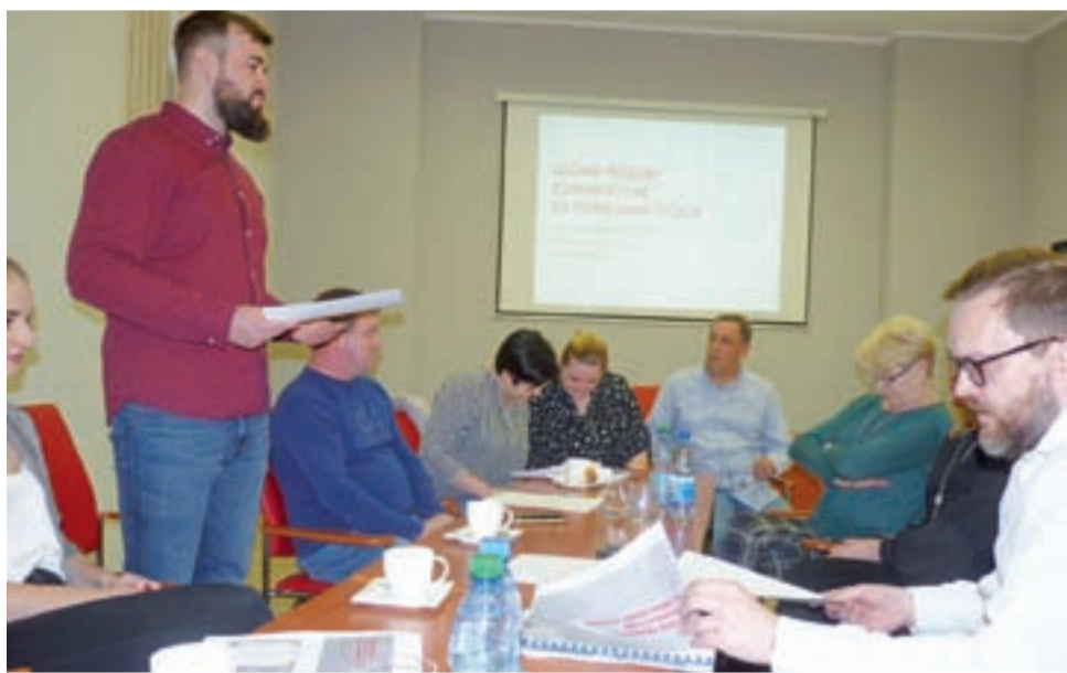
Podczas komisji drogowej burmistrz przedstawił radnym swoje propozycje, które teraz mają przeanalizować.

Burmistrz podkreślał, że zależy mu głównie na poszerzeniu ulicy Sannickiej do granicy województwa (w stronę Skrzyszew) oraz na poszerzeniu drogi 573 w stronę Gostynina