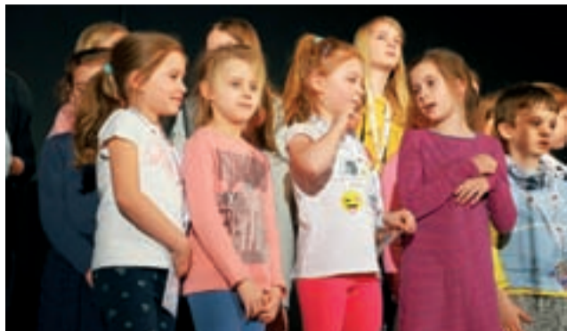
Ostatnie przygotowania przed sobotnim występem. Dzieci jeszcze nie przebrane w stroje, w których występowały.