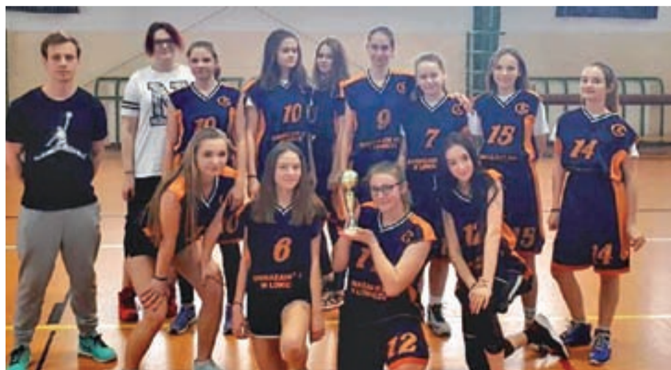
Koszykarki z SP 2 Łowicz zostały mistrzyni powiatu łowickiego.