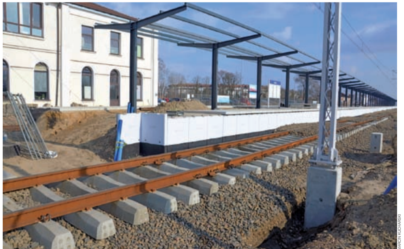
Niedokończony peron 1 na dworcu Łowicz Główny i niedokończone tory do niego przylegające.

Ponieważ faktyczny stan techniczny fundamentów oraz dolnej części przyczółków okazał się być w znacznie gorszym stanie niż zakładano w projekcie, istniejących elementów obiektu