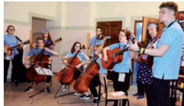
Sekcja muzyczna scholi z Bolesławca ćwiczyła przed występem na jednym ze szkolnych holi.

Łowicz | V Ogólnopolski Przegląd Scholi Pijarskich