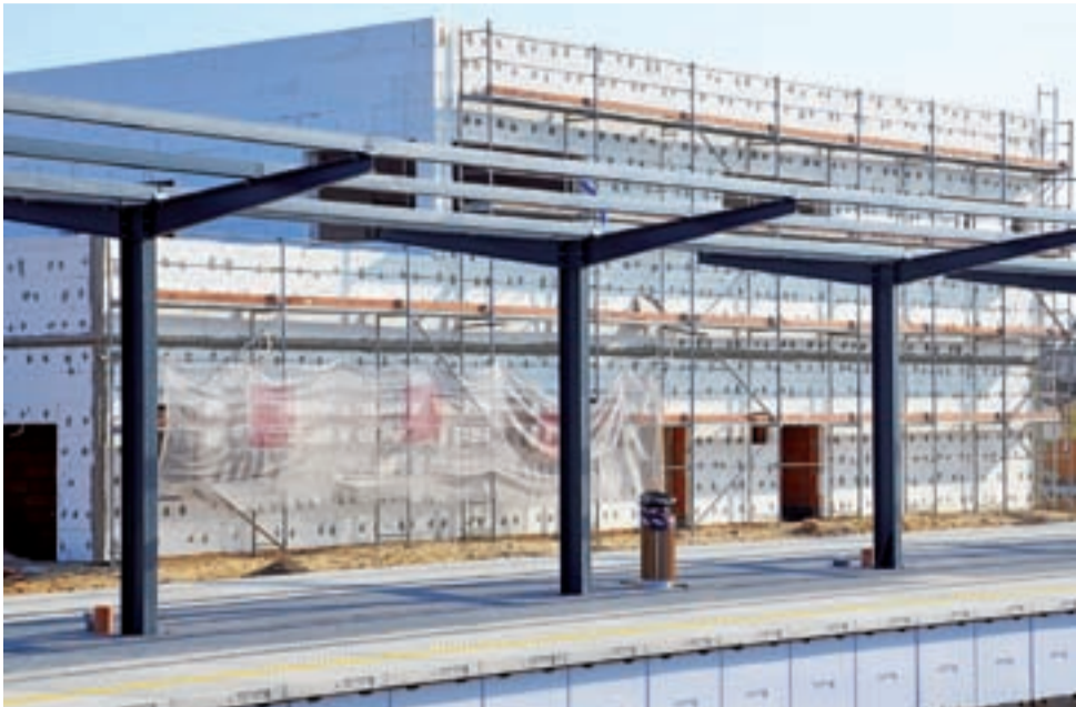
Budowa Lokalnego Centrum Sterowania, które widać z końca peronu 2, miała zakończyć się pod koniec ubiegłego roku.