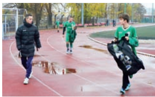
Pelikan 2004 nieudanie zainaugurował rozgrywki ligowe.

– Trzeba przyznać, że to będzie jedna z najmocniejszych drużyn w tej II lidze wojewódzkiej. Przewyższała nas pod względem siłowym, motorycznym, pod takimi aspektami, których nie możemy pokonać, bo mamy takie uwarunkowania biologiczne, jakie mamy i trzeba podjąć dwa razy takie zaangażowanie, żeby wygrać, a u nas zabrakło tego zaangażowania. Zabrakło dyscypliny taktycznej. Dostaliśmy wiadro zimnej wody na głowę. Niestety nic nie udało się zrealizować z tego, co funkcjonowało w dwóch ostatnich sparingach i funkcjonowało na dobrym poziomie. Chłopcy chyba nie wytrzymali presji tego, że to już jest mecz ligowy. Złe funkcjonowała obrona, źle funkcjonował środek pomocy. Wynik też nie do końca odzwierciedla to co działo się na boisku, bo przy stanie 0:3 zarzykował, zostawiłem trzech obrońców i chciałem szukać ja-