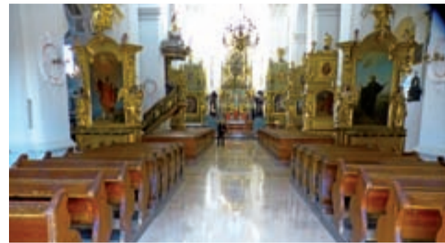
Wierni znów mogą oglądać ołtarz główny, a także nową, lśniącą posadzkę.