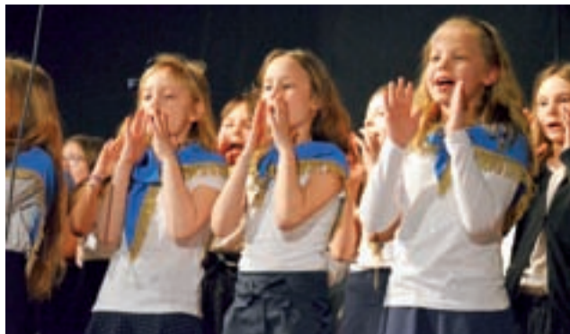
Dzieci ze scholi „Anielskie echo” z Krakowa Rakowic podczas otwartego występu w sobotę.