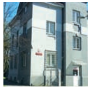
Komisariat Policji w Żychlinie. Tu pracował policjant skazany za zabójstwo.

Rok temu, 29 marca 2018 roku, usłyszał zarzut zabójstwa i paserstwa. W czerwcu 2018 r. rozpoczął się proces. Początkowo nie