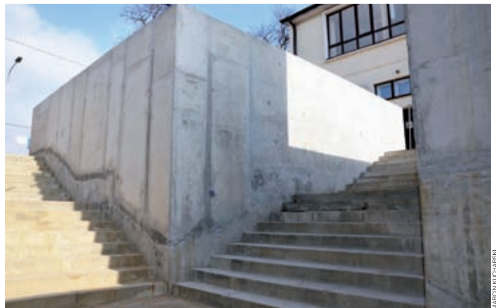
Przejście podziemne pod torami ma być otwarte dopiero po zakończeniu modernizacji peronu 2.