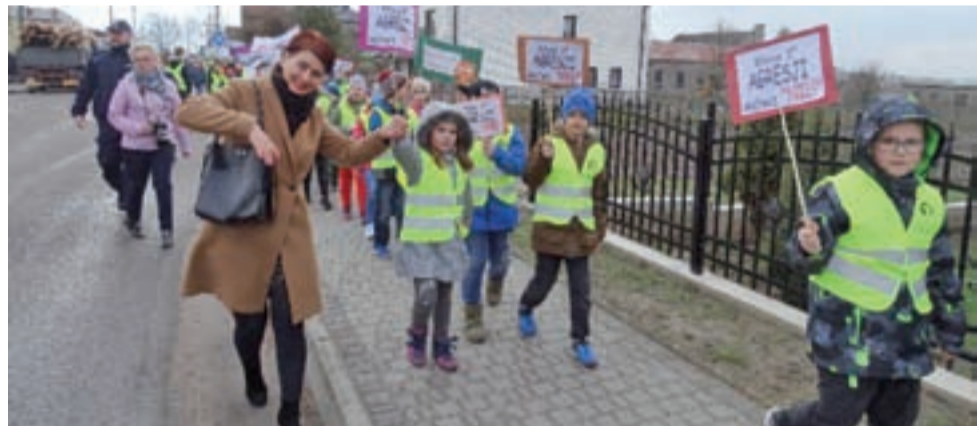
Uczniowie z SP w Pacynie zorganizowali kolorowy happening „Stop przemocy i agresji”.

Technika wykonania prac jest dowolna. Format obowiązkowy A4. Każde dziecko może dostarczyć tylko jedną pracę. Informacja o wynikach konkursu zostanie podana na stronie internetowej ŻDK i na Facebooku. O terminie wręczenia nagród laureaci zostaną powiadomieni telefonicznie. dag