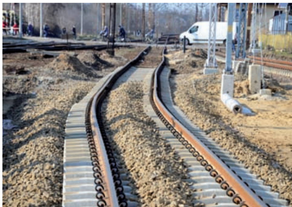
Te tory w przyszłości nie będą takie krzywe. Przed oddaniem odcinka do użytku będą wyrównywane specjalistyczną maszyną, to normalna procedura w tego typu robotach.

W przejściu nie ma jeszcze oświetlenia, planowanych wind dla osób niepełnosprawnych czy chociażby czujek monitoringu. Jest za to... woda – prawie cały