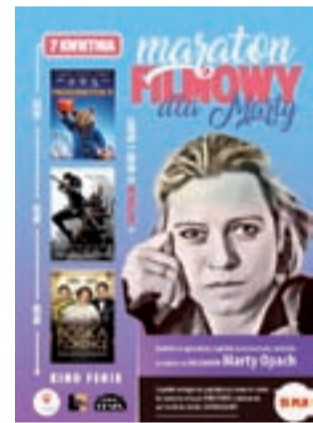
W niedzielę 7 kwietnia kino Fenix zaprasza na Maraton filmowy.

W niedzielę 7 kwietnia Stowarzyszenie Łączy nas Łowicz