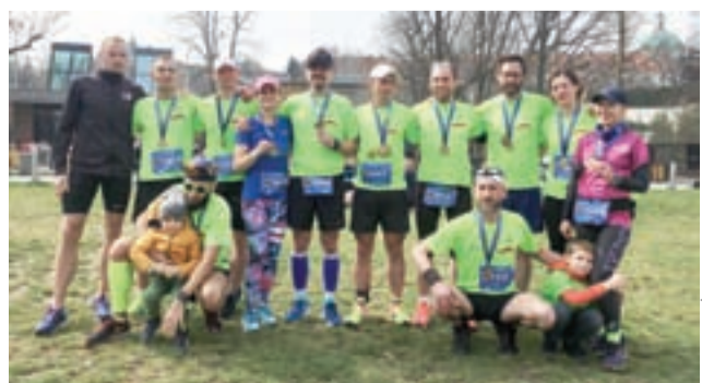
Rozbiegani Żychlin podczas 14. PZU Półmaratonu w Warszawie.

w tabeli w kolejności: imię i nazwisko zawodnika, czas, miejsce w poszczególnej kategorii – Mężczyzn, Kobiet