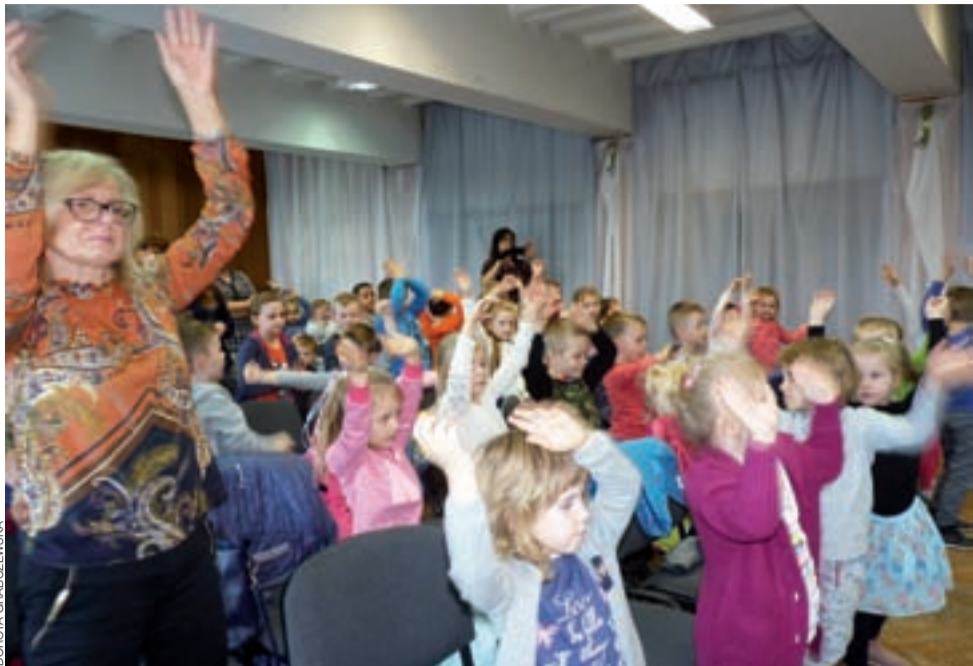
Dzieci bardzo chętnie uczestniczyły we wspólnej zabawie czytania wierszyków.

Żychlin | Akcja domu kultury pt. „Klasyka wierszyka”