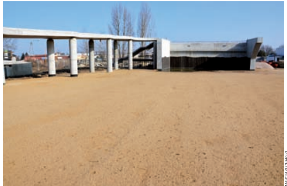
Tędy będzie się w przyszłości wjeżdżało na wiadukt.