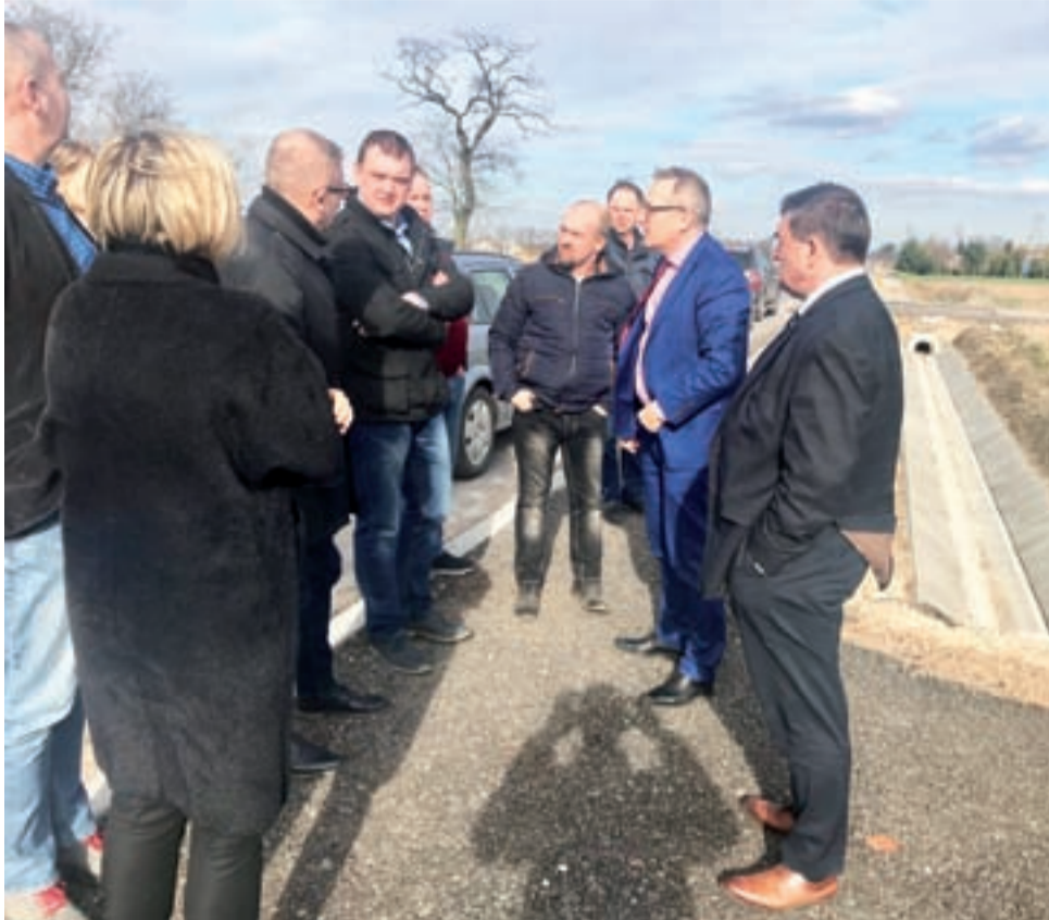
Po zakończeniu części spotkania przedstawiciele ZDW wraz z mieszkańcami udali się w teren.

– W pełni rozumiem problemy mieszkańców gminy, wynikające z przebudowy drogi wojewódzkiej 703, jednak musimy pamiętać, że jako nowy zarząd staramy się rozwiązać kłopoty, do których nie doprowadziliśmy sami, lecz zastaliśmy je po naszych poprzednikach. Dziś staramy się dojść do porozumienia z mieszkańcami i zrobimy wszystko, by do konsensusu doprowadzić.