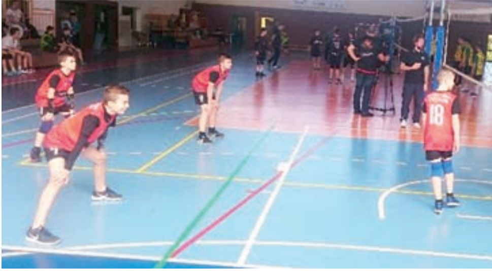
Mecz chłopów Volley Team Żychlin II w trakcie ogólnopolskich rozgrywek Turnieju Mini Siatkówki Jokery Glinka Academy 2019.