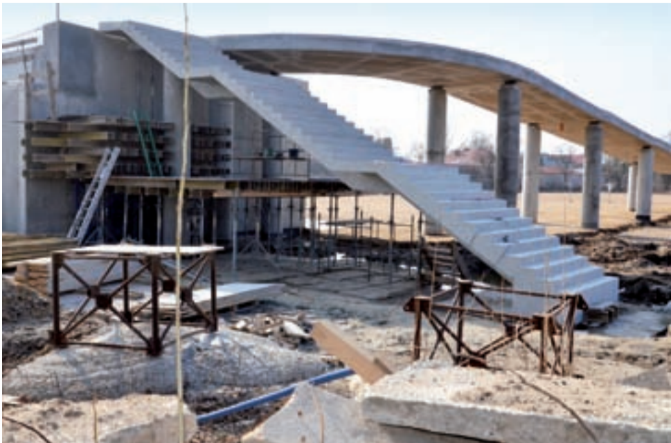
Schody i fragment wjazdu dla osób niepełnosprawnych – tutaj większych opóźnień nie ma.