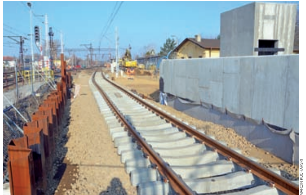
Betonowe podkłady oraz tory w pobliżu przejścia podziemnego zostały ułożone kilkanaście dni temu.

Łowicz | Ślimaczy się modernizacja linii kolejowej Warszawa – Poznań