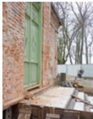
Właściciele zamontowali nowe, stylowe drzwi boczne, zrobiono też nowe betonowe schody.

– Do końca marca był termin, aby złożyć wnioski o dotację do ministerstwa kultury. Złożyliśmy dwa wnioski. Jeden dotyczy renowacji dworu, drugi wykonania ogrodzenia betonowego od strony frontowej o długości 560 m. W ciągu 2 miesięcy wnioski mają być rozpatrzone. Zobaczymy. Do 12 kwietnia składamy wniosek