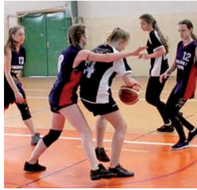
Dziewczyny walczyły o każdą piłkę, ale poziom był zróżnicowany.

■ Mecz o 3. miejsce: Pijarska SP w Łowiczu – SP 1 w Łowiczu 13:10 ■ Mecz o 1. miejsce: SP nr 2 w Łowiczu – SP 4 w Łowiczu 16:19