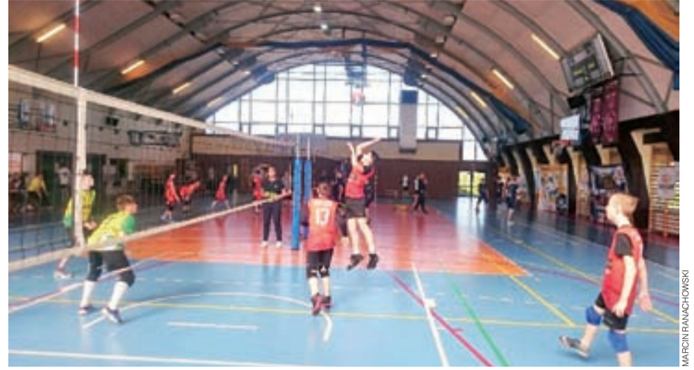
Drużyna Volley Team Żychlin I w jednym ze spotkań siatkarskich na Turnieju Mini Siatkówki o Puchar Małgorzaty Glinki, rozgrywanego w Ujeździe.

Piłka siatkowa | Ogólnopolski Turniej Mini Siatkówki „Jokery Glinka Academy 2019”