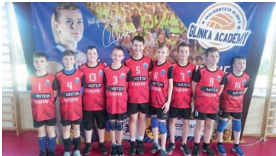
Volley Team Żychlin podczas Ogólnopolskiego Turnieju Mini Siatkówki Jokery Glinka Academy 2019 reprezentowały dwa zespoły chłopów.

Volley Team Żychlin reprezentowały dwa zespoły młodych