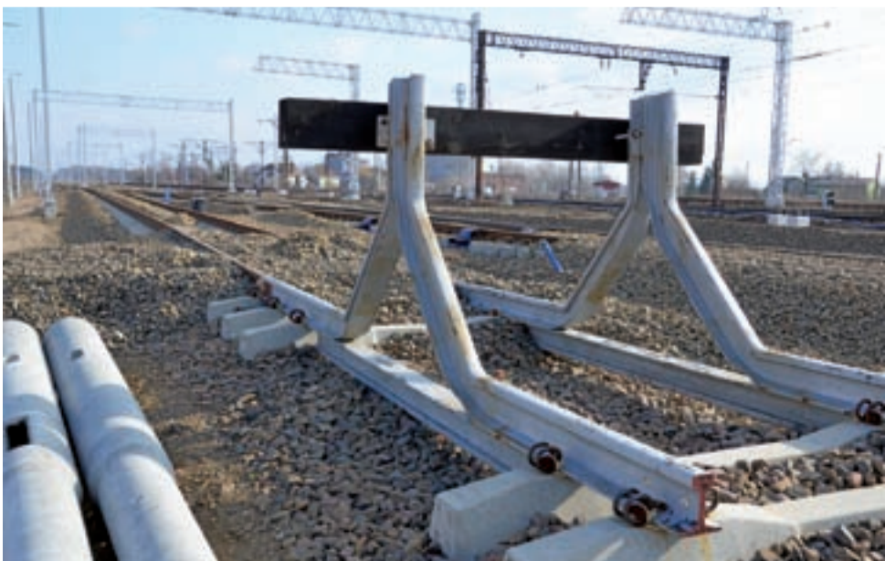
Nieczynny obecnie odcinek torów w rejonie mostu nad rzeką Zwierzyniec i ul. Arkadyjską.

Betonowa konstrukcja, którą widać od strony ul. 3 Maja, jest natomiast wejściem na wiadukt dla pieszych. Są tam schody oraz masywna konstrukcja wjazdu dla osób niepełnosprawnych. Jej masywność oraz to, że w betonie zatopiono wiele ton zbrojenia, spowodowana jest m.in. tym, że znajduje się ona w sąsiedztwie torowiska, które powoduje dodatkowe wibracje. ■