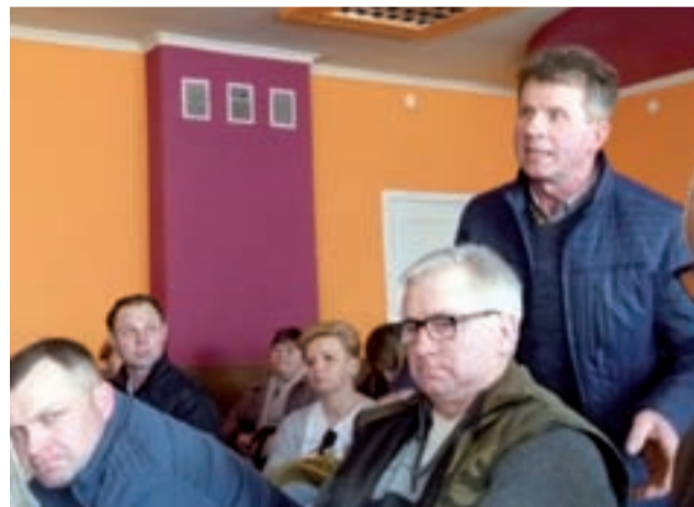
Jeden z mieszkańców gminy Bielawy przedstawia problemy, z jakimi boryka się w związku z przebudową DW 703.