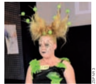
Prezentowane w konkursie fryzury i kreacje zaskakiwały pomysłowością i oryginalnością.

Dużymi umiejętnościami, ale też nie lada fantazją musieli wykazać się uczestnicy XI Konkursu Fantazji Fryzjerskich, którego finał przeprowadzono 26 marca w Warszawie. Brali w nim udział uczniowie szkół fryzjerskich z całej Polski. Uczniowie Zespołu Szkół Ponadgimnazjalnych nr 3 w Łowiczu, którzy wcześniej wygrali szkolne eliminacje (o których pisaliśmy na naszych łamach), startowali w kategorii „upięcie damsko-męskie”. Było to czworo uczniów, po jednym z każdej z czterech klas TUF (Technik Usług Fryzjerskich). Temat konkursu brzmiał „Awangarda na co dzień”, wysoko oceniano więc oryginalność, kreatywność i odwagę.