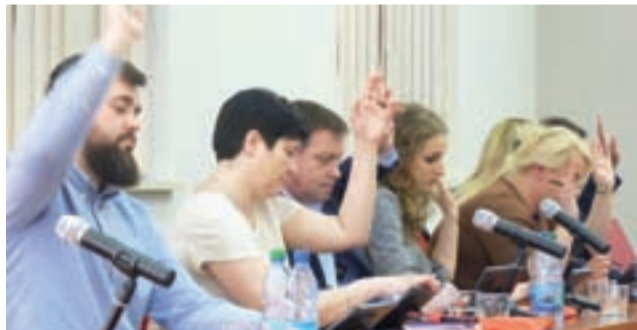
Nad zmianami budżetowymi radni głosowali jednogłośnie.

Kolejne 388.000 zł dołożyli do modernizacji pomieszczeń w ZS nr 1 im. A. Mickiewicza. Modernizacja jest potrzebna, by dostosować szkołę do nauki przez młod-