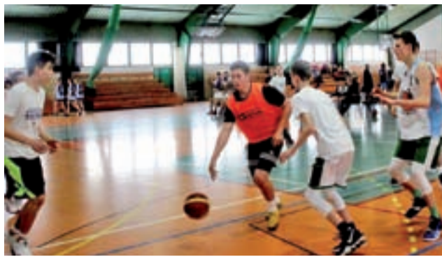
W finale SP2 pokonała pewnie Siódemkę.

W rywalizacji chłopców zdecydowanie najlepiej spisali się podopieczni Bartosza Włuczynskiego z SP 2 Łowicz, którzy w finale gładko pokonali ekipę SP