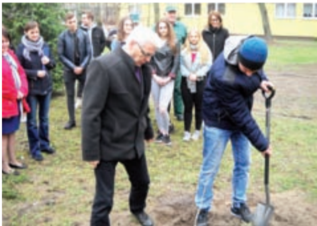
Symboliczne wkopanie kłonu.