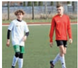
Zespół MUKS Pelikan 2005 przegrał z Ceramiką 1:4.

Pelikan 2005 przystępował do tego meczu po bardzo dobrym występie w próbie generalnej w Gąbinie, gdzie łowiczanie rozegrali się z rywalami, zwyciężając aż 9:0. W tym meczu zespół Pelikana 2005 „przespał” początek meczu ponieważ Ceramika strzeliła gole w 10. i 20. minucie meczu co w pewnym sensie ułożyło spotkanie w kolejnych minutach jego trwania.