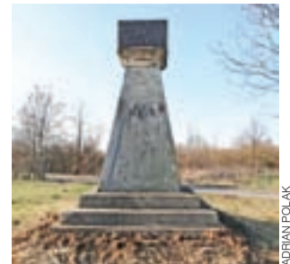
Słup w Patokach po ostatnich pracach porządkowych.