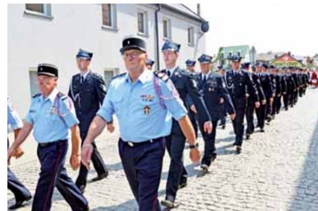
Na jubileusz OSP Łowicz przyjechali m.in. strażacy z Montoire-sur-le-Loir we Francji - widoczni na pierwszym planie.

Drugi sztandar – eksponowany obecnie w łowickim muzeum – wykonano w 1919 roku, w 40. rocznicę powstania jednostki. Na nim również została przedstawiona po jednej stronie św. Wiktorii, po drugiej – herbowe pelikany i herb straży. Na drzewcu tego sztandaru umieszczony jest ozdobny gwóźdź wbity przez prezydenta Stanisława Wojciechowskiego podczas jego wizyty w Łowiczu w 1925 roku. W miejscu obecnej siedziby straż działa od