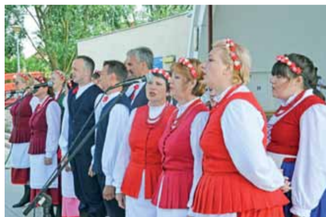
Zespół Pieśni i Tańca Solczanie z Solecznik przyjechał na występ do Łowicza po 15 latach. Szkoda tylko, że śpiewał dla niewielkiej widowni.