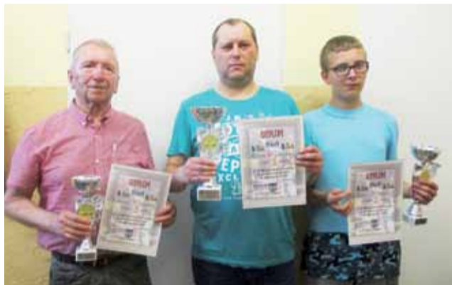
Najlepsi zawodnicy IV Mistrzostw Łowicza w szachach Fischera.