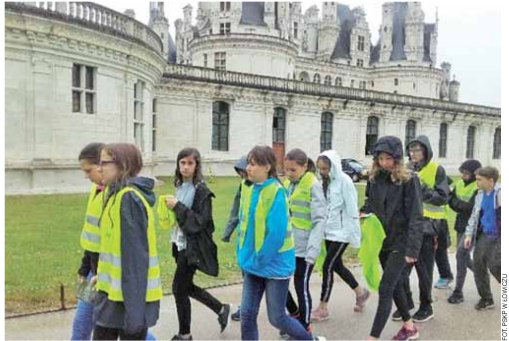
Łowicka grupa przy wielkim królewskim zamku Chambord. Jak widać: ciepło wcale tam nie było.