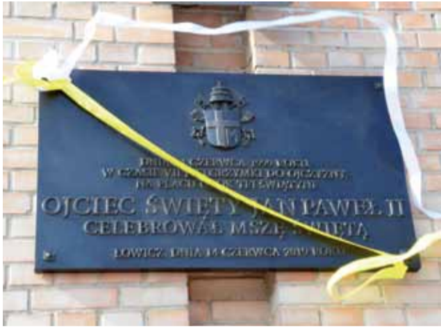
Tablica upamiętniająca wizytę Jana Pawła II w Łowiczu na froncie kościoła Chrystusa Dobrego Pasterza.