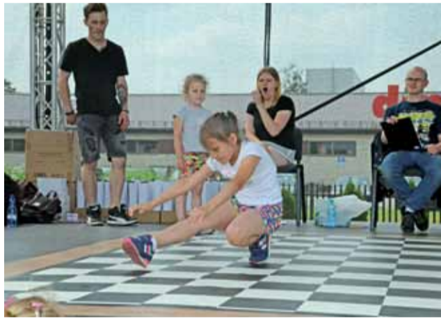
Występem tancerzy przyglądali się jurorzy, którzy siedzieli z tyłu sceny.