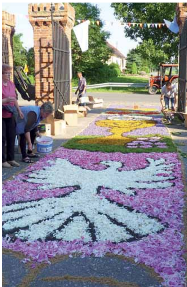
Okazały biały gołąb pokoju witał wiernych, którzy przyszli na Boże Ciało w ubiegłym roku.