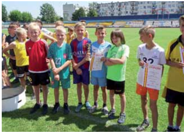
Reprezentacja chłopców SP Nr 2 w Żychlinie uplasowała się drużynowo na czwartym miejscu.

Sport szkolny | Trójbój Lekkoatletyczny dziewcząt i chłopców klas IV i młodszych