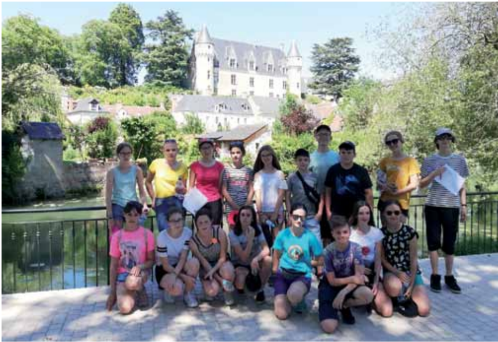
W tle zamek Montresor, należący do rodziny Reyów, obok most zaprojektowany przez Gustawa Eiffila.