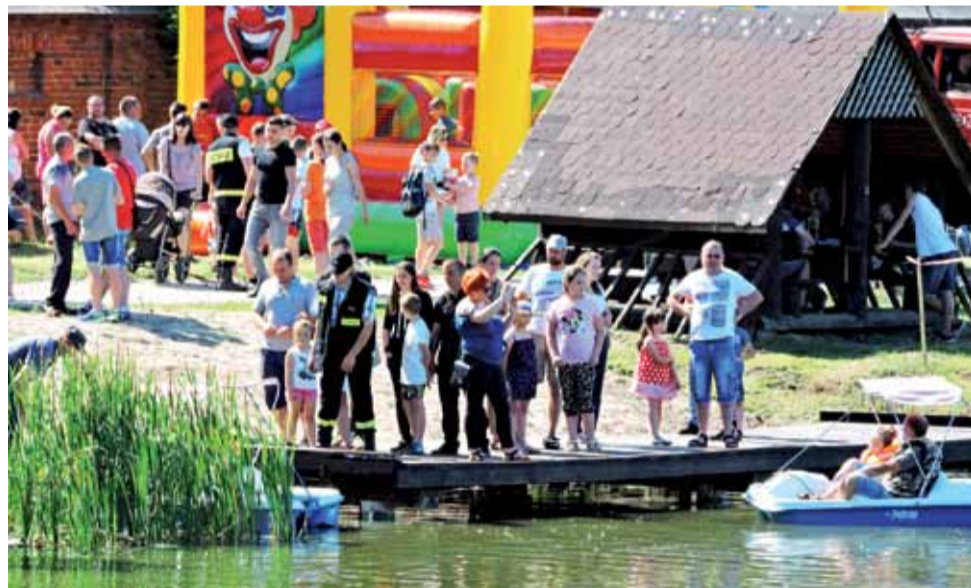
Impreza odbyła się nie na terenie zamku, ale wzdłuż stawu.

O godzinie 16 rozpoczęła się potańcówka przy muzyce serwowanej przez DJ Adrusa. Mimo zmiany miejsca imprezy, chętnych by zjeść kiełbasę z grilla czy pyszny domowy sernik nie brakowało. Niektórzy jednak narzekali, że teren był mniejszy, a muzyka tak głośna, że trudno było rozmawiać. Na terenie parku wokół zamku prościej było usiąść na ławce bardziej oddalonej od sceny. Trudno jednak wymagać, by na festynie było cicho. Imprezę organizowały władze gminy. Aleksandra Głuszcz