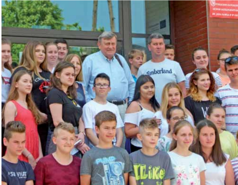
Uczniowie KLO oraz SP nr 2 w Głownie na pamiątkowej fotografii z Mirosławem Hermaszewskim.

Szkoda było czasu na sen, dlatego wolałem podziwiać. Nad Polską przelatywaliśmy w ciągu 87 sekund i było to doświadczenie niezwykle. Krzychałem, że po raz pierwszy widzę swój kraj w całości.