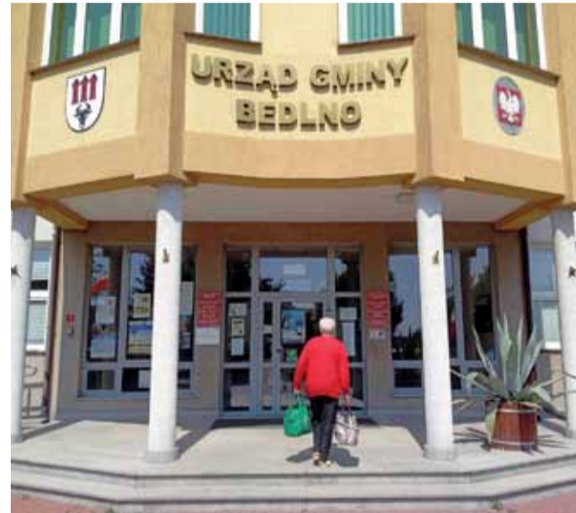
Zainteresowanie debatą było... prawie żadne. Na zdjęciu Urząd Gminy Bedlno.

Przygotowanie raportu jest pierwszym etapem procedury jego rozpatrzenia. Na pozostałe etapy składają się: debata nad raportem oraz przeprowadzenie głosowania nad udzieleniem wójtowi wotum zaufania. Ustawodawca zdecydował ponadto, że procedura rozpatrzenia raportu jest połączona z procedurą udzielenia wójtowi absolutorium i jest przeprowadzana podczas sesji absol-