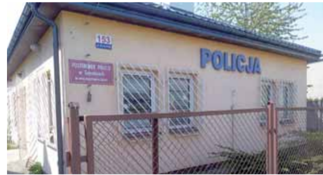
Posterunek policji przy ul. Warszawskiej w Sannikach.

Zmiany będą widoczne również z zewnątrz: budynek zostanie docieplony, wymienione zosta-