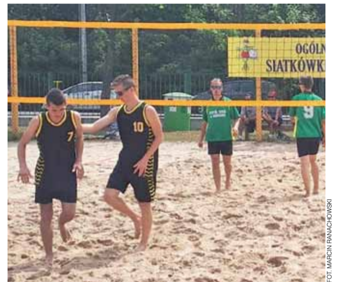
Mecz drużyny chłopców Gimnazjum w Żychlinie podczas wojewódzkich rozgrywek finałowych siatkówki plażowej na boisku w Burzeninie.

■ Gimnazjum Nr 4 w Bełchatowie – Gimnazjum Żychlin 21:17 ■ Gimnazjum w Dobrońcu – Gimnazjum Żychlin 23:21