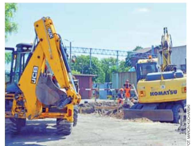
Prace przy nastawni w Żychlinie są tak prowadzone, żeby mogła ona cały czas pracować.