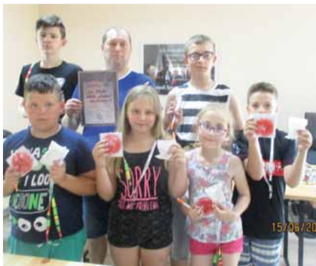
Drużyna Pałacu Nieborów była bardzo mało gościnną na ostatnich zawodach w sezonie.