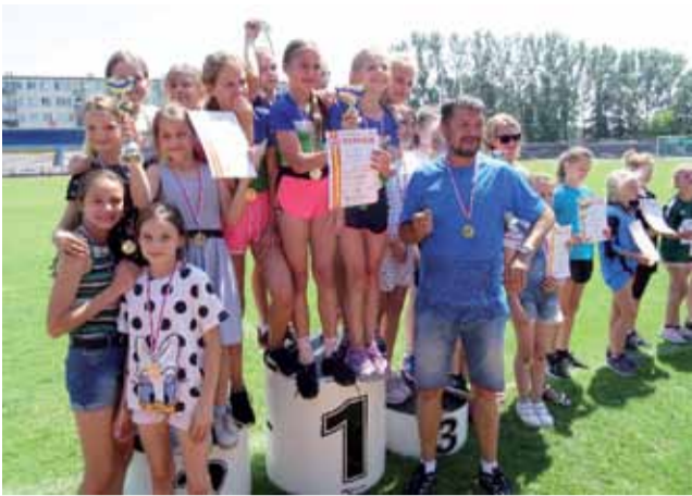
Reprezentacja dziewcząt SP Nr 2 w Żychlinie zajął drużynowo drugie miejsce.