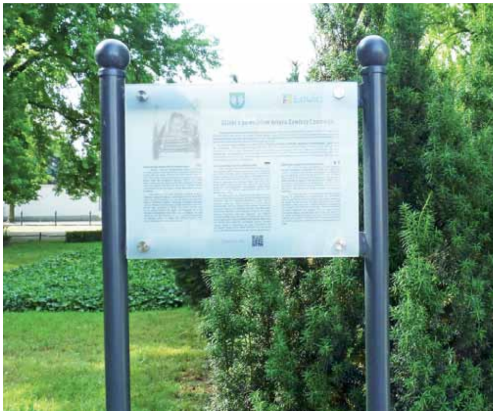
Jedna z tabliczek stanęła w alejach Sienkiewicza przy pomniku Artura Zawiszy Czarnego.

Do tematu wrócono w 2016 roku, uzupełniono dokumentację, którą rozpoczęto tworzyć w 2008 i 2009 roku, wystąpiono z ponowną prośbą o możliwość umieszczenia tablic na zabytkach. Na odpowiedź trzeba było czekać długo, ale w końcu w 2017 roku rozpoczęły się intensywne działania. Teksty, jakie miały znaleźć się na tablicach