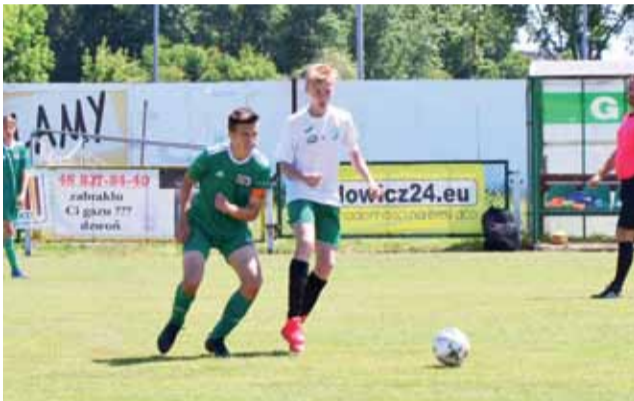
Gracze Pelikana 2004 wystąpili na głównej płycie Stadionu Miejskiego.

Zespół MUKS Pelikan zremisował na głównej płycie Stadionu Miejskiego z Wartą Sieradz 3:3, a mógł to spotkanie wygrać. Znacznie słabiej poszło łowickiej drużynie w Łodzi, gdzie w starciu z Widzewem tylko przez pierwszą połowę Pelikan dotrzymywał kroku i bezbramkowo remisował. Po przerwie to rywale strzelili cztery gole i zwyciężyli.