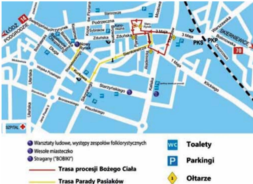
Mapka z zaznaczonymi trasami procesji oraz parady pasiaków.

Uroczystości kościelne rozpoczną się mszą świętą w bazylice katedralnej o godzinie 10.30. Po błogosławieństwie wyruszy procesja, czyli jeden z symboli Łowicza – bo choć w tym dniu procesje będą szły w całej Polsce, to ta łowicka od dawna uważana jest za unikatową i jedyną w swoim rodzaju. Trasa procesji, tak jak rok i dwa lata temu, będzie wiodła przez ulice 11 Listopada, plac Koński Targ, Tkaczew i 3 Maja. Zacznie się i zakończy na Starym Rynku. Cztery ołtarze na trasie przygotowują: ojcowie pijarzy, cech rzemiosł i repre-