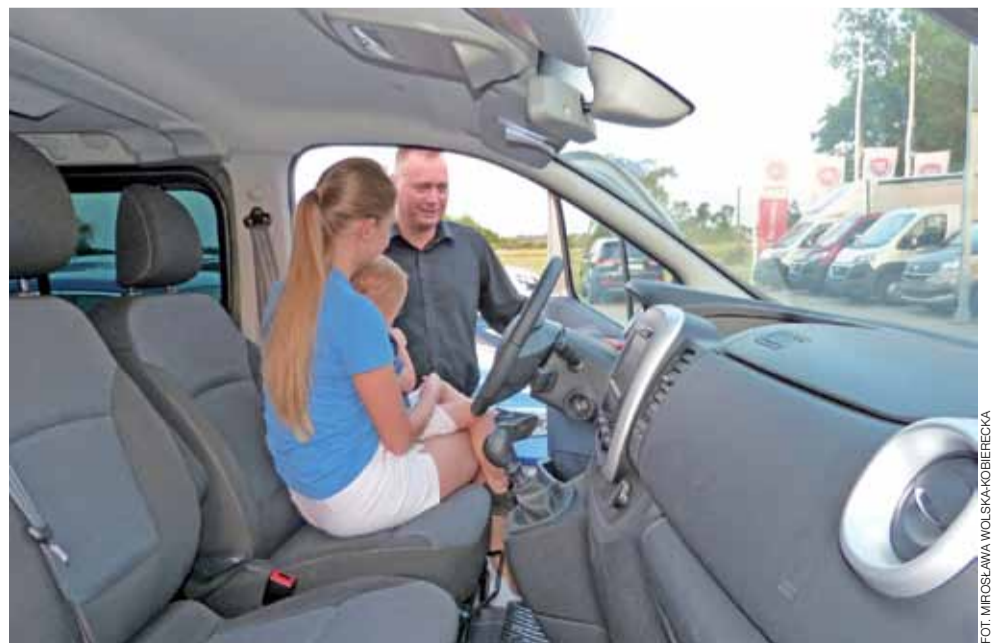
Spółka MGT oferuje sprzedaż tylko dostawczych Fiatów, stąd też „Noc cudów” nie przyciągnęła wielu klientów. tb

Wspomniani klienci zakupili Fiata Talento za 109 tys. zł (cena regularna wynosi 120 tys. zł) oraz Fiata Fiorino za 37 tys. zł (w tym przypadku upust wyniósł 4 tys. zł). mwk