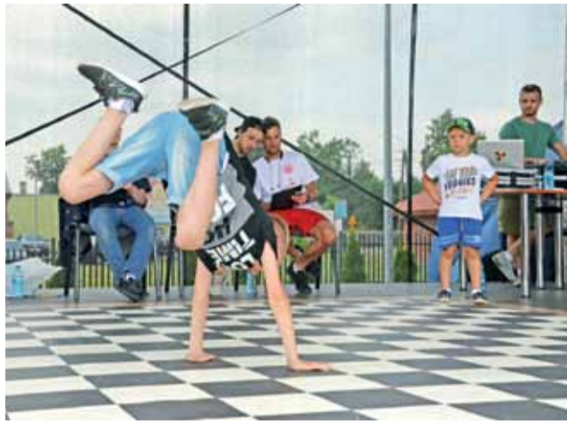
Najmłodszy uczestnik konkursu pokazywał swoje umiejętności podczas solowych występów.

W kategorii I startowało 120 uczestników (od przedszkolaków do uczniów klas III szkół podstawowych). Równorzędne wyróżnienia za indywidualne prezentacje otrzymali: Aleksander