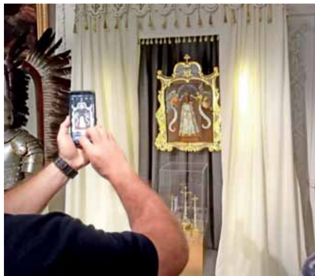
Najcenniejszym zbytkiem wystawy jest Matka Boska spod Wiednia, obraz datowany na I połowę XVII wieku.

Wyjątkowość nowej wystawy polega na tym, że Radziwiłłowie – potomkowie dawnych właścicieli nieborowskich dóbr – udostępniłi wiele swoich pamiątek, nigdy nie eksponowanych. Najcenniejszym eksponatem (ten akurat był już prezentowany) jest niepozorny wizerunek Matki Bożej (datowany na I połowę XVII wieku), który został znaleziony w 1683 r. w drugim dniu odsieczy wiedeńskiej. Przez króla Jana III Sobieskiego został on odczytany jako symbol zwycięstwa nad armią turecką, ze względu na napisy widniejące na szarfach trzymany przez anioły, odnoszące się (przypadkiem) do imienia króla. Treść tych napisów to: „In hac Imagine Mariae Victor ero Ioannes”, czyli „W tym obrazie Maryi ja Jan będę zwycięzcą” oraz „In hac Imagine Mariae Vincens Ioannes” czyli