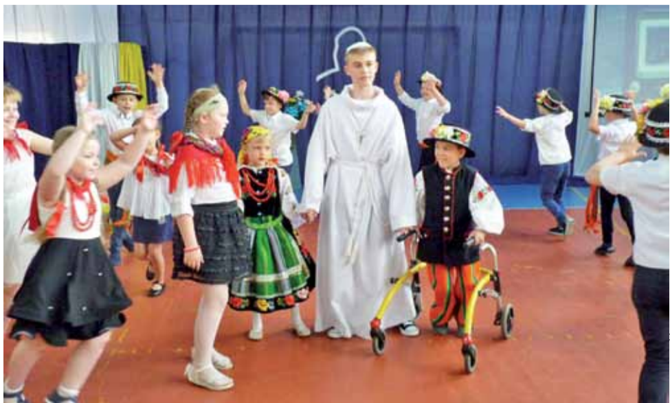
Nie zabrakło ludowego akcentu. W części artystycznej uroczystości uczniowie ubrani w stroje ludowe wzięli do tańca w kółeczku Jana Pawła II.