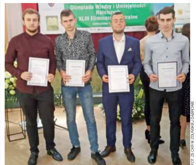
W tym roku szkoła w Zduńskiej Dąbrowie dochowała się 4 finalistów Olimpiady Wiedzy i Umiejętności Rolniczych.