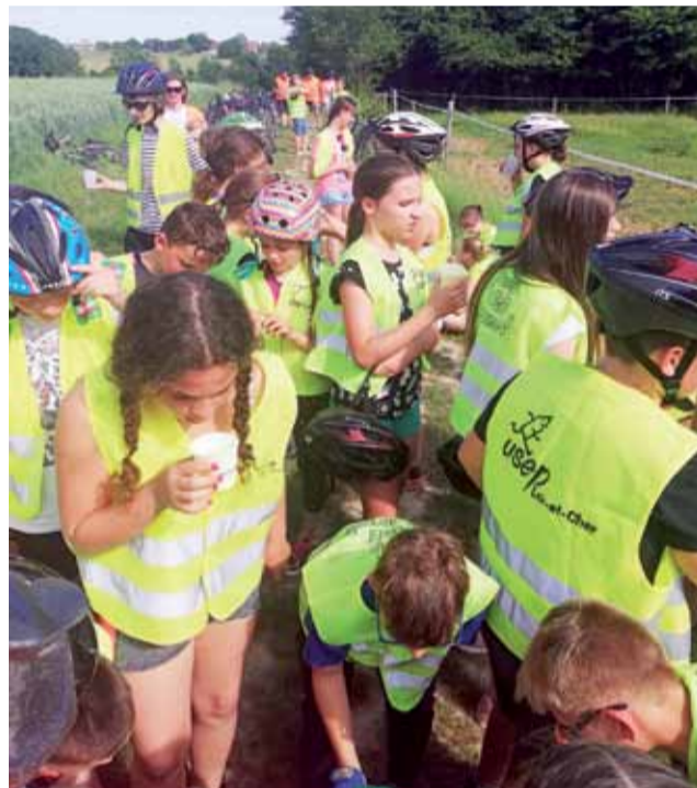
Na przystankach największym powodzeniem cieszyło się coś do picia.

Co do tego, że wyjazd, który połączył w sobie elementy edukacji przyrodniczej, historycznej, geograficznej, językowej i