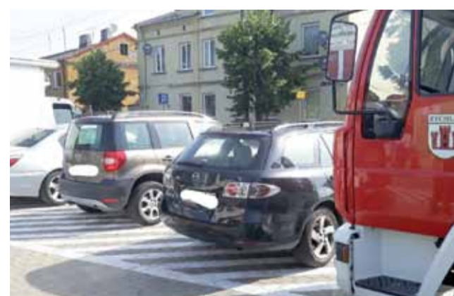
Samochody zaparkowane w sąsiedztwie wyjazdu z garaży z remizy Ochotniczej Straży Pożarnej w Żychlinie.

Kiedyś zdarzyło się, że wyjazd został znacznie opóźniony