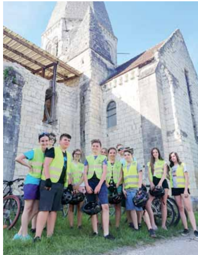
Zabytkowy kościół w trakcie odnowy – jeden z wielu przystanków na trasie.