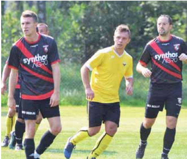
Drużyna GKS Bedno wygrała siódmy mecz z rzędu.

Zawodnicy z Bedna zagraли dobry mecz i zasłużyli zainkasowali komplet punktów. GKS w pierwszej części gry zdominował boiskowe wydarzenia, efektem czego było strzelenie dwóch goli. Gospodarze ograniczyli się do gry z kontry, po których jednak nie zdobywali goli. Po zmianie stron obraz gry w zasadzie nie uległ zmianie, nadal przeważał GKS. Cały czas widoczną była przewaga zespołu z Bedna, który dołożył jeszcze cztery trafienia. Było to siódme zwycięstwo z rzędu drużyny GKS Bedno. mr