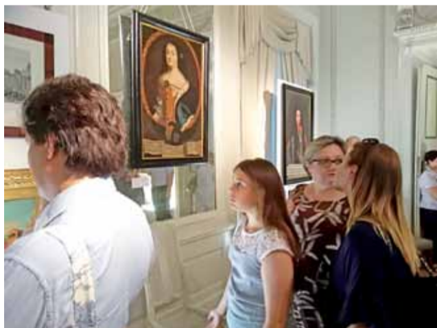
Na wystawie prezentowane są także obrazy przedstawiające Radziwiłłów. Pośrodku zdjęcia widoczny jest obraz Katarzyny z Sobieskich Radziwiłłowej.