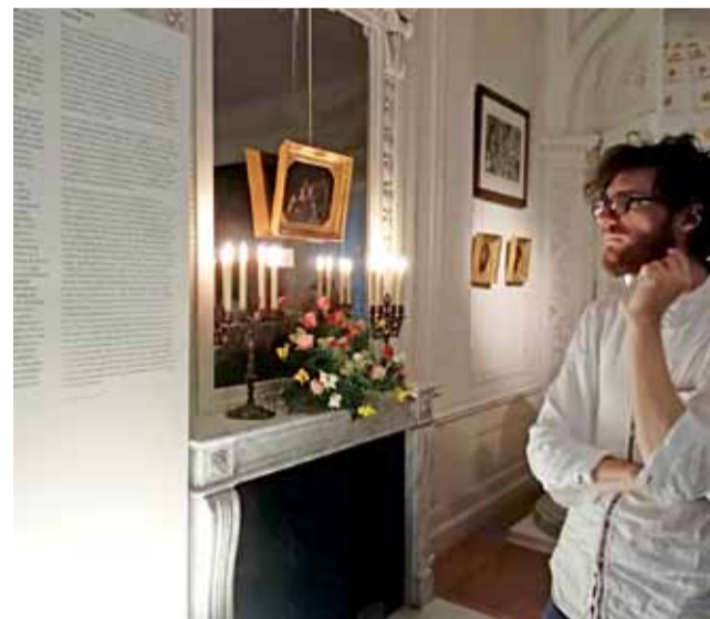
Większość obrazów i pamiątek rodzinnych tworzących wystawę nigdy nie była nigdzie eksponowana.

Obraz, który jest pod opieką Radziwiłłów od dziesięciu pokoleń, pokazywany był dotąd jedynie w 1883 i 1983 roku, podczas dwóch wystaw upamiętniających 200. i 300. rocznicę zwycięstwa pod Wiedniem. Obie te wystawy