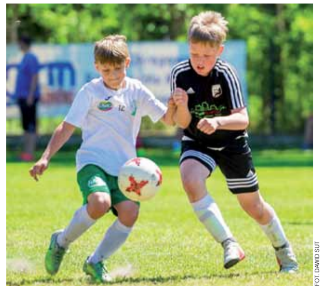
Walki w turnieju Widok Cup nie brakowało.