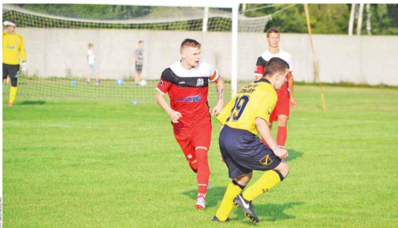
Drużyna GKS Bedlno rozpocznie ligowe zmagania od meczu ze Startem Żłaków Borowy.