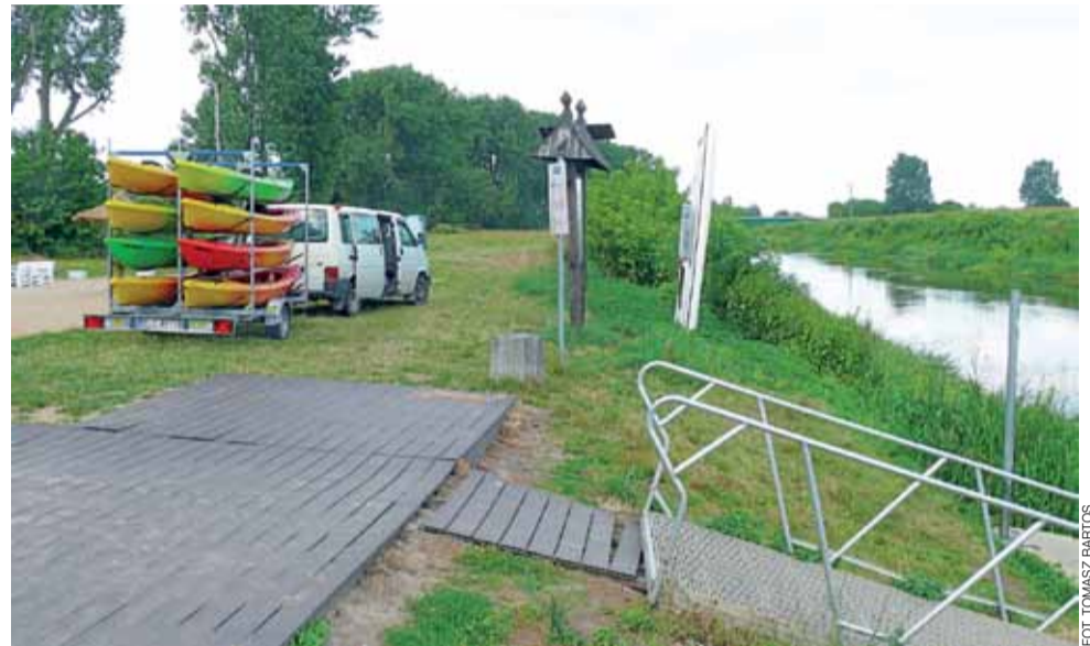
Co dziennie do końca wakacji, gdy tylko będzie słonecznie przy przystani kajakowej w łowickim parku Błonie będzie można wypożyczyć nieodpłatnie kajak.

Są jednak ograniczenia - pływać będzie można jedynie na odcinku Bzury pomiędzy mostami na ul. Zamkowej (DK14) i na ul. Mostowej. Nie będzie można spłynąć np. do Kompiny, rodzi