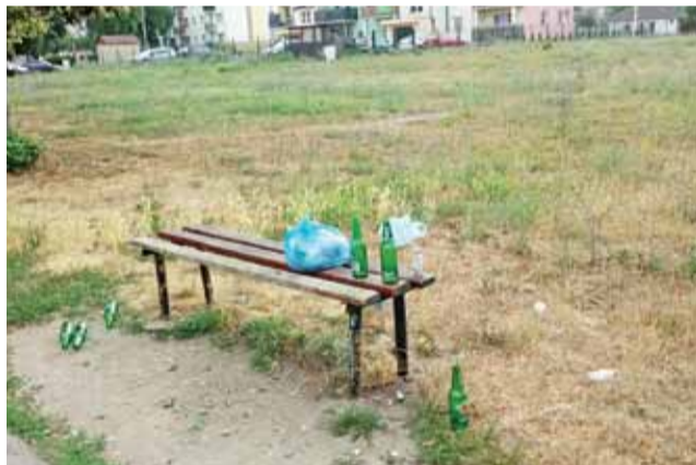
Ławki na osiedlu Łąkowa to ulubione miejsce spotkań i alkoholowych libacji młodzieży. Nasz Czytelnik sfotografował pozostałości po zakrapianej imprezie.

służby wejdą pod koniec listopada lub na początku grudnia. Wakacji nie ma. Teraz jeden funkcjonariusz przebywa na zwolnieniu lekarskim.