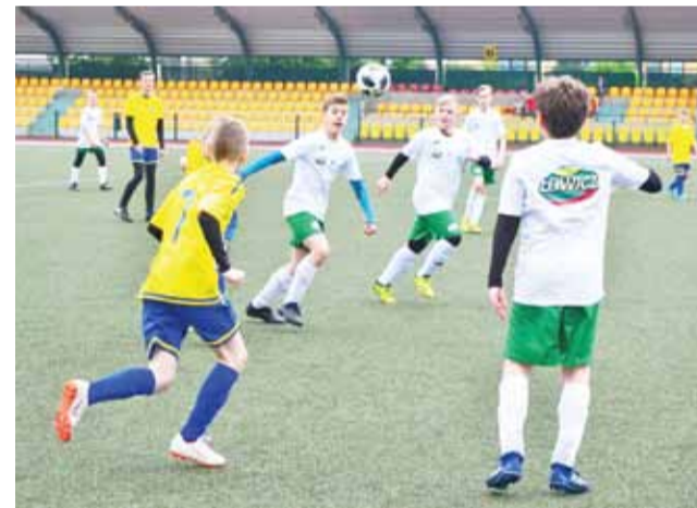
Pelikan 2006 II podczas meczu z Unią Skierniewice.