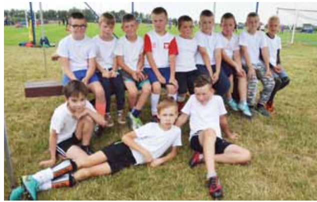
Grupa I: Najmłodsza pod względem wieku uczestników była na tym turnieju drużyna Dragon z Osieka.