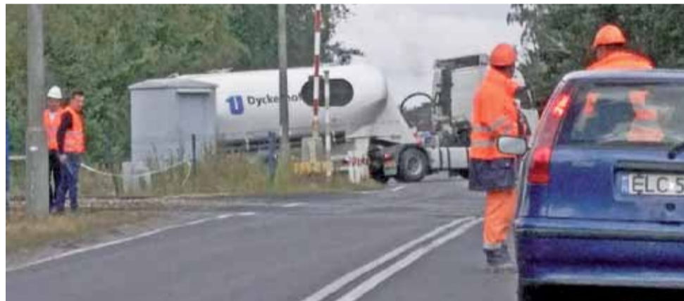
Podczas wyjazdów ciężarówek i ciężkiego sprzętu z placu budowy przy torach ruchem kierują przedstawiciele wykonawcy robót.

Jak nas zapewniono na miejscu, utrudnienia mają charakter tymczasowy, nie powinny jednak trwać dłużej niż kilka minut, ale mogą powtarzać się nawet kilkanaście razy w ciągu dnia. Mimo, że zarówno dla pracujących tam osób, jak i dla kierowców jadących „siedemdziesiątką” nie jest to komfortowa sytuacja, według Generalnej Dyrekcji Dróg Krajowych i Autostrad nie było potrzeby wyznaczenia objazdów.