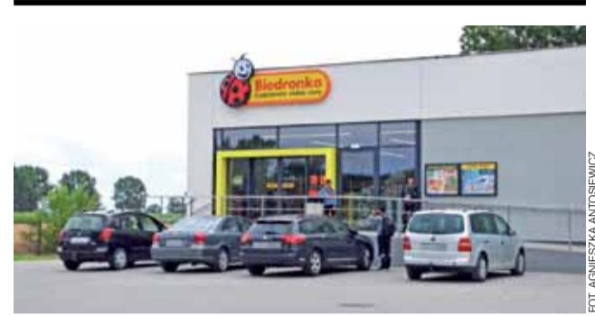
Nowy sklep sieci Biedronka działa w Kocierzewie Płd.

SKR w Zdunach zaproponowała cenę 228 zł/godzinę – i była to najwyższa cena. Spółka „Klys” Roboty drogowe z Łagiewnik Nowych, wyceniła koszt usługi na 123 zł, a Bud-Raf z Reczyc w gminie Domaniewice – na 105 zł. mwk