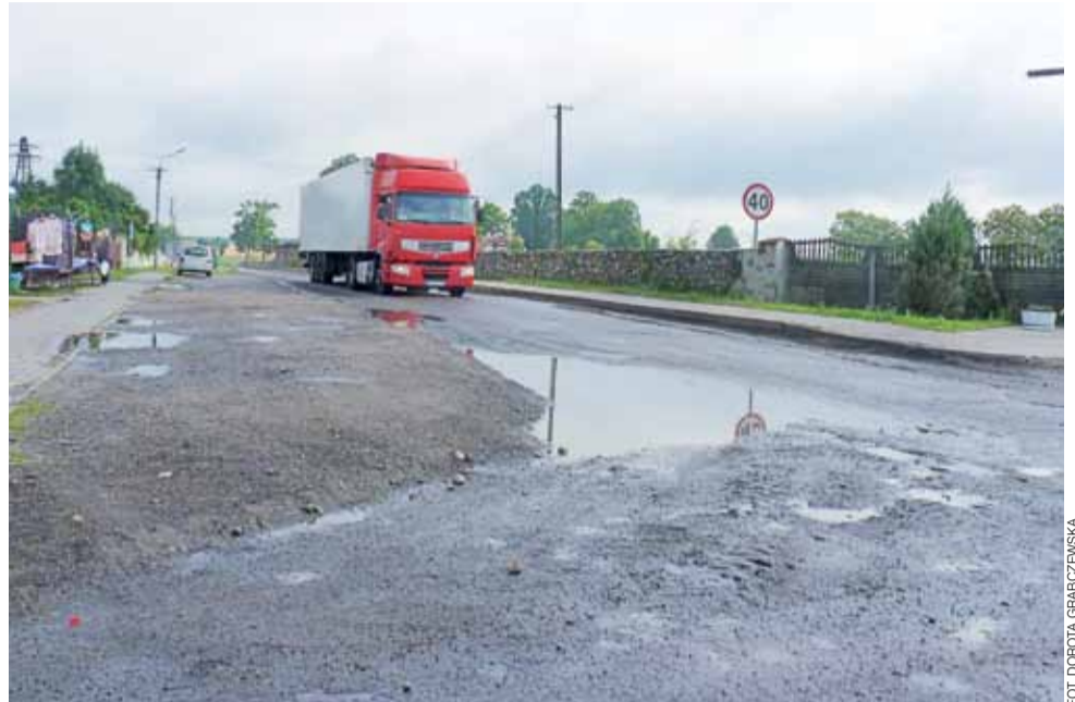
2,5 km odcinek drogi powiatowej przez Trębki do granicy z woj. łódzkim zostanie zmodernizowany. Dojazd do A2 zostanie poszerzony do 6 m. Wykonawca już sfrezował istniejący asfalt.

Wykonawca PRD już sfrezował istniejącą warstwę asfaltu. Firma rozbierze też fragmenty istniejącego chodnika, bowiem droga zostanie poszerzona z obecnych 4 m do