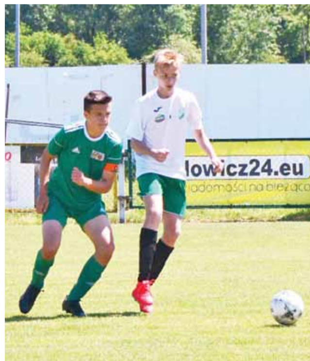
Pelikan 2004 spotkanie z Wartą Sieradz rozegrał na głównym boisku Stadionu Miejskiego