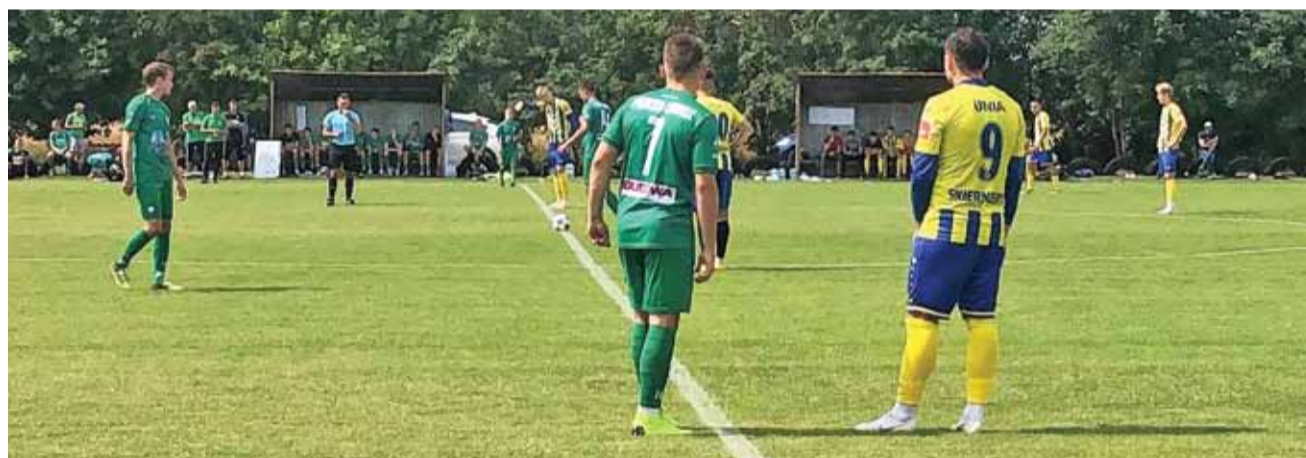
Wysoka wygrana z rywalem zza miedzy, ale też z jedną z rewelacji poprzedniego sezonu musiała ucieszyć kibiców Pelikana.