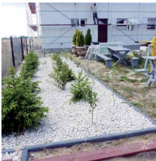
Urząd zakupił kamień i obrzeża. Nasadzenia na skalniakach wykonali mieszkańcy Czesławowa.

W ubiegłym roku zmodernizowano wnętrze świetlicy. Zrobiono kuchnię i sanitariaty.