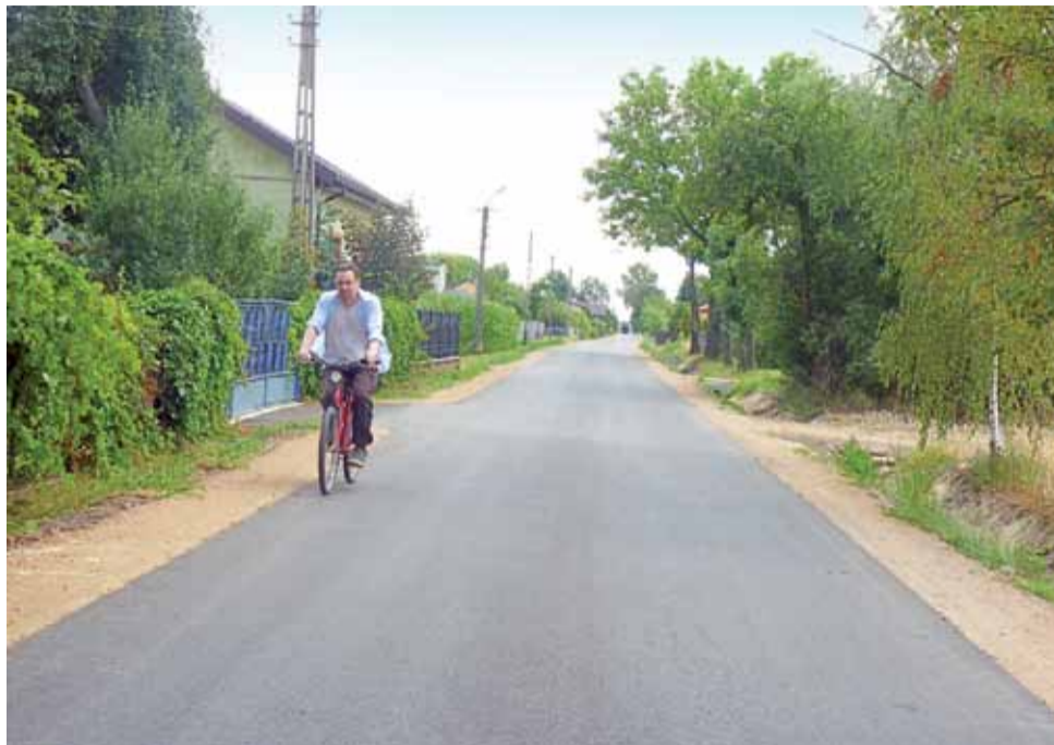
Po wielu latach mieszkańcy Czesławowa mają nową, równą drogę.

To droga inwestycja, ale mieszkańcy Czesławowa są bardzo zadowoleni. Po ostatniej zimie asfaltowa droga przez wieś w kilku miejscach była w fatalnym stanie. Za wsią droga była gruntowa, choć tamteży jeździł autobus szkolny. Teraz droga na całym odcinku jest asfaltowa. Została też poszerzona z 3 do 4 m. Na odcinku przez wieś