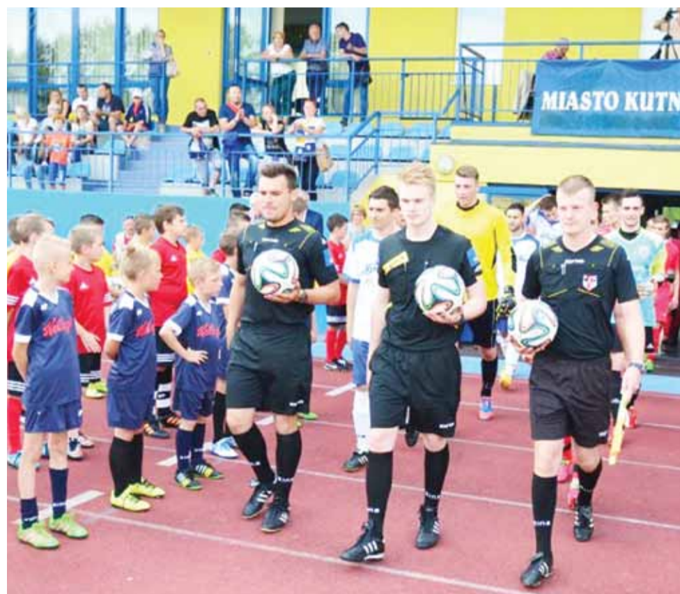
Piłkarze KS Sand Bus Kutno w ramach przygotowań do nowego sezonu 2019/2020 łódzkiej IV ligi rozegrają jeszcze sześć meczów sparingowych.