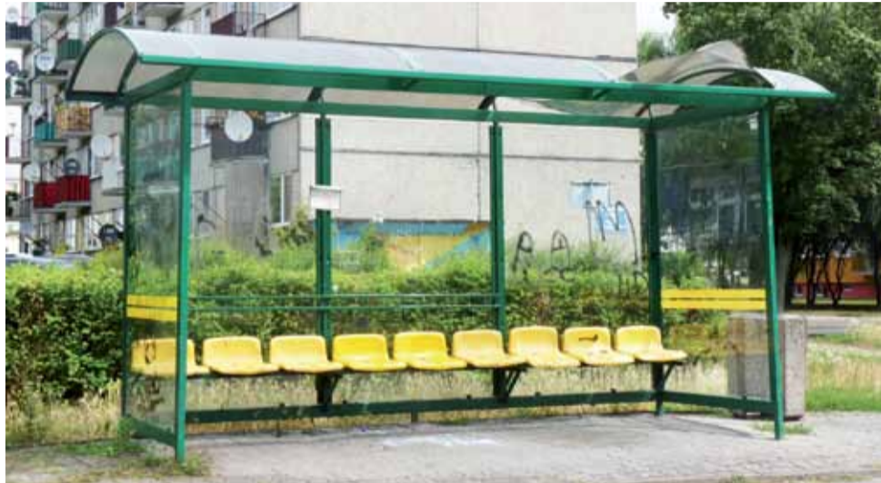
Tuż po dyskusji z komendantem policji na temat bezpieczeństwa chuligani zdemastrowali przystanek przy ul. Łąkowej. Czy nowe kamery pomogą w identyfikacji sprawców?

Na spotkanie z komendantem przybyło 10 radnych. Nadkomisarz Rafał Towalski informował radnych, że w KP w Żychlinie jest 24 funkcjonariuszy, z czego dwie osoby są na szkółce policyjnej i do