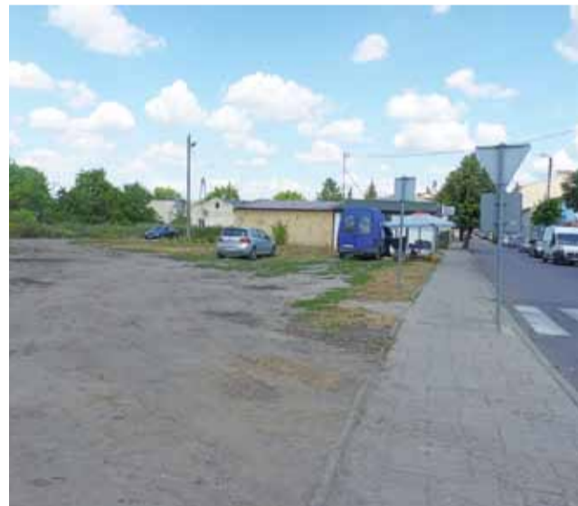
Nowa propozycja lokalizacji komisariatu policji w Żychlinie to plac przed mostem na Studwi.

na do Żychlina będzie bezpieczniejsze. Teraz na skrzyżowaniu wprawdzie jest znak STOP, ale widoczność jest bardzo zła. Trzy lata temu doszło tutaj do wypadku samochodowego, w którym zginęła kobieta. Po modernizacji centrum Trębek, aż do kościoła całkowicie zmieni swój wygląd. Kierowcy jadący od strony Gąbina będą mieli łatwiejszy dojazd do węzła wjazdowego na autostradę A2. dag