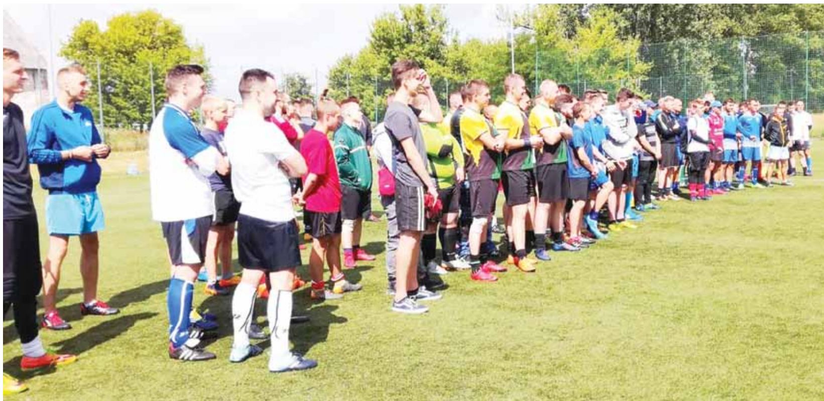
Podczas Turnieju Piłki Nożnej o Puchar Wójta Gminy Kutno rywalizowało 14 zespołów, wśród nich również piłkarze Olimpii Oporów.

Piłka nożna | Turniej Piłki Nożnej o Puchar Wójta Gminy Kutno