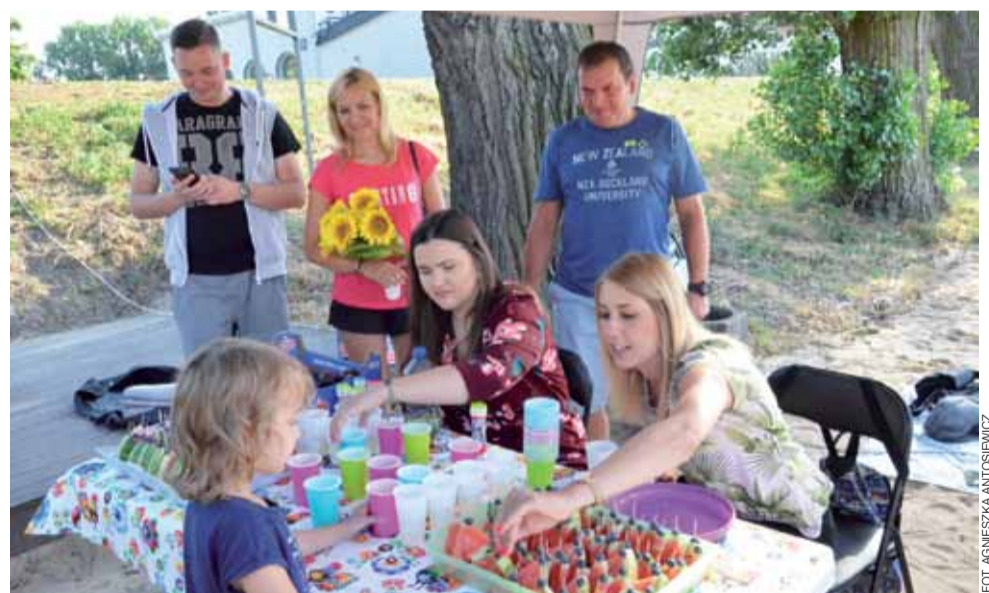
Na plaży został ustawiony namiot, przy którym członkowie stowarzyszenia Łączy nas Łowicz lemoniadą i owocowymi szaszłykami.

Pośród pierwszych użytkowników mebli z palet dominowały grupy znajomych i rodziny z dziećmi. - Bardzo fajny pomysł. Można przyjść z dzieckiem i po-