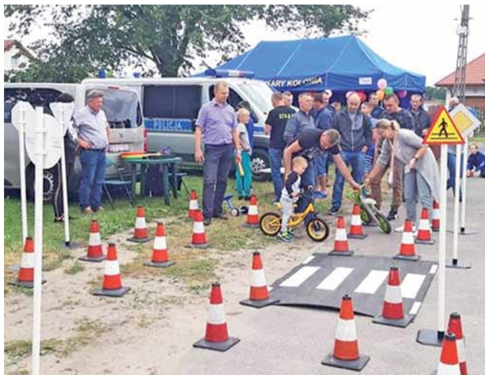
Jedną z atrakcji pikniku w Bednarach było miasteczko ruchu drogowego, które przywieźli na miejsce pracownicy skierniewickiego WORD.

Oprócz tego miał miejsce pokaz zumbi, w którym wzięło udział kilkadziesiąt dzieci, zaśpiewali także młodzi