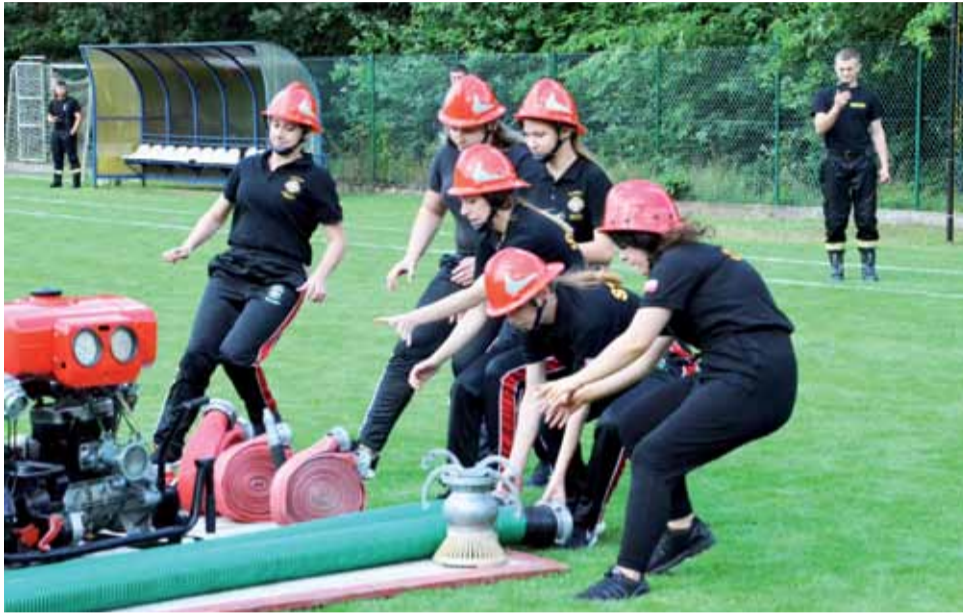
Drużny z OSP Nieborów podczas wykonywania ćwiczenia bojowego.

Najliczniej, jak co roku, była obsadzona grupa „A”, czyli zmagania sztafet męskich, w której wystartowało 14 drużyn. Najlepsi