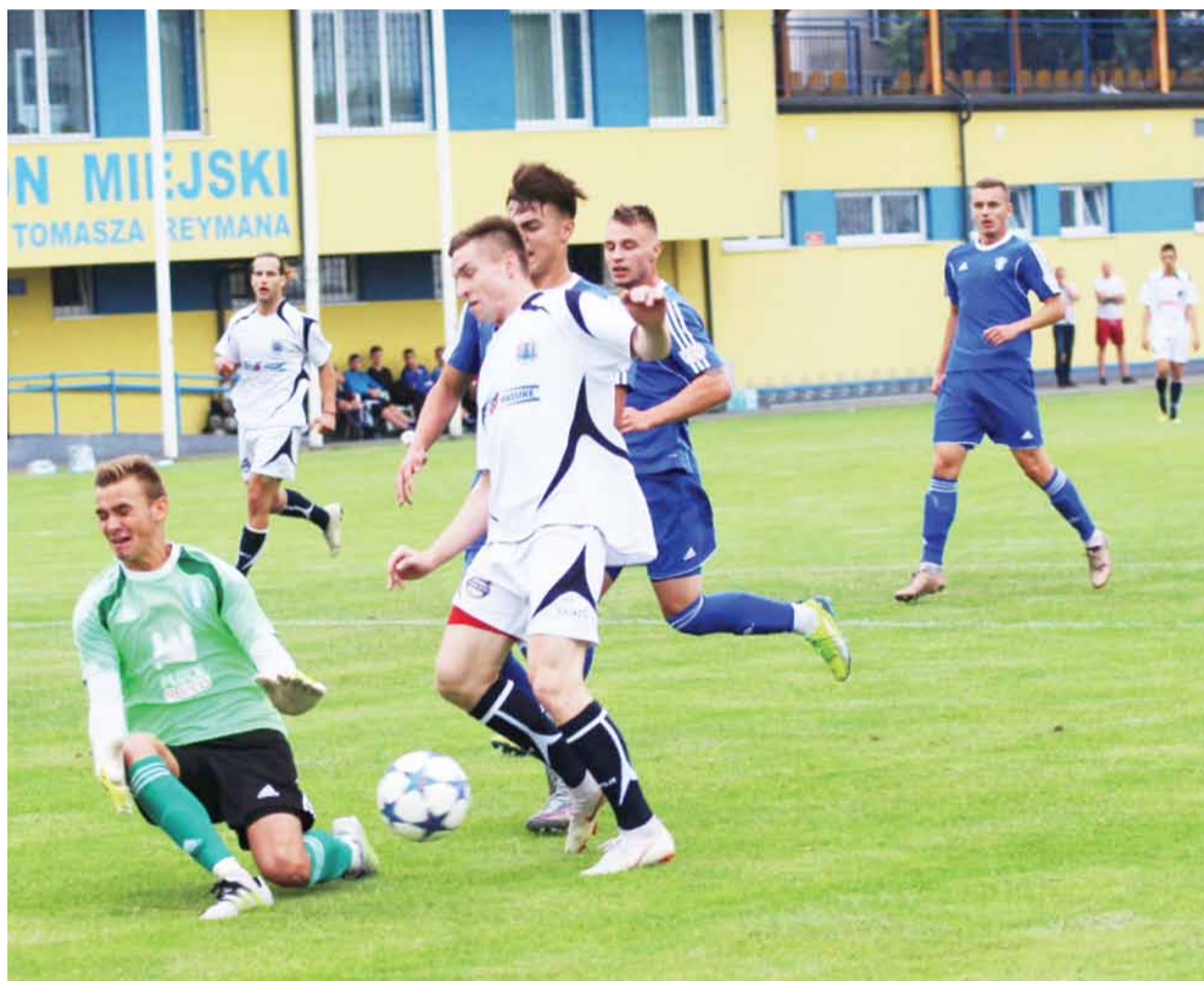
Pierwszy sparing piłkarzy KS Kutno odbył się w sobotę. Kutnowska drużyna zagrała na własnym boisku przeciwko Wiśle II Płock, wysoko z nimi wygrywając 7:1.

Bramki dla KS Sand Bus Kutno strzelili: Kralkowski (3), Wielgus (2) i dwóch zawodników testowanych.