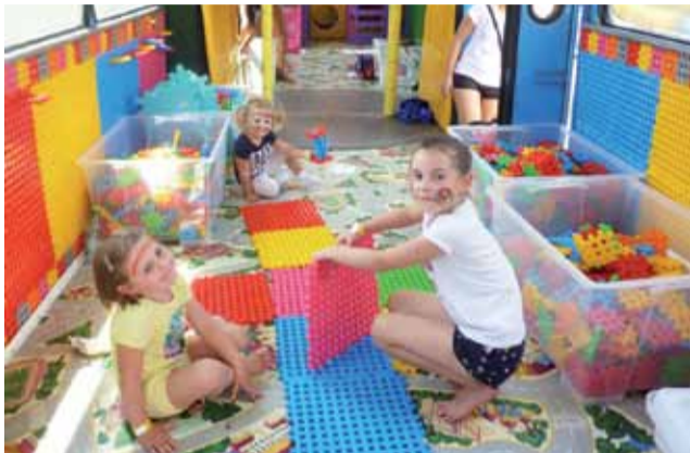
Mniejsze dzieci z Żychlina chętnie korzystały z układania klocków wewnątrz nietypowego busa.

Tematem przewodnim tegorocznej akcji Happy Bus 2019 jest hasło „Dzieci mają głos”. Podczas przystanków zachęcaliśmy dzieci, by zabrały głos w kilku obszarach