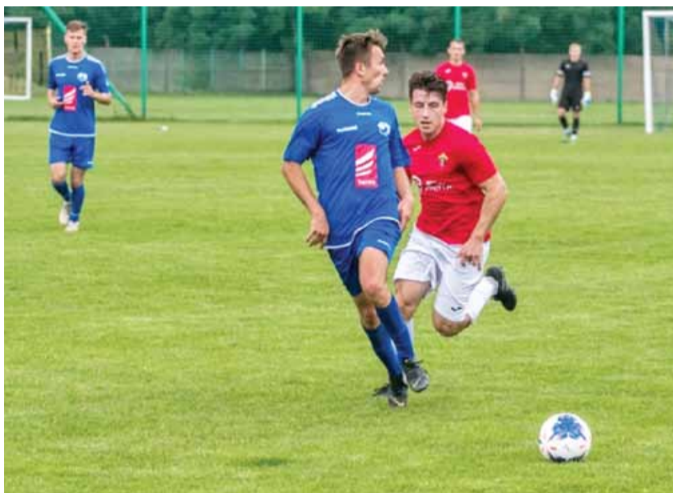
Środowy, wyjazdowy sparing KS Kutno kontra Górnik Konin zakończył się wygraną drużyny z Konina.

Pierwsza połowa piątkowego spotkania miała dość wyrównany przebieg. Jako pierwsza na prowadzenie wyszła drużyna z Wiśniowej Góry, umieszczając piłkę w siatce kutnowskiego bramkarza w 35. minucie gry. Na odpowiedź