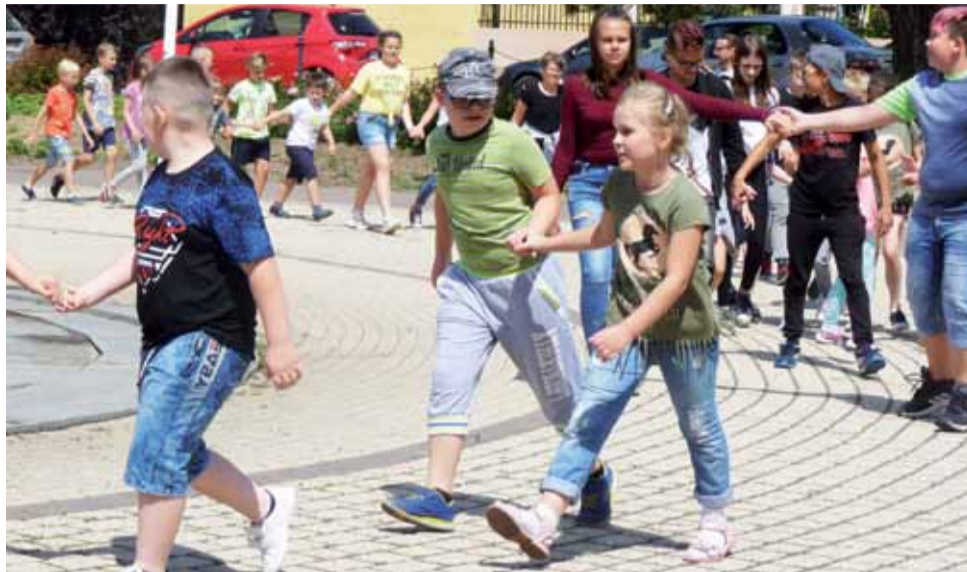
W piątek 12 lipca półkoloniści z ŻDK zatańczyli „belgijkę” na placu koło fontanny.

Dzięki Agencji Impresyjnej Klaps-Art z Krakowa do półkolo-