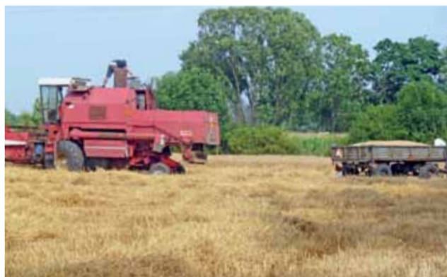
Tam, gdzie komisje już oszacowały straty, rolnicy mogli rozpocząć żniwa.

Zarówno władze gmin jak i rolnicy zgodnie przyznają, że uznawanie terenów objętych suszą na podstawie wskazań Instytutu Upraw i Nawożenia i Gleboznawstwa w Puławach nie odzwierciedla stanu faktycznego, bowiem deszcze padają punktowo. Ogromne różnice są nawet na terenie jednej gminy. W okoli-