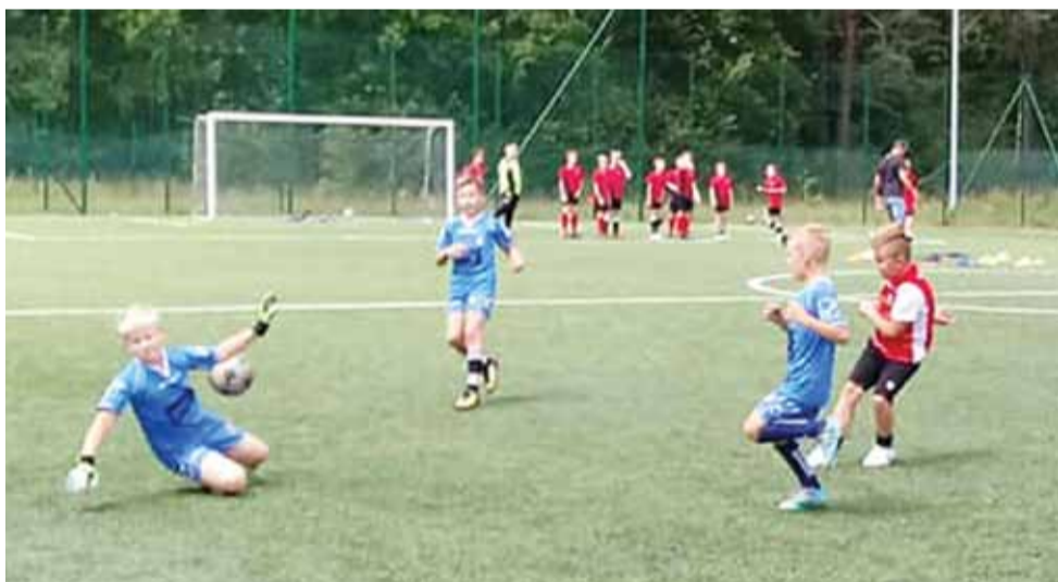
Przed dotarciem do Warszawy grupy GKS Bedno zagrały spotkania sparingowe na boisku w Nieborowie.

Runda Wstępna Pucharu Polski na szczeblu okręgu łódzkiego: Saints Łódź – KS II Kutno, Sokół Lutomiersk – KAS Konstantynów, Błękitni Dmosin – Włókniarz Zgierz, Czarni Smardzew – Start Brzeziny, Orzeł Piątkowsko – PTC Pabianice, LKS Sokół Popów – LZS Justynów, KP Bysze – LKS Gałkówek, Orzeł Kazimierz – Sokół II Aleksandrów, KKS II Kozuski – AMII Łódź, Tex Auto Łódź – Victoria Rąbień, KS Grom Powodów – Orzeł Parzęczew, Victoria Grabów – Ostrovia Ostrowy, LKS Magnat Sierpów – LKS Rosanów, GKP Husaria Gealan Rzgów – MUKS Włókniarz Pabianice, ŁKS III Łódź – AKS SMS Łódź, Włókniarz Konstantynów – Viking Łódź, Huragan Swędów – Różycza, Powstaniec Dobra – KKS Kozuski, Victoria Łódź – GLKS Dłutów.