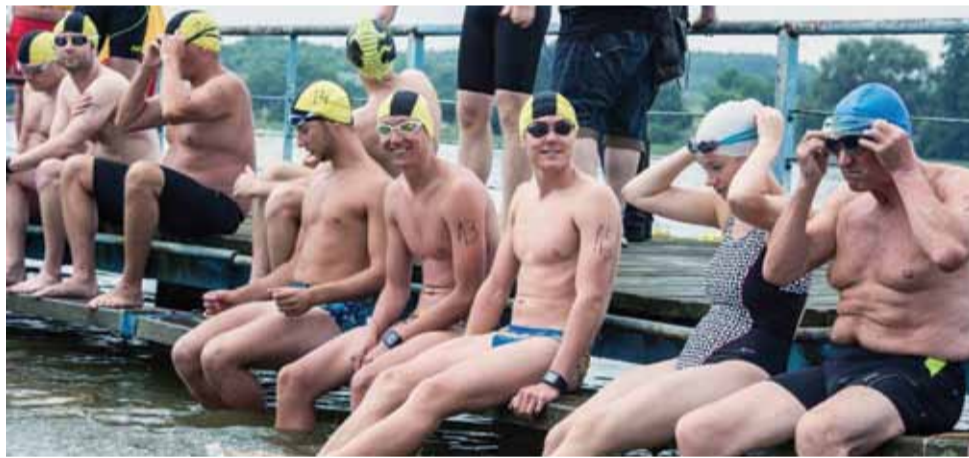
25 osób popłynęło w Maratonie im. Pawła Pioruna w Rawie Mazowieckiej.