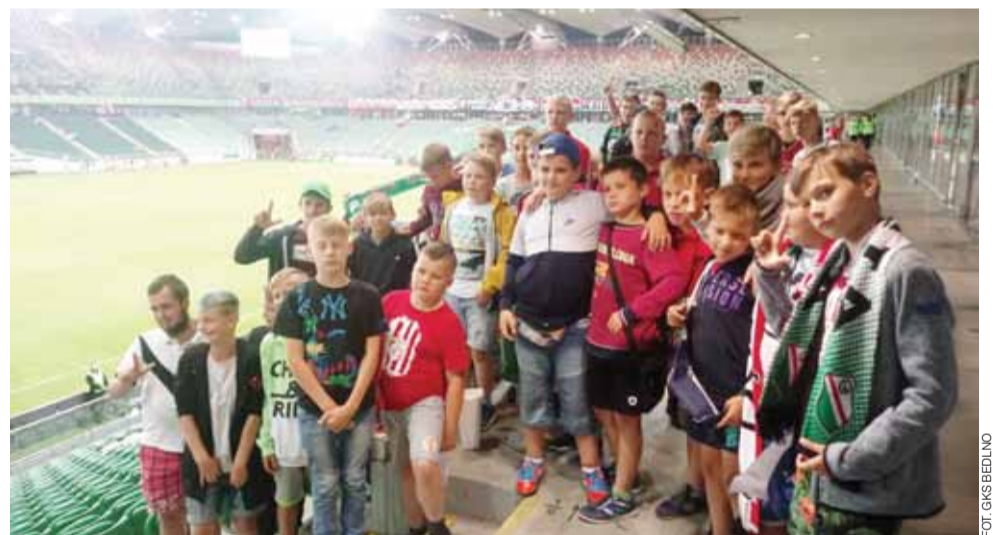
Jednym z punktów wycieczki było kibicowanie podczas meczu Legii Warszawa kontra FC Europa.

Piłka nożna | Gminny Klub Sportowy Bedno