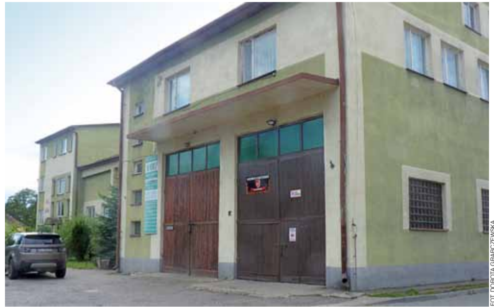
OSP Bedlno dostanie 19.000 zł z MSWiA na wymianę drzwi garażowych strażnicy.

Biesiadę zakończy wspólna zabawa taneczna. Nie będzie zespołu, ale będzie muzyka mechaniczna. Impreza ma się zakończyć o godz. 22.00. dag