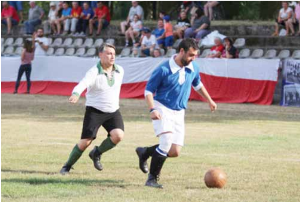
Mecz retro na Stadionie „Kutnowianki” rozegrany pomiędzy grupami rekonstrukcji historycznych drużynami WKS 37 PP Kutno i WKS 10 PP Łowicz. Spotkanie wygrała drużyna z Łowicza wynikiem 4:1.

Miejscem rozegrania tego meczu był Stadion Miejski „Kutnowianka” przy ulicy Oziębłowskiego w Kutnie. Stadion ten posiada bogatą historię, na nim mecze rozgrywała przed laty drużyna WKS Boruta. Wydarzenie realizowane jest w ramach projektu „Sportowe Kutno w okresie 20-lecia Międzywojennego – hi-