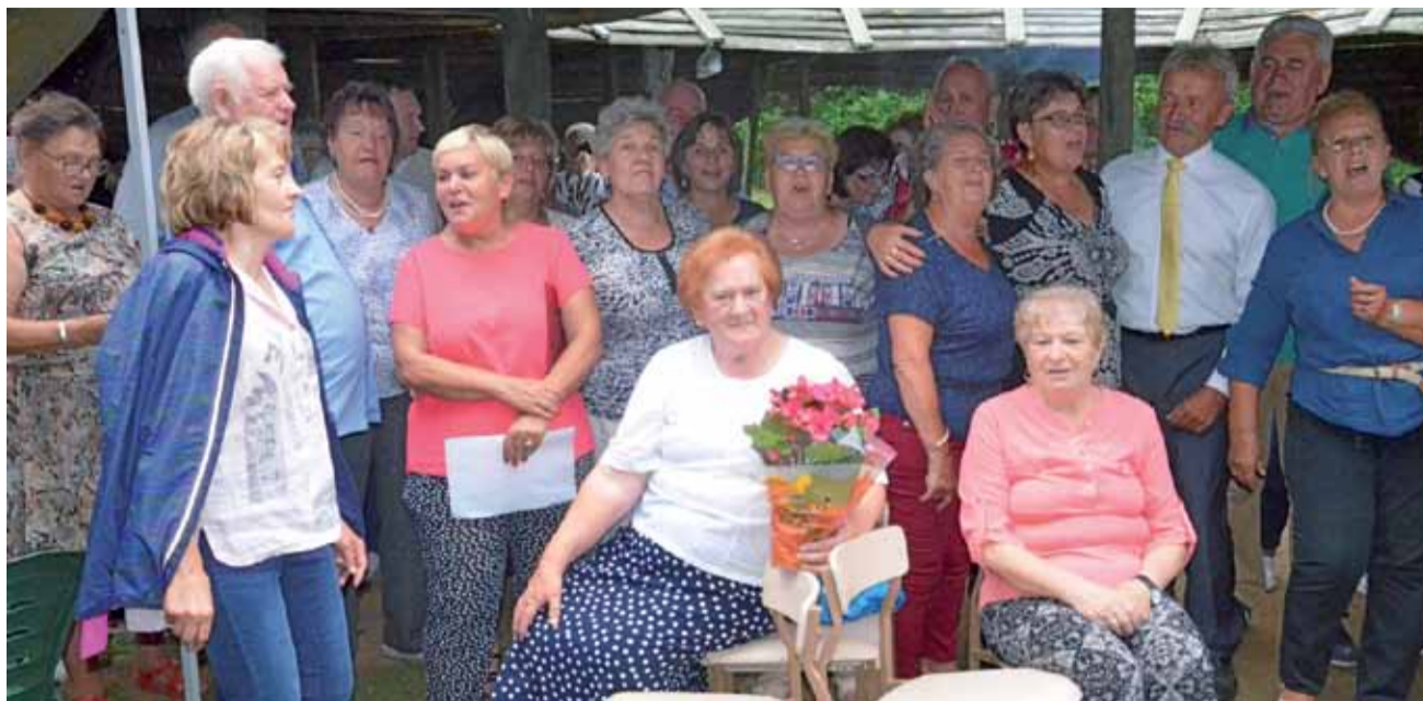
Piknik integracyjny na polanie w lasu miejskim, w którym uczestniczyło ponad sto osób, trwał od godz. 15 do 21.

Zmarł 19 grudnia 2018 r., w wieku 69 lat. Spoczywa w grobie rodzinnym na cmentarzu Emaus. aa