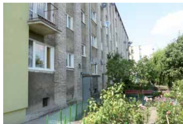
Gmina Żychlin chce wraz ze ZGRK poddać termomodernizacji budynek komunalny przy ul. Dąbrowskiego 6.

Jak mówi nam Jakub Świtkiewicz, wartość zaplanowanych prac to ok. 7,5 mln zł, zaś ZGRK liczy na dotację w wysokości ok.