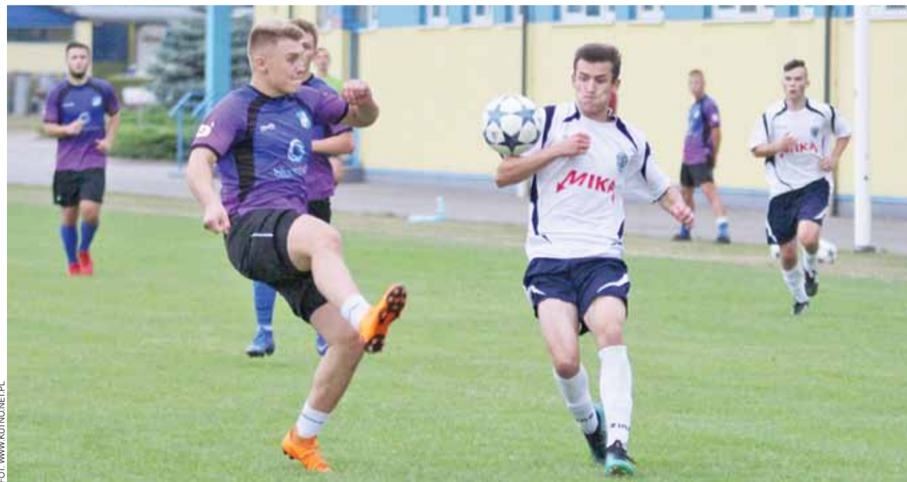
Drużyna KS Kutno w piątek zagrała u siebie przeciwko Andrespolii Wiśniowa Góra. Sparing przygotowujący do ligowych rozgrywek nowego sezonu wysoko wygrali gospodarze 5:1.