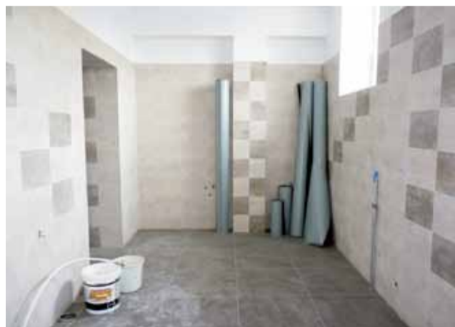
Sanitariaty we wschodnim skrzydle ZS nr 1 są już gotowe. Teraz czekają na biały montaż.

Jacek Dysierowicz, dyrektor Szkoły Podstawowej nr 1 w Żychlinie, mówi, że najnowsze meble (kolorowe stoliki, krzesła i szafka) już przewieziono do remontowanego budynku. Reszta będzie przewożona później, gdyż na razie nie ma ich gdzie stawiać. ■