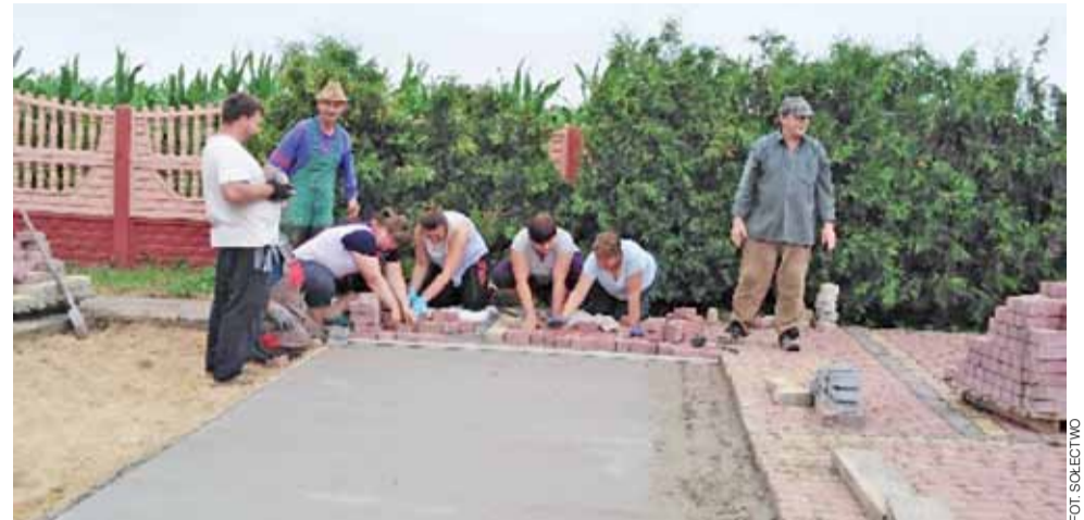
Mieszkańcy sołectwa Świechów sami układali kostkę brukową przed świetlicą wiejską.