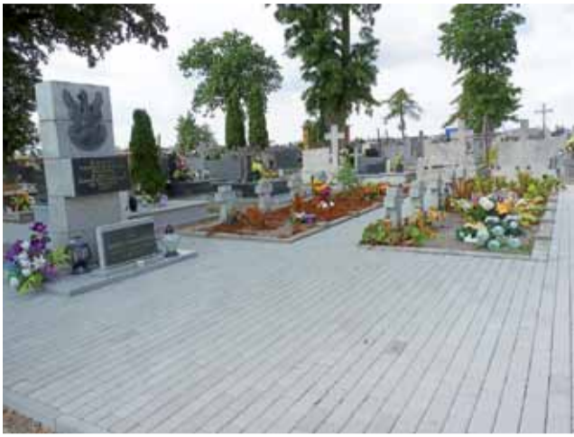
Przy okazji robienia cmentarnych alejek wyłożono kostką brukową plac przy żołnierskich grobach.

Plecka Dąbrowa | Trwa układanie alejek na cmentarzu