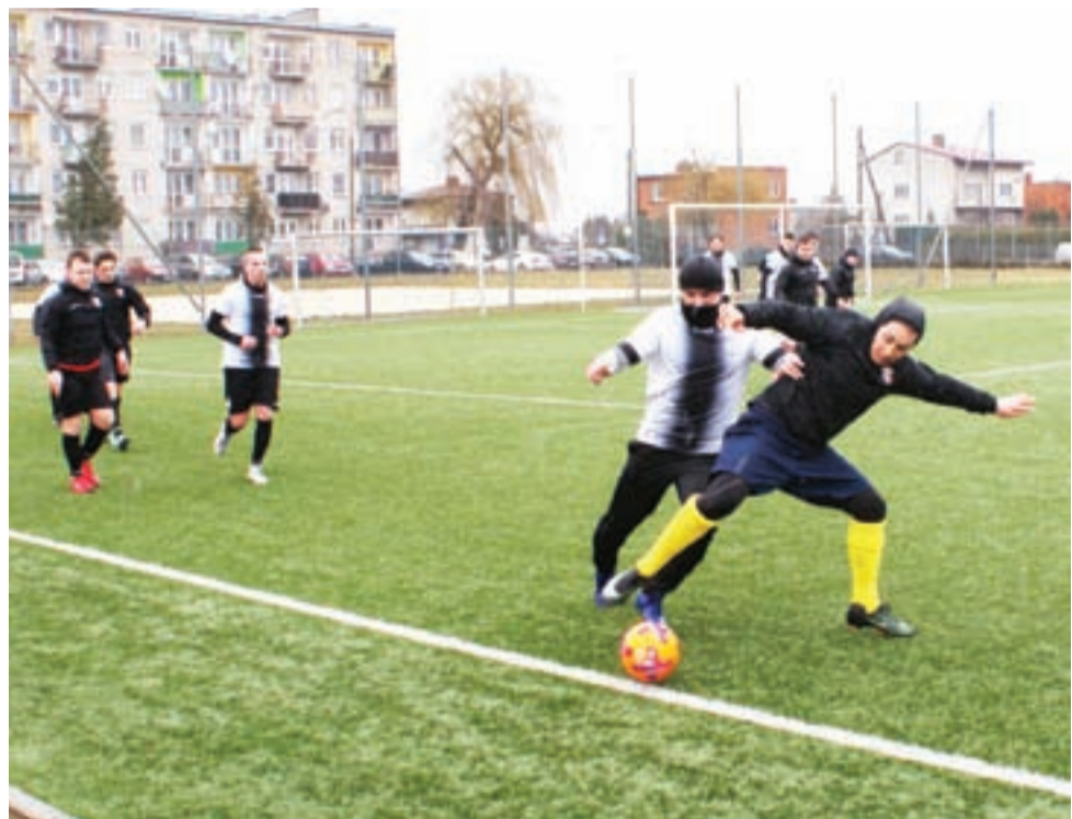
KS Żychlin (biało-czarno-białe koszulki) rozpocznie rozgrywki w łódzkiej klasie A w ostatnim tygodniu sierpnia.

Drużyny sparingowe KS Żychlin: ■ 3 sierpnia 2019 (sobota): Olimpia Niedźwiada ■ 10 sierpnia 2019 (sobota): Szopen Sanniki ■ 17 sierpnia 2019 (sobota): Górnik Łęczycza