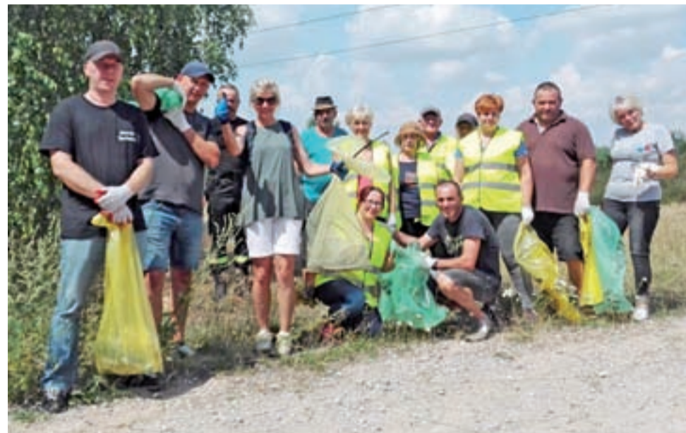
– Czas wziąć sprawy w swoje ręce – mówią mieszkańcy Polesia w kwestii zaśmiecenia lasów.