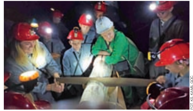
W kopalni soli w Wieliczce młodzież wzięła udział w zajęciach edukacyjnych „Młody górnik”.