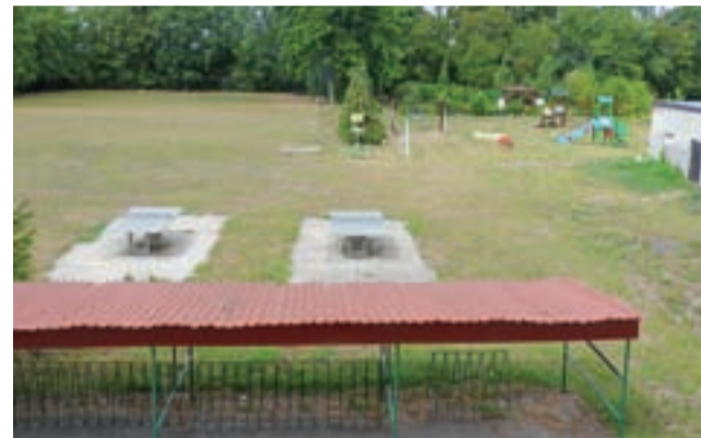
Za dotychczasowymi betonowymi stołami do ping-ponga zostanie utworzona OSA, obok placu zabaw.

Dzięki Radzie Rodziców, która zorganizowała dwie imprezy charytatywne (bal karnawałowy