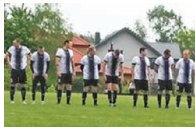
Drużyna z Żychlina przegrała w fazie grupowej dwa mecze, czego konsekwencją był brak awansu do dalszej części turnieju.

■ Lwówianka Lwówek – Start Złaków Borowy 0:1 Tabela grupy A: 1. Start Złaków Borowy 6 pkt. 2. Witonianka Witonia 3 pkt. 3. Lwówianka Lwówek 0 pkt.