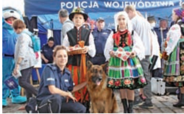
Święto Policji w Warszawie. Na stoisku Komendy Wojewódzkiej Policji w Łodzi promowany był folklor łowicki.

Jedną z części wystawowej namiotu, należącego do Komendy Wojewódzkiej, była prezentacja powiatu łowickiego, m.in. sztuki, kultury i folkloru. Dla najmłodszych przygotowano krótkie konkursy o bezpieczeństwie, a ich uczestników nagradzano drobnymi upominkami. Największą