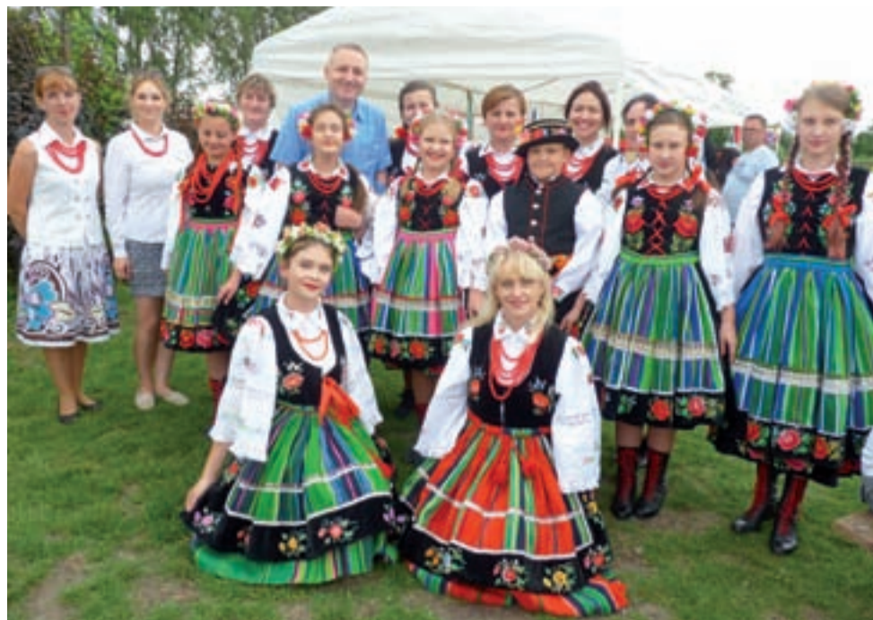
Zafascynowani tradycją ludową tworzą wielką rodzinę. Andrzej Górczyński, wicemarszałek województwa, mówi, że urząd będzie wspierał finansowo takie kulturalne przedsięwzięcia.