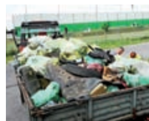
Niestety, ale było co sprzątać. Miejmy nadzieję, że akcje takie jak ta przyniosą trwały skutek.

To już kolejny przykład integrującej społeczność i promującej zdrowy tryb życia imprezy w Polesiu. Mieszkańcy niewielkiej miejscowości w gminie Łyszkowice po raz kolejny udowadniają,