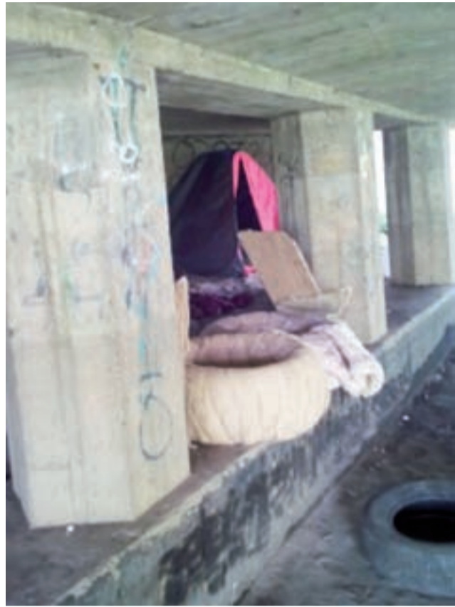
Pod mostowymi filarami rozstawiono namiot, są też jakieś pledy i pufy.