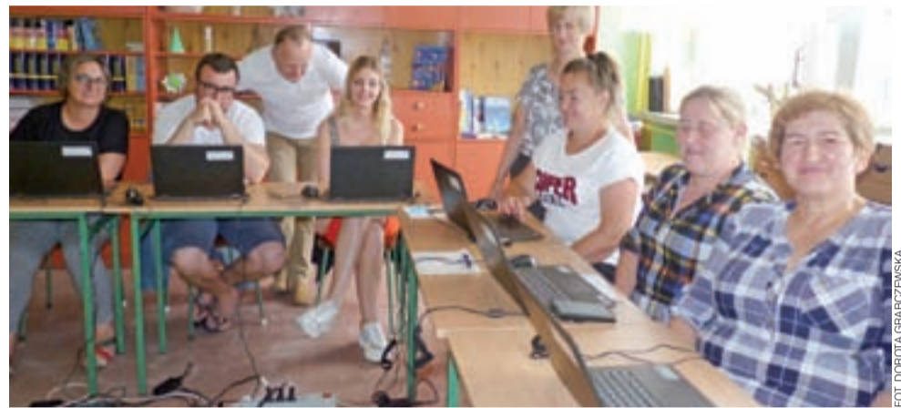
Uczestnicy szkolenia z 27 lipca w Bedlnie poznawali tajniki finansów i transakcji sieci.