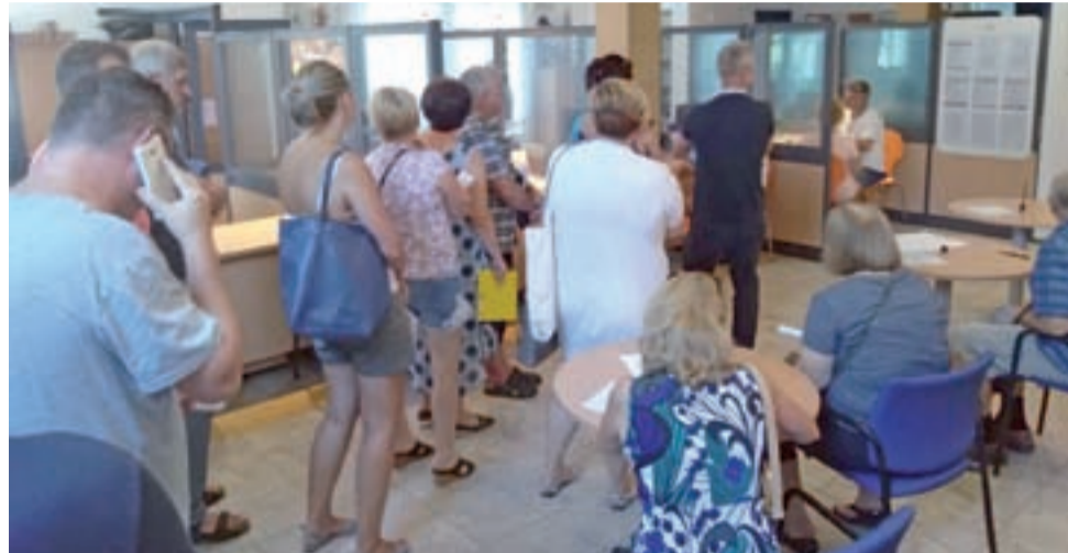
W poniedziałek przed południem przedsiębiorcy wciąż ustawiali się w kolejce do składania oświadczeń, choć była ona już mniejsza niż w piątek i nie wychodziła poza budynek.

Naszemu reporterowi, który odwiedził zakład w czwartek przed południem, mówili, że sprawa jest absurdalna. Pokazali nam,