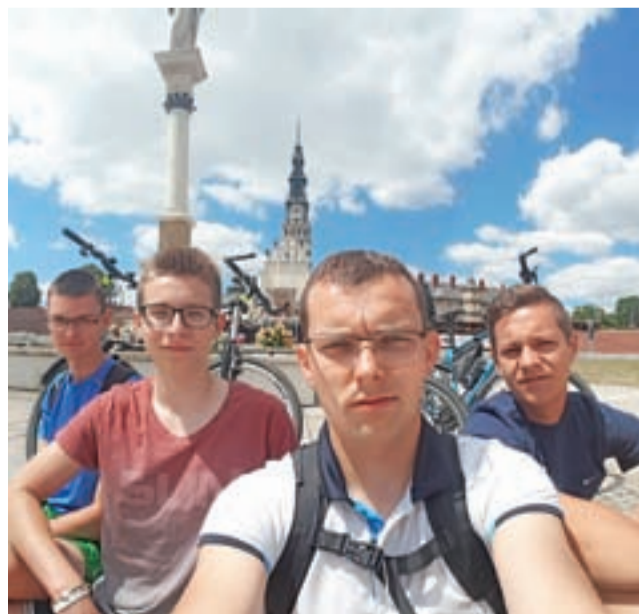
Na rowerową pielgrzymkę do Częstochowy wikariusz zabrał kleryka oraz dwóch lektorów.