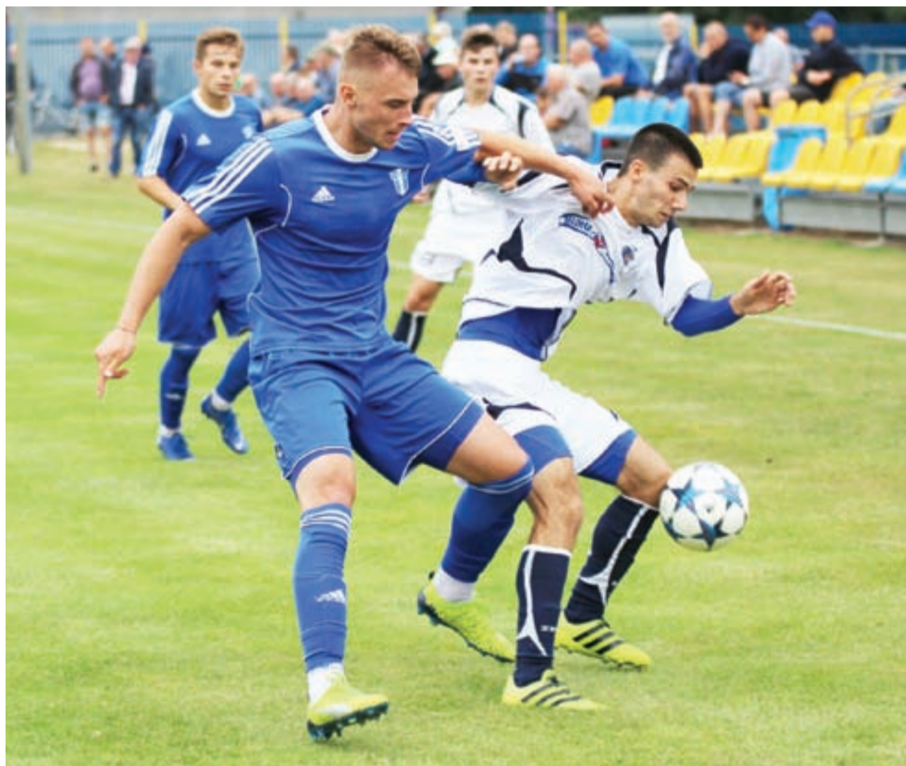
Sobotni sparing piłkarze KS Kutno zagrali u siebie przeciwko drużynie Sokół Aleksandrów Łódzki. Spotkanie zakończyło się przegraną kutnian wynikiem 1:3.

■ KS Kutno – Sokół Aleksandrów Łódzki 1:3 (1:1)