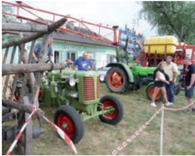
Pasjonaci zabytkowych pojazdów z Bąkowa i okolic przyjechali do Śleszyna, by pokazać swoje oryginalne pojazdy.