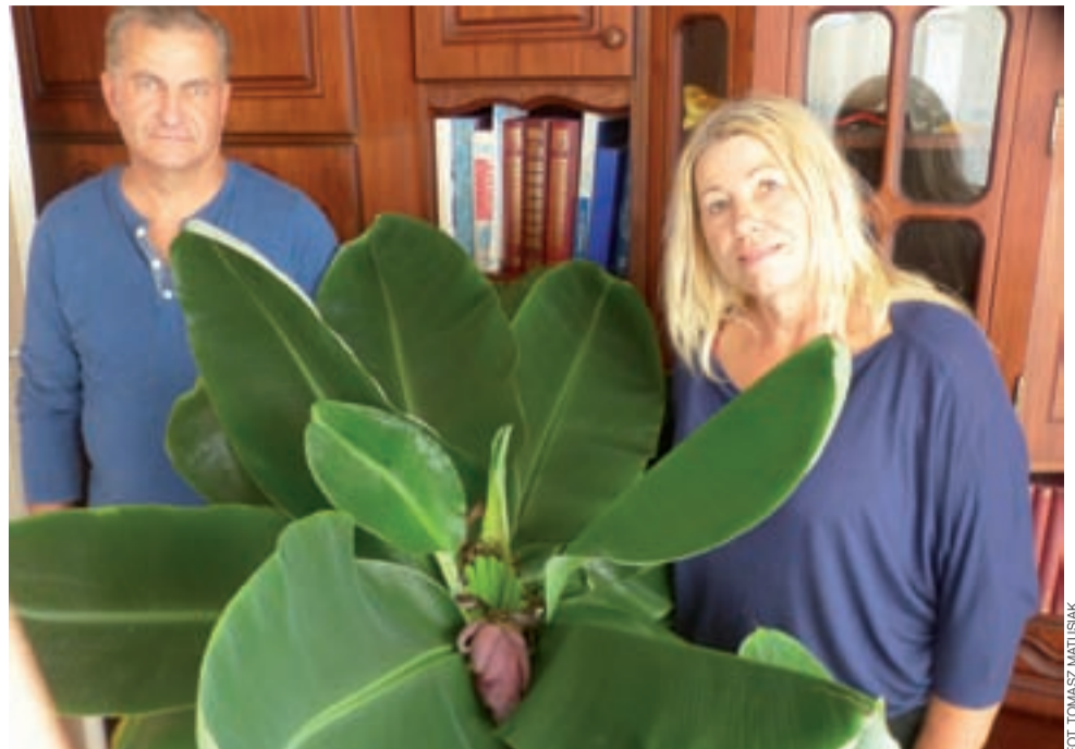
Przyroda po raz kolejny pokazała, że potrafi zaskakiwać – w Bocheniu zakwitł bananowiec.

Trzeba przyznać, że bananowa niespodzianka nie trafiła się ludziom z przypadku, ale prawdziwym pasjonatom ogrodnictwa i przyrody, także egzotycznej. Oprócz licznych roślin i kolorowych kwiatów w domu mają je oni też na podwórku i w ogródku, który wygląda jak małe ar-