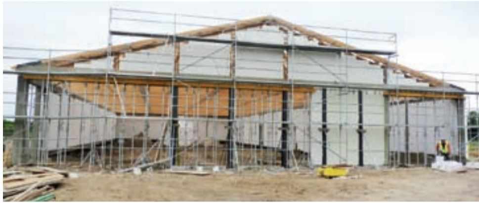
Ściany stoją, dach powstaje – Biedronka koło Dino ma być otwarta w grudniu, przed świętami.

Jednak ta nowo budowana jest zdecydowanie większa. Będzie mieć powierzchnię sklepową 750 mkw. Do tego dochodzą pomieszczenia magazynowe, socjalne, przechowalnie itp. Budynek ma wymiary 44x20 m. Wykonawcą jest żychlińska firma Elvis. Budy-