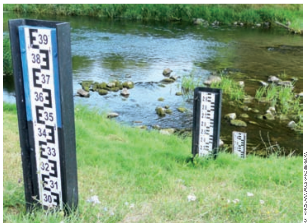
Poziom wody w Bzurze w Łowiczu nie jest jeszcze rekordowo niski, wynosi około 40 cm