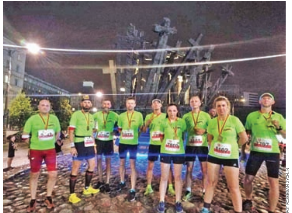
Aby uczcić walczących w Powstaniu Warszawskim, biegacze z Żychlina udali się do Warszawy dziewięcioosobową grupą i przemierzali trasę biegu głównego wynoszącą 10 km oraz trasę biegu na 5 km.

Zawodnicy Grupy „Rozbieganych Żychlin”, którzy do Warszawy udali się dziewięcioosobową ekipą, pokonali 10-kilometrową trasę głównego biegu, a jedna osoba z „Rozbieganych” zmierzyła się z trasą krótszą, na dystansie 5-kilometrów.