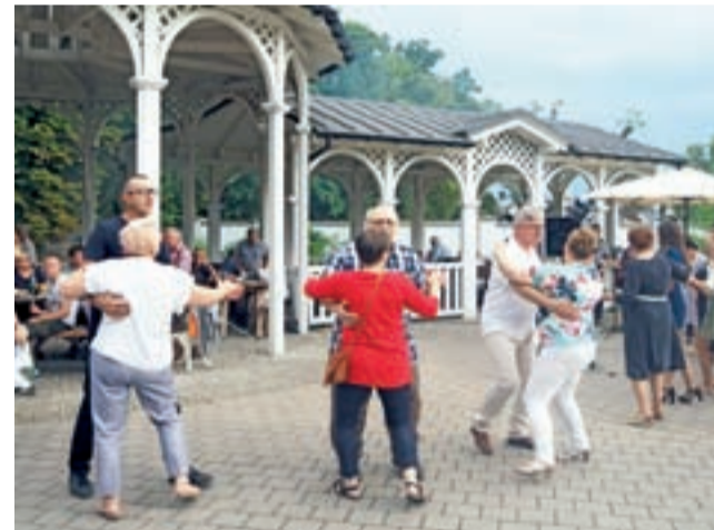
Organizowane w altanie grillowej potańcówki cieszą się coraz większym powodzeniem.