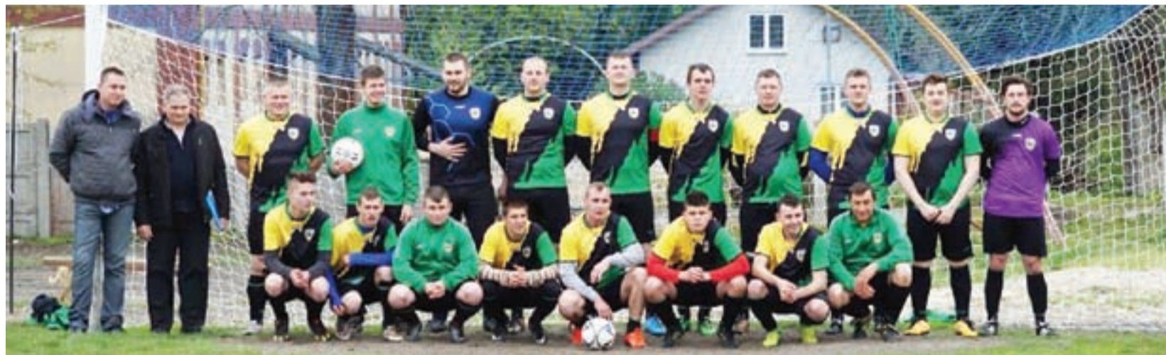
Drużyna LUKS Olimpia Oporów ostatni mecz w minionym sezonie przegrała z mistrzem ligii – Strugą Dobieszków. W nowym sezonie pierwszy mecz rozegra pod koniec sierpnia.

Drużyna z naszego regionu Olimpia Oporów będzie rywalizowała w grupie III, swój pierwszy z mecz rozgrywek łódzkiej klasy B rozegra w dniu 24 sierpnia 2019 przeciwko LKS Gieczno, miejscem spotkania będzie boisko w Giecznie. Mecze pierwszej kolejki ligi łódzkiej klasy B grupy III rozegrane zostaną w weekend 24-25 sierpnia. mr