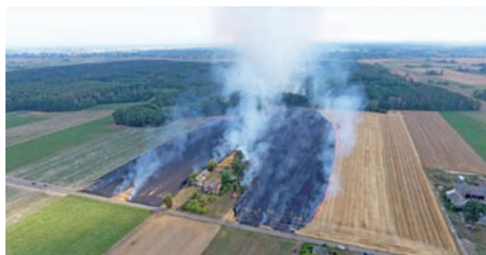
Aż 52 strażaków walczyło w poniedziałek, 29 lipca, z pożarem na 8 ha rżyska w miejscowości Leśniczówka w gminie Bielawy. Zagrożone było sąsiednie gospodarstwo.

W czwartek 25 lipca o godz. 16.35 strażacy zostali wezwani do pożaru słomy w miejscowości Wewiórz, gmina Bedlno. Po-