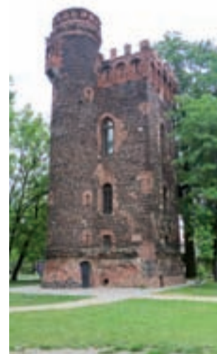
Baszta gen. S. Klickiego była w 2017 roku poddana pierwszym od lat pracom remontowym, wówczas za 144 tys. zł poprawiono stan jej elewacji.