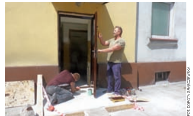
Teraz trwa wymiana drzwi wejściowych na nowe, metalowe, które będą się domykać. Robione są również nowe podesty.

Jak mówi wójt, można się spodziewać, że konkurs zostanie ogłoszony jesienią. Rozpatrzenie wniosków mogłoby nastąpić do końca roku lub na początku roku, a w połowie 2020 roku gmina mogłaby realizować inwestycję. dag