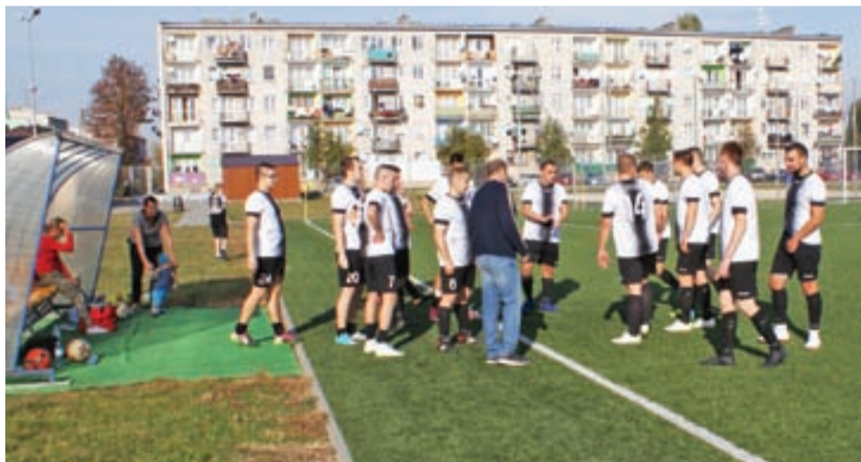
Piłkarze KS Żychlin pokonali 4:1 drużynę Szopen Sanniki w piątkowym meczu towarzyskim, którego byli gospodarzami.