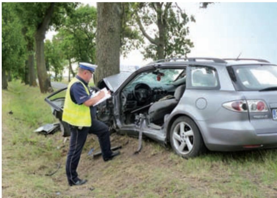
Kierowca Mazdy 6 z nieustalonych przyczyn, na prostym odcinku drogi uderzył w drzewo, za Jastrzębią.

Zatrzymany w tej sprawie został 47-letni mieszkaniec powiatu płockiego, który okazał się osobą poszukiwaną do odbycia kary więzienia za przestępstwa przeciwko mieniu. Za handel podrobionymi wyrobami z zastrzeżonymi znakami towarowymi może grozić mu nawet do 5 lat więzienia. mak