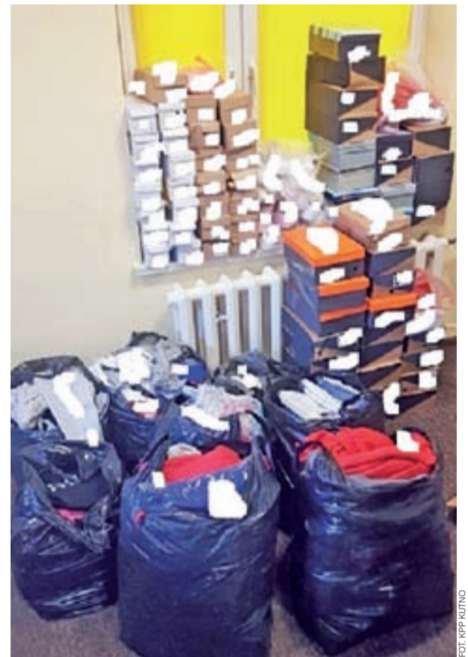
Policjanci zabezpieczyli ponad 500 sztuk różnego rodzaju odzieży oraz 72 pary butów oznaczonych podrobionymi znakami znanych firm.