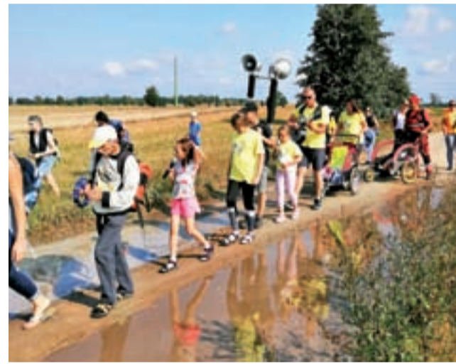
Grupa Cytrynowa i Białe Żółte pokonuje katuże po nocnej ulewie tuż za Wysokiennicami, 8 sierpnia.