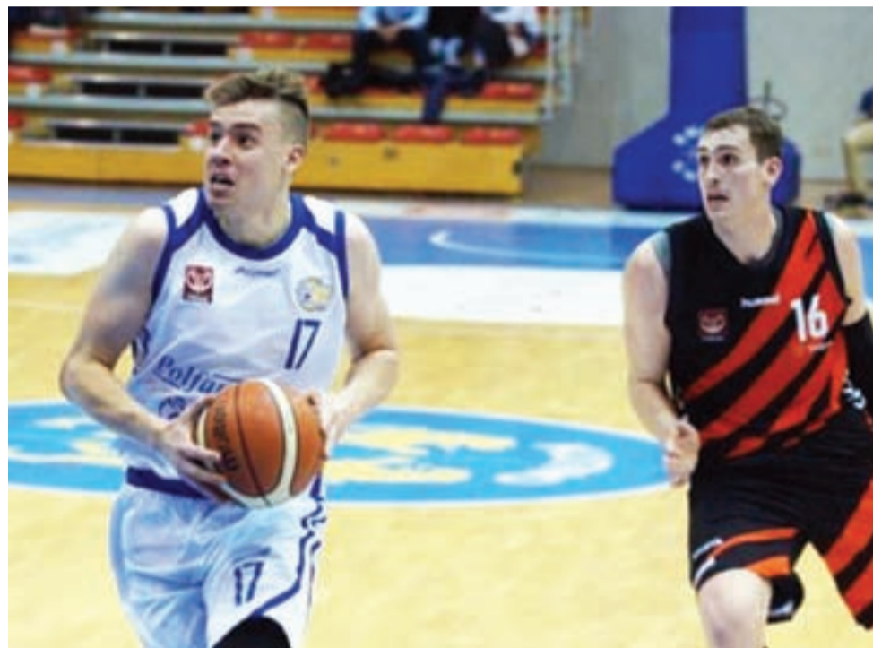
Koszykarski Klub Sportowy Pro-Basket Kutno S.A. ma w składzie drużyny koszykarskiej ośmiu nowych zawodników.

Mamy nadzieję, że po pierwszym roku spędzonym za zaplecza EBL, w nadchodzących