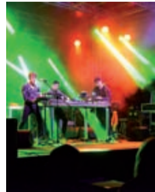
Kamp! był tym zespołem, który najczęściej nazywano „gwiazdą wieczoru” albo „gwóździem programu”.

Przez cały czas długie kolejki ustawiały się do stoiska Browaru