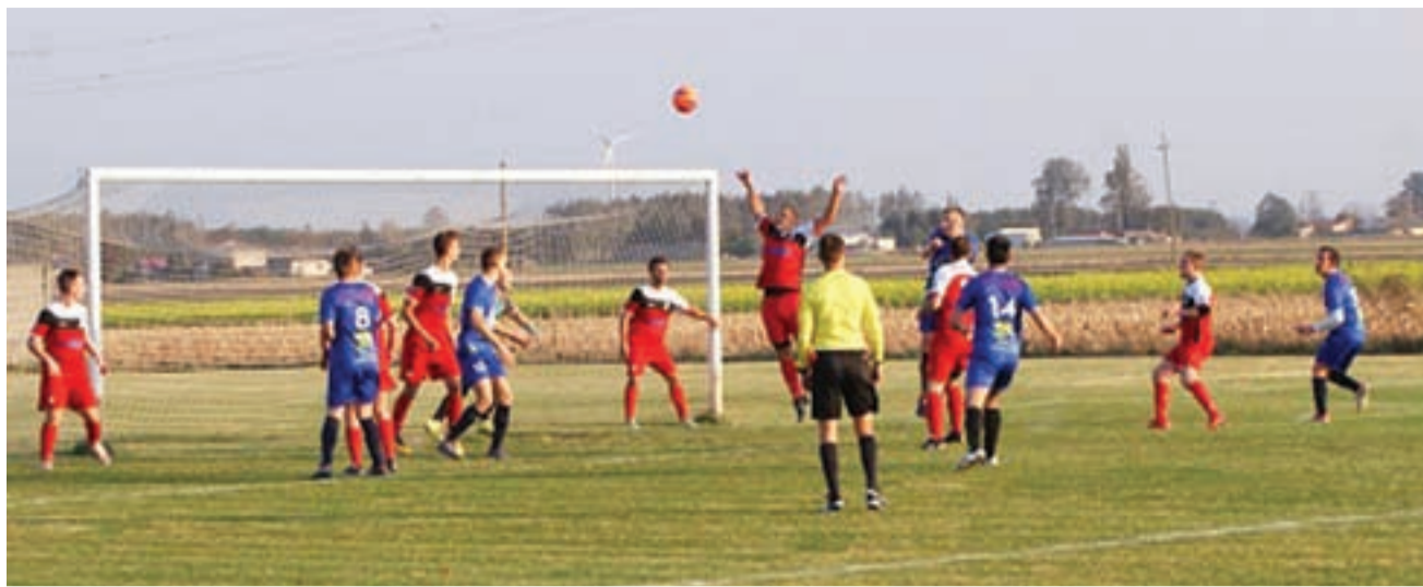
W sobotnim meczu pierwszej rundy Pucharu Polski w okręgu skierniewickim piłkarze GKS Bedno pokonali zespół Orłęta Cielądz 4:2.