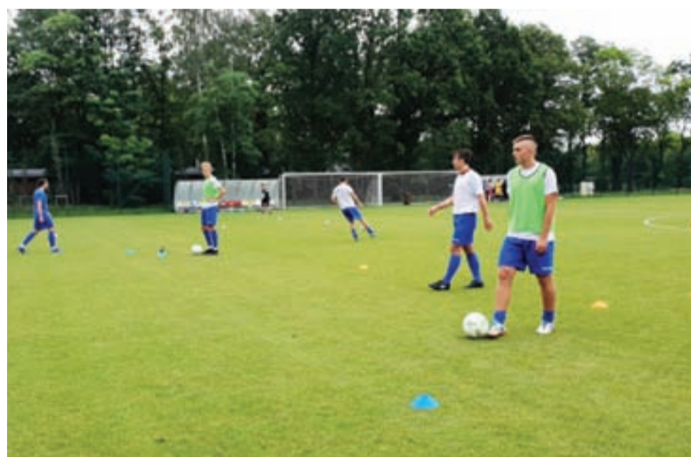
W sobotę kutnowscy piłkarze KS n stadionie w Łodzi zmierzili się z tamtejszą drużyną ŁKS II Łódź.