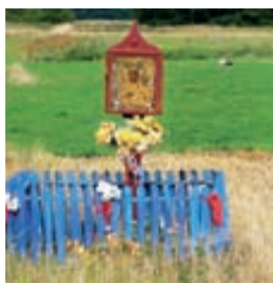
Charakterystyczna kapliczka po środku łąki między Kompiną a Bednarami urzeka swoją kolorystyką.

– Żaba wyglądała na tyle korzystnie, że postanowiłam pokazać ją w Internecie. Została ciepło przyjęta i to zachęciło mnie do zakupu własnego aparatu i rozwijania umiejętności – opowiada. Anna mieszka w Belchowie. Na codzień zajmuje się pracą zupełnie nie związaną z fotografowa-