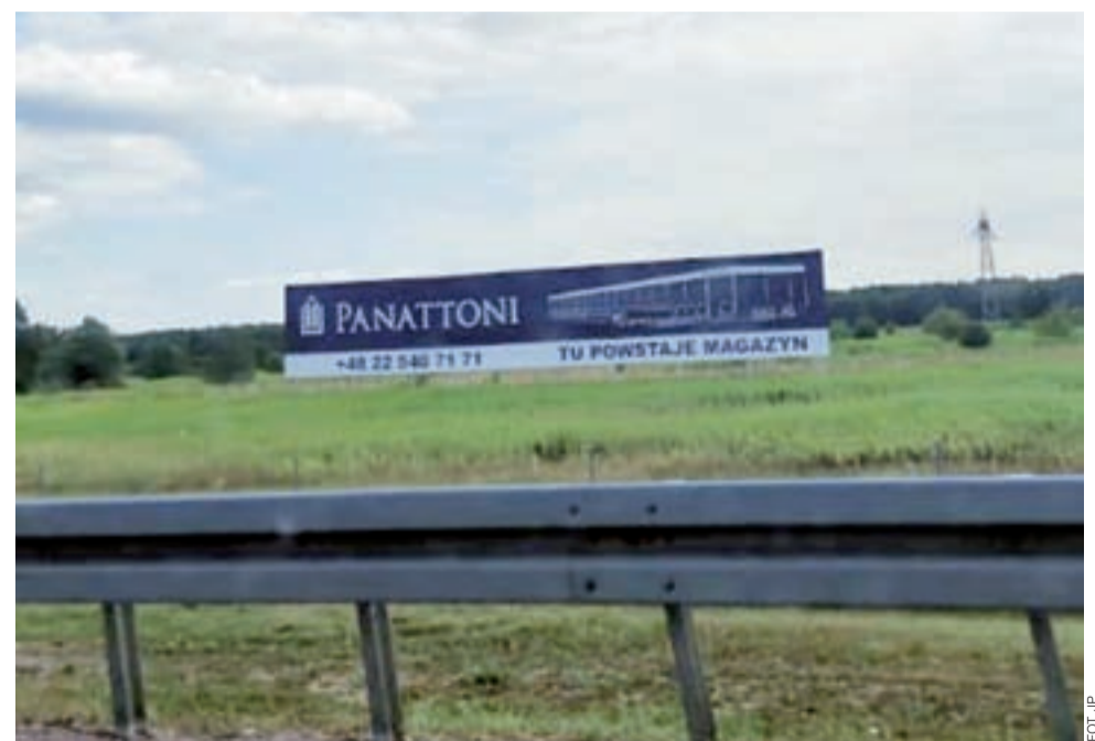
Baner informujący o przyszłej inwestycji można zobaczyć w sąsiedztwie węzła autostadowego „Skjerniewice”.

Oprócz tego gmina zajmie się planowaniem budowy ronda na DK70 (w sąsiedztwie wieży stacji przekaźnikowej telefonii komórkowej), skąd odejdą drogi dojazdowe dla terenów inwestycyjnych w kierunku Dzierzgowka