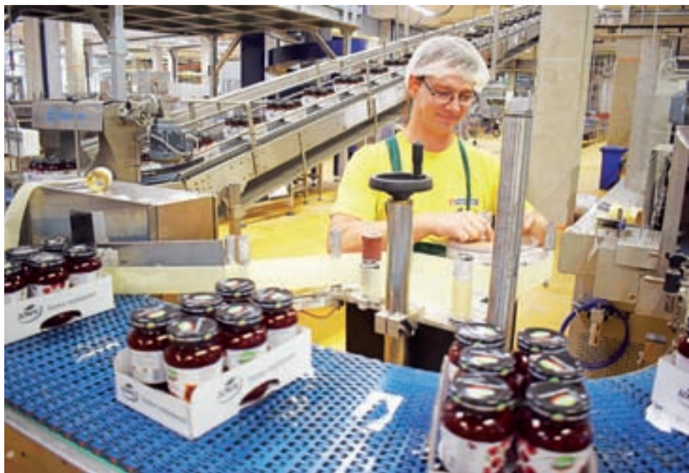
Pracownik przy linii produkcyjnej dżemów Łowicz.