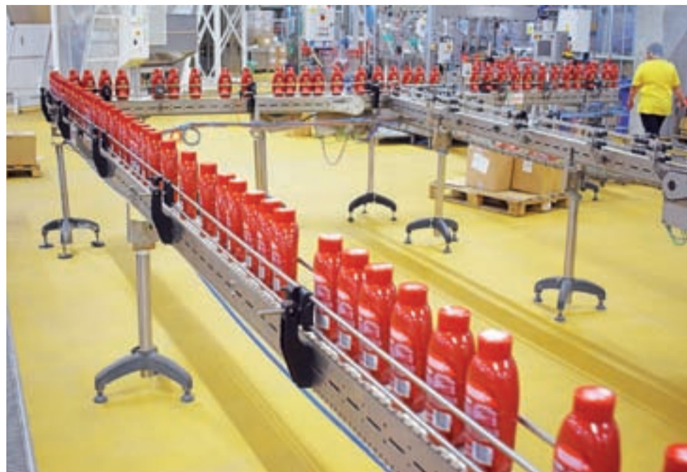
Nowa linia produkcyjna keczupów Kottlin.

Łowicz | Trwają inwestycje spółki Maspex. I to nie ma być koniec