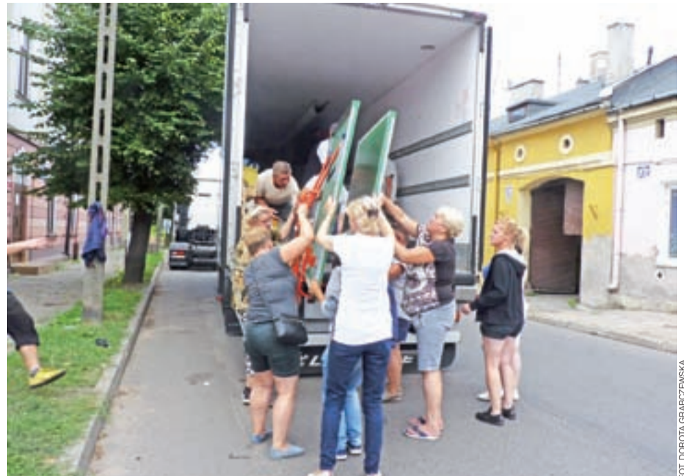
Kilkanaście osób pomagało rozładować samochód z darami. Wśród nich był też stół pingpongowy.

Asfaltowa droga, którą wybuduje PRD, ma mieć szerokość 3 metrów. Roboty będą kosztować 244.858,40 złotych. mak