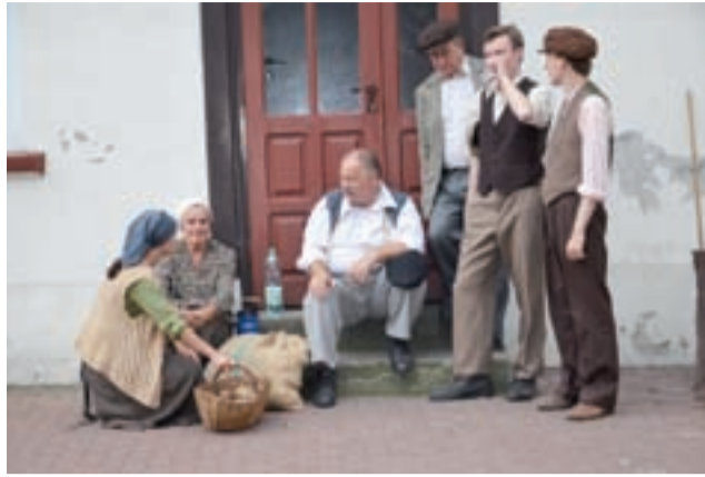
Poza profesjonalnymi aktorami, na planie pracowali także statyści, którzy przyjechali autokarem z Łodzi.