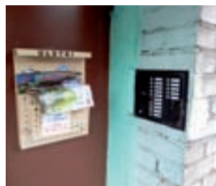
Stan domofonów i instalacji w wielu blokach pozostawia wiele do życzenia.

– Przed wieloma laty domofony były zakładane z inicjatywnej mieszkańców. Później nie było komu o nie dbać i naprawiać: część działała, a część nie. Dla-