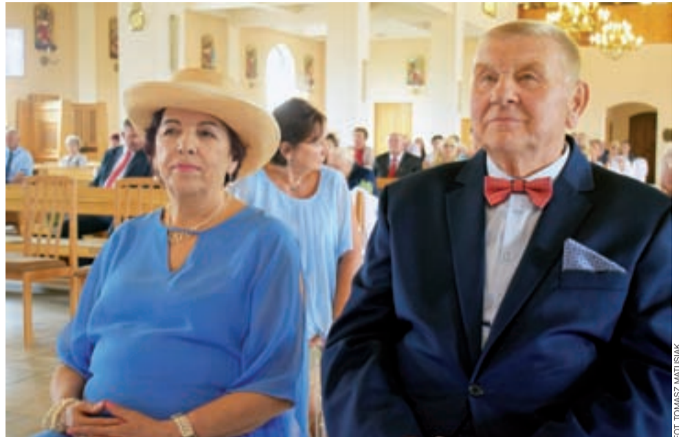
Państwo Wypychowie znow przed ołtarzem – 50-lecie ich ślubu na mszy w kościele pw. Chrystusa Dobrego Pasterza.

To nie jest tak, że nigdy się nie kłóciliśmy. Zawsze jednak po sprzeczkach potrafiliśmy skupić się na tych najważniejszych celach i zadaniach, jakie mamy jako rodzina, czyli na tym, co nas łączy.