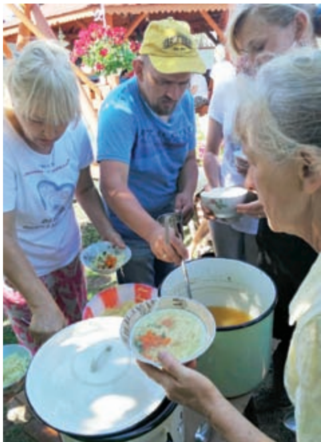
Niedzielnny rosół dla pielgrzymów w Łochyńsku.

Czasem podwiezie rodzina, ale często „stopem” czy taksówką, za którą trzeba słono zapłacić.