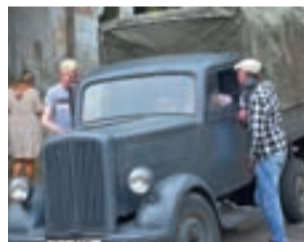
Uwagę przykuwała wykorzystywana na planie niemiecka ciężarówka.

Produkcja jest na finiszu. W poniedziałek ekipa serialu miała do zrealizowania jeszcze 11 dni zdjęciowych. Najprawdopodobniej serial obejrzymy na antenie TVP w przyszłym roku, choć jeszcze