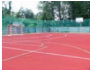
Nowy obiekt łączy w sobie cechy boisk do wielu dyscyplin sportu.

– Dobrze znamy osiągnięcia naszych mieszkańców w tym zakresie, dlatego osobom, które dopiero rozpoczynają swoją przygodę z tego rodzaju sportem chcemy zapewnić optymalne warunki rozwoju – zapewnił wójt w rozmowie