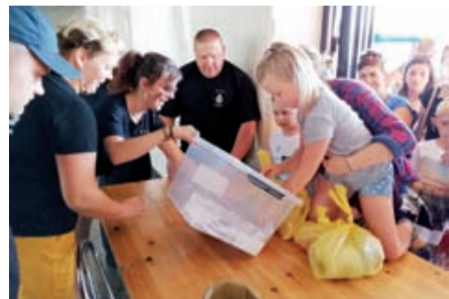
Główna atrakcja festynu w Kompinie - loteria fantowa, cieszyła się dużym powodzeniem.