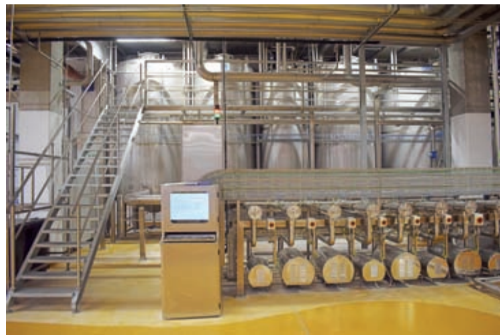
Automatyczna stacja mycia elementów linii produkcyjnych.

Cała praca w magazynie będzie się odbywała automatycznie,