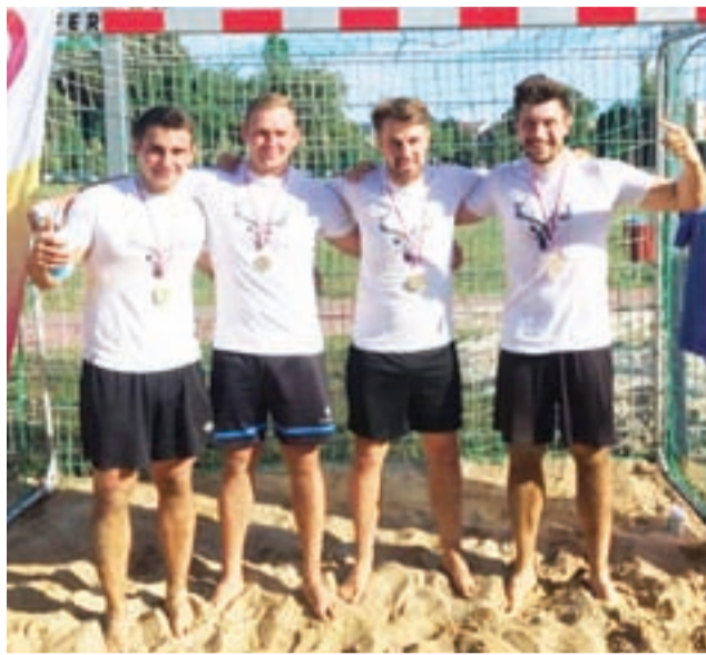
Mistrzowie turnieju Soliders of Fortun.