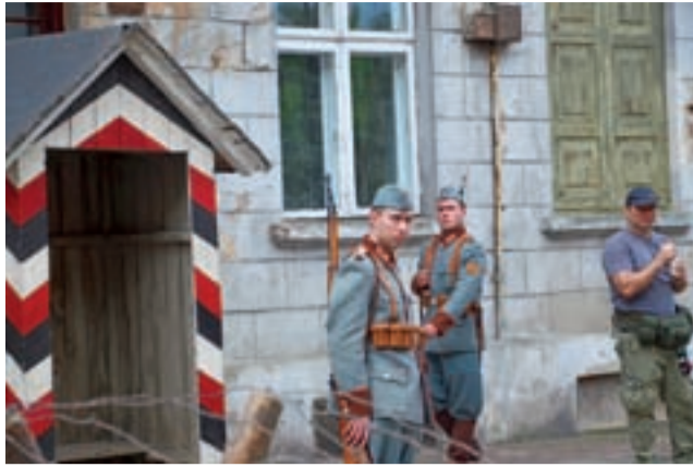
Jedna z kamienic przy ul. Podrzecznej odgrywała w serialu posterunek żandarmerii niemieckiej. Przed nią wartownia i żołnierze.