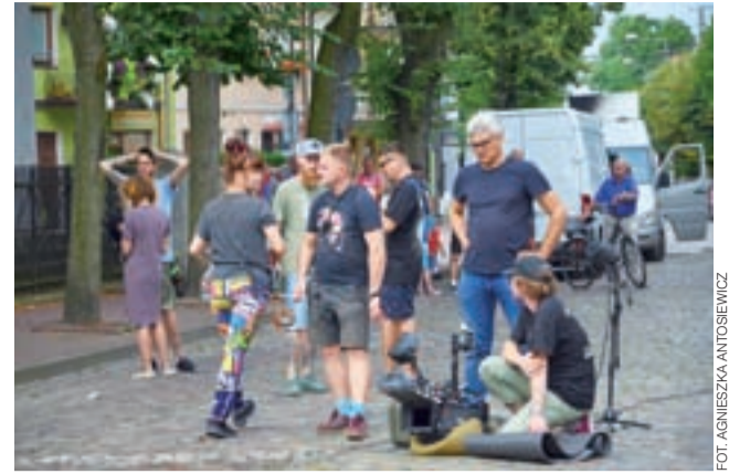
Przy powstawaniu scen do serialu „Ludzie i bogowie” na ul. Podrzecznej pracowało wiele osób, w głębi było sporo gapiów.

Łowicz | Nasze miasto zagrało Warszawę z czasów II wojny światowej