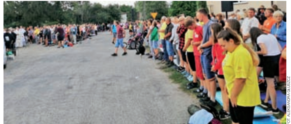
Eucharystia na skrzyżowaniu przy OSP w Gosławicach.

Najbardziej urzeka mnie serce gospodarzy, którzy nas częstują