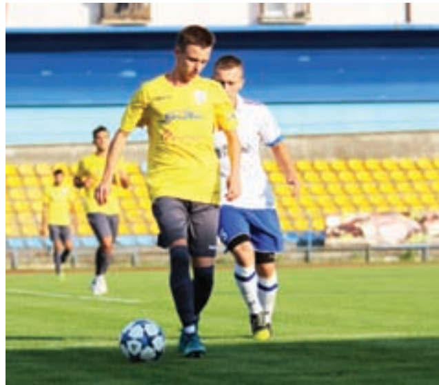
Kutnowska drużyna zagrała na własnym boisku przeciwko Włóknarzowi Żelów, wygrywając z nim 4:1.