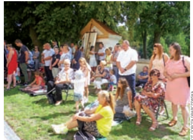
Główna msza odpustowa była mszą polową. Ludzie siadali na kocach i swoich krzesłach w cieniu wokół kościoła.

gipsowej, balonami. To wreszcie okazja dla OSP Suserz, by zarobić pieniądze przeznaczone na wyposażenie jednostki, która wyrusza ratować mienie i zdrowie ludzi, gdy jest taka potrzeba.