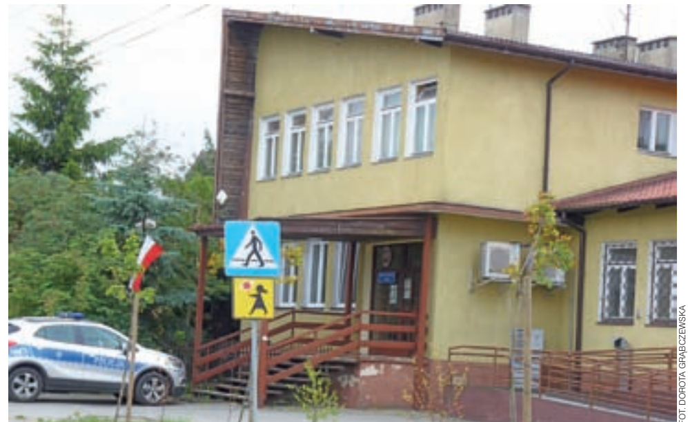
Na czas remontu posterunku policji w Pacynie (na zdjęciu) funkcjonariusze będą urzędować w Szczawinie Kościelnym.

W ubiegłym roku udało się tylko wymienić okna. Teraz przebudowane zostanie całe wnętrze budynku. Wymieniona będzie instalacja elektryczna i wodno-kanalizacyjna, zamontowana sygnalizacja przeciwpożarowa i alarmowa, rozebrane istniejące ścianki działowe i postawione nowe. Będą zrobione nowe wy-