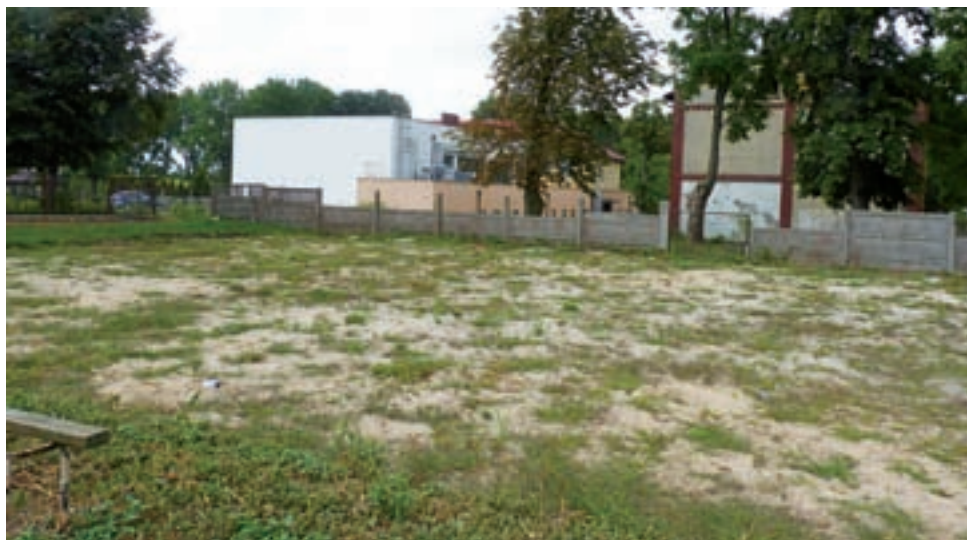
Budowę sportowego boiska wielofunkcyjnego rozpoczęto rok temu. Wykorytowano teren, nawieziono piasek i roboty przerwano. Umowę z wykonawcą rozwiązano. Teraz teren już porósł trawą i zielskiem.

Wszyscy wykonawcy deklarowali, że wykonają zadanie do 15 listopada br., z 5-letnią gwarancją.