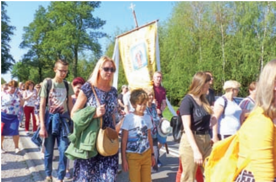
W tegorocznej pieszej pielgrzymce do Suserza szło ok. 500 osób.

– Dotarliśmy do Suserza po raz 167. od kilku lat dołącza pielgrzymka z Pacyny. Cieszę się, że możemy gościć w świątyni Matki Boskiej Suserskiej zwaną uzdro-