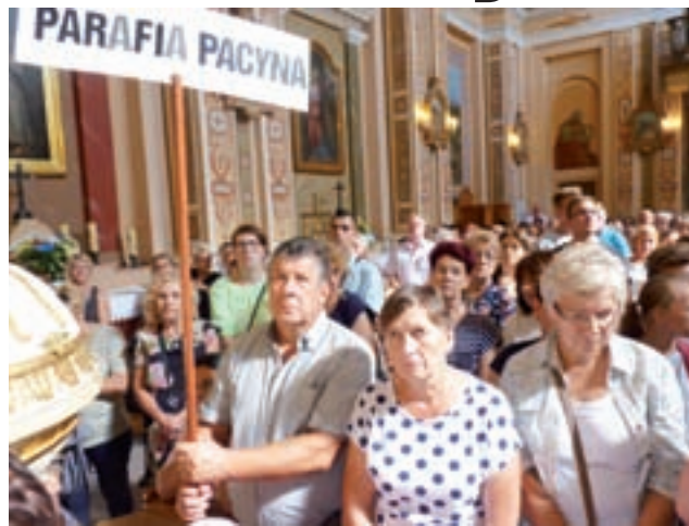
W tym roku pielgrzymi z Pacyny w kościele w Suserzu przyszedli przed pielgrzymami z Żychlina.

Od 6 lat w pieszej pielgrzymce wędrują mieszkańcy gminy Pacyna i Sanniki. Z każdym rokiem pielgrzymów jest więcej. Mieszkańcy Żychlina mają do pokonania trasę 10 km w jedną stronę, zaś mieszkańcy Pacyny 7 km w jedną stronę.