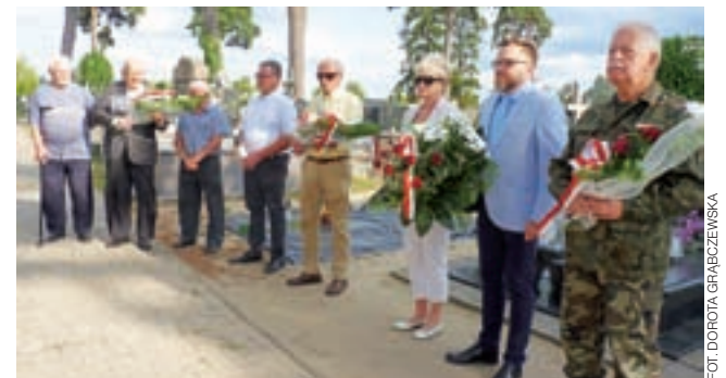
Rocznice Bitwy Warszawskiej w Żychlinie 14 sierpnia uczcili tylko członkowie TMHŻ oraz władze gminy.

Na koniec zagra zespół „Cosmo” – to grupa, która mówi o sobie, że wprowadza świeżość w polskiej muzyce tanecznej. Ich muzyka to mix disco z dance i innymi odmianami muzyki tanecznej. Zespół zakończy tegoroczne dożynki. dag