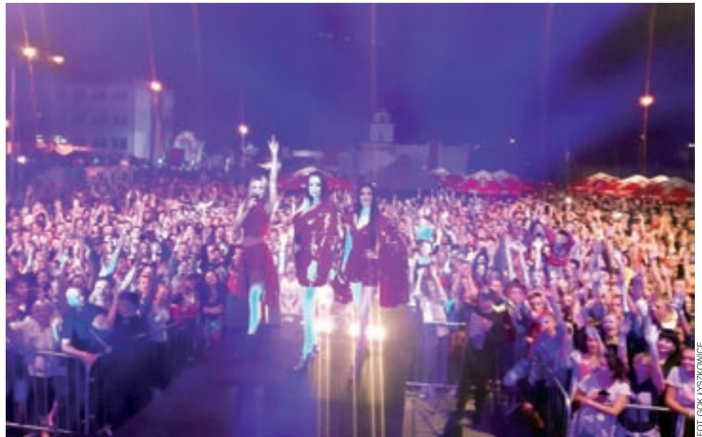
Gwiazdą wieczoru na festynie w Łyszkowicach był trzyosobowy girlsband Top Girls.