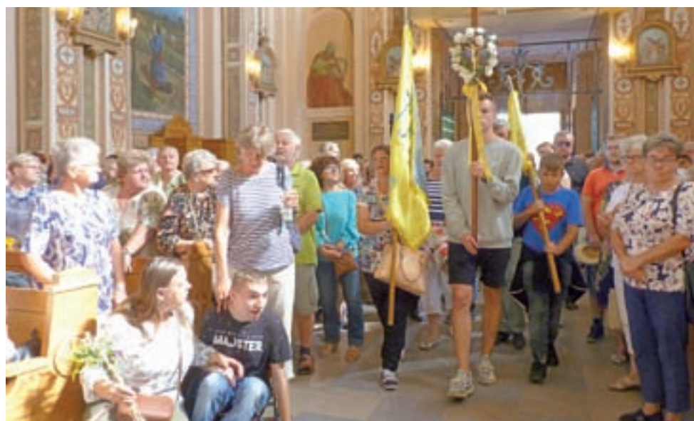
Pielgrzymi z Żychlina wchodzą do kościoła w Suserzu.

15 sierpnia strażacy z OSP Śleszyn usuwali powalone drzewo na ulicy Kasztanowej. dag