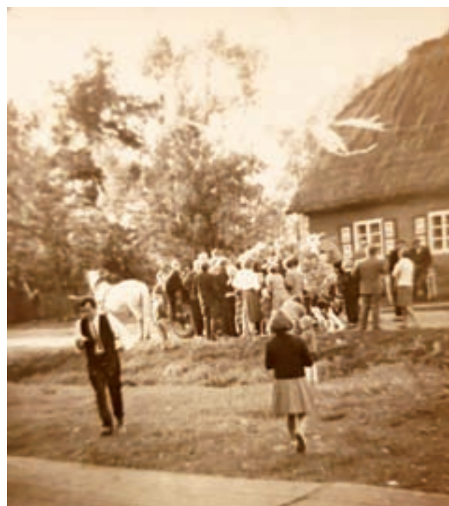
Takie to były początki. Kolejka po lody sprzedawane wprost z wozu. To mógł być rok 1969.

Do produkcji lodów potrzebny był lód, który pozyskiwano