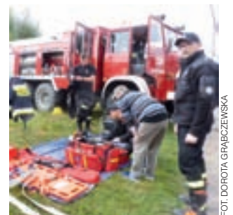
Rok temu podczas dożynek strażacy z OSP Skórzewa prezentowali najnowszy sprzęt ratownictwa medycznego.

Dla OSP Oporów gmina wniosowała m.in. o zakup kombinezonu pszczelarskiego, zbiornika