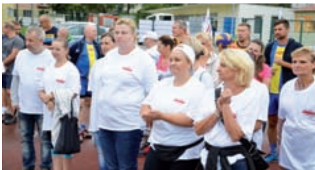
Zawodnicy w koszulkach z napisem „Solidarność” Łowicz podczas ubiegłorocznej Spartakiady.

Podobnie jak rok temu, rozegrane zostaną następujące konkurencje: piłka siatkowa kobiet (drużyny 4-osobowe), piłka siatkowa