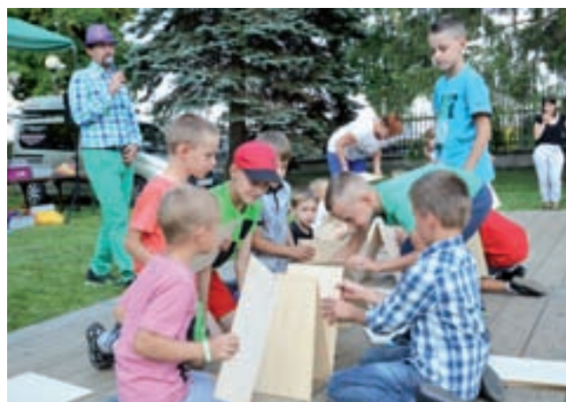
Zabawy z wodzirejem. Drużyna chłopców układa wieżę z drewnianych kart.

Nad stawem parafianie mogli obejrzeć pokaz ratownictwa dro-