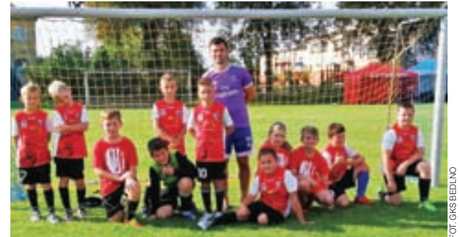
Dzieci zrzeszone w grupach młodzieżowych GKS Bedno doskonaliły swoje umiejętności piłkarskie w Choceniu.

Dodatkowymi urozmaieniami obozu były wycieczki do parku linowego we Włocławku oraz Chodcza, gdzie trenowali na profesjonalnym boisku do plażowej