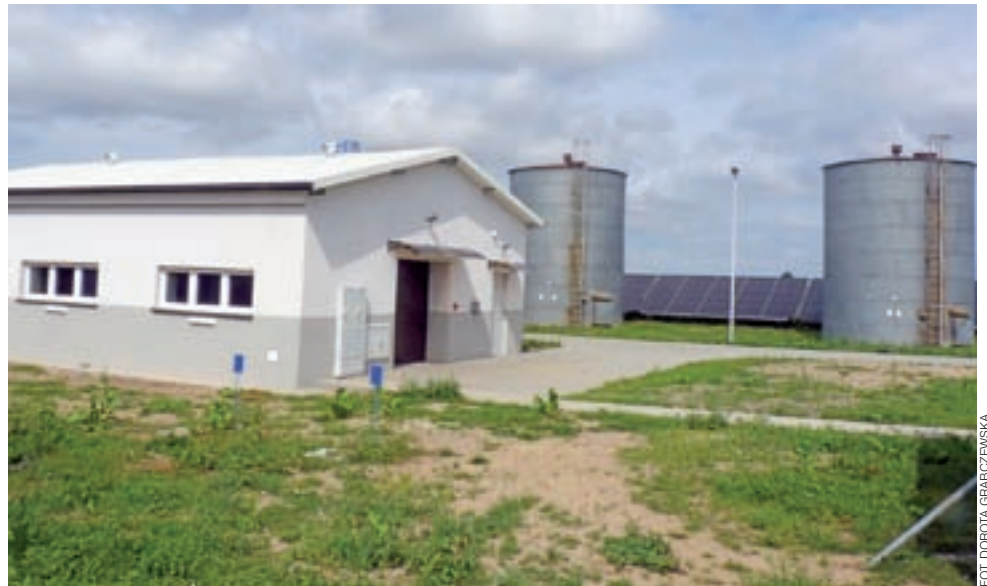
Modernizację Stacji Uzdatniania Wody w Oporowie zakończono. Wkrótce odbiór inwestycji.

Modernizacja SUW była ostatnią z trzech gminnych inwestycji proekologicznych. W ubiegłym roku zrobiono 51 przydomowych oczyszczalni ścieków oraz zrealizowano przebudowę sieci wodociągowej w miejscowościach Probostwo, Kurów Wieś, Mnich Ośrodek i Mnich Południe, w których powstało łącznie 4,1 km nowego wodociągu. Na realizację tych zadań gmina Oporów miała przyznać dotację 1.362.903 zł. Do końca roku nastąpi rozliczenie wszystkich kosztów trzech inwestycji i okaże się, ile faktycznie wyniesie dotacja. dag