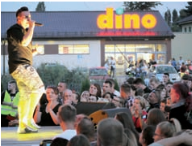
Kilkanaście minut po godzinie 20 na scenę wkroczył Loverboy, a pod sceną wtedy zaczęło robić się tłoczno.