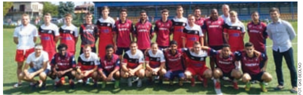
Pamiątkowe zdjęcie drużyny GKS Bedno i Akademii Piłkarskiej z Brazylii.

Mecz odbył się w czwartek 15 sierpnia, w samo południe na Stadionie Miejskim w Żychlinie. Spotkanie stało na bardzo dobrym poziomie. Oba zespoły prezentowały odmienny styl gry w defensywie ale kibice nie mogli narzekać na brak goli i ciekawych akcji po obu stronach boiska.