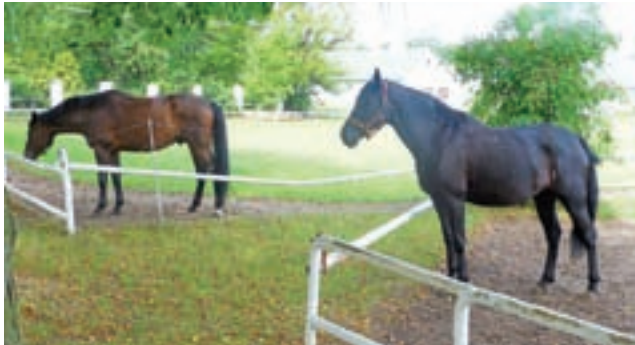
Walewickie konie. Wiele osób zastanawia się dziś, jak potoczą się losy stadniny po przejęciu jej przez większą spółkę buraczaną.

Potraw z walewickiego karpia, a także z wołowiny z hodowanego przez spółkę bydła mięsnego