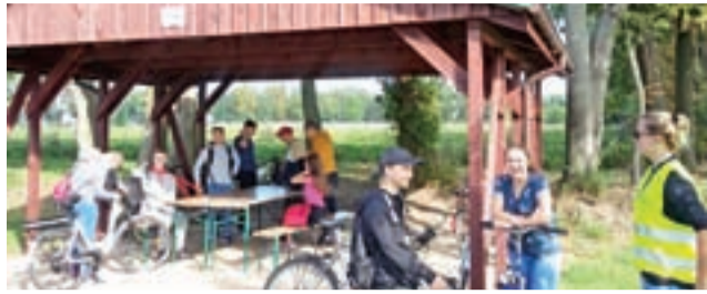
W X rajdzie Śladami Bohaterów Września uczestniczyło 24 uczniów z Zespołu Szkół w Żychlinie.

Grupa udała się do Orłowa (gmina Bedno), gdzie znajduje się pomnik żołnierzy armii Poznań i armii Pomorze, którzy polegali podczas Bitwy nad Bzurą we wrześniu 1939 roku. Historię walk