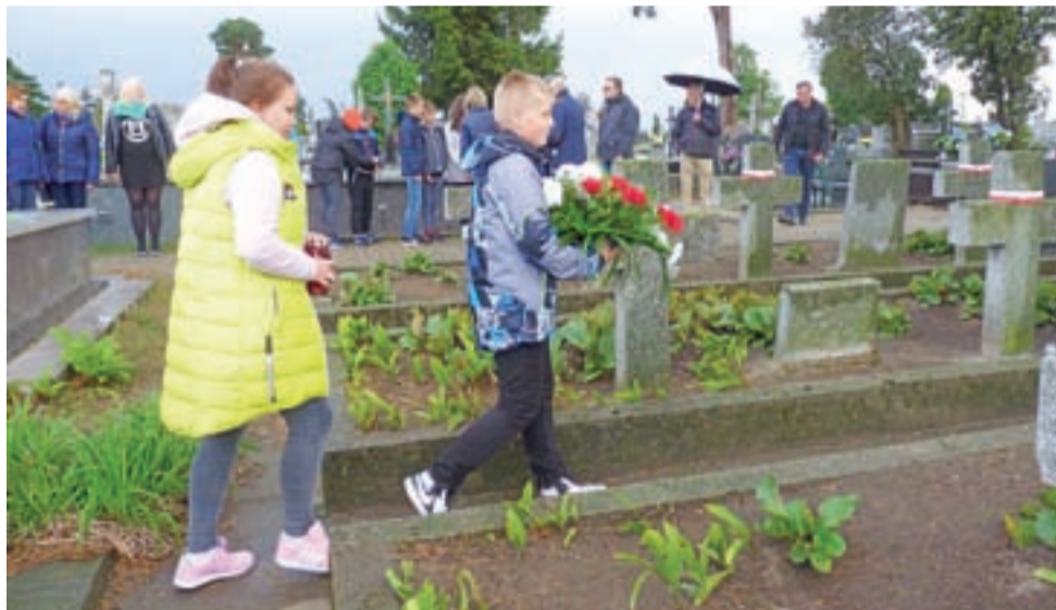
Kwiaty na grobach żołnierskich złożyli uczniowie z SP w Grabowie.