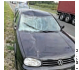
Łoś, który wpadł na autostradę A1 uszkodził trzy samochody, trzy osoby zostały ranne.

Główne uroczystości święta Brodów odbywały się w niedzielę. Świętowanie zaczęło od wspólnej modlitwy, po czym kolorowy korowód uczestników zabawy przeszedł ulicami miasta na miejsce, gdzie ustawiono główną scenę. Tradycyjnie mer oficjalnie witał wszystkie delegacje chlebem. Później na scenie prezentowały się dzieci i młodzież. Były też koncert ukraińskich gwiazd muzyki. dag