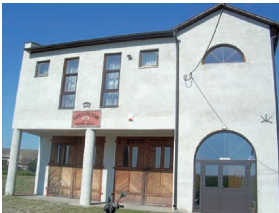
Wiejski Dom Kultury „Strażak” w Bogorii Dolnej budowany był w latach 1995-2013.