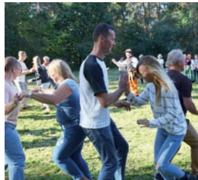
Tańczenie na polanie nie było łatwe, pomimo że rosnąca tam trawa była skoszona.

– Jako ludzie odpowiedzialni nie pracowaliśmy na żadne zamówienie publiczne. Wykonaliśmy bardzo duży kawał ciężkiej pracy – przekonywała. – Nie cofnę się ani o krok. (...) Ten raport nie zawiera ani jednego zdania naciągającego – podkreślała. aa