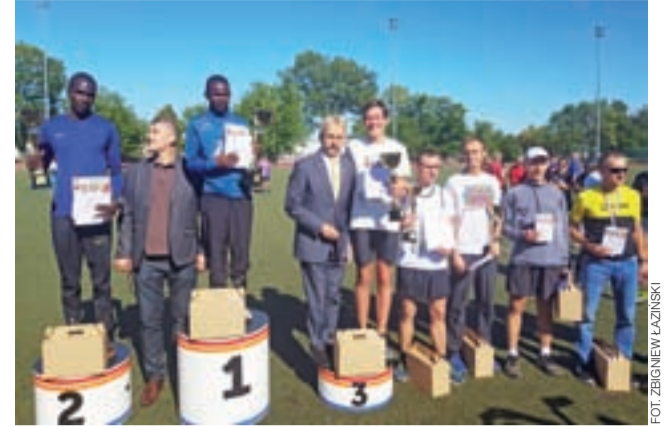
Najlepsi zawodnicy w kategorii open.

Lekka atletyka | XXXVIII Łowicki Półmaraton Jesieni o Puchar Burmistrza Miasta Łowicza