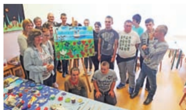
W wyniku blisko trzygodzinnej pracy twórczej, powstał obraz „Nasza Ziemia”, który namalowała grupa wychowanków Specjalnego Ośrodka Szkolno-Wychowawczego w Łowiczu pod kierunkiem słuchaczy Łowickiego Uniwersytetu Trzeciego Wieku.

Spotkanie w szkolnej świetlicy, na które przybyło około 30 uczniów z trzema opiekunami, rozpoczęło się od zapoznania z warsztatem artysty plastyka i rozmowy o świecie – jak go sobie wyobrażają, z czym im się kojarzy: z jakimi roślinami, zwierzętami, krajobrazami i kolorami.