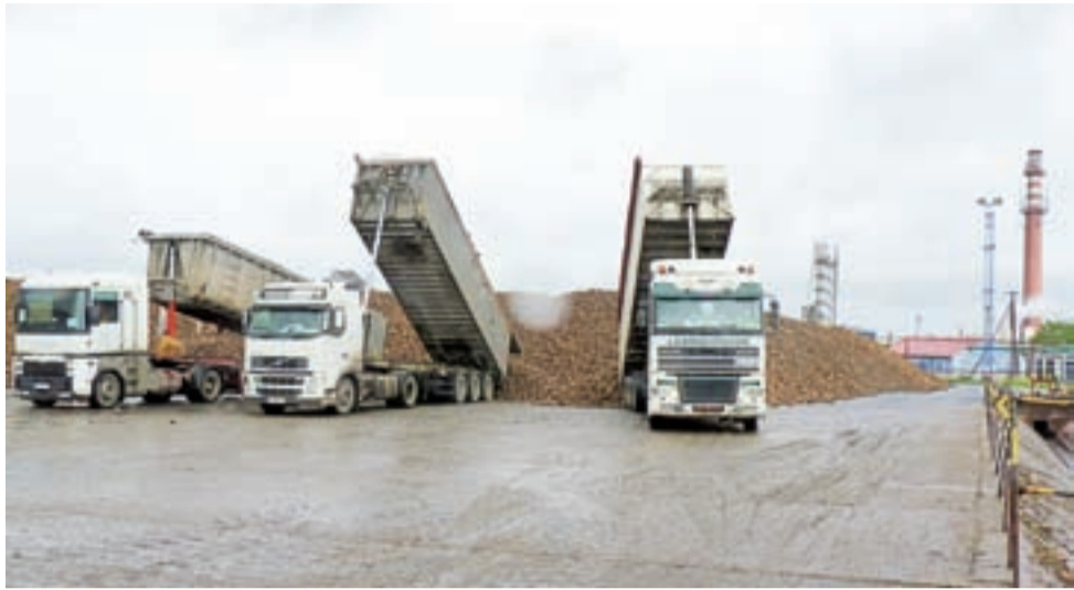
Transporty dowożą buraki cukrowe na plac buraczany cukrowni w Dobrzelinie.