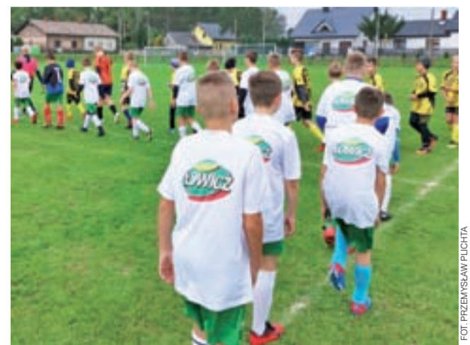
Wychodząc na boisko zawodnicy Pelikana-2007 II nie wiedzieli, jak potoczą się losy meczu.

– Byliśmy zespołem, który miał optyczną przewagę na boisku. Niestety zbyt poważne indywidualne błędy techniczne sprawiły, że przegraliśmy ten mecz. Przy wyniku 0:0 nie potrafimy trafić do pustej bramki. Astra prostymi środkami, poprzez