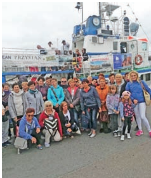
Jedną z atrakcji wycieczki nad morze był godzinny rejs widocznym za paniami statkiem o nazwie „Ocean”.

W sobotni wieczór panie zorganizowały wieczór integracyjny w miejscu zakwaterowania – a był to Pensjonat Bliźniak w Chłapowie, podczas którego mąż właścicielki zagrał dla nich na żywo, a członkinie KGW z Urzeczka prowadziły kalambury. mwk