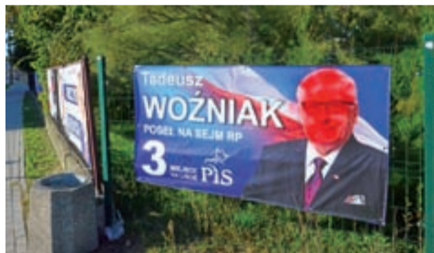
W okolicach ronda na skrzyżowaniu ulic Dmowskiego oraz gen. Klickiego banery zostały pomazane czerwonym markrem lub farbą.