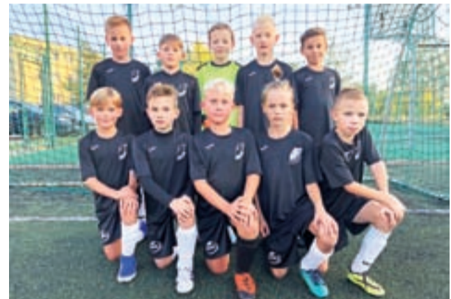
Drużyna Pelikana 2009 wygrała z MKS Diament.