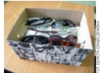
Okulary można przynosić do ŻDK do końca września.