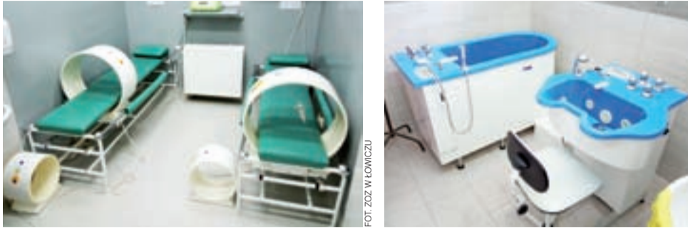
Dostępna jest magnetoterapia, czyli leczenie za pomocą pola magnetycznego oraz zabiegi hydroterapii.

To interesująca oferta dla pacjentów, bowiem zaleca się, aby chorzy po operacji endoprotezoplastyki lub innym zabiegu przeprowadzonym w oddziale ortopedii byli przyjmowani przez oddziały rehabilitacji ogólnoustrojowej w trybie pilnym, tj. do 6 miesięcy od zakończenia hospitalizacji. To daje im szansę na szybsze usprawnienie.