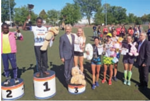
Najlepsze panie w Łowickim Półmaratonie.