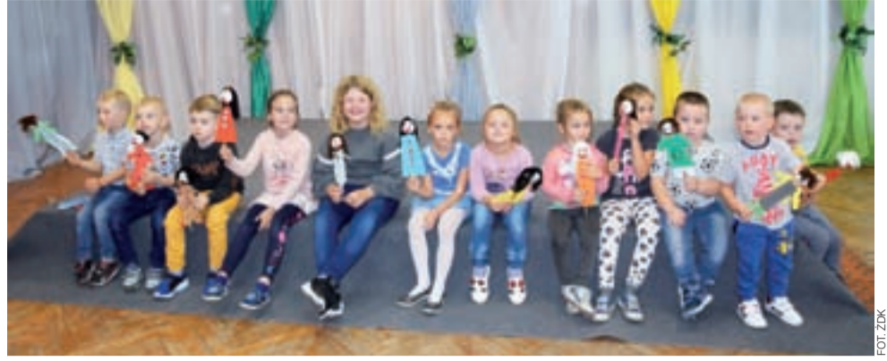
Dzieci podczas Rodzinnej Niedzieli zrobiły swoje lalki teatralne, które zabrały do domu.

Organizatorzy planują, że Rodzinne Niedziela z atrakcjami będą odbywać się w domu kultury raz w miesiącu. dag