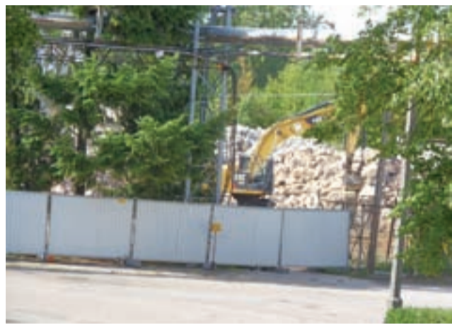
Budynek dawnej hali produkcyjnej w Emicie został wyburzony. Na jego miejscu powstanie nowoczesne Centrum Badaniowo-Rozwojowe.

Do tej pory transmisje z obrad radców gminy Pacyna były efektem nagrywania ich za pomocą zwykłej kamery, nie było mikrofonów, co sprawiało, że często głos mówców był bardzo słabo słyszalny, co jest tak ważne zwłaszcza gdy jest mowa o pieniądzach. dag