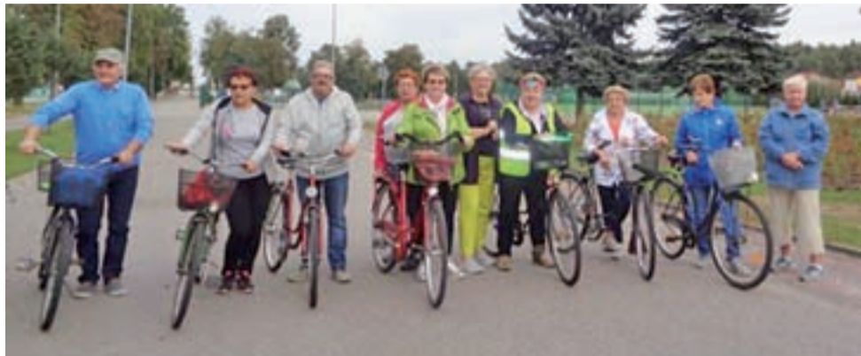
Podczas wycieczki rowerowej seniorzy odwiedzili sporo zakątków okolicy, podziwiając zmiany, jakie się dokonały w ciągu ostatnich lat.

– Wielu miejsc nie ma już w okolicy, jednak pojawiły się nowe przestrzenie, które przesyłają o tym, że gmina wspaniale