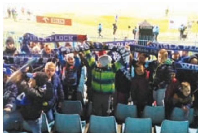
Piłkarze grup młodzieżowych KS Żychlin kibicowali na plockim stadionie podczas meczu Wisły Plock z Legią Warszawa.