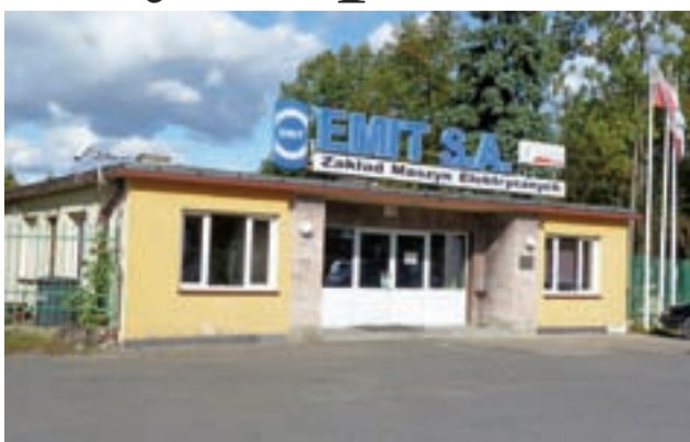
Emit chce wybudować w Żychlinie najnowocześniejsze w Polsce Centrum Badawczo-Rozwojowe.

Jak mówi nam prezes, już został ogłoszony przetarg na inwestycję, która ma być wykonana