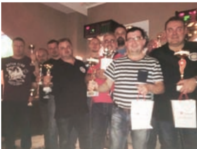
Wszyscy zawodnicy sezonu 2018/19 otrzymali pamiątkowe puchary i nagrody.