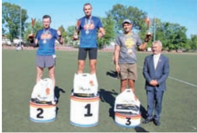
Najszybsi łowiczanie na podium.