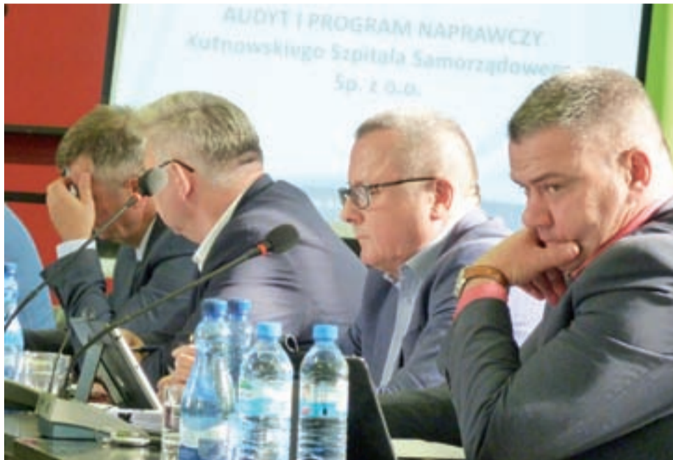
Podczas nadzwyczajnej sesji rady Powiatu Kutnowskiego przedstawiono audyt szpitala w Kutnie i plan naprawczy.