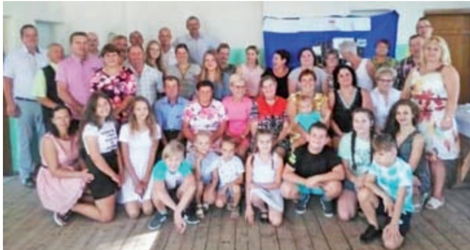
Członkowie KGW w Janówku podczas zorganizowanych dożynek 2019.

Strażacy sami zadeklarowali, że wyremontują dach na świetli-