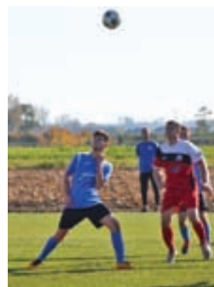
W meczu na szczycie GKS Bedno z Mazovią nastąpił podział punktów w wyniku remisu 2:2.

■ 9. kolejka Skierniewickiej Kl. A: ■ GKS Bedno – Mazovia Rawa Mazowiecka 2:2 ■ Czarni Bednary – Olimpia Niedźwiada 2:1 ■ Start Żłaków Borowy – Dar Placencja 1:3 ■ Laktóża Łyszkowice – Sokół Regnów 0:2 ■ Vagat Domaniewice – Korona Wejście 1:12