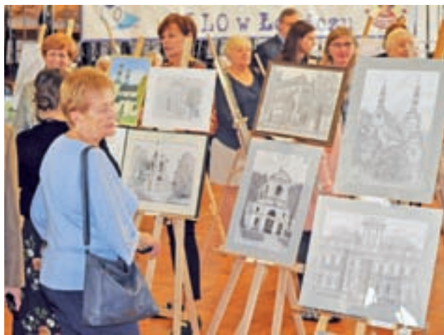
Każdy z rysunków, które powstały na wrześniowym plenerze, został wyceniony na co najmniej 25 złotych.