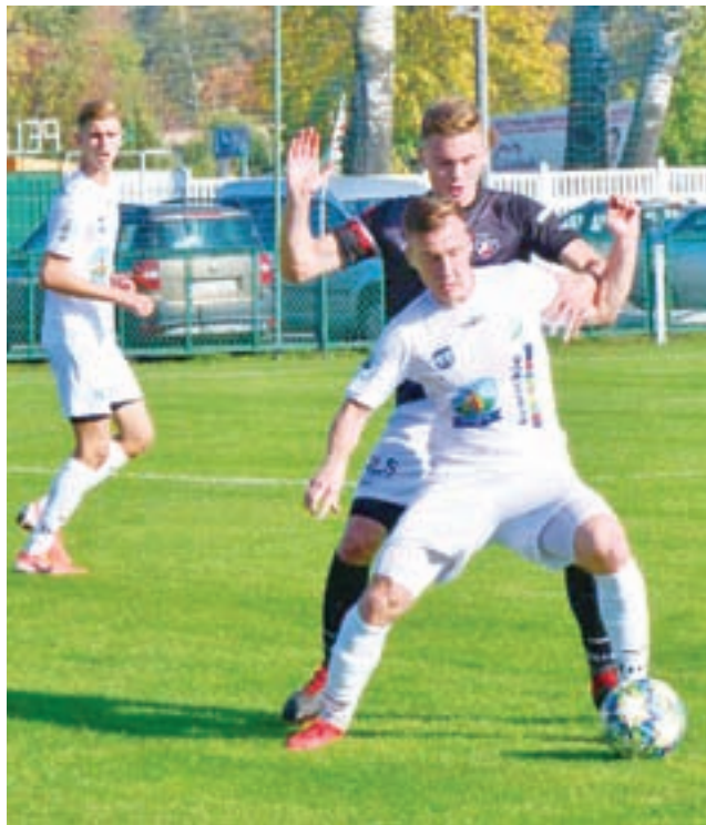
Pelikan ograł Polonię i zgrał trzy punkty.