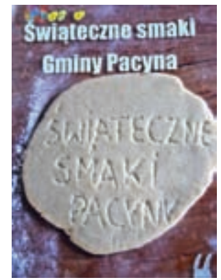
Okładka książki wydanej przez stowarzyszenie „Malowany młyn”.

Podczas promocji autorzy publikacji – w której zebrane są sta-