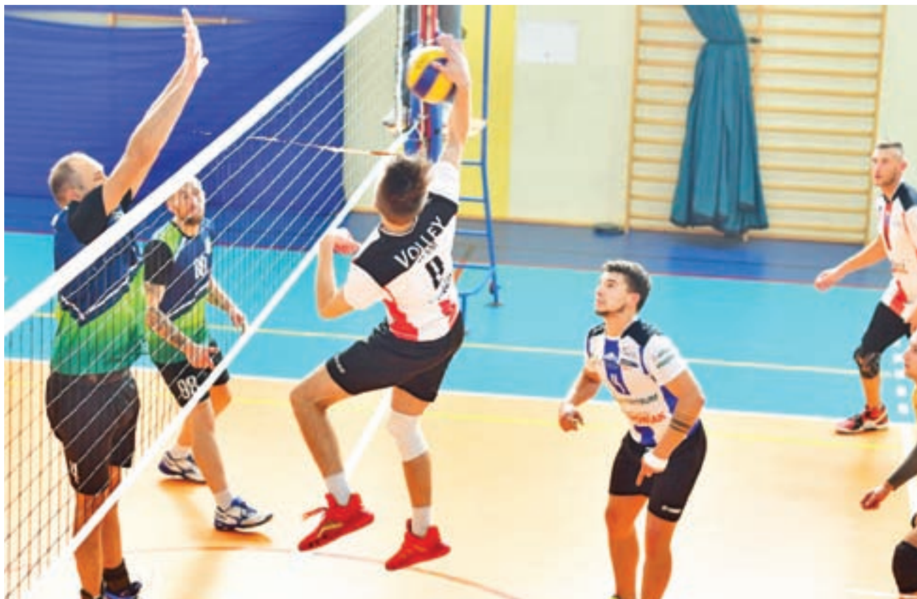
W Kutnie odbyła się piąta edycja Memoriału Siatkarskiego im. Mieczysława Gałusy. Żychlińska drużyna Volley Team zdobyła w rozgrywkach drugie miejsce.

Piłka siatkowa | V Memoriał im. Mieczysława Gałusy