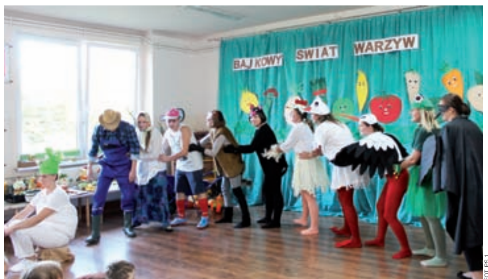
Rodzice przedszkolaków z „jedynki” chętnie uczestniczyli w bajkowej inscenizacji „Rzeczka” J. Tuwima.