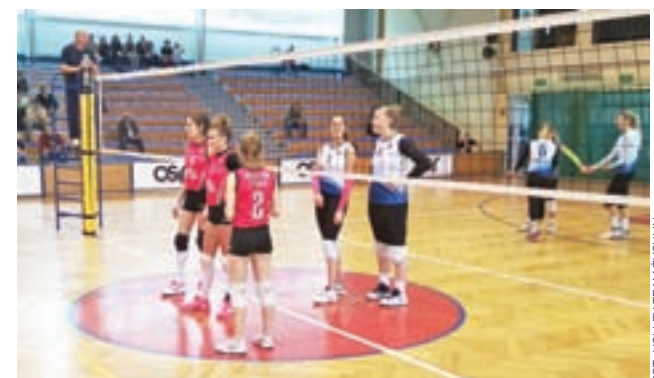
Mecz 3. kolejki wojewódzkiej III ligi kobiet, podczas którego siatkarki Volley Team Żychlin zagrały w Skierniewicach przeciwko tamtejszej drużynie MKS Sier-Vis zakończyły się wynikiem 3:2 dla gospodarzy.