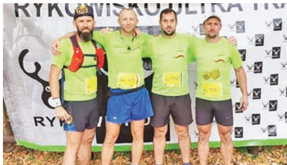
Biegacze zrzeszeni w Rozbieganych Żychlin pokonali 12,5-kilometrowy dystans w Łącku.