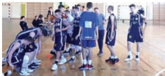
W Skierniewicach Książacy udanie zainaugurowali III ligę.

W ubiegłym sezonie Bródka startował wykorzystując na zawody i zgrupowania urlop a także zamieniając się służbami z kolegami z PSP w Łowiczu. Startując w Tomaszowie Mazowieckim w pierwszym od lat Pucharze Świata rozgrywanym w Polsce panczenista z Domaniewic zszedł prosto ze służby by za kilka godzin rywalizować z najlepszymi zawodnikami na świecie. Przygotowując się w takich warunkach trudno odnosić spektakularne sukcesy. Miedzy innymi z tego względu najbliższy sezon będzie wolny od startów. Nie będzie za to wolny od treningów. Bródka będzie nadal trenował na tyle aby być w dobrej dyspozycji, aby w przyszłości łatwiej mu było powrócić do formy startowej. Na nudę na pewno nie będzie narzekał gdyż często jest zapraszany do udziału w imprezach promujących sport. Będzie mógł wreszcie więcej czasu spędzać z rodziną i najbliższymi. Tafel