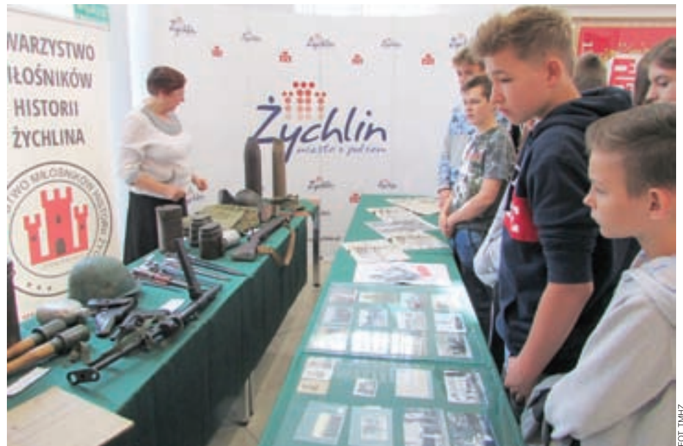
Wystawę o II wojnie światowej przygotowaną przez TMHŻ obejrzało ok. 100 uczniów z SP 1 i SP 2.

Wystawę obejrzeli uczniowie z klas VI a, VI b, VII i VIII Szkoły Podstawowej nr 1 pod opieką nauczycieli: Izy Gałązka, Barbary Sadkowskiej, Agnieszki Sidwa