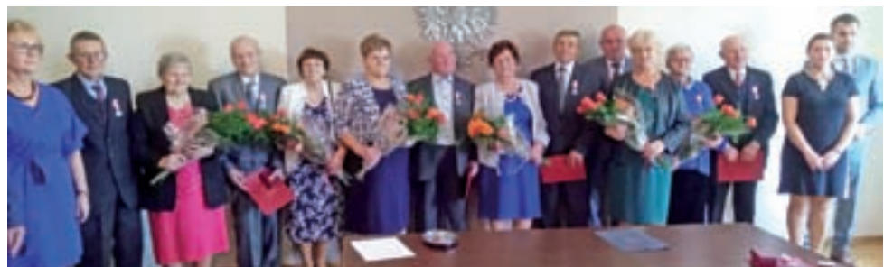
„Złoci małżonkowie” z gminy Chąsno zostali zaproszeni do USC 18 października.