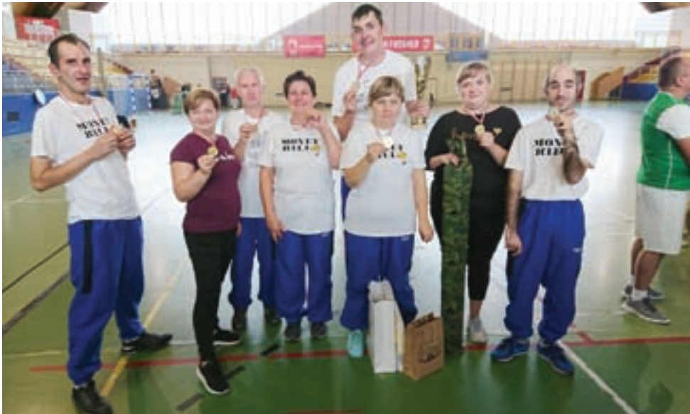
Reprezentacja Warsztatu Terapii Zajęciowej PSONI – Koło w Żychlinie podczas XV Mityngu Lekkoatletycznego Osób Niepełnosprawnych w Zgierzu.