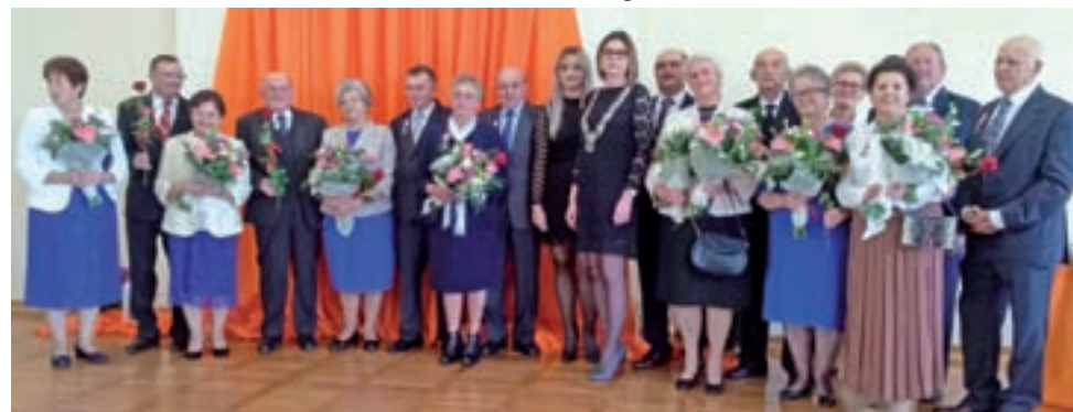
Złote Gody małżeństw z gminy Kiernozia odbyły się w sali Ochotniczej Straży Pożarnej w Kiernozie.