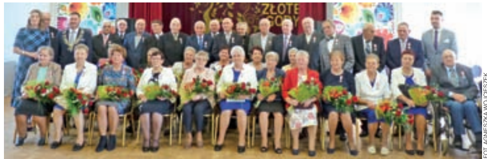
Tyle par małżeńskich od dawna nie świętowało Złotych Godów w Domaniewicach.