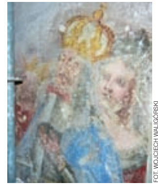
To prawie na pewno oni: Jan III Sobieski i jego żona, Maria Kazimiera (Marysienka).