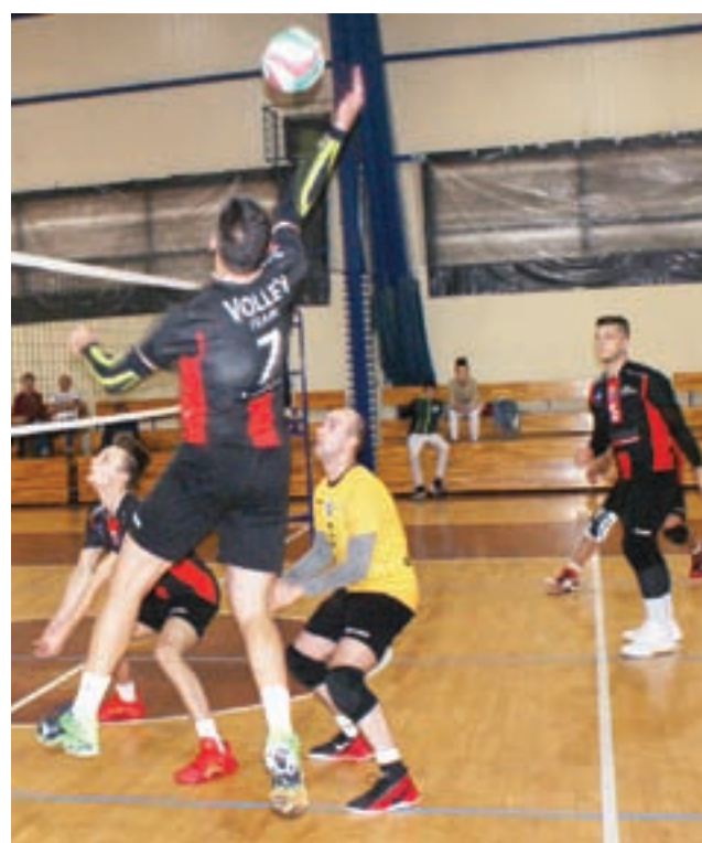
Seniorzy Volley Team Żychlin zanotowali przegraną 0:3 w meczu z LKS Luks Dobroń.