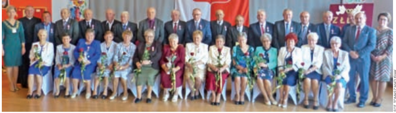
Odnaczone pary oraz organizatorzy imprezy pozują do wspólnego zdjęcia.