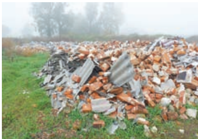
Gruzowisko z elementami płyt azbestowych faktycznie istnieje na wskazanym miejscu, ale płyt nie jest wiele. Więcej podejrzeń budzi duże lustro wody po żwirowni.

Teraz wszyscy w okolicy się zastanawiają czy osoba, która informowała o przestępstwie celowo nie podała prawdziwych danych, by uniknąć skutków doniesienia do organów, czy też może ktoś chce po prostu rzucić zło światło na byłego wójta, a może jeszcze komuś innemu zaszkodzić?