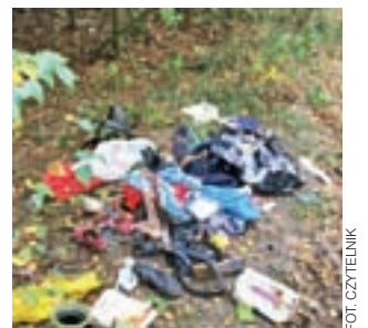
Śmieci znalezione w lesie w Strzelcewie.