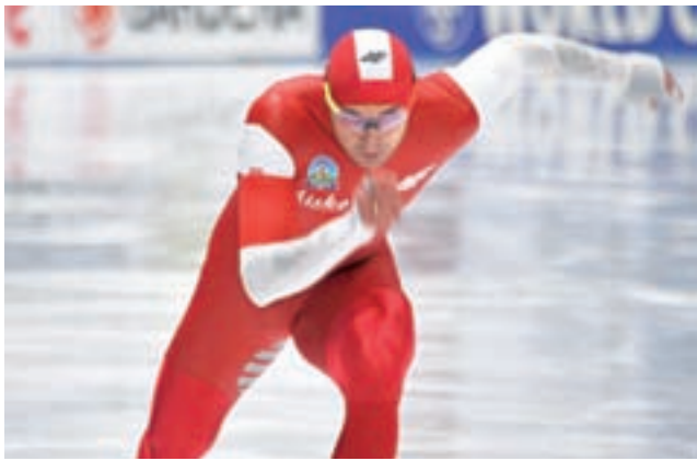
Zbigniew Bródka w Tomaszowie Mazowieckim w 2018 roku, podczas biegu na 1000 metrów. W tym roku go tam nie zobaczymy.

W Tomaszowie Mazowieckim nie zobaczymy także na torze Zbigniewa Bródki, który postawił sobie przerwę od startów. Nie oznacza to zakończenia kariery sportowej a jedynie roczną pauzę, po której Domaniewiczanki podejmą decyzję co będzie robił dalej.