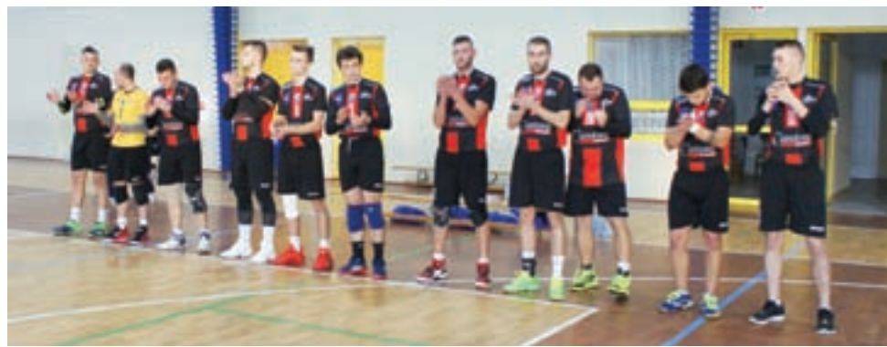
Zespół Volley Team Żychlin w spotkaniu 2. kolejki Łódzkiej III ligi mężczyzn zagrał we własnej hali sportowej podejmując LKS Luks Dobroń.

Piłka siatkowa | Łódzka III Liga Siatkówki Mężczyzn