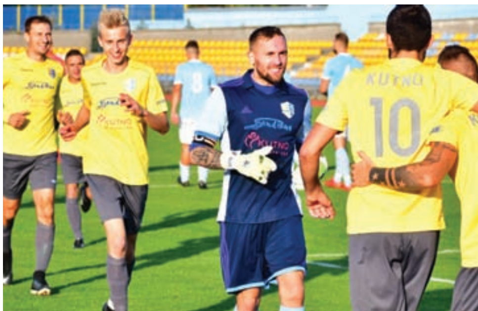
W spotkaniu 13. kolejki IV łódzkiej ligi triumfował zespół KS Kutno, który pokonał na wyjeździe zespół Andrespologii Wiśniową Górę, ustalając ostateczny wynik na 1:3.