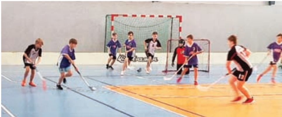
Jedno ze spotkań rozegranych przez drużynę chłopców Szkoły Podstawowej w Grabowie w finale wojewódzkim w unihokeju.

Był to bardzo ciężki i wymagający turniej dla chłopców, dodatkowo zbieg okoliczności sprawił, iż nie mogli wystąpić w pełnym składzie. Mimo wielkiej woli walki i ogromnego zaangażowania w grę, nie udało się odnieść zwycięstwa. Chłopcy SP Grabów rozegrali trzy spotkania, we wszystkich doznając