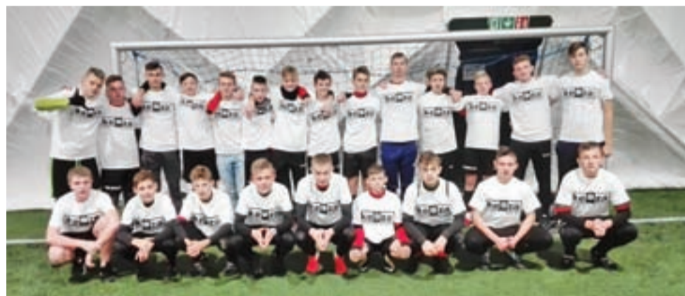
Drużyna juniorów GKS Bedno na Turnieju Piłki Nożnej KEEZA CUP Głuchołazy 2019.

Najmłodsza kategoria wiekowa orlik rywalizowała w hali sportowej, a do gry przystąpiło dziewięć zespołów. Po rozegraniu pierwszego etapu turnieju, drużyny podzielono na trzy poziomy. Pierwszy Mistrzostwa Świata, drugi Liga Mistrzów oraz trzeci Ekstraklasa. Młodzi piłkarze z Bedna, podobnie jak starsi koledzy nie-