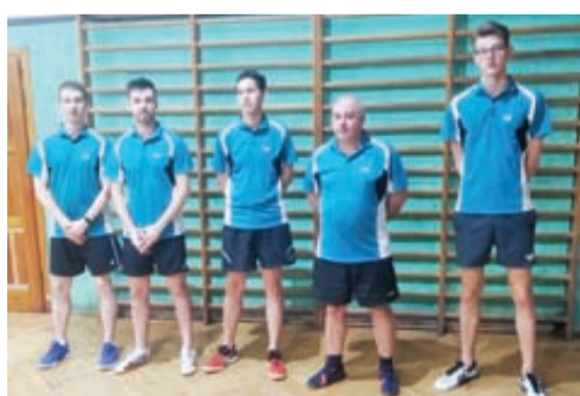
Ekipa drugoligowego Księżaka walczy o górną część tabeli.

Wola. W ostatnim meczu Soccer Kids 2011 zwyciężyło 2:0 i zajęło ostatecznie trzecie miejsce podczas turnieju. ever