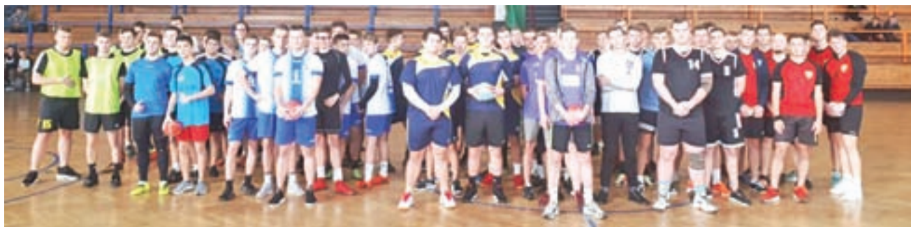
W turnieju powiatowym o mistrza zagrało siedem zespołów.