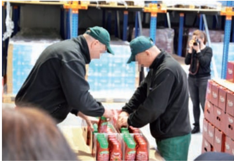
Zaraz po czwartkowej uroczystości pracę rozpoczynała druga tego dnia zmiana osadzonych.

W pierwszej kolejności do pracy kierowani są skazani posiadający zobowiązania alimentacyjne oraz inne zobowiązania finansowe, na przykład komornicze, które tym sposobem będą spłacane.