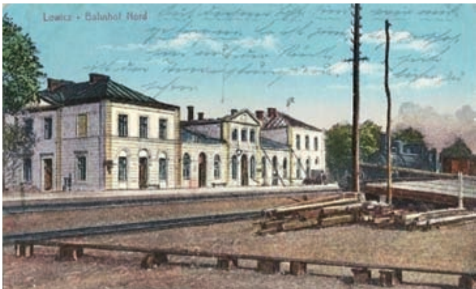
Tak wyglądał budynek dworca na przełomie 1914/1915 roku, przedstawiony na niemieckiej pocztówce.