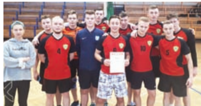
Szczyptę mistrzów z Blichu wygrali Półfinał Wojewódzki.