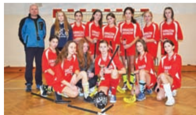
Dziewczyny z Kocierzewa Południowego mistrzyniami w unihokeja.