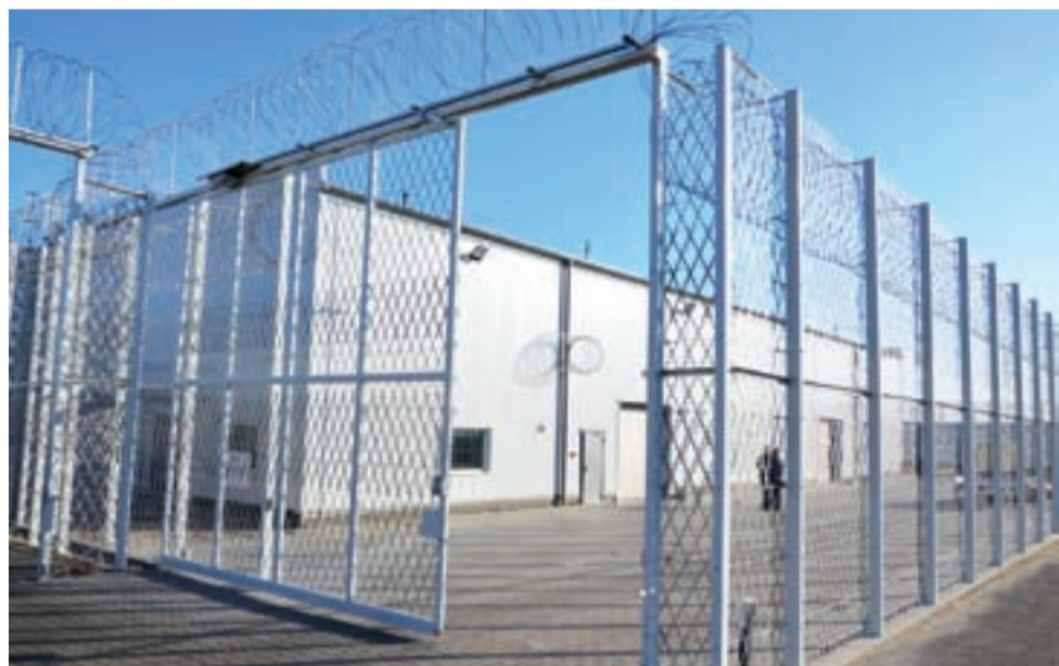
Tak prezentuje się nowa hala po oddaniu.

Praca w hali to przede wszystkim pakowanie i konfekcjonowanie, w tym na przykład przygotowywanie indywidualnych zamówień dla firm handlowych i oklejanie zamówień dodatkowymi oznaczeniami. Zakwalifikowani przechodzą wcześniej przeszkolenie. Zdobyte umiejętności, poza korzyściami odniesionymi już teraz, mogą ułatwić im znalezienie pracy po wyjściu na wolność. Jak mówią wychowawcy – ważnym czynnikiem jest też wyrabianie w nich systematyczności i poczucia obowiązku, których często brakuje wychodzącym po „odsiadce”. ■