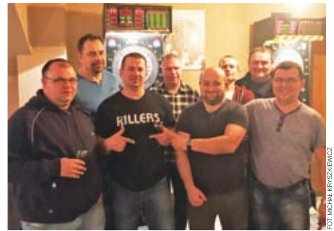
Uczestnikom turnieju darta humory dopisują.