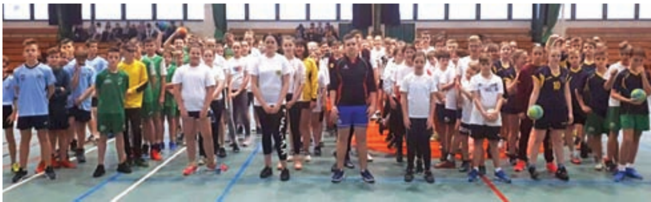
Uczestnicy mistrzostw Łowicza w piłce ręcznej.

Sport szkolny | Miejskie Igrzyska Dzieci w piłce ręcznej chłopców