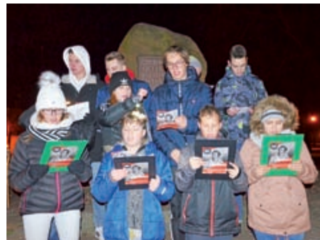
Pod pomnikiem Artura Zawiszy Czarnego młodzież odśpiewała „Warszawiankę”, po złożeniu kwiatów przez burmistrza.

Generał Stanisław Klicki to uczestnik walk w obronie Konstytucji 3 Maja, powstania kościuszkowskiego, Legionów Polskich, wojen napoleońskich i wreszcie powstania listopadowego. Przez krótki czas pełnił rolę zastępcy naczelnego wodza powstania, choć nie był zwolennikiem jego wybuchu. Najtrwalszą pamiątką po jego