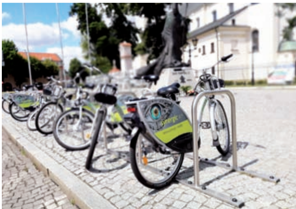
Rowery na Starym Rynku. Z tej stacji wypożyczono je przez miniony rok 2.383 razy.

Najczęściej korzystano z rowerów oczywiście w miesiącach najcieplejszych – w sierpniu tego roku zanotowano ich 3786, w lipcu 3484, w czerwcu 3163. Naj-