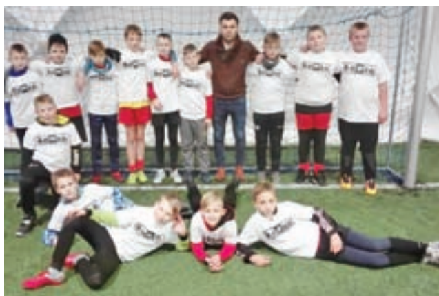
Zespoły młodzików GKS Bedno podczas Turnieju Piłki Nożnej KEEZA CUP Głuchołazy 2019.