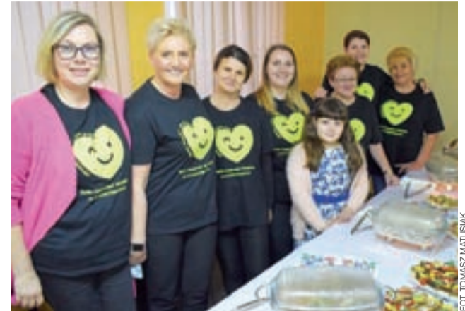
Koło Gospoń Wiejskich w Łyszkowicach zachęca do dbania o swoje zdrowie, czego niezbędnym elementem jest przemyślana dieta i świadomość tego, co się je.

Szacuje się, że około 70% zgonów można by znacząco odwrócić w czasie, gdyby ludzie stosowali się do zasad diety planetarnej.