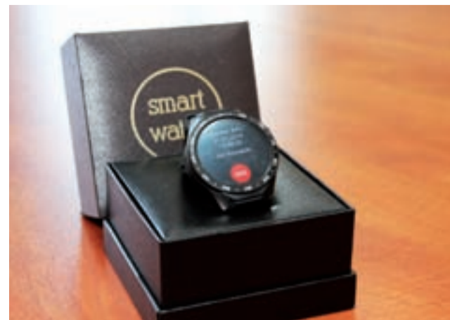
„Teleopaska” to urządzenie monitorujące podstawowe parametry życiowe – łączy w sobie funkcje ratunkowe, zegarka oraz telefonu.

O tym, że urządzenie to jest skuteczne, najlepiej świadczy statystyki. W Łodzi 1.500 osób korzysta z teleopasek i już 79 razy, za ich pośrednictwem, została udzielona pomoc służb medycznych. Opaski 25 razy zadziałały w momencie odnotowania alertu upadku osoby korzystającej z urządzenia. Kilka razy opaska była przydatna w zlokalizowaniu miejsca pobytu jej właściciela.