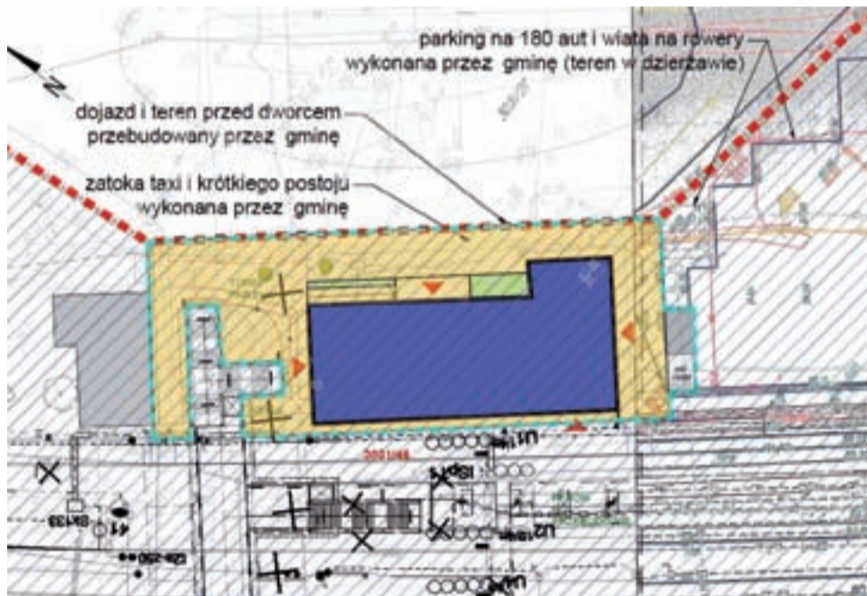
Widoczne na planie czerwone strzałki wskazują gdzie mają znajdować się wejścia do budynku przeznaczone dla pasażerów.

Przewiduje się utworzenie nowego korytarza prowadzącego do nowego wejścia od strony tunelu.