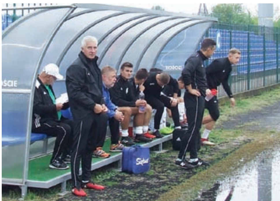
Praktycznie po każdym meczu sztab szkoleniowy Pelikana miał nad czym myśleć i wiele aspektów w grze zespołu było do poprawy.