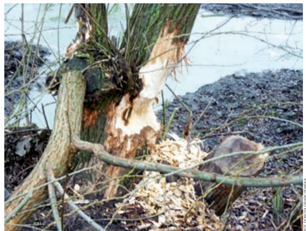
Bobry podcinały wiele drzew rosnących wokół prawie wyschniętego stawu.