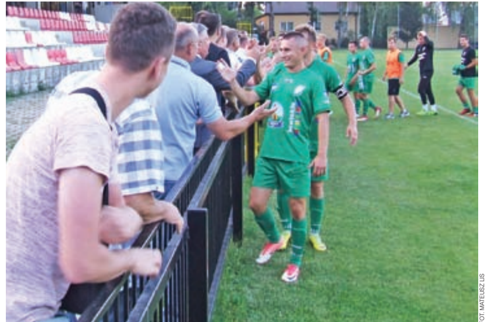
Piłkarze Ptaków na samym początku sezonu mieli najwięcej powodów do radości po meczach z beniaminkami. Na zdjęciu: radość po zwycięstwie w Grodzisku Mazowieckim.

– Nie wiem, kto to liczył, że będziemy wysoko i będziemy kandydatem do awansu. My chcieliśmy wygrywać w każdym meczu i być wysoko w tabeli. Mecz w Ostródzie – trzeba powiedzieć, że byliśmy tam słabszym zespołem, ale patrząc na to, po jakimś