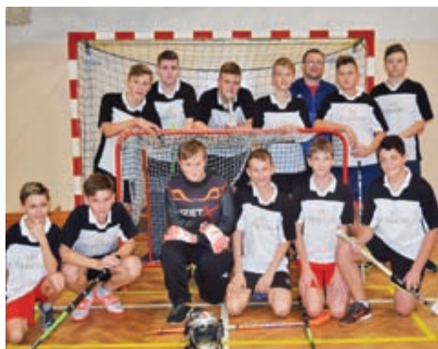
Zespół z Bąkowa Górnego zagrał najlepiej.

Sport szkolny | Powiatowe Igrzyska Młodzieży Szkolnej w unihokeju chłopców