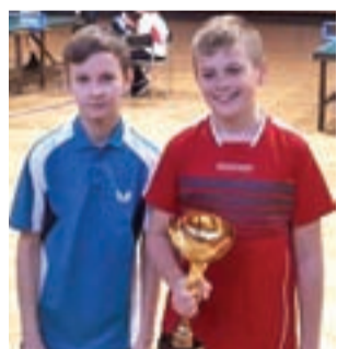
Łowiccy tenisiści bliscy medalu Finału Wojewódzkiego.

■ Wyniki: SP 2 Wieruszów – SP 2 Łowicz 2:3, SP 2 Łowicz – SP Pawlikowice 1:3, SP 2 Łowicz – SP Biała 3:2, SP 8 Zgierz – SP 2 Łowicz 2:3.