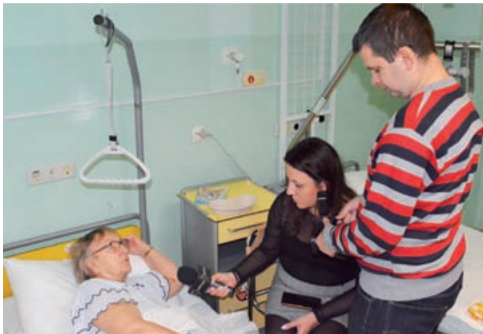
O opasce pozytywnie wypowiadali się dla starostwa ludzie chorzy.