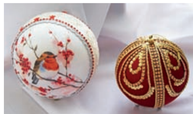
Piękne bombki i inne ozdoby na świąteczny stół uczestnicy UTW robią już od początku listopada.

– Wszyscy na wsi się boją, bo nie wiadomo, kogo tym razem zaatakuje podpalacz – mówi roztrzęsiona kobieta. str. 3