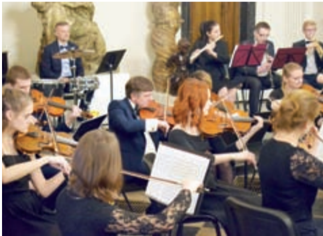
Łowicka Orkiestra Kameralna gra Mazura z „Halki”, najbardziej chyba znanego dzieła Stanisława Moniuszki.

Koncert rozpoczął się występem uczniów Samorządowej Szkoły Muzycznej I stopnia w Łowiczu, którzy zaprezentowali „Pieśń wieczorną”. Później