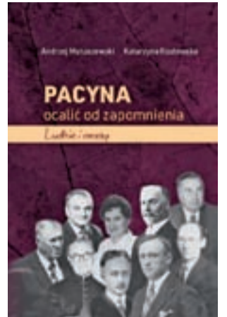
Okładka książki, której promocja odbędzie się w szkole w Pacynie.