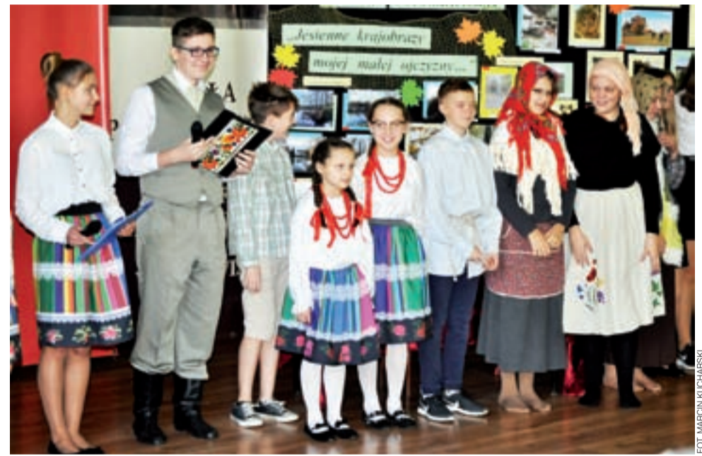
Uczniowie Szkoły Podstawowej w Błędowie w gminie Chaśno w oczekiwaniu na rozstrzygnięcie konkursów.

Bezpośrednio po apelu rozstrzygnięty został międzyszkolny konkurs fotograficzny, który skierowany był do uczniów klas