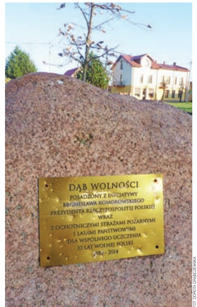
Tablica Dębu Wolności zniszczona przez wandalów.

Wszystkie postępowania prowadzi policjanci z Komisariatu Policji w Żychlinie. dag