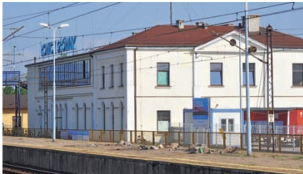
Tak wyglądał dworzec w chwili rozpoczęcia modernizacji linii kolejowej E-20. Na zdjęciu z lewej strony widać jeszcze fragment nieistniejącej już kładki nad torami.

Łowicz Główny | PKP S.A. ogłosiła ważny przetarg