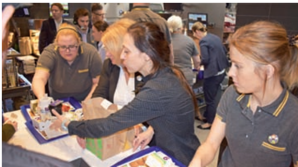
Zamówień było mnóstwo, ale kasjerki robiły co się dało, by było jak najszybciej – w końcu to fast food.

– To jest od tej pory najlepsza restauracja w Łowiczu – mówili