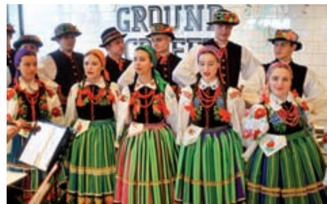
„Blichowiaci” występowali już na różnych uroczystościach, ale nigdy wcześniej na otwarciu baru szybkiej obsługi.

ży. Wielu internautów sztydzi też, czasem w niewybredny sposób z zainteresowania jakim cieszyło się otwarcie lokalu.