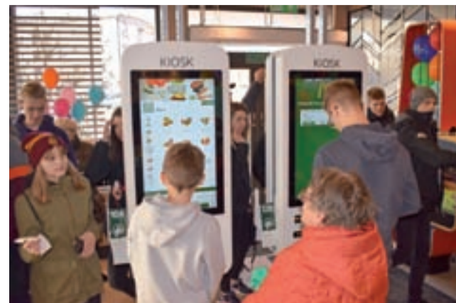
Jeśli komuś nie chce się stać w kolejce do kasy, jest na to sposób – można złożyć zamówienie za pomocą urządzeń z ekranami dotykowymi.

Oczywiście zdania pozytywne przeplatają się też z negatywnymi, niektórzy obawiają się, że wkrótce przełoży się to na złe nawyki żywieniowe, także dzieci i młodzie-