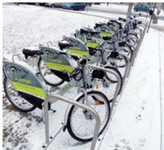
Tak to wyglądało w styczniu 2019: śnieg, wilgoć, minimalne zainteresowanie. Mimo to operator systemu uważa, że wypożyczanie całoroczne to dobry kierunek.