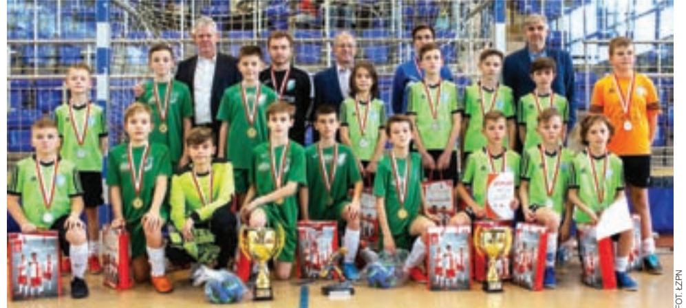
Gracze Pelikana i RAP-u Radomsko po meczu finałowym z pucharami, medalami i nagrodami.