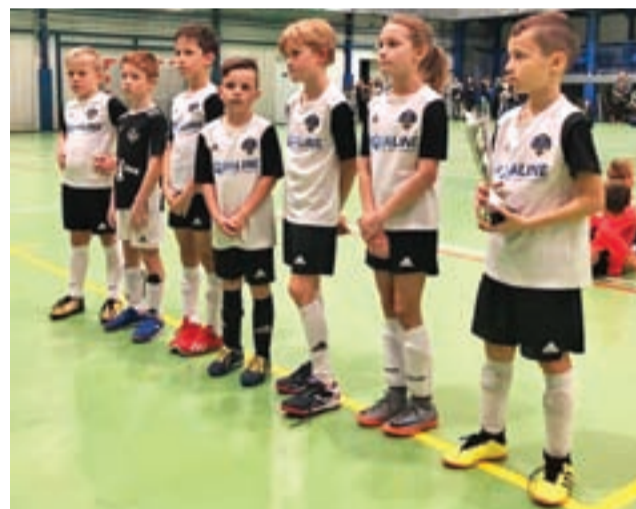
Drużyna Soccer Kids okazała się zwyciężką.

W turnieju który odbył się w Zgierzu grano z oficjalnymi wynikami i drużyna z Łowicza zajęła wysokie trzecie miejsce. Soccer Kids po wygraniu czterech z pięciu grupowych spotkań (w piątym był remis) i bilansie bramkowym 13:2 przystąpił do meczu półfinałowego z MKS Zduńska Wola. Rywalę już w 1. minucie strzelili gola, zaś Soccer Kids w dalszych minutach bił głową w mur.