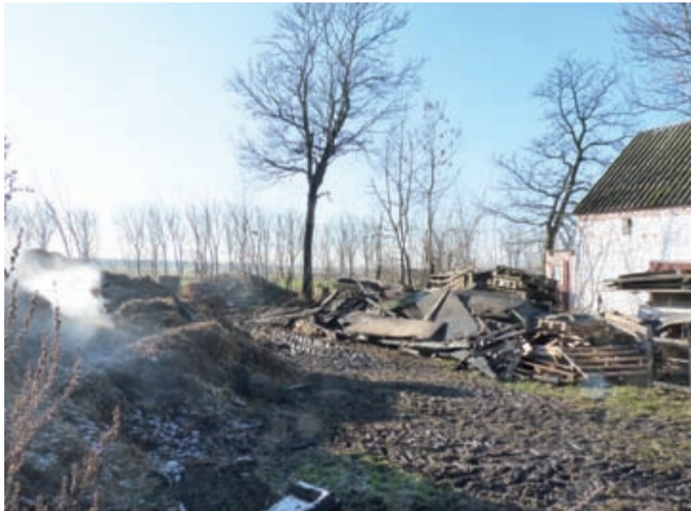
W Orłowie podpalacz zaatakował po raz siódmy. Spłonęła drewniana stodoła ze słomą i sianem.

– Jeszcze o godz. 21.00 wychodziłem na pole, by wziąć z przymy kieszonkę z kukurydzy dla zwierząt i nic nie było widać – mówi