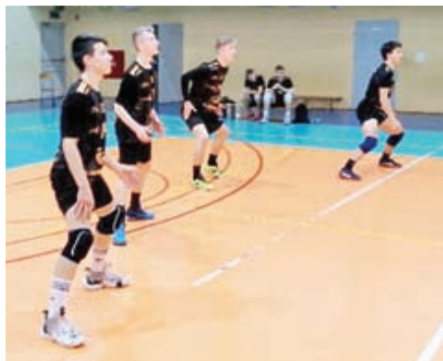
W meczach 4. kolejki II Ligi Mężczyzn KALS drużyna Akademii Siatkówki Żychlin odniosła zwycięstwo w obu rozegranych w tym dniu meczach.

Następne rozgrywki II Ligi Mężczyzn Kutnowskiej Ama-