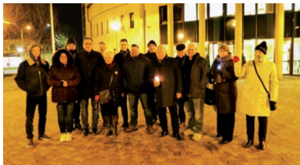
Grupa protestujących, którzy spotkali się w poniedziałek, 2 grudnia przed Sądem Rejonowym w Łowiczu.

Obecne protesty będą ponawiane, ale nie codziennie. mwk