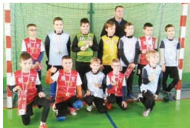
Najmłodsza grupa piłkarzy GKS Bedno w kategorii Orlik rywalizowała w Turnieju Piłki Nożnej KEEZA CUP Głuchołazy 2019.