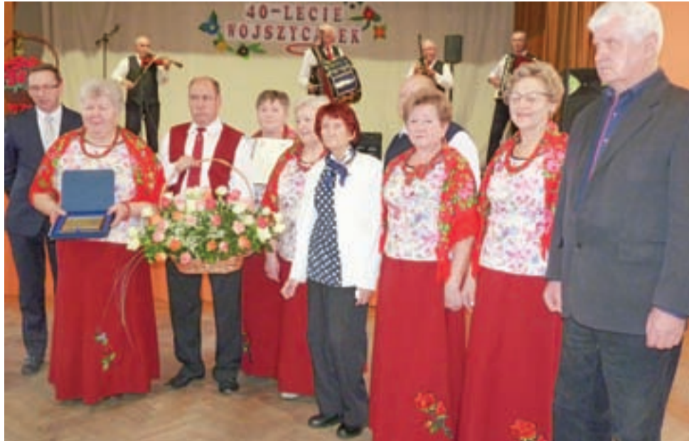
Zespół Śpiewaczy Wojszycanki otrzymał od wójta kosz z 40 różami oraz okolicznościowy graweron.

40 lat minęło jak jeden dzień. Przez wszystkie lata Wojszycanki uczestniczyły w wielu przeglądach i festiwalach. Efektem jest 20 różnych statuetek. Były nagrody i wyróżnienia. Swoim śpiewem kultywowały ludowe tradycje i promowały gminę Bedlno. Wy różniła je zawsze to, że występowały w ludowych strojach łowickich.