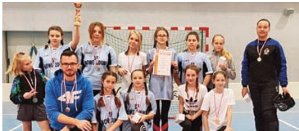
Hokeistki z Nowych Zdun ze srebrnymi medalami.