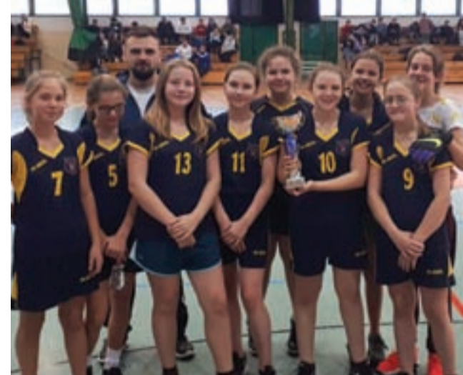
Reprezentacja Pijarskiej zdobyła mistrza powiatu w szczyptę mistrzów.