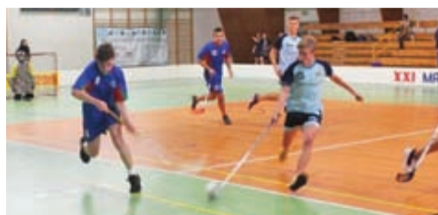
Jeden z meczów chłopców reprezentujących SP w Pacynie podczas Finału Mistrzostw Rejonu Płockiego Szkół Podstawowych w unihokeju.

Wyniki chłopców: SP Słubice – SP 18 Płock 1:7, SP Słubice – SP