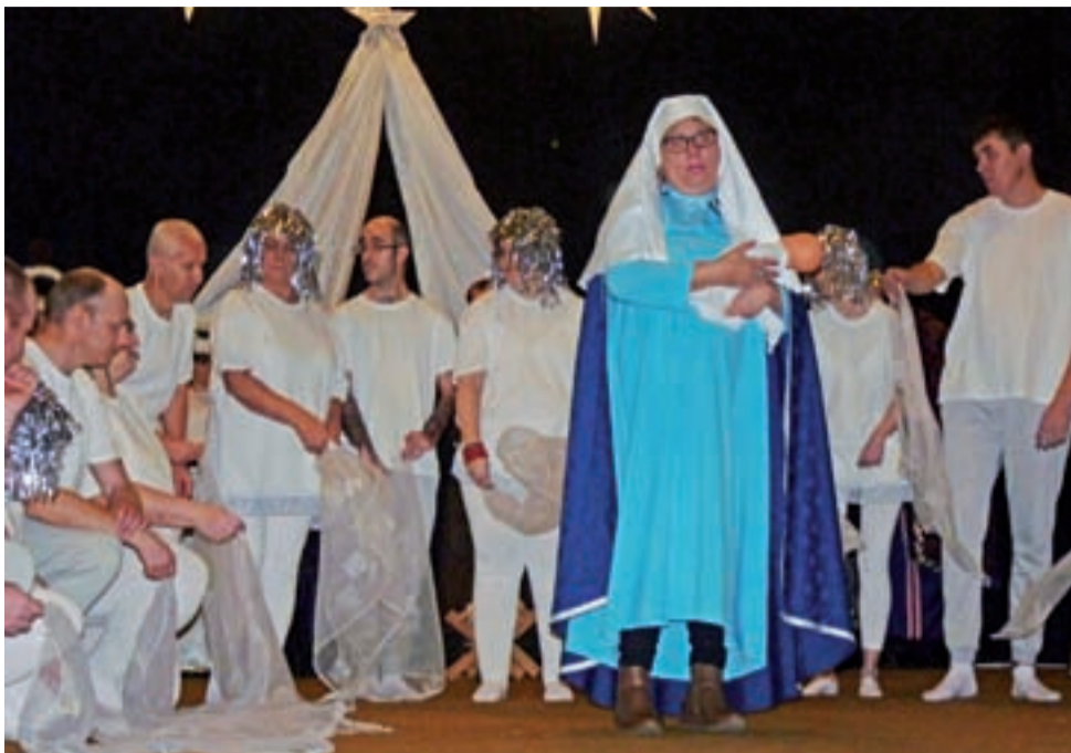
Podopieczni Warsztatów Terapii zajęciowej w Żychlinie podczas ponadregionalnej imprezy wigilijnej zaprezentowali pantomimę z narodzin Jezusa.