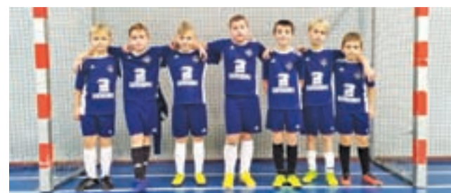
Drużyna Soccer Kids 2010 na turnieju w Bedlnie.