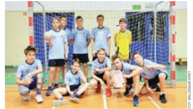
Ekipa SP 1 Łowicz awansowała na Finały Wojewódzkie.