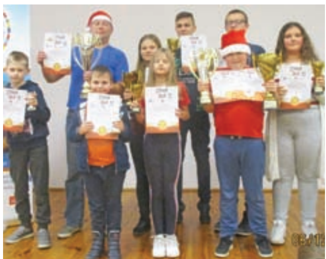
Najlepsi zawodnicy Otwartych Mistrzostw Łowicza w szachach błyskawicznych.