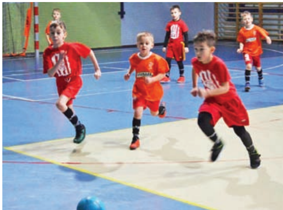
W weekend odbył się kolejny Turniej Piłki Nożnej Keeza Cup, którego organizatorem był Gminny Klub Sportowy Bedno.