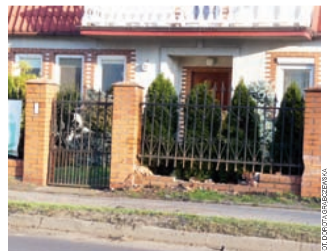
22-letni kierowca nie dostosował prędkości do panujących warunków i uderzył samochodem w ogrodzenie, przejeżdżając przez chodnik.

Łatwiej w pokonaniu podejźdu będą mieć też opiekunowie osób starszych na wózkach inwalidzkich. Z dotychczasowych stromych zjazdów trudno było korzystać w obawie, by osoba niepełnosprawna nie wypadła z wózka. Większość wolała jechać okrężną drogą, ale bardziej płaską i bezpieczną. dag