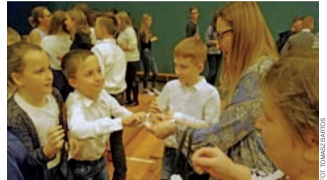
W Dzierżgówku po świątecznym przedstawieniu zebrani dzieliли się wspólnie opłatkami.