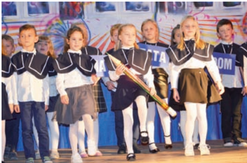
„Razem uczymy się literek, bo litery ważne są. Można z nich ułożyć słowa: mama, tata oraz dom” – śpiewały dzieci z klasy I A łowickiej „Dwójki” podczas Święta Szkoły.

Szczególne podziękowanie otrzymali nieobecni na uroczy-