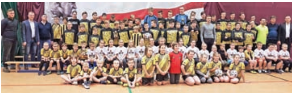
Do pamiątkowego zdjęcia stanęli wszyscy zawodnicy i ich trenerzy Astry Zduny.