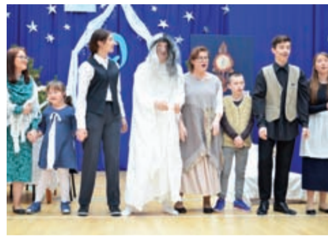
Uczestnicy spektaklu w utworze końcowym.

Po szczęśliwym zakończeniu historii sknery, który przeszedł po-