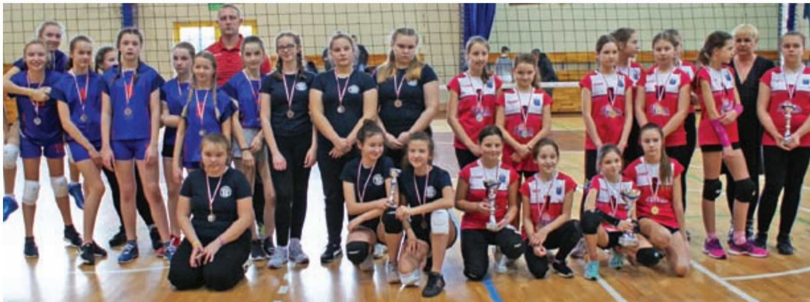
Zespoły siatkarskie dziewcząt biorące udział w Mikołajkowym Turnieju Piłki Siatkowej "4" Dziewcząt w Żychlinie.

Piłka siatkowa | Mikołajkowy Turniej „4” dziewcząt