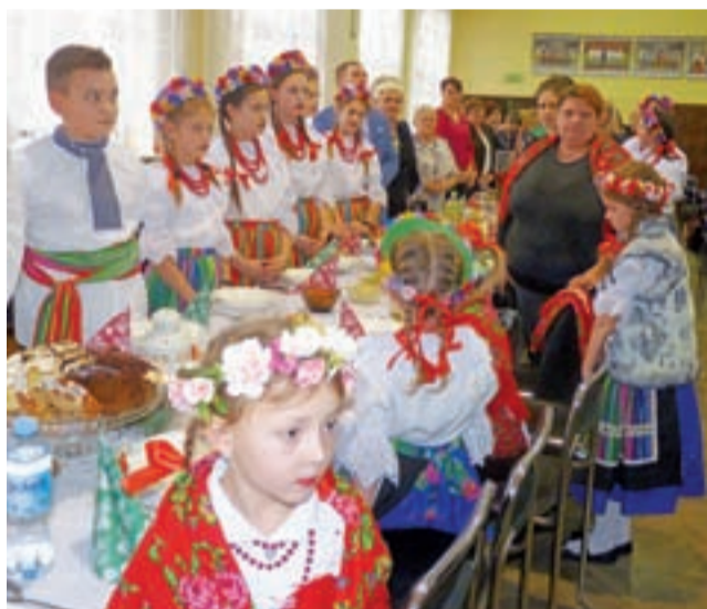
Do wigilijnego stołu zasiadły też dzieci z zespołu Ester Folk, które uświetniły uroczystość.

– Serdecznie witam wszystkich przybyłych mieszkańców gminy –