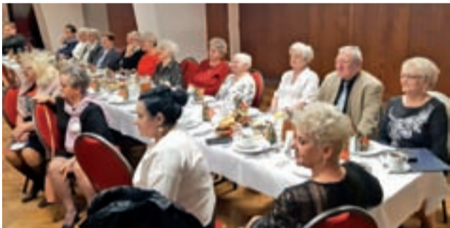
Spotkanie mieszkańców dzielnicy Kostka odbyło się w sali przy ul. Powstańców.

składają Radni Rady Miejskiej w Strykowie, Burmistrz Strykowa wraz z Pracownikami