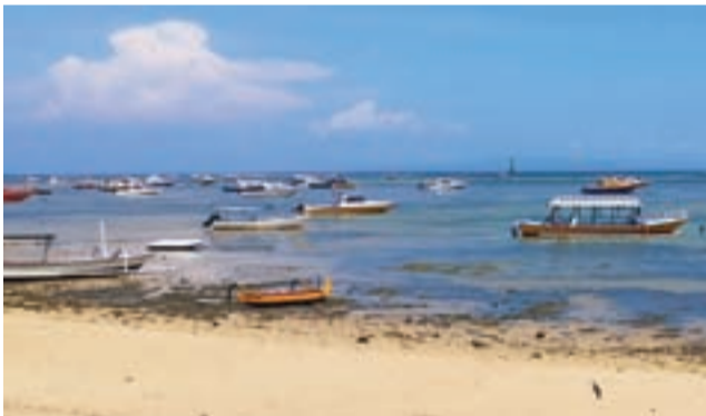
Bali: rajskie plaże – ale i miejsce ciężkiej pracy.