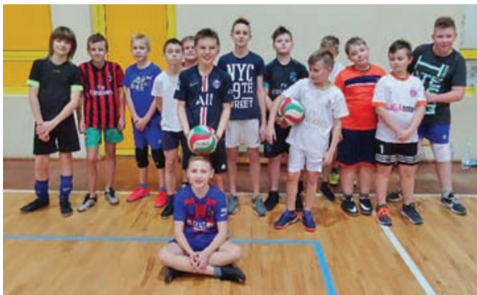
Zespoły siatkarskie chłopców, którzy rywalizowali w ramach Gminnego Turnieju Czwórek Siatkarskich Dziewcząt i Chłopców.