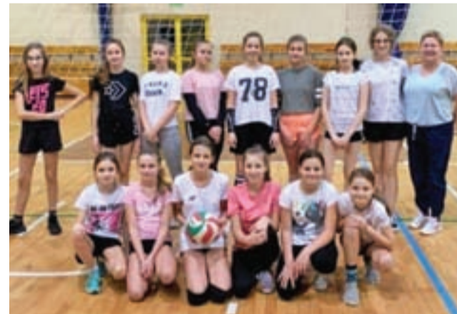
Drużyny siatkarskie dziewcząt biorące udział w Gminnym Turnieju Mini Piłki Siatkowej Czwórek Dziewcząt i Chłopców, który odbył się w żychlińskiej hali sportowej.