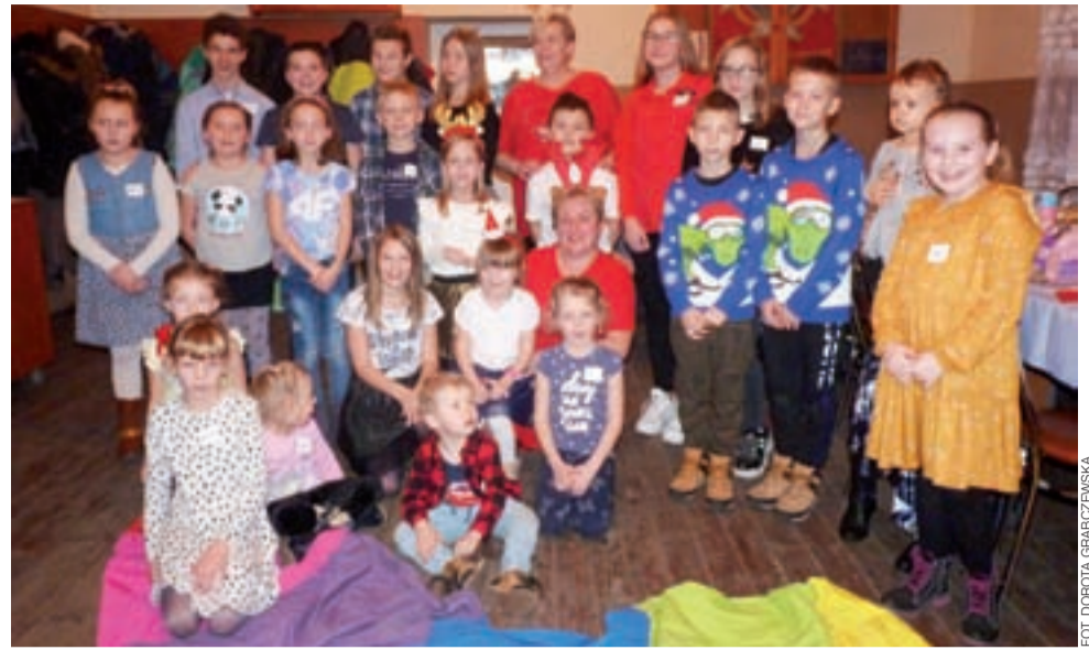
Po raz pierwszy w sołectwie Plecka Dąbrowa zorganizowano zabawę Mikołajkową dla dzieci.

– Widzę, że ludzie coraz chętniej chcą ze sobą spędzać czas, chcą się razem bawić. Dlatego podejmujemy się trudu organizacji lokalnych imprez, któ-