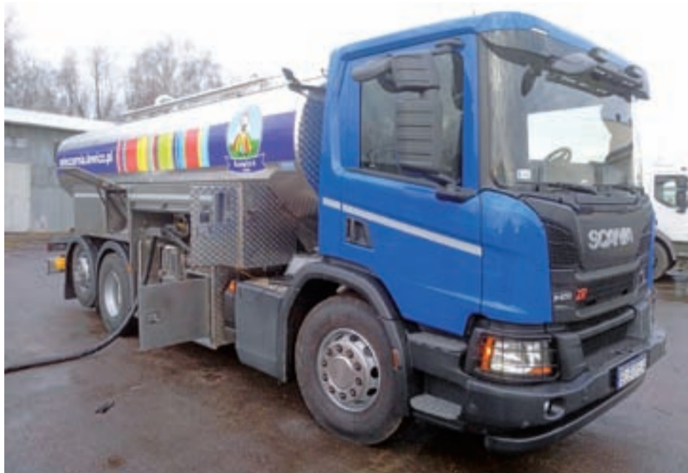
Nowe autocysterny Okręgowej Spółdzielni Mleczarskiej w Łowiczu są ozdabiane w elementy towickie.

Nawet kierowca obsługujący pobór mleka nie będzie wiedział, do której spośród kilkudziesięciu (54) fiolek ułożonych na planie okręgu trafia próbka pobrana w gospodarstwie mleka.