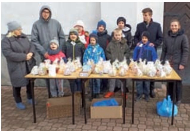
Grupa ze świetlicy Słonko sprzedająca ozdoby świąteczne pod kościołem pw. Świętego Ducha.

Młodych ludzi można było spotkać w tym roku nie tylko przy kościele parafialnym, ale także przy kościele oo. pijarów. Podopieczni wykonali samodzielnie na po-