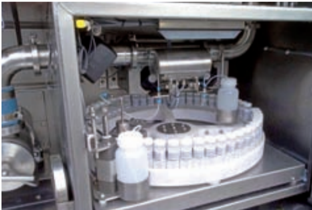
Tak wygląda „karuzela” do której trafiają próbki mleka pobrane w gospodarstwach.