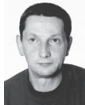
Grzegorz Stankiewicz (1962–2018)

Dodatkowych lekcji udzielał też tym dzieciom, które przygotowywały się do konkursów i olimpiad lub do matury z matematyki. I to właśnie spotkania z tymi zdolnymi dziećmi dawały mu największą radość. Mówił, że na lekcjach z nimi się nie męczy, mógł im pokazać jak rozwiązać pewne zadania w szybszy i prostszy sposób. Spotkania z dziećmi, które miały już wiedzę, ale chciały coś więcej w matematyce osiągnąć, traktował jak zabawę. W swojej karierze nie miał ich zbyt wielu, zdecydowaną większość stanowiły dzieci z trudnościami w nauce matematyki lub były zwyczajnie leniwe. – Dzieci, które potrafiły wmówić rodzicom, że matematyka jest „be”, czasami po jednej godzinie zmieniały podejście. Zaczynały rozumieć, że matematyka jest przydatna i można nią komuś zaimponować, na przykład dzięki jakiejś zagadce – wspomina żona.