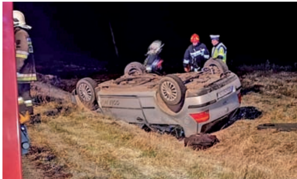
Volkswagen Golf, którym podróżował drogą Kiernozi – Luszyń 42-letni mężczyzna z 11-letnim chłopcem, wypadł z drogi i dachował.

W wyniku dachowania kierowca nie doznał obrażeń ciała. Wraz z nim podróżował jednak 11-letni chłopiec, który został przewieziony na badania do szpitala w Płocku. mwk