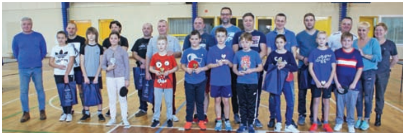
Uczestnicy 9. edycji Rodzinnego Turnieju Tenisa Stołowego 2019 wraz z organizatorami reprezentującymi Stowarzyszenie Przyjaciele Dwójki.