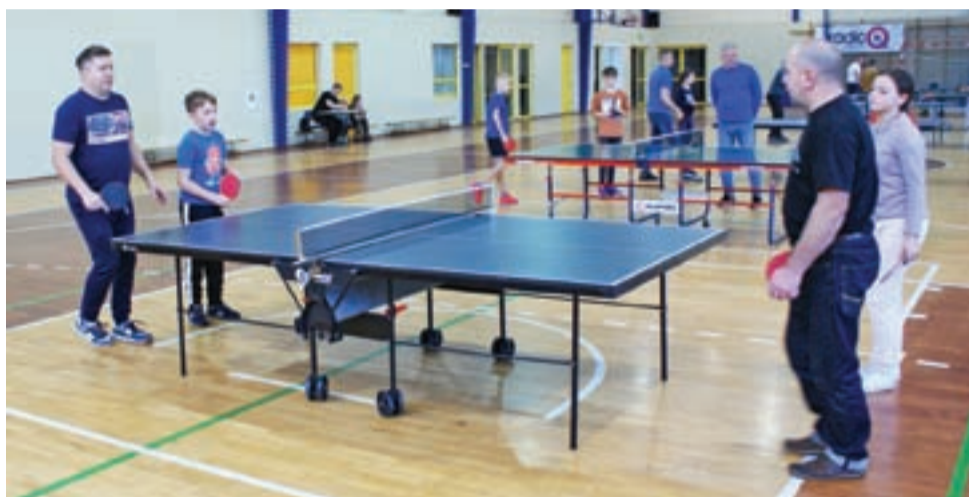
Rozgrywki meczowe w rodzinnym turnieju tenisa stołowego 2019.

Nad sprawnym prowadzeniem turnieju czuwali nauczyciele wy-