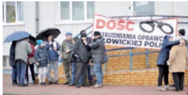
W pikiecie uczestniczyło kilkanaście osób. Zgromadzili się przy wejściu do komendy od strony ul. Długiej.

Pikietujący rozwinęli w piątek przy komendzie tylko jeden transparent z napisem „Dość zatrudniania oprawców w łowickiej