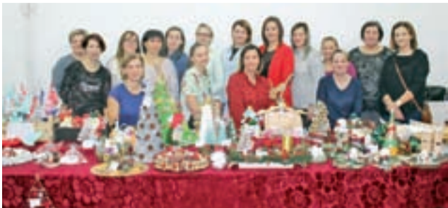
Sukcesem okazał się kiermasz świąteczny zorganizowany przez Radę Rodziców.