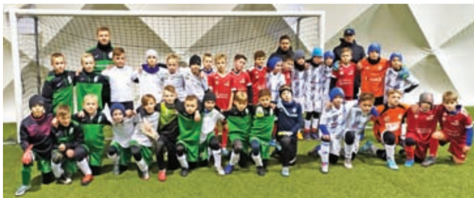
Pelikan 2009 zagrał w Płocku z Błękitnymi Gąbin.

W meczu z Błękitnymi który trwał przez półtorej godziny wzięło udział aż 16 zawodników „Biało-Zielonych”. – Graliśmy przez 90 minut na dwóch boiskach, także było bardzo intensywnie. Obydwie nasze drużyny dobrze funkcjonowały w grze kombinacyjnej. Z każdym treningiem robimy progres jeśli chodzi o otwarcie gry czy to od bramki, z auto czy ze stałego fragmentu gry. Nie robimy tego może jeszcze w sposób