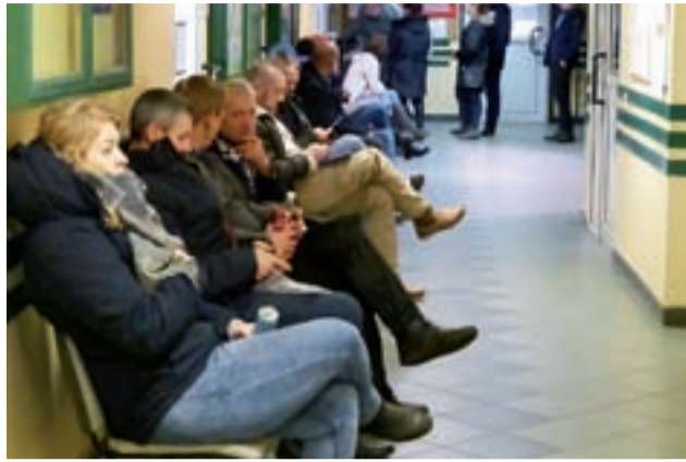
Gdy w środę, 18 grudnia nasz reporter robił to zdjęcie, w kolejce do wydziału komunikacji w Łowiczu czekało „zaledwie” około 20 osób.