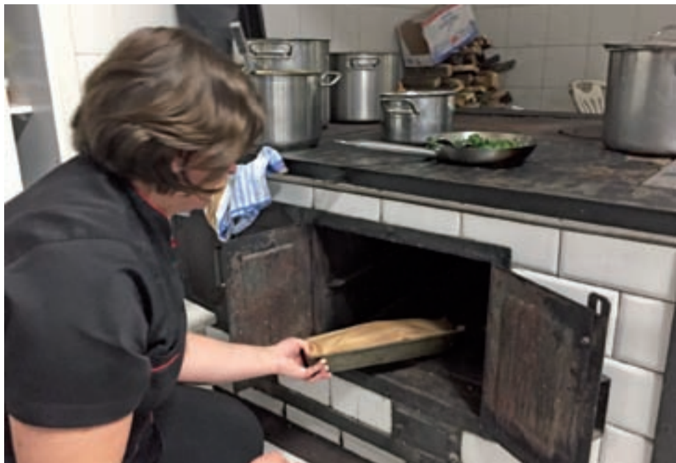
Pierwszy świąteczny makowiec już trafia do piekarnika. Na pracowniczą wigilię potrzeba ich sześć.