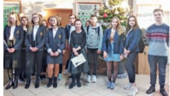
Grupowe zdjęcie uczestników konkursu ortograficznego w I LO.

Horacy. Nie przepadam za jego towarzystwem, bo jest hipochondrykiem”. Zdaniem organizatorów, trudność sprawy nie typowe pod względem ortograficznym wyrazi, choć dosyć popularne, np. „Z ponad dwudziestu gadeł wydobyl się pelen niezadowolonia, ledwo słyszalny pomruk” i „Spomad chmur wyjrzało słońce”. aa