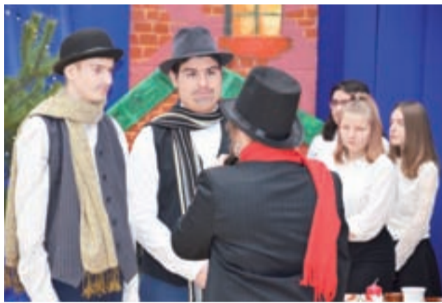
Jedna ze scen końcowych, w której odmieniony już Scrooge przekazuje pieniądze dla organizacji dobroczynnej.

– Miałem perukę ciągle opadającą na twarz, więc nawet jak miałem na twarzy stres, nie mogło być tego widać z publiczności – mówił