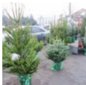
Ruch na tym stoisku zacznie się na dobre od dziś.

Na razie kupujących nie było zbyt wielu. Wprawdzie sprzedawcy przekonywali, że drzewko można postawić na balkonie, ale świeżo ścięte przez wiele dni ma piękny zapach lasu, a jak postoi traci wiele swojej wartości. Choinki z pojemnikami są zwykle mniejsze, na pewno podlewane i stoją w mieszkaniu dłużej. Niektórzy myślą, że po świątach przesadzą je do ogródka, by rosły dalej. Ale to raczej mit, gdyż system korzeniowy drzewka podczas wykopywania zostaje zwykle na tyle uszkodzony, że drzewo w nowym miejscu rzadko się przyjmuje.