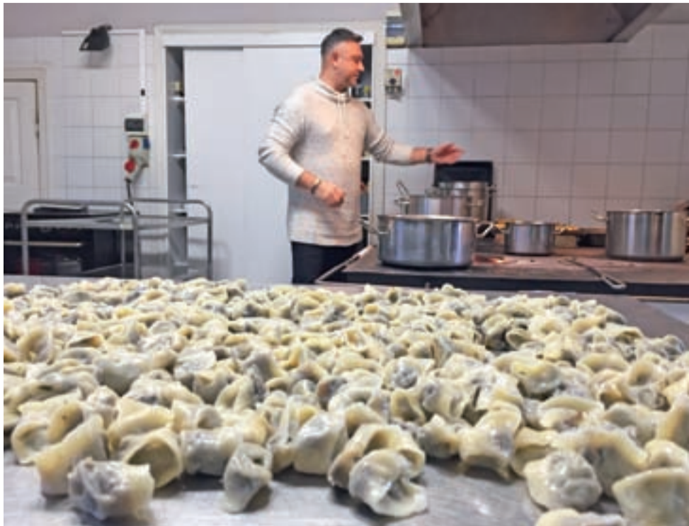
Uszka na wigilię już przygotowane.