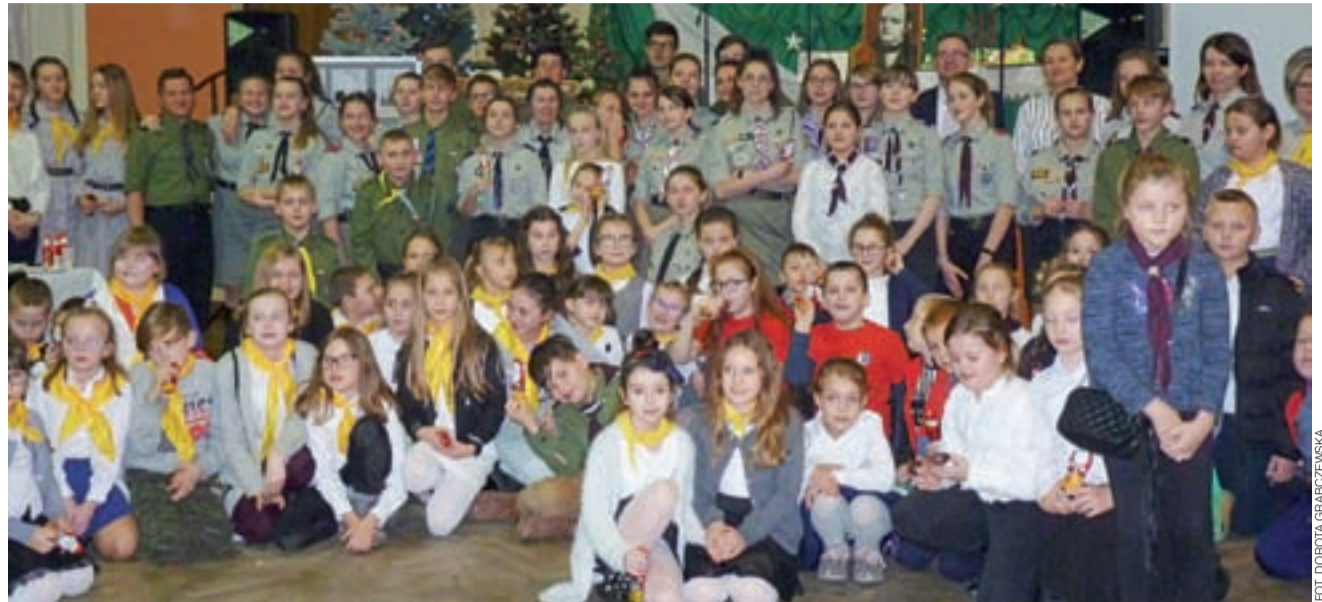
Pamiątkowe zdjęcie harcerzy i zuchów wraz z gośćmi podczas harcerskiej Wigilii 2019 roku.

Młodzież szkolna z SP Bedno przygotowała przedstawienie nawiązujące do życia i twórczości wielkiego Polaka, ojca polskiej opery Stanisława Moniuszki, gdyż rok 2019 był rokiem Moniuszkowskim, w 200. rocznicę jego urodzin. To była lekcja histo-