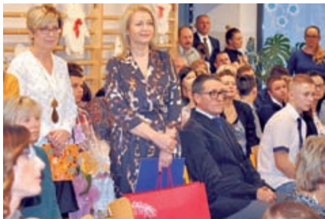
Wiele osób przekazało nie tylko życzenia, ale również mnóstwo prezentów dla wychowanków ośrodka, a nawet pieniądze.