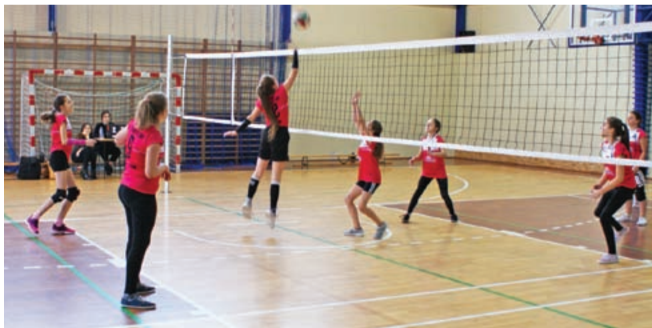
Mikołajkowe rozgrywki „Czwórek” siatkarskich dziewcząt w hali sportowej w Żychlinie.