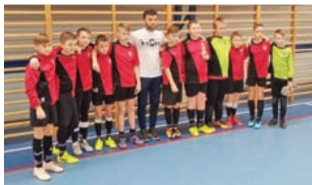
Ekipa młodych piłkarzy GKS Bedno rocznika 2007, 2008 biorąca udział w rozgrywkach Keeza Cup zorganizowanego przez GKS w Bedlnie.