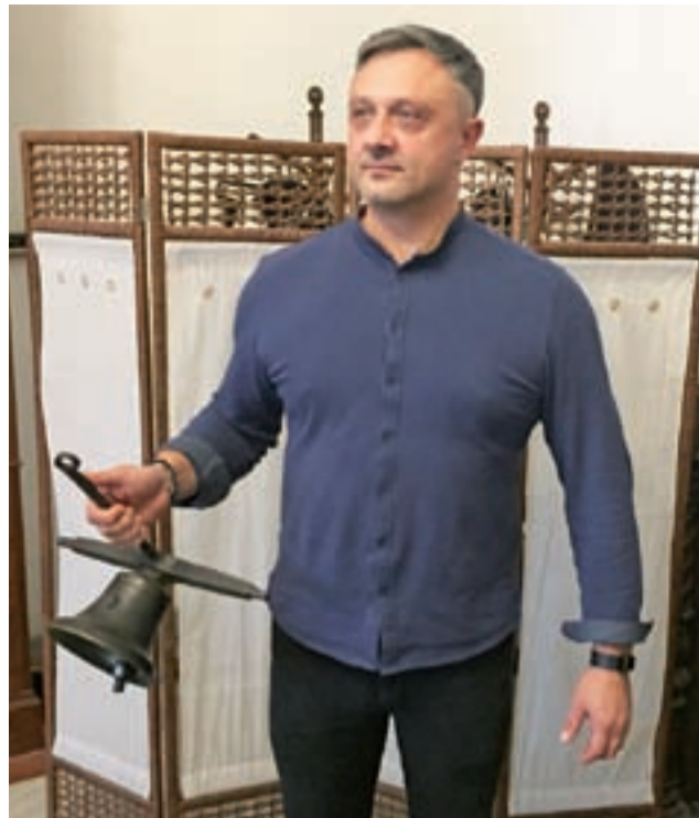
Tym dzwonkiem goście przyzywani są na obiad.