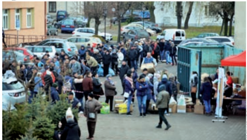
Takie tłumy zastaliśmy pod łowickim starostwem w poniedziałek o godzinie 12.