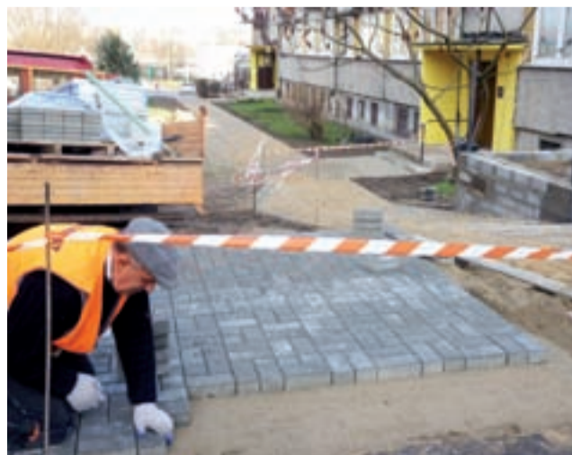
Do Świąt ciąg pieszy wzdłuż Konopnickiej 5a, od Biedronki do TESCO wraz z dodatkowymi miejscami postojowymi zostanie zakończony.

Pracownicy firmy Budomat, która wykonuje zlecenie, kończą układanie kostki polbrukowej w dwóch miejscach, gdzie będą urządzone dodatkowe 4 miejsca parkingowe, tak potrzebne dla pacjentów korzystających z usług PZO Almamed. Do wykończenia zostało wykonanie tynku na fragmencie postawio-