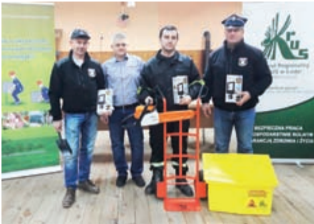
W piątek, 13 grudnia, strażacy z OSP Tomczyce uczestniczyli w szkoleniu KRUS. W nagrodę otrzymali piłę i sprzęt o wartości prawie 1.500 zł.