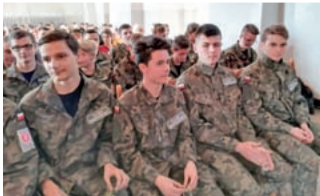
Uczniowie ZSP1 z grupy mundurowej, podczas uroczystości pasowania.