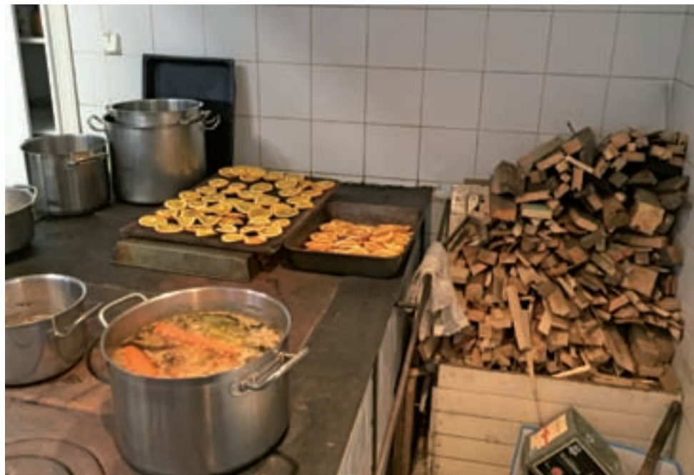
Kuchnia jest opalana drewnem i węglem. Rozpala się ją co rano na nowo.

Nieborów | Niektórzy goście chcą tu wracać co roku