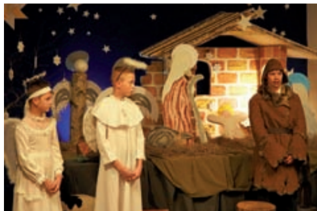
Jasełka w wykonaniu podopiecznych MOS w Kiernozi.