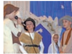
W Nieborowie wystawione zostały jasełka w tradycyjnej formie.