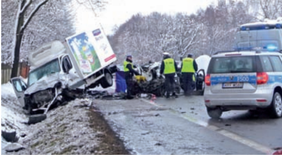
Miejsce wypadku. Pozostałości samochodów służby usuwały jeszcze przez wiele godzin po zdarzeniu.

Na miejscu zdarzenia śmierć ponieśli dwaj mężczyźni – 25-letni oraz 44-letni, będący pasażerami Opla. Pięcioro poszkodowanych, w tym dwoje w stanie ciężkim, przetransportowano do szpitali w Zgierzu, Łodzi i Brzezinach. Wśród nich znajdowali się także kierowcy pozostałych pojazdów: 53-letni mieszkaniec powiatu pabianickiego, kierujący dostawczym Mercedeselem oraz 62-letnia mieszkanka powiatu zgierskiego, prowadząca pojazd marki Kia. Ich życiu nie zagraża niebezpieczeństwo. Poszkodowanej została również sprawca wypadku, czyli kierowca Opla Insignii.