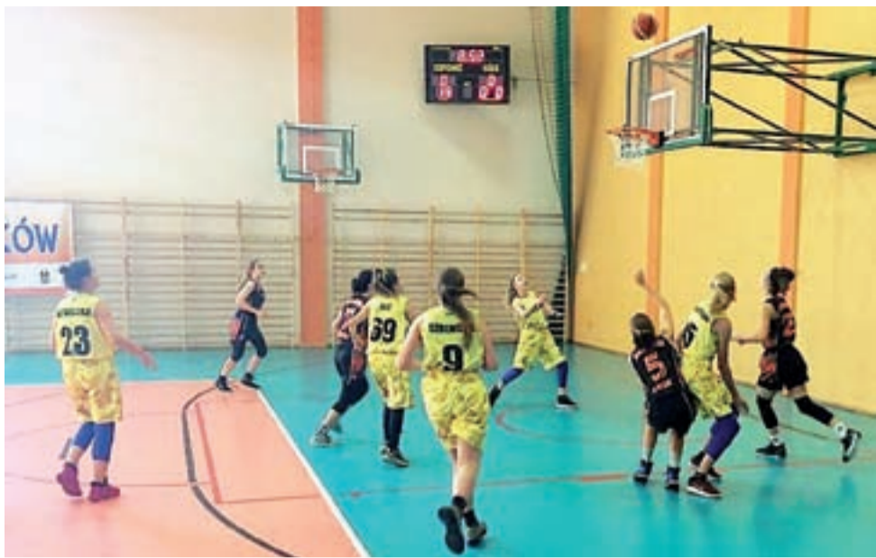
Koszykarki TK Basket Stryków (żółte stroje) plasują się w środku stawki Wojewódzkiej Ligi do lat 16 i raczej nie poprawią już swojej pozycji.