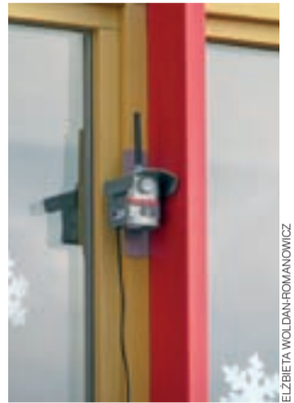
Nowy czujnik. To urządzenie kontroluje jakość powietrza przy Szkole Podstawowej nr 2 w Głownie.

Dodajmy, że z obserwacji obecnych na sali osób wynika, iż wspomniany problem z zadymieniem miasta narasta poza godzinami możliwej kontroli, zwłaszcza w weekendy.