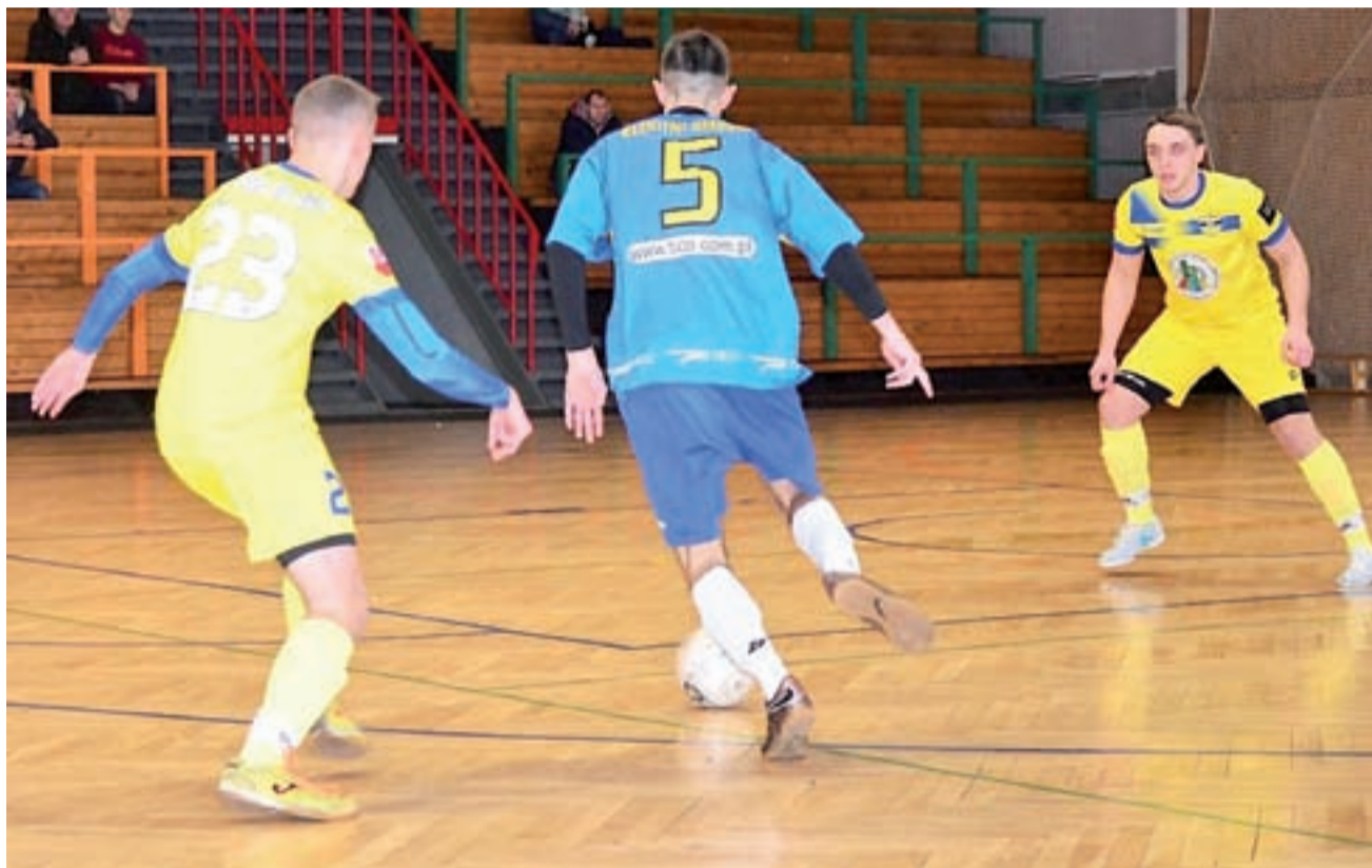
Błękitni Dmosin (niebieskie stroje) po zaledwie roku przerwy mogą wrócić na najwyższy szczebel rozgrywek Łowickiej Ligi Futsalu.

Świetnie spisali się także zawodnicy drugiej drużyny Błękitnych, którzy gładko pokonali FC Łaguszew 3:0. Dwie bramki zdobył najskuteczniejszy gracz re-