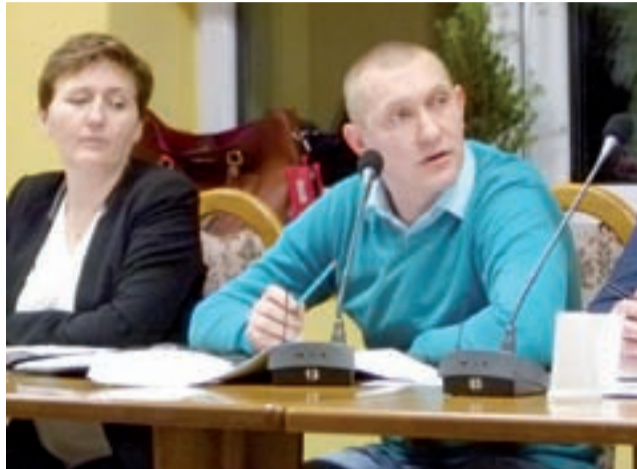
Trzeba wyremontować klatkę schodową. Radny Piotr Kałuża mówił o potrzebach remontowych w strażnicy OSP w Mąkolicach, ale tej jednostce nie przypadły w tegorocznym podziale środki przeznaczone na modernizację strażnic.

Na sesji stycznia budżet nie był już tak szczegółowo analizowany jak na komisji. Radni Piotr Kałuża i Eligiusz Dąbek wycofali się z prób złożenia nowych wniosków, więc te nie były głosowane. Piotr Kałuża chciał zaproponować zabezpieczenie 10 tys. zł na remont klatki schodowej (po pożarze) w strażnicy OSP w Mąkolicach, ale okazało się, że środki na remonty strażnic zostały już, na