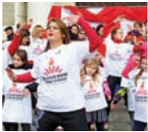
Zdjęcie z jednej z poprzednich edycji akcji „One Billion Rising” (w Polsce jako „Nazywam się Miliard”).