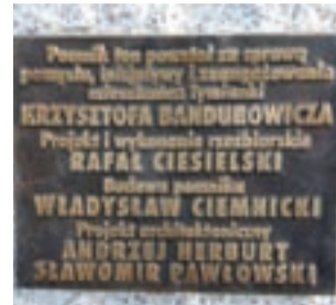
Boczna tabliczka umieszczona na pomniku.