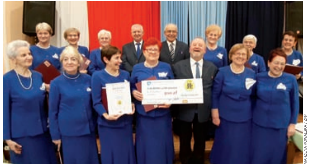
Członkowie chóru „Słoneczny Krąg” nie ukrywali radości z otrzymanej nagrody.

– Repertuar mamy zróżnicowany oscylujący pomiędzy tematyką lekką i poważniejszą, dlatego możemy występować podczas wielu uroczystości. Śpiewamy