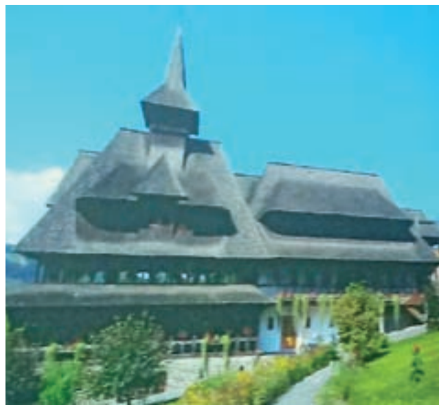
Wrażenie na prelegencje zrobiła m.in. rumuńska architektura drewniana regionu Maramures, której przykład widoczny jest na zdjęciu.