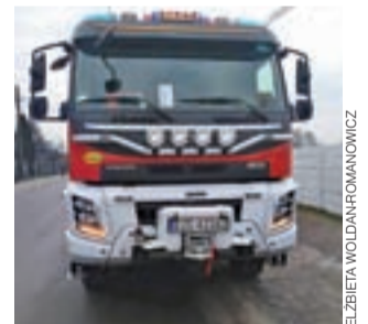
Nówka sztuka. GCBA Volvo do pierwszej akcji wyjechał w dniu wprowadzenia go do podziału bojowego JRG PSP w Strykowie 30 stycznia.

Jego atutem jest duża kabina, umożliwiająca strażakom ubranie się w trakcie jazdy w środku ochrony indywidualnej i zabranie sprzętu. Wartość samochodu bez wyposażenia to 1.100.000 zł. Sta-