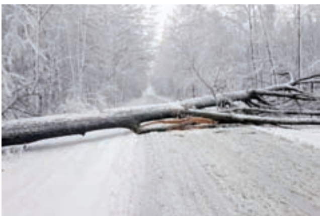
Drzewo uniemożliwiające przejazd w okolicach Glinnika.

W wyniku wypadku droga krajowa nr 14 była zablokowana przez wiele godzin. Policja zorganizowała objazdy przez Dobrą, a następnie drogą krajową nr 71. Po udzieleniu pomocy osobom poszkodowanym prowadzono oględziny miejsca zdarzenia oraz zabezpieczono ślady po wypadku. Ostatecznie, utrudnienia udało się usunąć dopiero po godzinie 20.15. aw