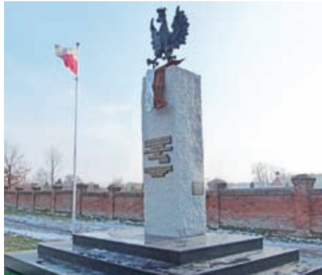
Pomnik na 100-lecie Odzyskania Niepodległości przez Polskę stanął u zbiegu ulic Rolniczej i Cichej.