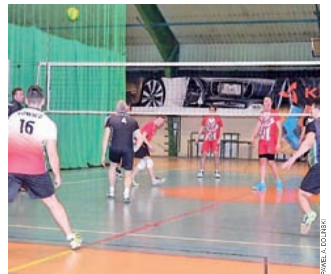
Siatkarze Mnichów z Południa Głowno będą walczyć o miejsca 5-8 w SAM Łowicz, choć liczyli na znacznie więcej.

Głowieńscy siatkarze nieznacznie przegrali walkę o awans do Grupy A i prawo gry o medale XX edycji SAM Łowicz.