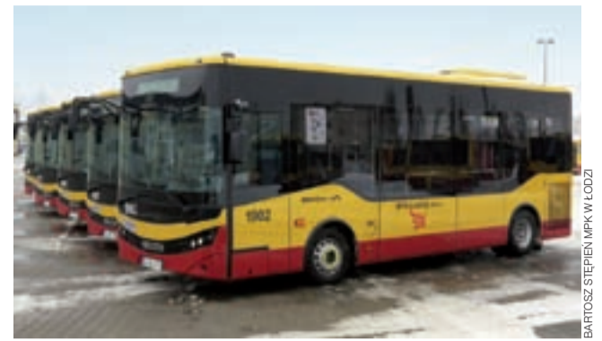
Nowy model autobusów marki Isuzu już jeździ po ulicach Łodzi.

Przypomnijmy, że prowadzone w marcu 2018 roku statystyki wskazują, iż rocznie z komunikacji miejskiej w Głownie korzysta średnio 150 tys. osób. Oznacza to, że autobusem miejskim