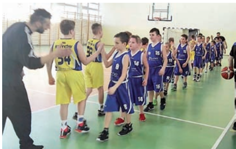
Koszykarze Strykowa (żółte stroje) bardzo dobrze radzą sobie na szczeblu wojewódzkim ligi do lat 11.

Zacy ze Strykowa mają zatem szanse zaistnieć w WLK U-11