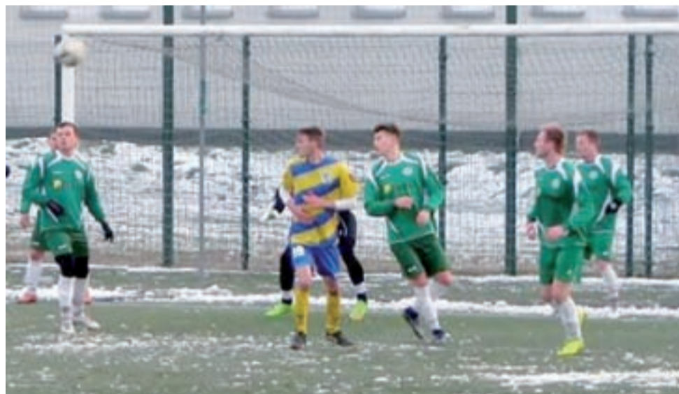
Piłkarze Stali Głowno (żółto-niebieskie stroje) będą celować w poprawę swojej pozycji wiosną w V lidze.

– Starty wszystkich lekkoatletów okazały się być udane. Trochę szkoda tylko, że z różnych przyczyn na zbliżających się Halowych MP wystartuje tylko jeden zawodnik. Myślę, że to jednak przejściowy problem i w sezonie letnim wszystko ulegnie zmianie. – powiedział na koniec trener UKS Błyskawicy Domaniewice Mieczysław Szymajda. wp