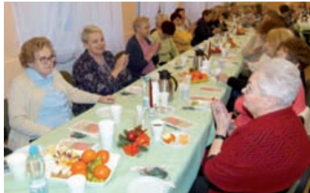
Spotkanie noworoczne. 31 stycznia członkowie Oddziałowej Sekcji Emerytów i Rencistów ZNP w Głownie spotkali się w świetlicy ZS nr 1

Tradycją Oddziałowej Sekcji Emerytów i Rencistów ZNP w Głownie są doroczne spotkania bożonarodzeniowo-noroczne, organizowane by wspólnie dzielić się radością ze świąt i powitania nowego roku.