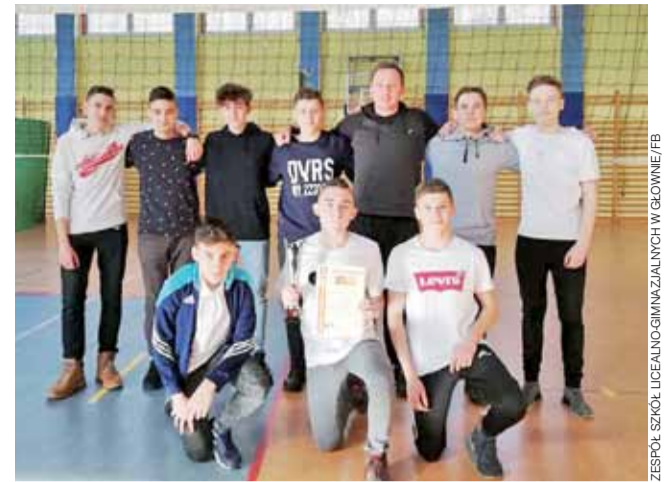
Uczniowie głowieńskiego ZSLG po zajęciu 3. miejsca w Mistrzostwach Powiatu Zgierskiego w siatkówce.