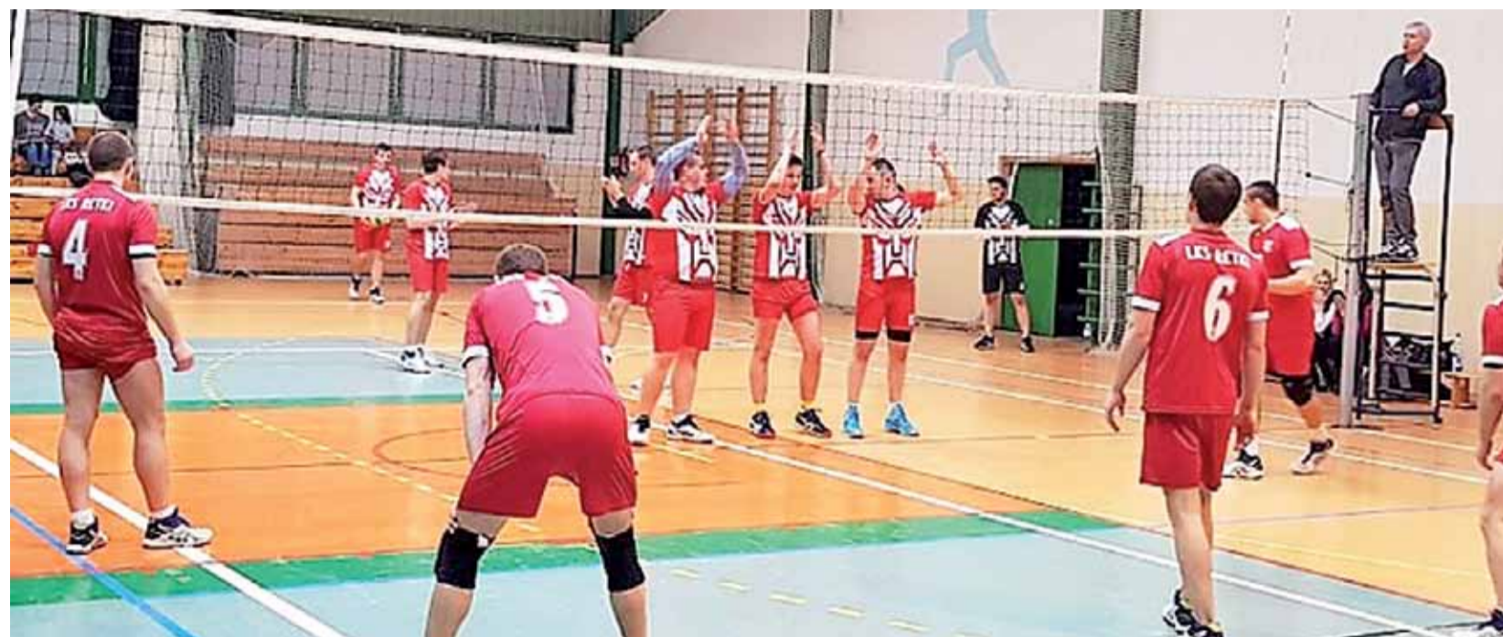
Głowieńscy siatkarze Mnichów z Południa (czerwono-białe stroje) pokazali, że w pełni zasługują na grę o ścisłą czołówkę XX edycji SAM Łowicz.

Mnichy podejmowały wicelidera LKS Retki, który jako jedyny mógł jeszcze zagrozić niepokonanemu Awanturnikowi. Głownianie poradzili sobie kapitalnie i w trzech setach pokonali rywali, po-