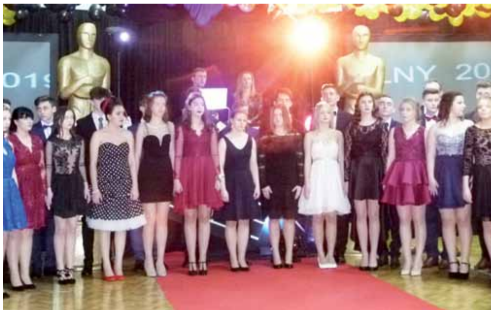
Gwiazdy gimnazjalnego balu – uczniowie trzecich klas. W tle imponująca scenografia, nawiązująca do klimatu oscarowej gali.

– Bal gimnazjalny przeżywanie jako ostatni rocznik. Jesteście ostatni, to jednak nie znaczy, że jesteście nieważni. W tym sensie je-