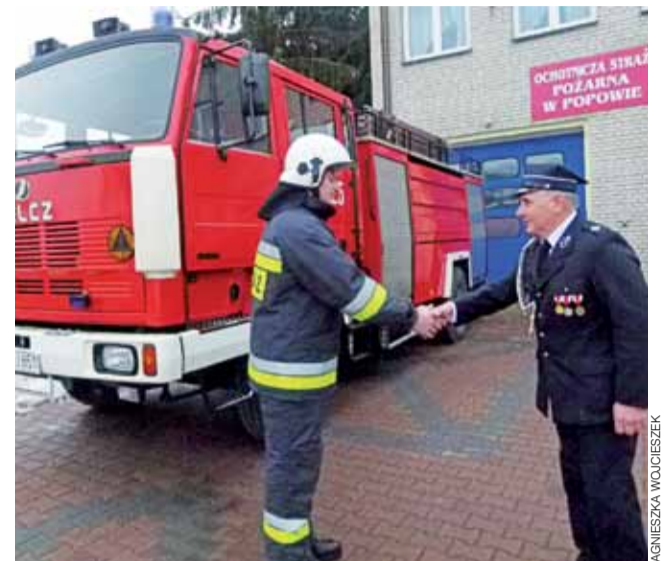
Przekazanie kluczyków kierowcy wozu strażackiego. W tle Jelcz, który już służy ochotnikom z Popowa.

W stosunku do kierowcy zastosowano środek zapobiegawczy w postaci tymczasowego aresztowania na okres trzech miesięcy. Prokuratura postawiła 38-latkowi zarzut spowodowania wypadku w ruchu drogowym ze skutkiem śmiertelnym. Grozi mu 12 lat pozbawienia wolności. aw