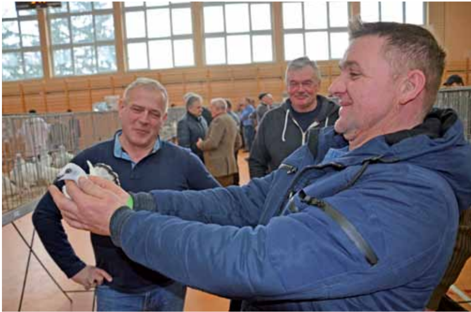
Wystawa w Kompinie jest niecodziennym wydarzeniem, w czasie którego w jednym miejscu spotykają się osoby mające to samo hobby. Mogą porozmawiać, poartować i wymienić się doświadczeniami.

Wystawa jest niecodziennym wydarzeniem, w czasie którego