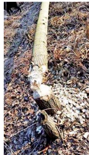
Efekt „pracy” głowieńskich bobrów w okolicach Marakanu.