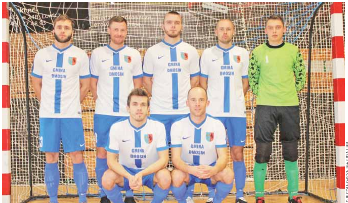
Błękitni Dmosin w dobrych nastrojach są na najlepszej drodze do mistrzostwa i powrotu do KIA Open I Ligi ŁoLiF.