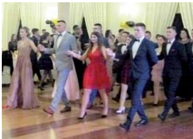
Studniówka ZS nr 1 w Bratoszewicach. Na zdjęciu tradycyjny polonez w wykonaniu uczniów szkoły.

Tuż po części oficjalnej wybrzmiały dźwięki poloneza au-