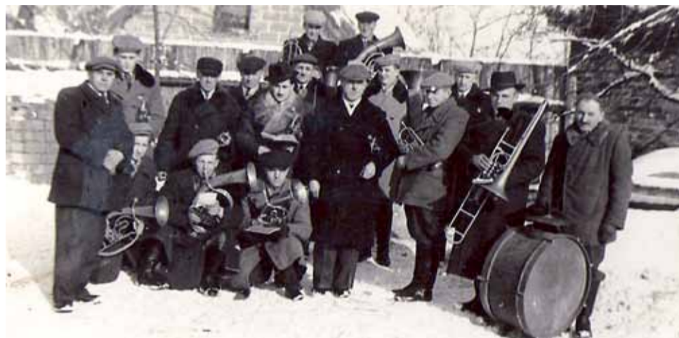
Archiwalne zdjęcie orkiestry z 1950 roku.

Choć wydawać by się też mogło, że znaczna różnica wieku między nowym kapelmistrzem