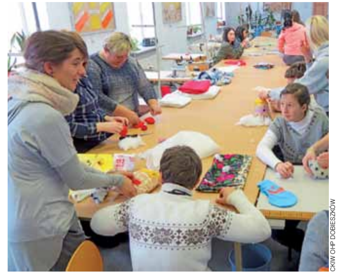
Pod okiem instruktora praktycznej nauki zawodu uczestnicy warsztatów samodzielnie wykonywali maskotki.

Warsztaty nie były pierwszym spotkaniem podopiecznych stowarzyszenia i młodzieży CKiW.