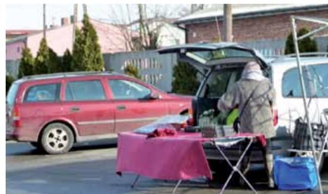
Mężczyzna, który zmarł na rynku, miał swoje stoisko pod parkanem od strony ul. Cmentarnej.

– Kajdanki zwyczajowo kojarzą się z pracą policjanta, jednak są one ogólnodostępne i z łatwością można nabyć je choćby w sklepach militarnych. Używając ich należy jednak zachować szczególną ostrożność – zauważa Bogusław Gorący, komendant Komisarzatu Policji w Głownie. aw