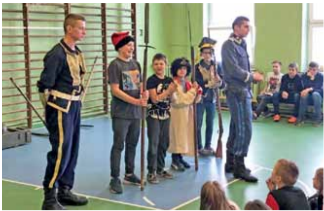
Nauka poprzez zabawę. Uczniowie SP nr 1 uczestniczą w zajęciach historycznych.

Spotkanie pt.: „Ku Niepodległej” miało charakter interaktywnej prelekcji poświęconej wydarzeniom historycznym od czasów rozbiorów, aż po moment odzyskania niepodległości.