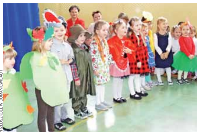
Mali aktorzy podczas przedstawienia pt. „Czerwony Kapturek”.

Ciekawą „miniwystawę” na temat bezpieczeństwa w internecie przygotowała Miejska Biblioteka im. Cebrowskiego na osiedlu Bratkowice w Łowiczu. Okazją do jej przygotowania był obchodzony na początku lutego Dzień Bezpiecznego Internetu. Bibliotekarze dokonali wyboru – i proponują lekturę – kilku dostępnych w bibliotece książek nawiązujących do tego tematu, np.: „Przestępcze oblicze komputerów” Ryszarda Czechowskiego i Piotra Sienkiewicza, „Sekty w Internecie” Andrzeja Zwolińskiego, czy też „Hejsterstwo: Nowa praktyka kulturowa? Genezą, przypadki, diagnozy” – pracę zbiorową wydaną przez Wydawnictwo Uniwersytetu Łódzkiego. Wystawę w holu biblioteki można oglądać do końca lutego. mak