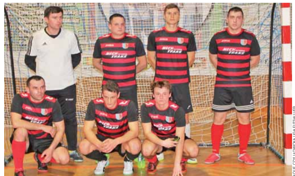
Drużyna Błękitnych II Dmosin ma szanse na awans do elity Łowickiej Ligi Futsal.

Koszykówka | 14. kolejka WLK U-13 K, gr. A