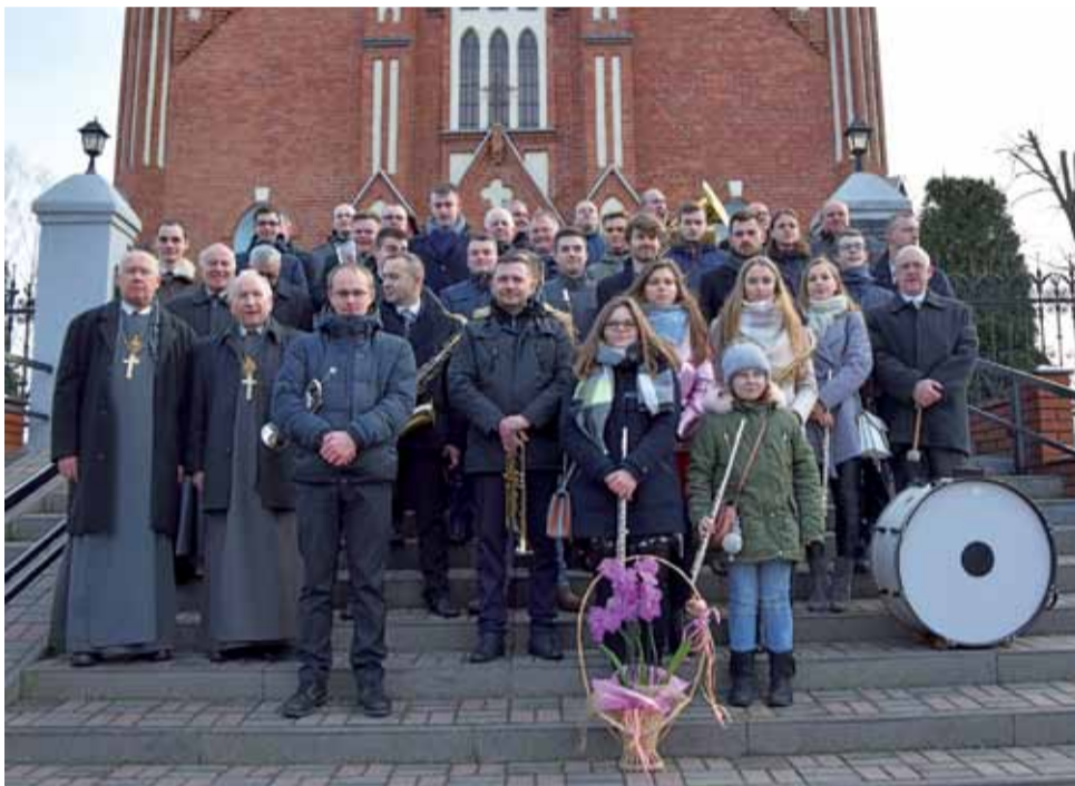
Pamiętkowe zdjęcie z okazji 110-lecia orkiestry, 10 lutego 2019.