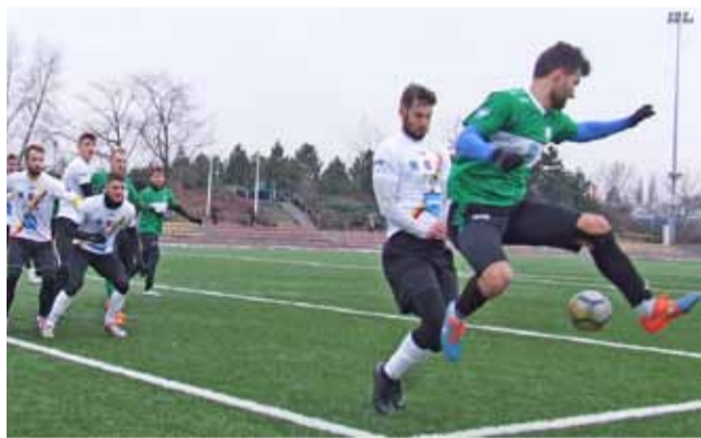
Stałe fragmenty gry stanowiły niemały problem dla Legionovii w drugiej połowie.

Wydaje się, że Pelikan i Legionovia mogą iść innym tokiem przygotowań. Dla spadkowicza