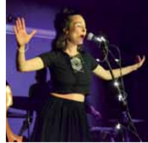
Chłopcy kontra Basia zagraли z okazji 1. urodzin klubokawiarni HopKultura i 5. urodzin Browaru Bednary.

Był to muzyczny prezent dla bywalców wydarzeń kulturalnych i nie tylko z okazji 1. urodzin klubokawiarni HopKultura i 5. urodzin Browaru Bednary. To tylko niektóre z wydarzeń mu-