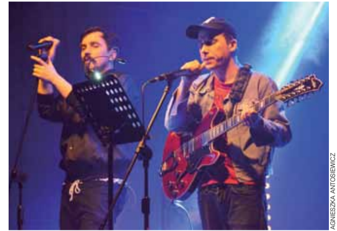
Dla pełnej widzów sali kina Fenix zagrał zespół Pablopavo i Ludziki.

zycznych, które, poza bogatą listą tytułów filmowych, znalazły się w programie Och! Film Festiwalu. aa