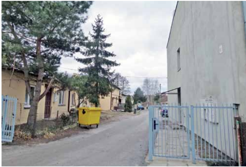
Do tragicznych zdarzeń doszło w jednym z lokali na tym podwórku.

Z uzyskanych przez nas informacji wynika, że w poniedziałek, 11 lutego, w jednym z mieszkań na komunalnej posesji przy ul. Kościuszki, do którego przyszedł 60-latek, w kilkuosobowym gronie spożywany był alkohol. W pewnym momencie między 60-latką a 36-latką doszło do scysji. Ofiara miała być okładana pięściami i kopana nogami doznając m.in. licznych obrażeń głowy. Wszystko odbywało się w obecności lokatora mieszkania oraz jeszcze jednego kompana al-