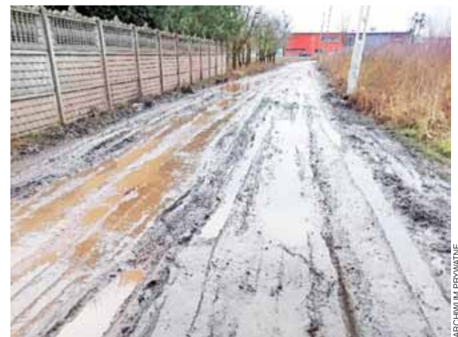
Zdjęcie aktualnego stanu drogi drogi wykonane 11 lutego.

Droga jest obecnie często wybierana jako skrót do magazynów. Kierowcy miast jechać przez rondo w Sosnowcu-Pieńkach wolą zaoszczędzić i skręcić w gruntówkę, która z pozoru wygląda na cywilizowaną, bo na odcinku łączącym się z DK 14 została wykostkowana. To w połączeniu z pierwszymi lutowymi roztopami spowodowało, że droga jest całkowicie rozjeżdżona, a wyjazd i powrót do własnego domu wiąże się z ryzykiem utknięcia samochodem w grząskim błocie i kałużach. Jest więc obawa, że z nastaniem wiosny będzie tu jeszcze