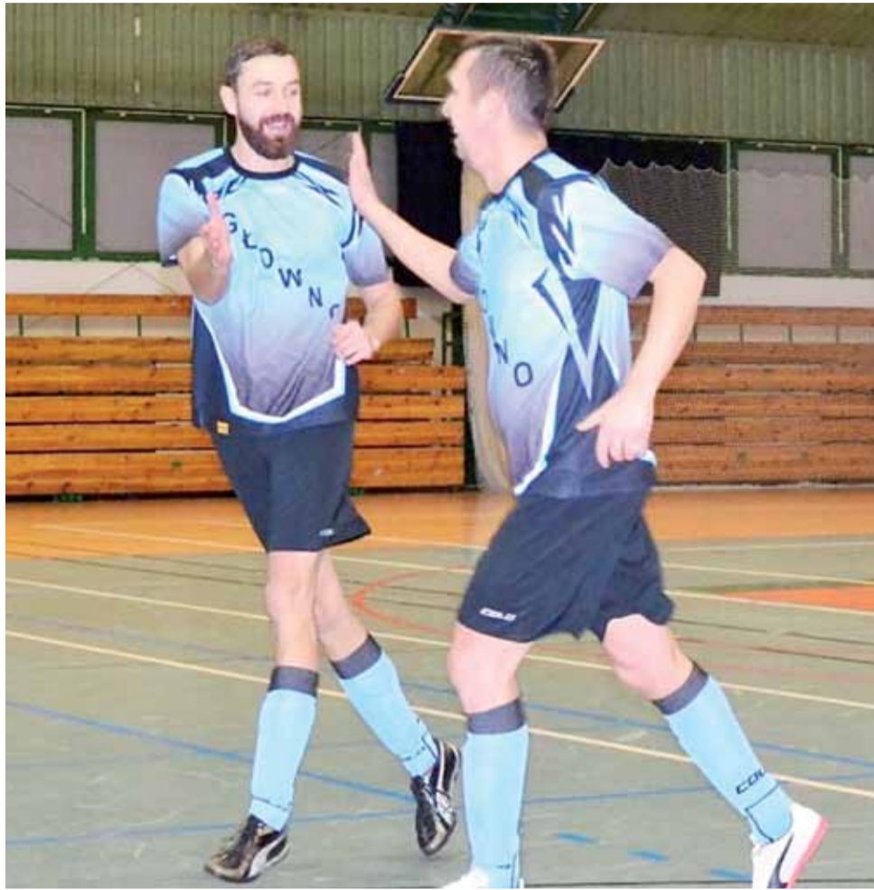
Piłkarze halowi Nieobliczalnych Główno znakomicie się dogadują na parkietach łowickiej hali OSiR. Głównianie z kompletem punktów są liderami V Ligi ŁoLiF.

Walka w V Lidze ŁoLiF powoli dobiega końca. Do rozegrania pozostała jeszcze jedna kolejka, w której lider z Główna podejmie Komtrans Bednary. Spotka-