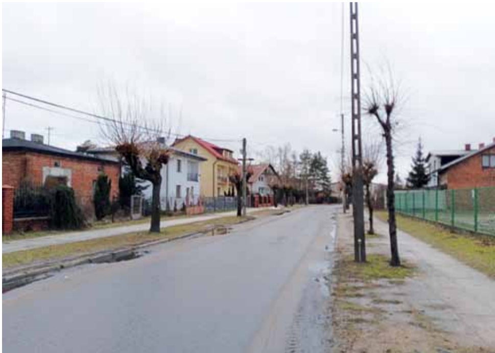
Krajobraz bez progów. Ograniczniki zniknęły z ul. Wojska Polskiego pod koniec stycznia.

Mieszkańcy dziękują za zdjęcie progów. Nie męczy ich już hałas nadejeżdżających aut i mogą spać spokojnie.