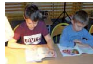
Taki kącik czytania książek, to już znak rozpoznawczy bratoszewickich nocy w szkole.

Dla dzieci z oddziałów przedszkolnych zorganizowano Wieczór Bajek Zimowych, podczas