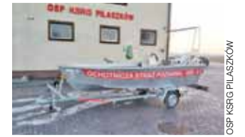
Łódź ratownicza została zaprojektowana i wykonana przez firmę Rafann z Jastrzębi.