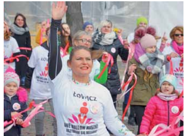
Forma happeningu jest luźna, ale ma on zwracać uwagę na bardzo poważny problem społeczny.

Potem pasja odeszła na bok, do chwili, gdy kilka lat temu pod wieczór wyszła do ogródka. W czasie pielienia grządek zafascynowały ją kolory nieba i wtedy w głowie zrodziło się jej określenie „Ciemnoczerwona luna”, które nie chciało jej opuścić. Poczuli, że pociąg do pisania jest silniejszy niż sądziła wcześniej i wzięła się do pracy. str. 19