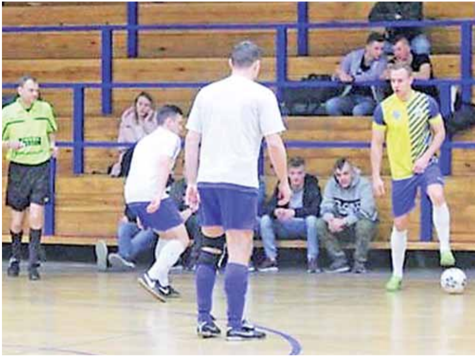
Błękitni Dmosin (żółto-niebieskie stroje) zdominowali rozgrywki Julomax II Łowickiej Ligi Futsal u i po roku przerwy wrócili do elity.

Piłkarze Dmosina mogą śmiało śpiewać teraz piosenkę Niebiesko Czarnych – Niedziela będzie dla