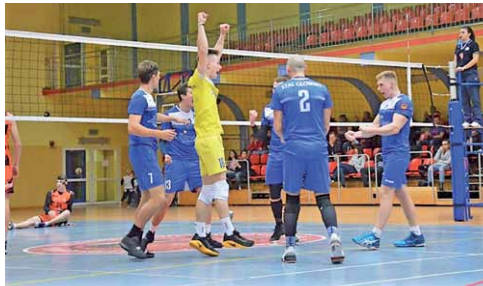
Radość siatkarzy Główna. Stal pewnie zmierza do II Ligi.