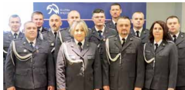
Delegacja z Łowicza na obchody 100. rocznicy polskiego więziennictwa.

Wśród przeszło setki uczestników okręgowych uroczystości Święta Służby Więziennej, obchodzonego w Piotrkowie Trybunalskim, znalazło się 12 przedstawicieli Zakładu Karnego w Łowiczu, których delegacji przewodził kpt.