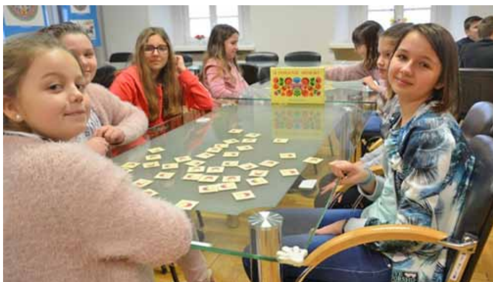
Gra w „Łowickie memory” podczas zajęć w Muzeum w Łowiczu.

W Walentynki uczestnicy od rana byli w Łowiczu, gdzie odwiedzili salę edukacyjną „Ognik” w komendzie PSP w Łowiczu. Spotkali się tam nie tylko ze strażakami, ale też funkcjonariuszami łowickiej policji. Była to okazja do zapoznania się ze sprzętem i zasadami zachowania bezpieczeństwa na różnych wziętych z życia przy-