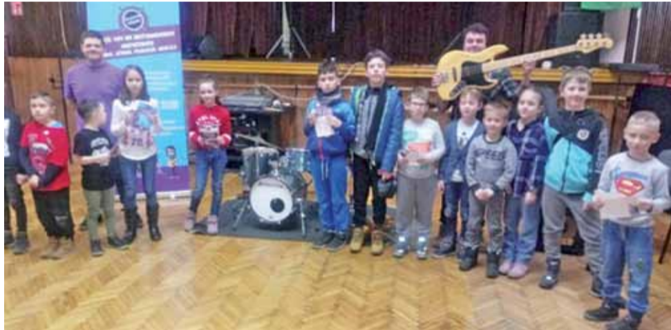
Niektóre z osób uczestniczących w warsztatach perkusyjnych grały na tym instrumencie po raz pierwszy.