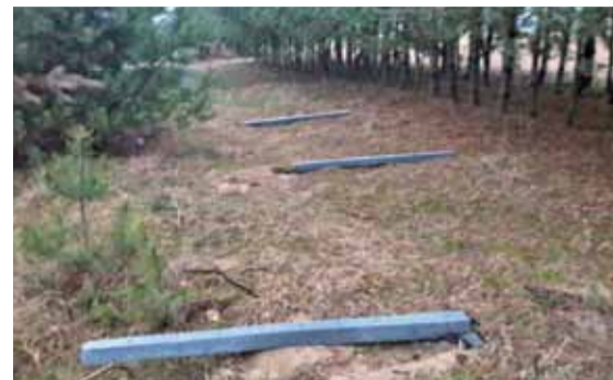
Uszkodzone słupki w Domaradzynie. Gmina Głowno 8 lutego zgłosiła na policję dokonanie aktu wandalizmu.

– O takich rzeczach to się słyszy w telewizji. W ogóle w czasie ciąży będą jakiegokolwiek komplikacje, a co dopiero, że stracimy dziecko – mówi. – Tylko to, że mamy synka, mobilizuje nas do codziennego, w miarę normalnego funkcjonowania. ewr