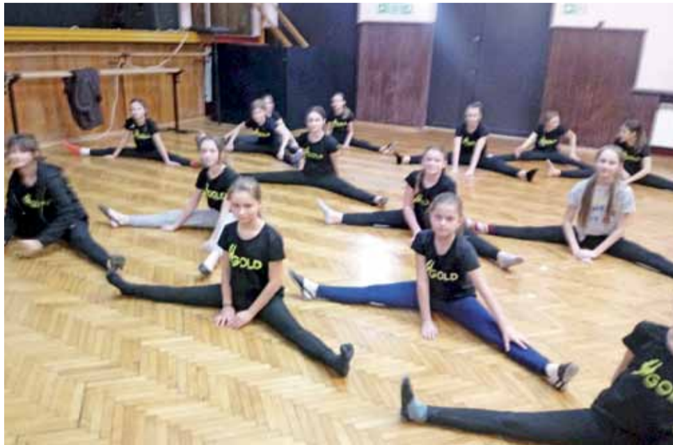
W wydarzeniach Feryjnej Nocy Tańca „Gold” w głowieńskim MOK-u wzięło udział ok. 30 uczestników.

Drugi tydzień atrakcji rozpoczął się w MOK-u refleksją na temat istotnych w życiu wartości. Wszystko to za sprawą twórców Teatru Lalki „Pacusi” z Łodzi, którzy w poniedziałek, 18 lutego, przybliżyli małej publiczności treść „Bajki o trzech braciach”. Lalkowy spektakl był sceniczną próbą poszukiwania odpowiedzi na pytanie czy możliwe jest zdobycie najważniejszych w życiu zjawisk: dobroci, miłości, bogactwa oraz radości? Licznie zgromadzone tego dnia w kulturalnej placówce dzieci z żywym zaangażowaniem pomagały głównemu bohaterowi, czyli najmłodszemu z tytułowych braci, pomyślnie zdać egzamin z człowieczeństwa. To ów test okazał się kluczem do osiągnięcia życiowego szczęścia.