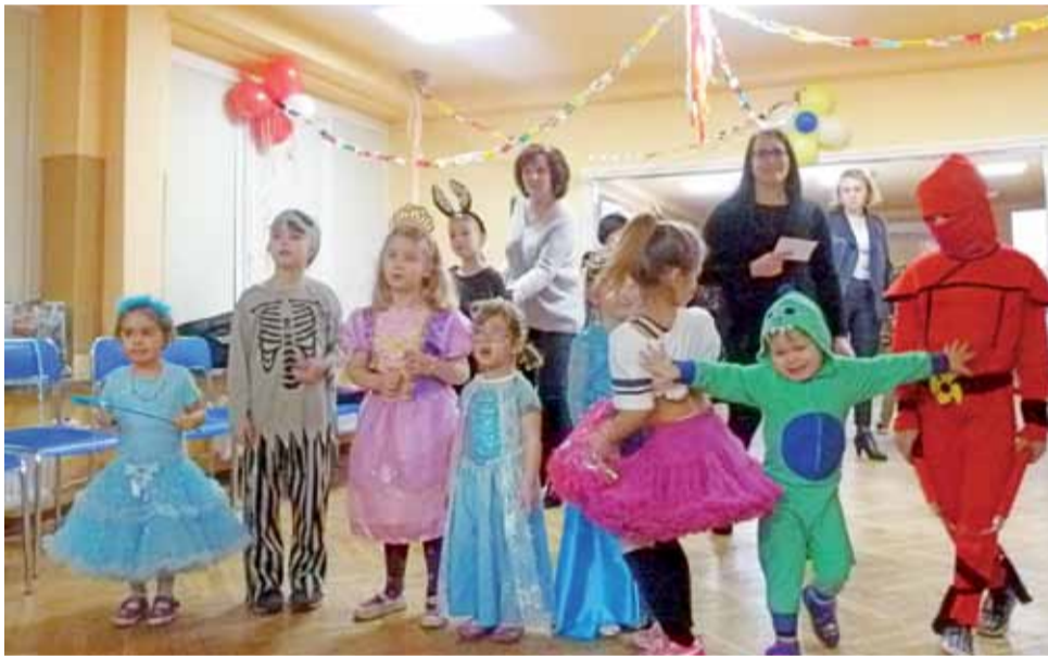
Księżniczki zachwycające błyszczącymi kreacjami, superbohaterowie oraz smoki, czyli małe gwiazdy Balu Karnawałowego w Bratoszewicach.

Podczas wydarzenia dzieci aktywnie uczestniczyły w zajęciach tanecznych, przez kilka godzin korzystając z uroków wspólnej zabawy. Zainteresowaniem zgromadzonych cieszyły się nie tylko