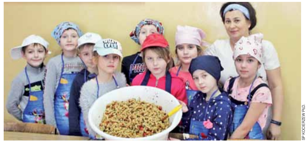
Klasa II A prezentuje swoją pyszną i zdrową sałatkę.

w matematyczne oraz wiele innych. Najlepsi uczniowie z kl. IV-VIII i III gimnazjum pojechali na wycieczkę – niespodziankę do „Stajni u Kowala” w Nieborowie. Pyszne i zdrowe sałatki powstawały podczas zajęć kulinarnych pn. „MasterChef Junior”. Najmłodsi uczniowie mogli się sprawdzić w grach sportowych z cyklu „Kto szybciej, kto dalej?”. aa