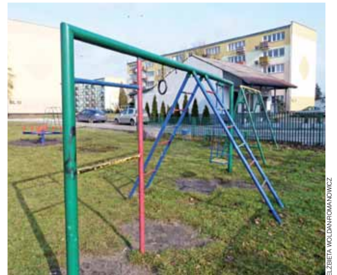
Plac zabaw na os. M. Kopernika w Głownie. Stan na 15 lutego.