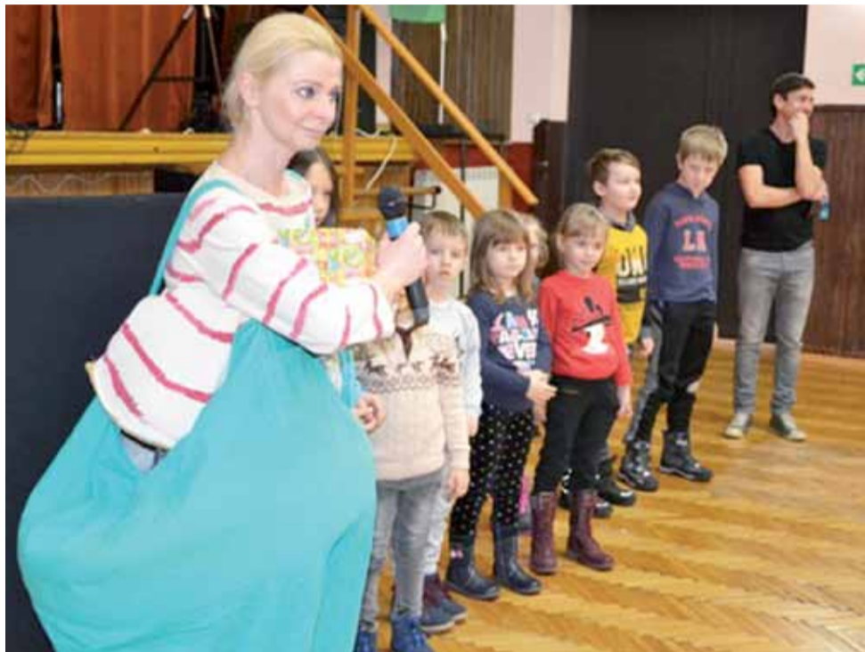
O negatywnych skutkach otyłości opowiadali dzieciom artyści z Teatru Lalki „WidziMisię”.