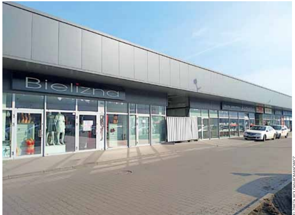
Powstanie nowy, duży sklep. Prace budowlane toczą się na tyłach obiektu Galerii Głowno i w przejściu między zwolnionymi lokalami, które zostaną włączone w jeden nowy pawilon, sąsiadujący ze sklepem z bielizną (po lewej). Stan na 18 lutego.