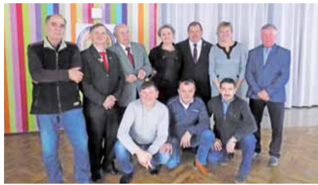
Koło Emerytów i Rencistów Pożarnictwa w Łowiczu liczy 38 członków oraz 4 osoby wspierające.

nie środowiska byłych pracowników Państwowej Straży Pożarnej, którzy są emerytami lub rencistami. Członkowie koła biorą udział w wycieczkach integracyjnych – ostatni taki wyjazd został zorganizowany we wrześniu ubiegłego roku do Grecji. Była to 10-dniowa wycieczka autokarowa. Uczestniczą też w Dniu Strażaka, organizują spotkania oplatkowe – ostatnie odbyło się 16 grudnia. Pamiętają o swoich kolegach, którzy odchodzą „na wieczną wartę”. Działalność koła jest wspierana przez fundusz socjalny tworzący