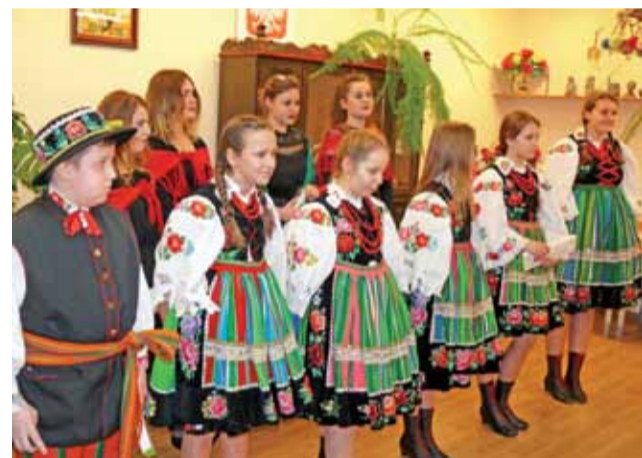
Występujące na dniu Babci i Dziadka zespoły Krzewina i Modraczki.