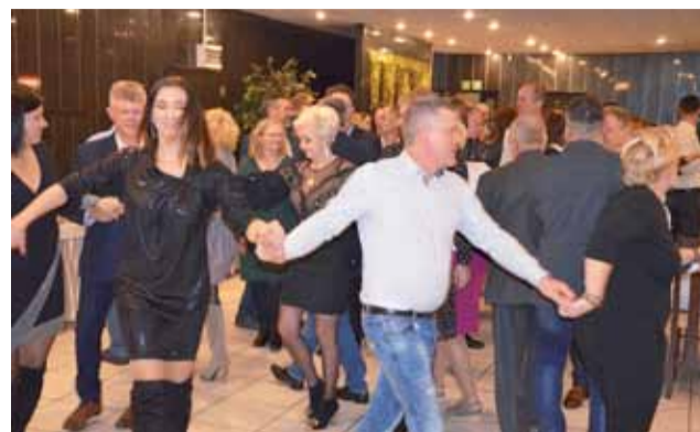
Polonez otwierający rozrywkową część małżeńskiej randki.