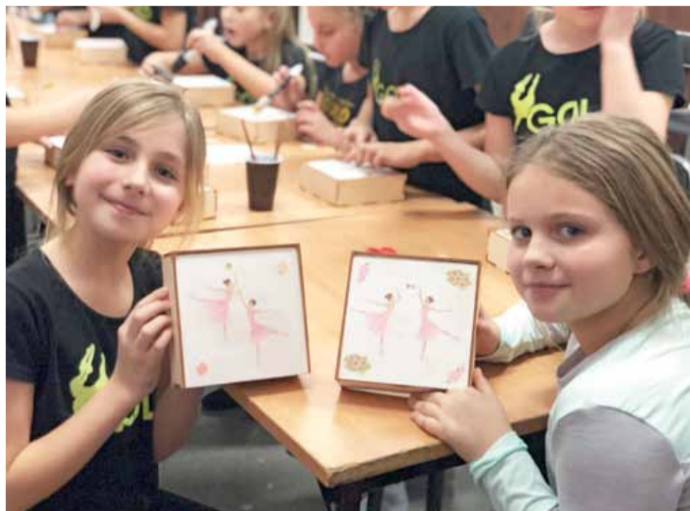
Feryjna Noc Tańca „Gold” obfitowała nie tylko w zajęcia taneczne, lecz także w warsztaty plastyczne.