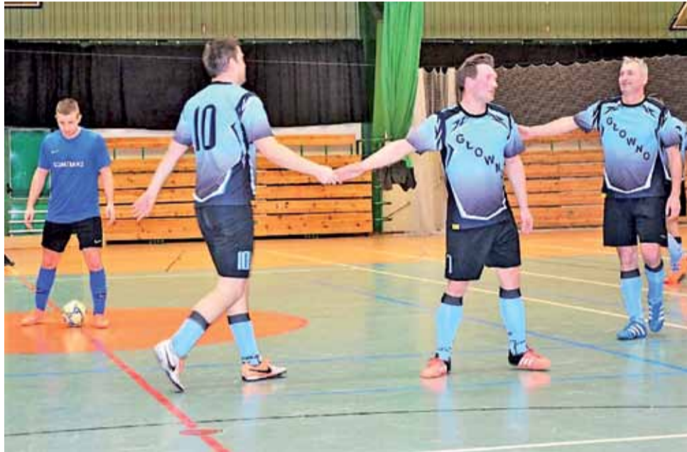
Zespół Nieobliczalnych Głowno jako jedyny w całej XXVI edycji ŁoLiF nie stracił żadnego punktu.