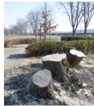
Po wycince. Choć wygląda jakby wycięto kilka drzew, w rzeczywistości był to jeden wielopniowy klon jesionolistny.

MZK ma zresztą jeszcze sporo drzew do wycięcia właśnie ze względów bezpieczeństwa, w tym okazały dąb za cmentarzem, przy