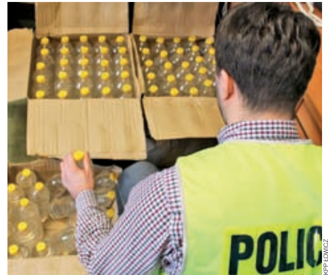
Alkohol znaleziony przez policjantów podczas interwencji domowej.

Wykonując czynności z udziałem awanturującego się 37-latkę, znaleźli u niego 120 litrowych butelek z alkoholem bez polskich znaków akcyzy. Wartość uszczu-