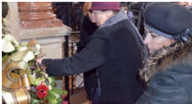
Więńce ustawiono w sąsiedztwie schodów prowadzących do krypt, do których wierni nie mieli możliwości wejścia.