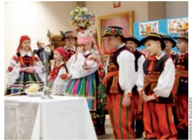
Panna młoda w rozpaczy. Uczniowie z Soboty przypomnieli widzom, że o zamążpójściu niegdyś decydowali rodzice.

By w wiarygodny sposób kultywować tradycję, podczas przedstawienia dzieci wystąpiły w prawdziwych łowickich strojach. Wełniaki ludowe na potrzeby spektaklu udostępnione zostały