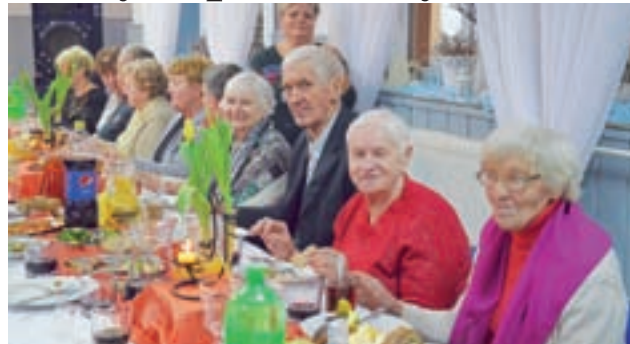
Integracja seniorów w Bednarach Kolonii.

Na przybyłych seniorów czekał obiad i poczęstunek oraz różne atrakcje, m.in. występy wokali-