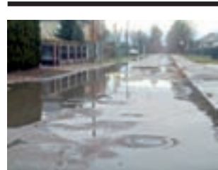
Woda stojąca na tej ulicy po deszczu to dla mieszkańców „dzień powszedni”. Wkrótce może się to zmienić.