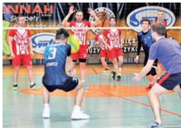
Gracze Mníchów (czerwono-białe stroje) wyrwali rywalom zwycięstwo.

Spotkanie z łowicką ekipą dostarczyło wielu emocji. Korabka musiała wygrać za 3 pkt., by myśleć o wyprzedzeniu Mníchów. Po nieznacznie przegranym pierwszym secie w drugim głównianie pokazali wielką klasę i wygrali 25:15. Podium rozgrywek SAM Łowicz było więc bardzo blisko i wystarczyło wygrać kolejną partię. Łowiccy zawodnicy walczyli o zachowanie szansy na 3. miejsce, ale po świetnej grze to głownianie wygrali 25:22 i tym samym mogli już być pewni ligowego podium. Mimo kilku osłabień w składzie i walki o pietruszkę Korabka ambitnie grała do końca. Siatkarze Mni-