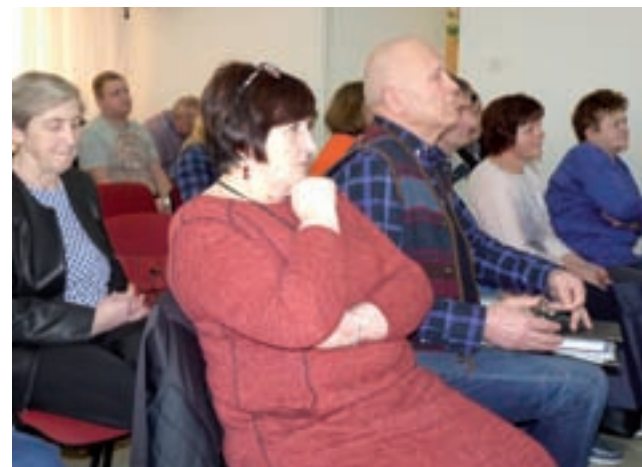
Sołtysi i przewodniczący zarządów rad osiedli są stałymi uczestnikami każdej sesji Rady Miejskiej w Strykowie.

Radni posługują się notebookami niemal od początku ubiegłej kadencji, bo od 2015 roku. Z tych samych przyczyn komputerów Toshiba korzystają teraz radni obecnej kadencji, którzy przy ich użyciu m.in. głosują imiennie na sesjach. Urządzenia wyeliminowały papierowy obieg dokumentów zastępując go elektronicznym systemem przekazywania powiadomień o terminach