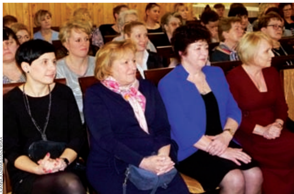
Gminny Dzień Kobiet zgromadził wiele pań, a sala OSP na dłuższą chwilę zamieniła się w salę kinową.