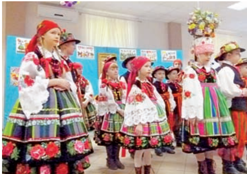
Łowickie wełniaki na potrzeby inscenizacji wypożyczono od zaprzyjaźnionych rodzin.

– Początkowo mieli oni problem z odczytaniem gwary, jednak po dwóch tygodniach udzieliła im się twórcza energia ludowa, więc z radością angażowali się