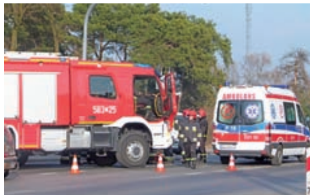
Kolizja spowodowała chwilowe utrudnienia w ruchu na DK 14 dla kierunku jazdy z Łowicza do Łodzi.

Zderzenie pojazdów było efektem wymuszenia pierwszeństwa. Kierująca oplem 39-letnia mieszkanka powiatu łowickiego skręcając z ul. Rynkowskiego w kierunku Łowicza nie ustąpiła pierwszeństwa fiatowi kierow-