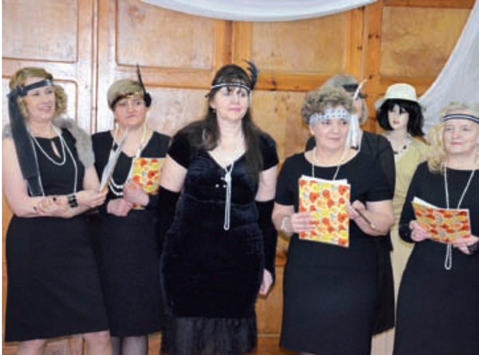
Panie z KGW Zielkowie wystąpiły w strojach z lat 20. poprzedniego stulecia.

– To jest po prostu jakaś magia. Nie możemy uwierzyć, że z mieszanina takich prostych składników może powstać coś tak fajnego – fascynowali się uczestnicy zajęć. aw