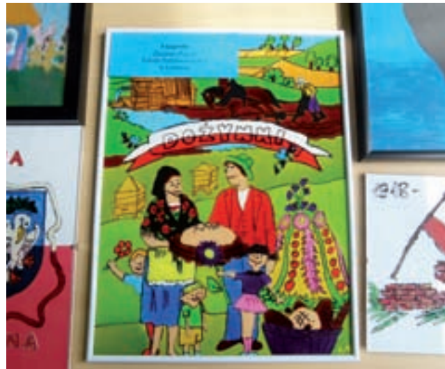
XIII edycja konkursu „Na szkle malowane”. W roku 2018 temat nawiązywał do 100-lecia odzyskania przez Polskę niepodległości.

Konkurs „Na szkle malowane” został objęty patronatem Łódzkiego Kuratora Oświaty oraz Starosty Powiatu Łowickiego, a patronat medialny objął nad nim nasz tygodnik – Nowy Łowiczanie. ewr