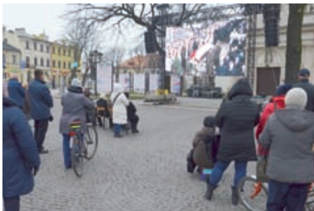
Na Starym Rynku przed telebimem, na którym wyświetlana była relacja na żywo z mszy pogrzebowej było kilkadziesiąt osób.