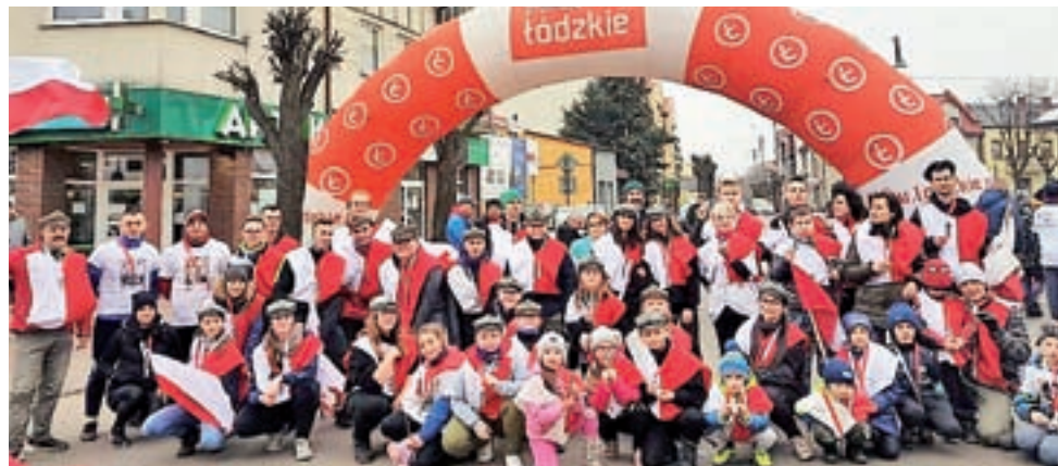
Uczestnicy niezwykłego biegu w Głowniu pokazali wielkie przywiązanie do narodowej historii.

W gronie startujących przekrój był bardzo różny. Od dzieci do starszych osób, biegli harcerze, lekarze, przedstawiciele władzy i przeciętni zjadacze chleba. Wszyscy zgodnie chcieli uczcić pamięć tych, dzięki którym żyjemy obecnie w wolnym kraju. wp