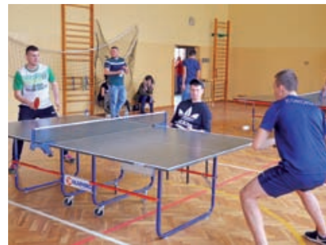
Rozgrywki były prowadzone na trzech stołach jednocześnie, sędziowali zawodnicy, którzy czekali na swoją kolej.

bywały turnieje, w których uczestniczyło nawet po 30 osób w każdej z grup wiekowych, a turniej kończył się w godzinach popołudniowych. Tym razem rozpoczął się o godz. 11, a zakończył około 14.