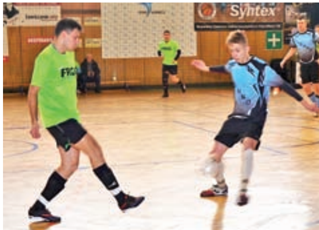
Pilkarze halowi Głowna (niebieskie koszulki) zanotowali udany sezon.

■ 1/16 Finału: Guminex Gzinka - LKS Start Złaków Borowy 0:5, FC