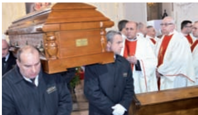
Moment wyniesienia trumny z ciałem śp. biskupa z nawy głównej łowickiej katedry do krypt, przez pracowników firmy pogrzebowej.