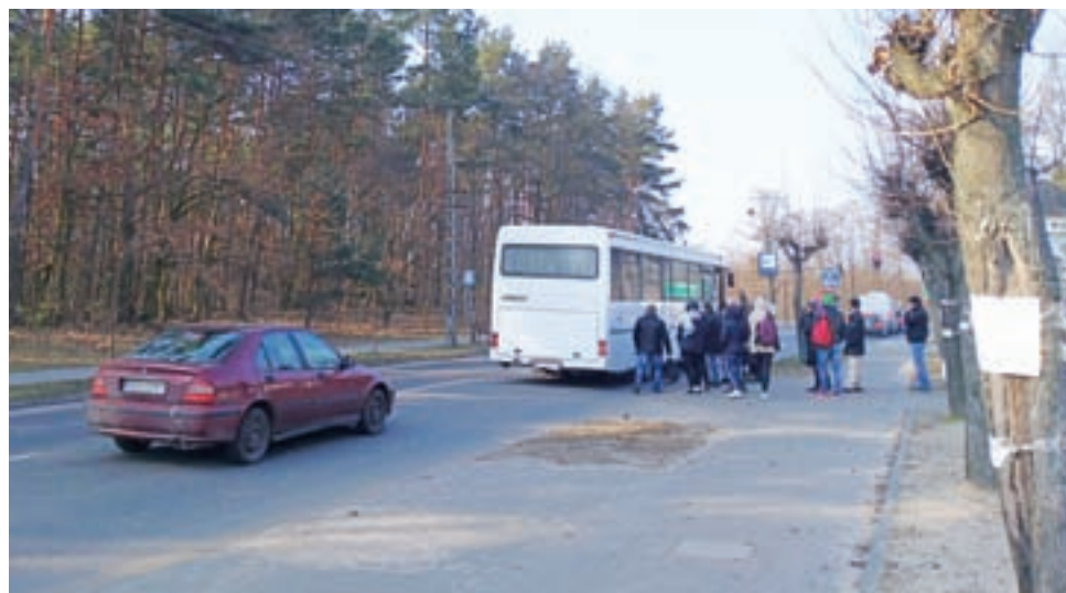
Przystanek przy ul. Sikorskiego. Pracownicy magazynów wyruszają do pracy. Na odblokowanie przejazdu oczekuje jeden pojazd.

– Już dawno zauważyłam, że problem ten dotyczy wszystkich. Po południu podjeżdżają dwa autobusy i zanim oczekujący pracownicy zdążą do nich wejść, już