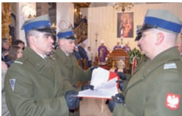
Żołnierze Kompanii Honorowej Wojsk Lądowych z Zegrza składają biało-czerwoną flagę, która spoczywała na trumnie zmarłego biskupa.