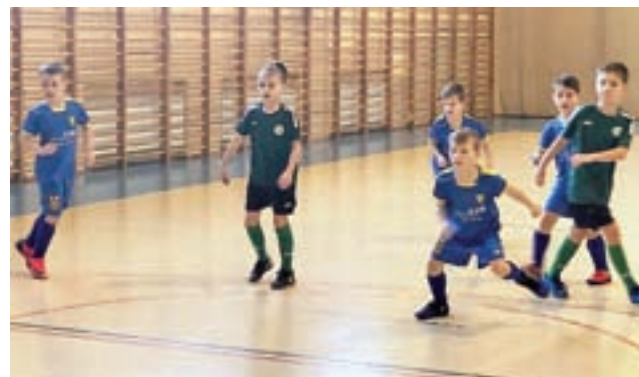
Młodzi piłkarze Peret Stryków (niebieskie stroje) wygrali wszystkie spotkania w rozgrywanym w SP w Rąbieniu Turnieju.

41 bramek, tracąc jedynie sześć. Co ciekawe w każdym z tych spo-