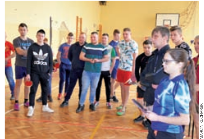
W XII turnieju uczestniczyło najmniej osób od kilku lat, ale i tak będzie on organizowany.

Do rozgrywek przystąpiło łącznie 17 zawodników w dwóch grupach wiekowych. Wcześniej