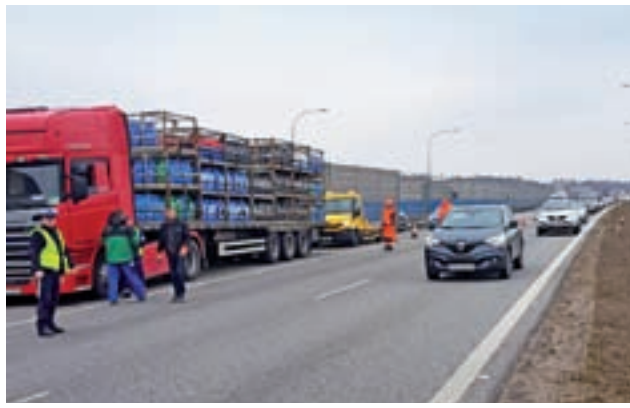
Prawy pas autostrady A-2 w kierunku Warszawy był przez wiele godzin zablokowany.

Z ustaleń policji wynika, że przyczyną zderzenia pojazdów było niedostosowanie prędkości do warunków panujących na drodze przez kierowcę volvo. W wyniku następujących po sobie zderzeń z naczepy man-a na pas zieleni wysypało się 100 butli z gazem, a sam pojazd wbił się