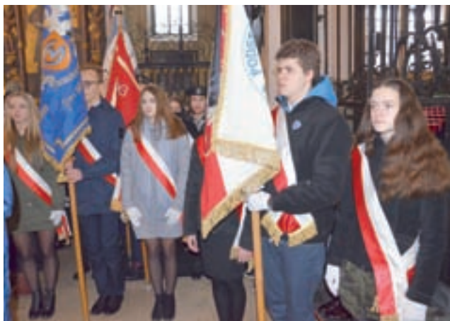
Pocztę sztandarową Gimnazjum nr 2 i Szkoły Podstawowej nr 1 z Łowicza.