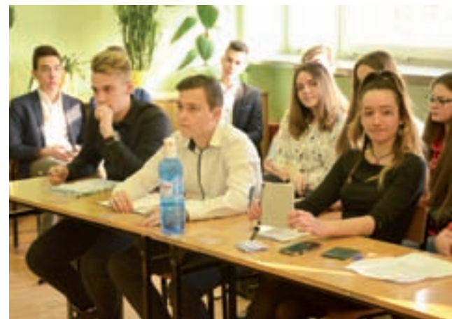
Drużyna ZSP nr 4 podczas debaty z rywalami z Pijarskiego LO.