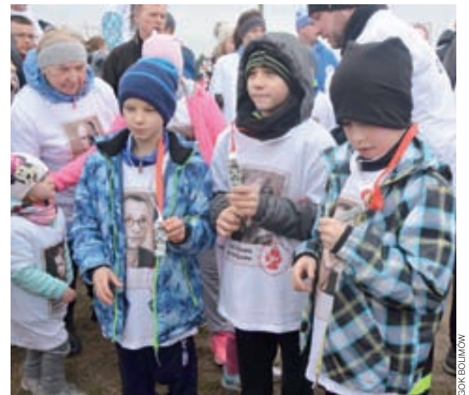
Wśród uczestników bolimowskiego biegu było sporo młodzieży i dzieci.