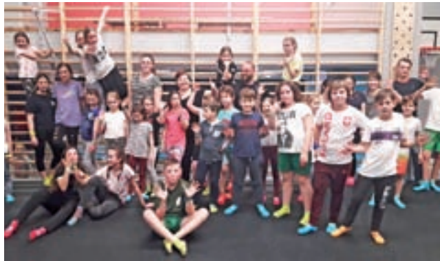
Uczestnicy pijarskich półkolonii w parku trampolin.

Każdy dzień ferii rozpoczynał się o godzinie 9.00 od mszy w szkolnej kaplicy, a po niej – poczęstunku. Potem program był różnicowany, tworzyły go