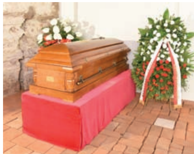
Trumna z ciałem pierwszego biskupa łowickiego spoczęła w kryptach łowickiej katedry.