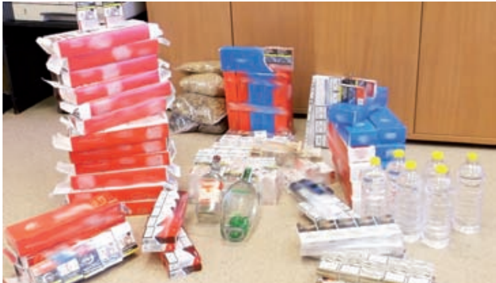
Papierosy i alkohol znalezione na targowisku w Łowiczu.

Łowicz | Akcja skierniewickich celników – nie pierwsza i nie ostatnia