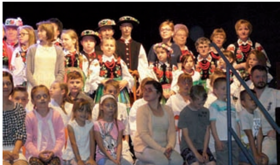
W programie Dnia Rodzicielstwa Zastępczego w Łowiczu nie mogło zabraknąć występu dzieci.

Władze powiatu łowickiego chciały tego dnia podziękować za trud rodzicielstwa zastępczego i wyrazić swe uznanie osobom, które się tego podjęły. Dlatego dla każdej rodziny, która odpowiedziała na zaproszenie, wystosowano dedykowane podziękowania. Przygotowano też urozmaicony program spotkania. Poza życze-