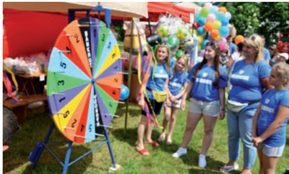
Jedną z atrakcji budzących największe zainteresowanie i emocje była loteria w formie koła fortuny.

Organizatorami wydarzenia były władze gminy wraz ze Szkołą Podstawową w Zielkowicach. Duży udział miały też m.in. OSP z Bochenia, Parmy i Zielkowic oraz KGW z Parmy, Placencji i Zielkowic. tm