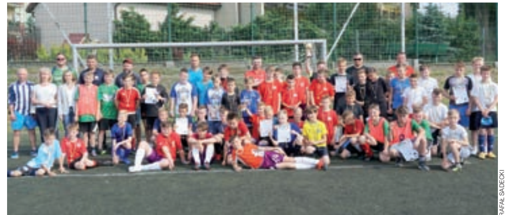
Orlikowa Liga Mistrzów w Strykowie przesyła wiele dzieci ze szkół całej gminy.

■ Finał: Bayern Monachium – Ajax Amsterdam 5:0.