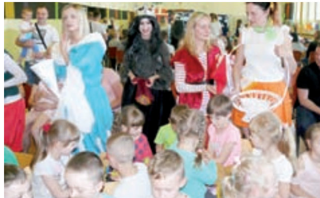
Rodzice mieli dla swoich pociech także słodki poczęstunek.

Historia traktowała o zmianach w krainie baśni, w wyniku których postaci doszły do wniosku, że ich popularność wśród dzieci spadła tak bardzo, że należy szukać innego zajęcia. Na szczęście w odpowiednim momencie wezwana zo-