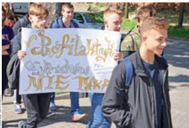
Uczniowie ZSP nr 4 w drodze na Błonie.

Z drużyn żeńskich I. miejsce zajęły drużyny z OSP Kiernoza przed OSP Osiny (w porównaniu do ubiegłorocznych zawodów drużyny zamieniły się miejscami na podium). Trzecie miejsce na trzy startujące drużyny żeńskie zajęła startująca po raz pierwszy drużyna z Teresewa. W grupie młodzieżowej wystartowała tylko drużyna OSP Osiny. mak