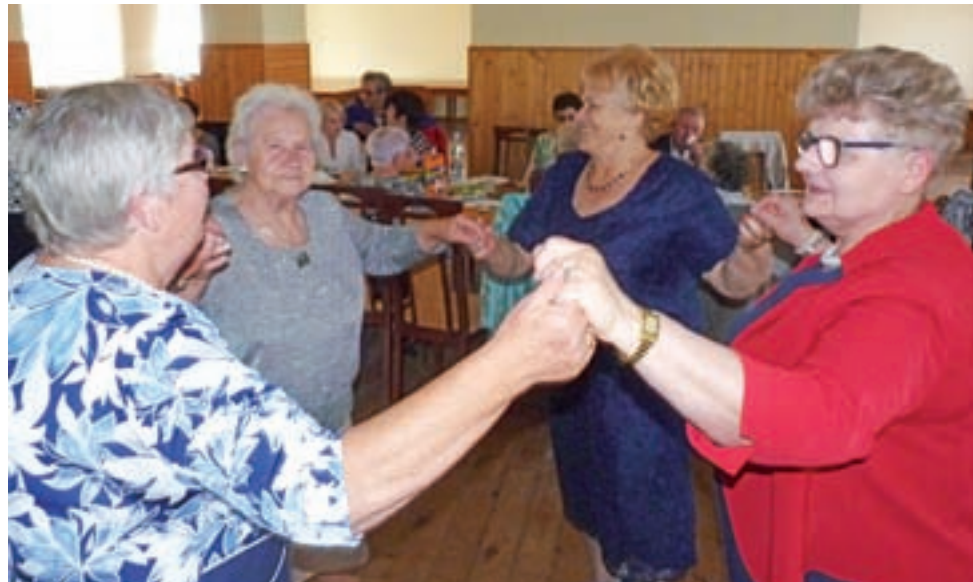
Znakiem rozpoznawczym Słonecznych Dębów od początku były m.in. muzyka i śpiew, jak i do tańca seniorów nie trzeba długo namawiać.