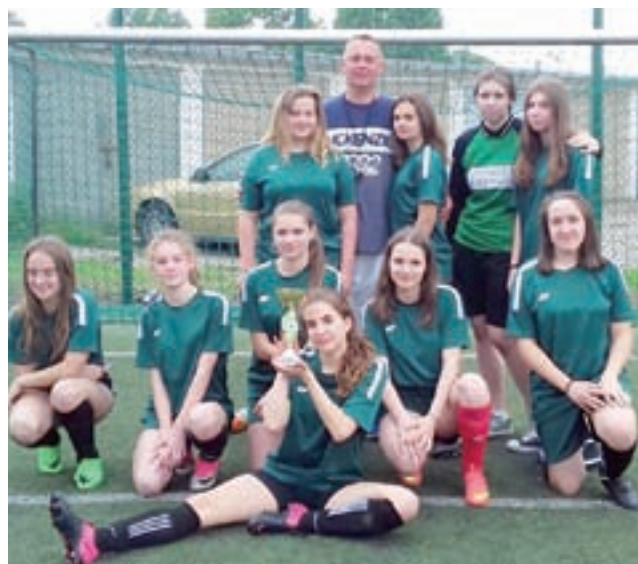
Dziewczyny z Kocierzewa najlepiej w powiecie łowickim kopią piłkę.

Puchar z trzeciego miejsca wywalczyły dziewczyny z Bielaw, które w decydującym pojedynku pokonały SP Bednary 1:0. zł