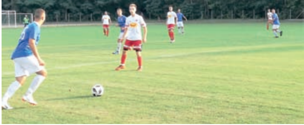
Błękitni Dmosin (niebieski stroje) zakończą tegoroczne rozgrywki na 3. miejscu.