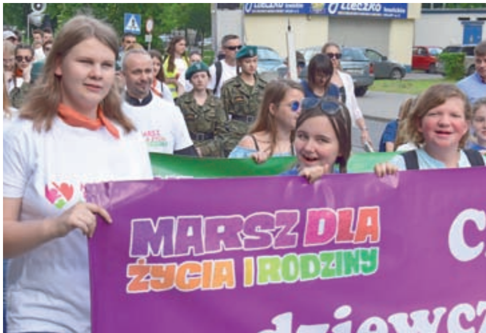
Na czele marszu szła młodzież z transparentami.