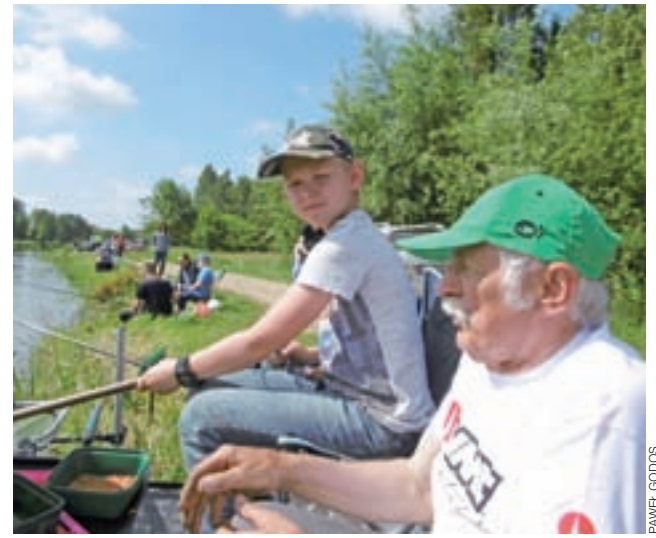
Dzień Dziecka pokazuje, że wędkarstwo może łączyć pokolenia.

ki wędkarskie, podbieraki, siatki, żyłki, spławiki czy zanęty, poza tym każdy otrzymał torbę z produktami mlecznymi od OSM Łowicz i Bakomy.