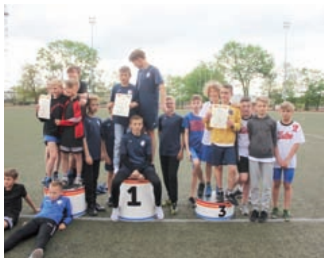
Mistrzowie lekkiej atletyki naszego powiatu.