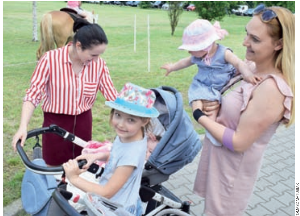
Dopisała pogoda, frekwencja, a przede wszystkim – uśmiechy na twarzach.