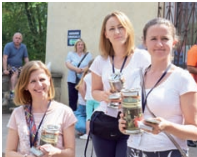
Anioty Miłosierdzia kwestują na rzecz utworzenia na Litwie pierwszego hospicjum dla dzieci.