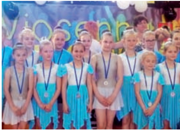
Niektóre spośród nagrodzonych tancerek tuż po ceremonii wręczenia pamiątkowych medali.

– Z zachwytem obserwuję postępy dzieci i pozytywne emocje, jakie towarzyszą im podczas tańca. Cieszę się, że mogliśmy dziś