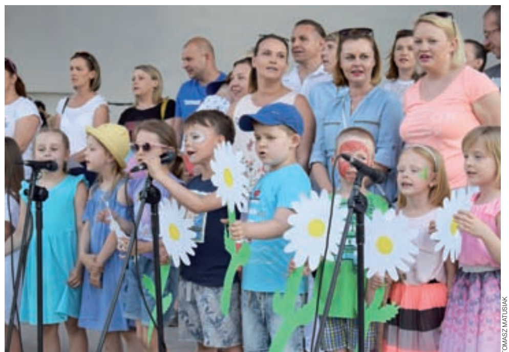
Występ dzieci z Przedszkola nr 1 „Stokrotka”.