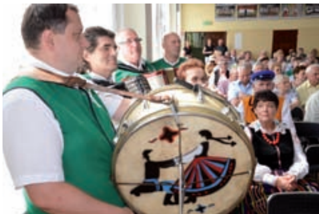
Do występu przygotowuje się Kapela Ludowa „Okowita” z Leszczynka w gminie Kutno.