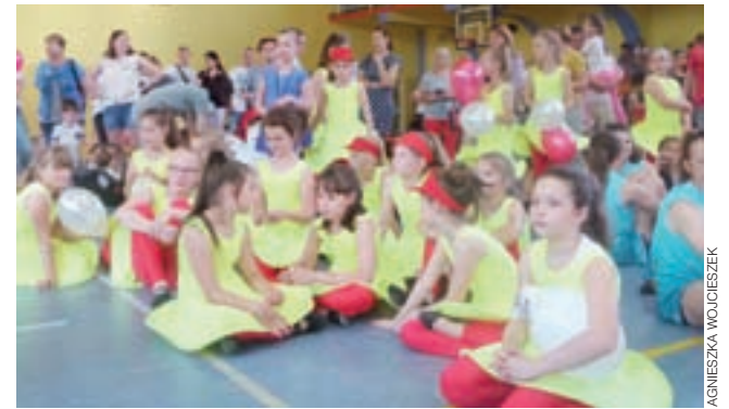
Chwila odpoczynku po tanecznej prezentacji.

przybyć całą rodziną, by podziwiać te występy. To nasze święto! – powiedziała nam mama jednej z tancerek tuż po zakończeniu wydarzenia.