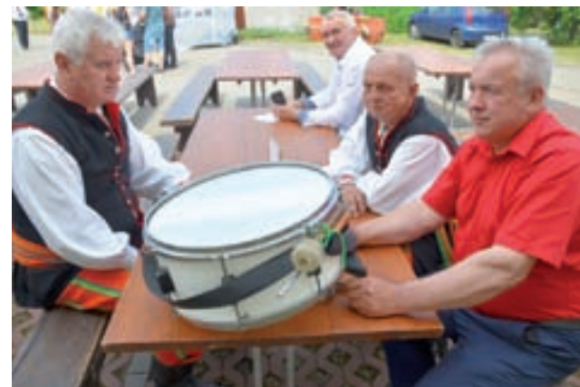
Odpoczynek muzyków pomiędzy występami.

Bedno | Ogólnopolski Przegląd Kapel Ludowych