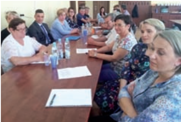
Sołtysi uczestniczący w sesji Rady Gminy Dmosin już w nowym składzie.

Biblioteka w Strykowie świętowała swoje 70-lecie. str. 9