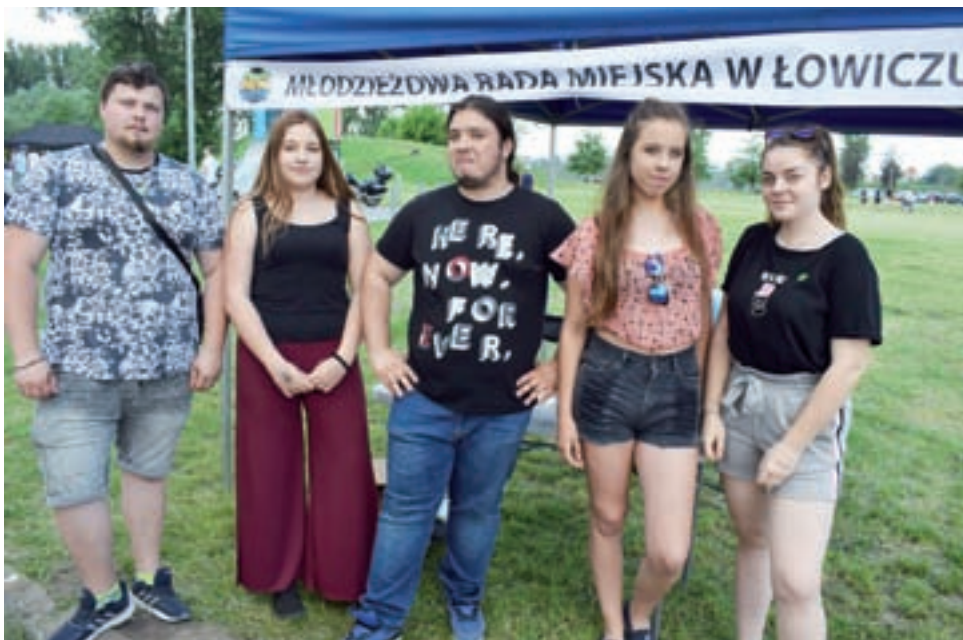
Młodzieżowa Rada Miejska także zaangażowała się w zapewnienie atrakcji dla odwiedzających piknik.