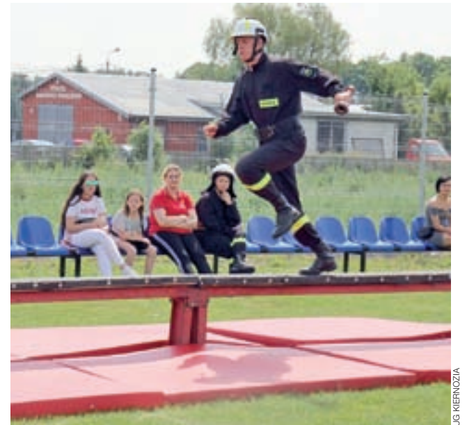
Jedną z przeszkód, którą muszą pokonać strażacy podczas sztafety jest równoważnia.