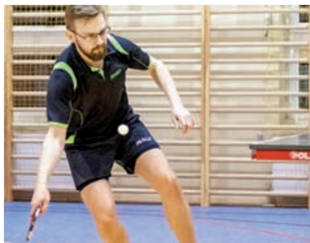
Tenisści LUKS Koźle w kiepskim stylu zakończyli ligowe zmagania.