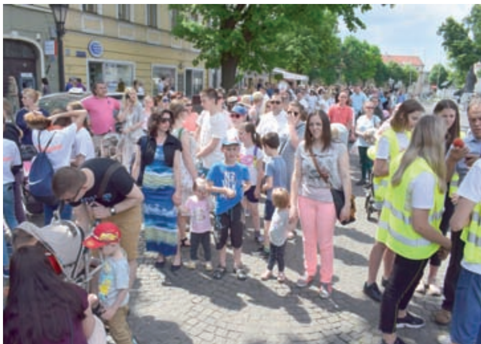
Uczestnicy przygotowują się do marszu na Starym Rynku.