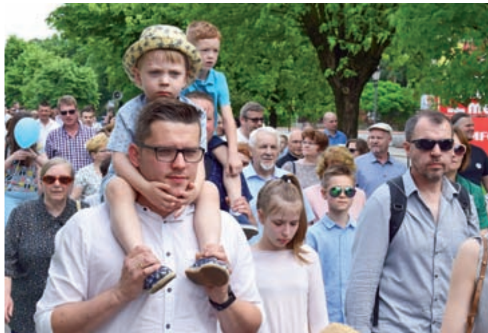
W marszu brali udział zarówno dorośli, jak i dzieci – nie wszystkie przeszły trasę na własnych nogach.

Łowicz | Duży sukces VI Marszu dla Życia i Rodziny