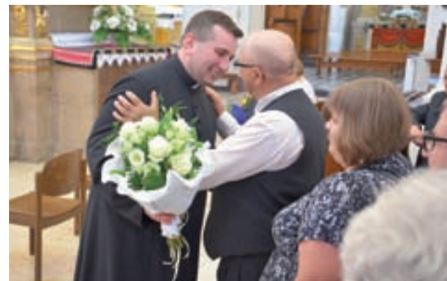
Po mszy świętej neoprezbiter został w kościele, by każdemu osobiście podziękować za obecność podczas jego święceń.

Po mszy świętej do neoprezbitera ustawiła się kolejka gości z życzeniami i gratulacjami. Słychać było ciepłe wypowiedzi, zaczyna-