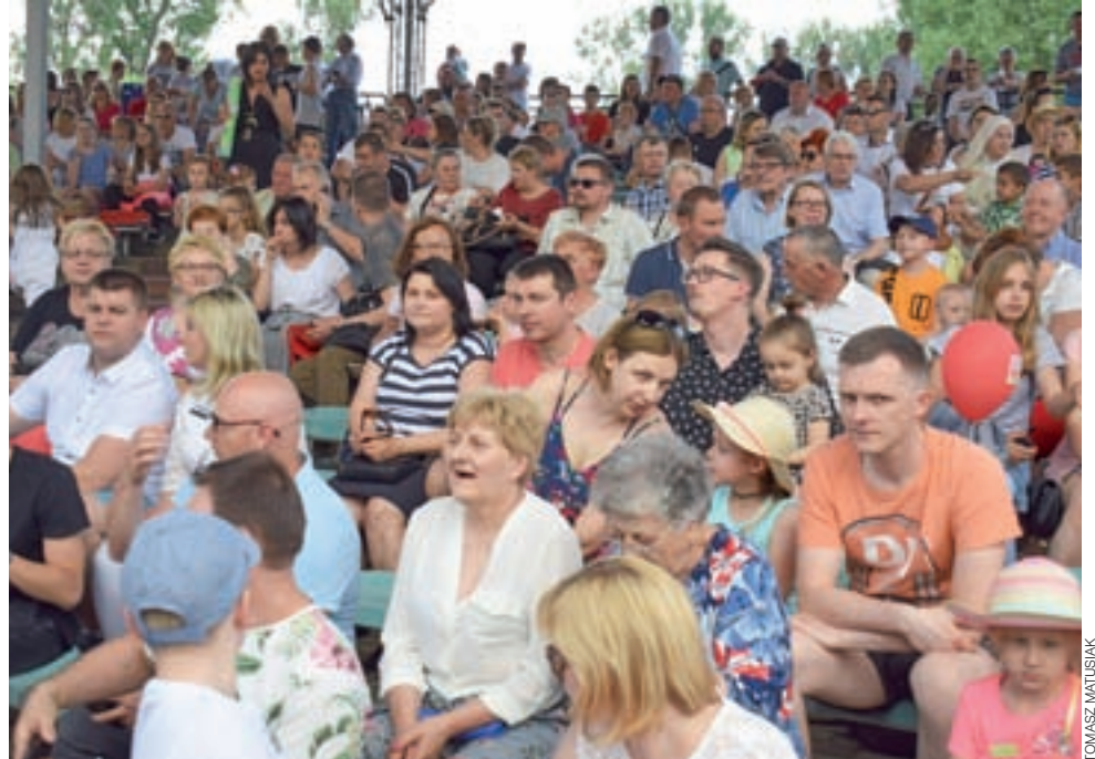
Liczna publiczność zajęła wszystkie miejsca siedzące w muszli koncertowej.

w Skierniewicach i klubu motocyklowego No. 16 dzieci mogły jeździć po miasteczku ruchu na niewielkich pojazdach albo też oglądać z bliska prawdziwe motory, starsi mogli na przykład założyć okulary symulujące percepcję wzrokową pijanego – to kolejna forma przestrogi przed wsiadaniem za kierownicę pod wpływem alkoholu.