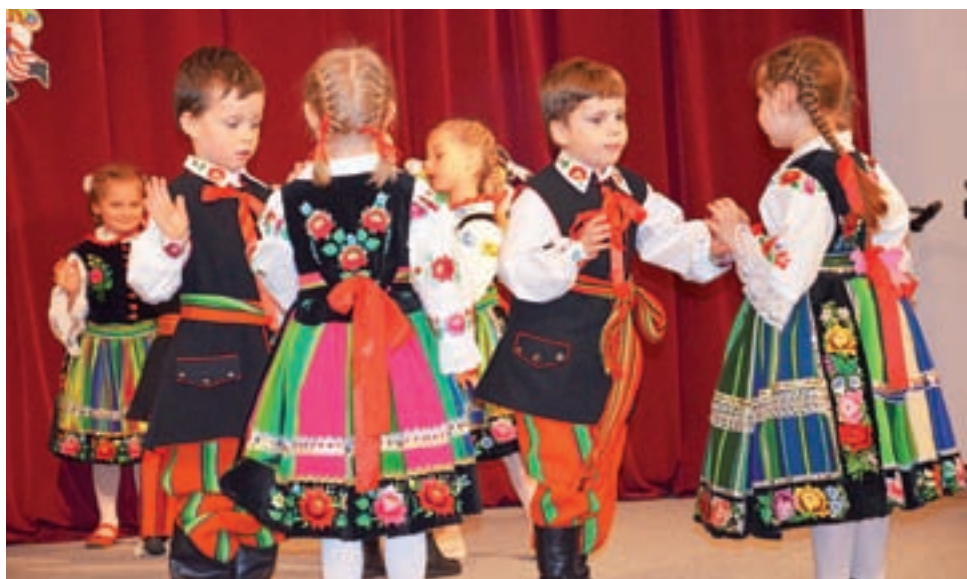
Podczas konkursu nie mogło zabraknąć tańców ludowych i strojów łowickich.