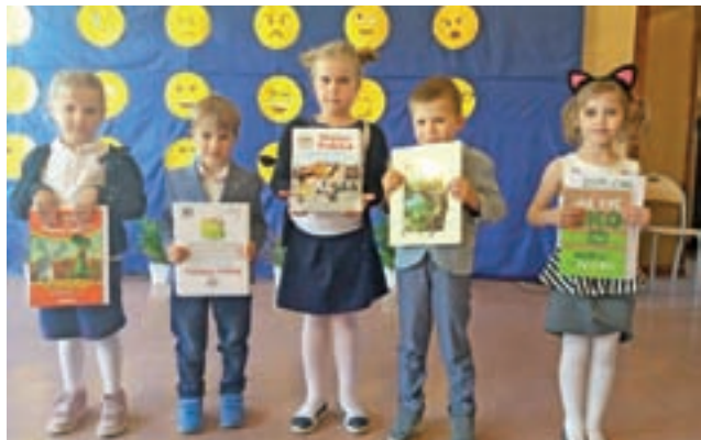
Uczestnicy konkursu otrzymali nagrody i dyplomy.