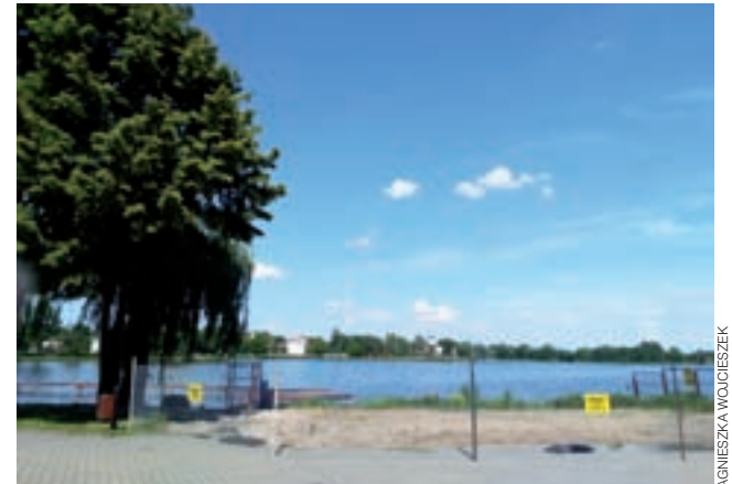
W miejscu, gdzie dziś znajduje się plac budowy, za kilka tygodni dostępna będzie strefa wypoczynku z ofertą gastronomiczną.