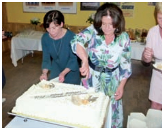
Czas na tort! W finale uroczystości zaproszono gości na poczęstunek.