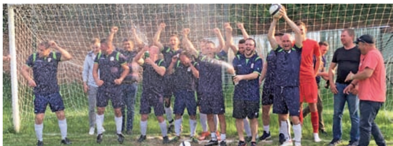
Radość klubu z Dobieszkowa po ostatnim gwizdku w sezonie B-klasy, gr. III, z której po wakacjach Struga wychodzi z przytupem.