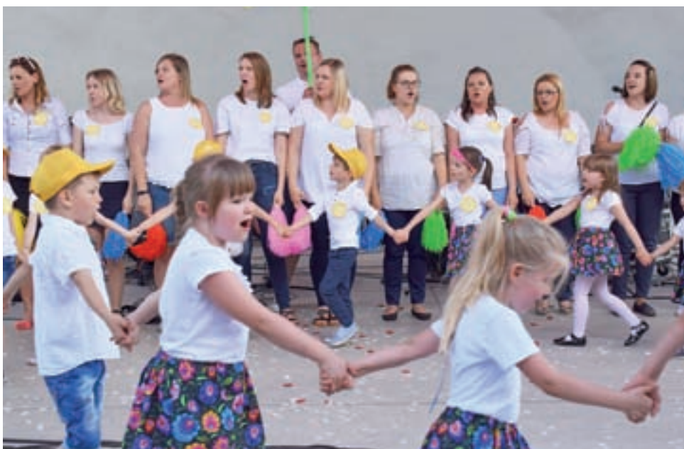
Występ dzieci z Przedszkola nr 4.

Są też dzieci, które od koni mechanicznych wołały żywe – dla nich atrakcją była możli-