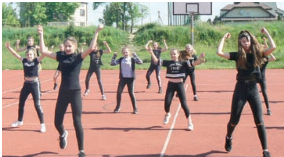
Pokaz tańca w wykonaniu uczennic szkoły.