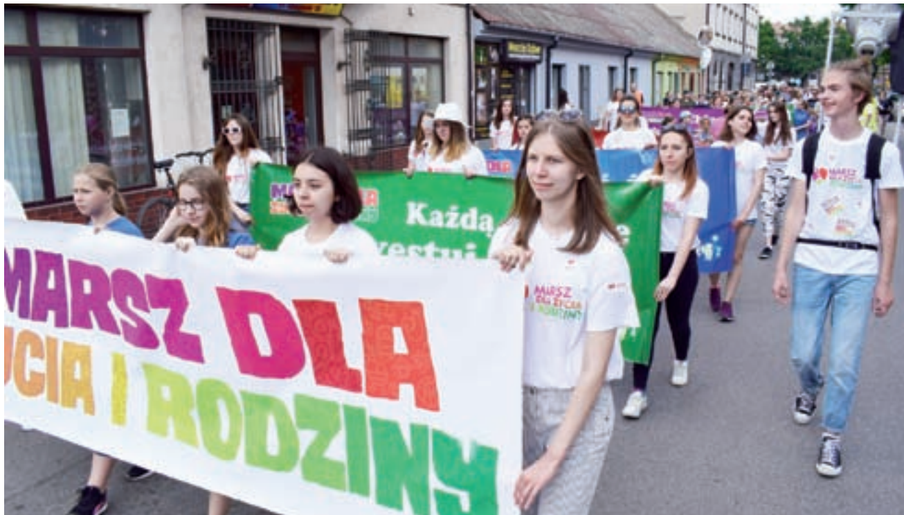
Marsz idzie ulicą 11 Listopada, prowadzi go młodzież ze szkół pijarskich.

Skandując prorodzinne hasła uczestnicy przeszli ulicami 11 Listopada, Alejami Sienkiewicza, Kurkową i Stanisławskiego na Nowy Rynek, a następnie Kozią i św. Floriana na Błonia, gdzie już od 13.00 wiele osób bawiło się na pikniku rodzinnym. Po drodze swoje świadectwo – o tym jak bardzo rodzina wspierała go, wbrew