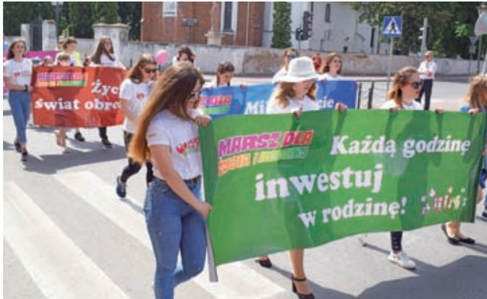
„Każdą godzinę inwestuj w rodzinę!” – brzmiało jedno z marszowych haseł.

W tym roku nacisk kładziony jest także na prawo rodziców do wychowywania dzieci w zgodzie z własnymi przekonaniem, w przeciwstawieniu do szkolnych zajęć edukacji seksualnej proponowanych przez szeroko rozumiane środowiska LGBT. Sprzeciw ten jednoznacznie wybrzmiał w hasło ogólnopolskim: „Seksendukacja to deprawacja!”. Choć