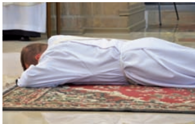
Prostracja jest wyrazem szczególnego uniżenia się wobec Boga. W tym czasie śpiewana była Litania do Wszystkich Świętych.

Obecnie trwa internetowe zbieranie głosów poparcia. Wniosek ze Zdun znajduje się pod linkiem https://pomotomoc.pzu.pl/node/964 . mwk