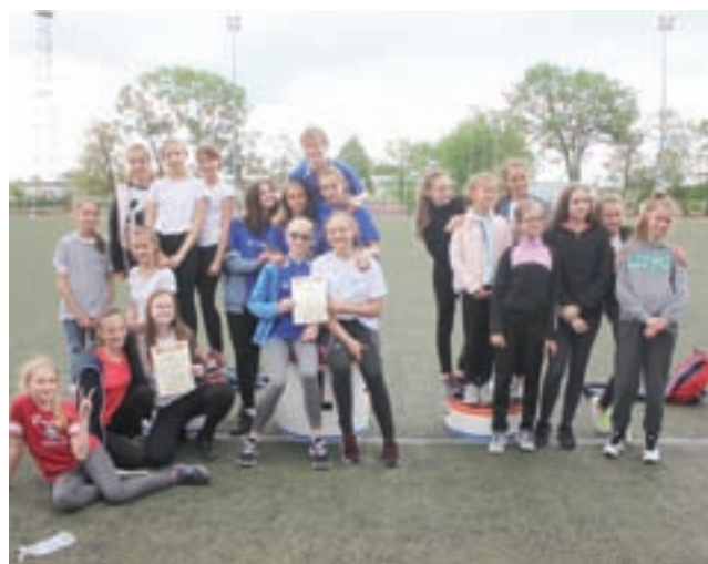
Najlepsze lekkoatletki powiatu łowickiego.