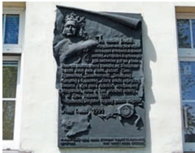
Tablica ufundowana przez Radę Miejską Strykowa w rocznicę 600-lecia miasta została zawieszona na budynku szkoły 25 lat temu.