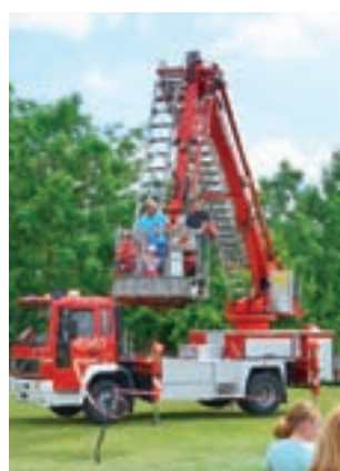
Strażacy zapewnili możliwość spojrzenia na Zduny z góry.