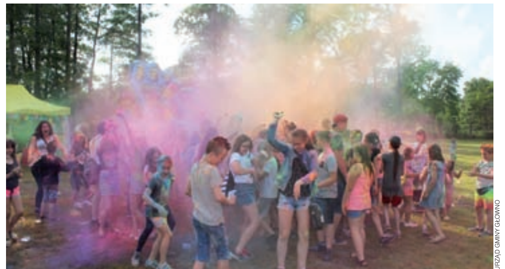
Kolorowy pył wiruje nad uczestnikami zabawy.

Największą gratką okazała się jednak atrakcja popołudniowa, czyli festiwal kolorów. Punktualnie o godzinie 18.00 w górę wyrzucono kolorowe proszki, które teren przy gminnym ośrodku zamieniły w bajkową krainę. Tęczowy pył wirował w powietrzu, tworząc magiczną atmosferę, a osadzając się na ubraniach uczestników zapewniał niezapomniane wspomnienia tym, którzy niedzielnego popołudnia nie obawiali się pobrudzenia. A takich nie brakowało! aw