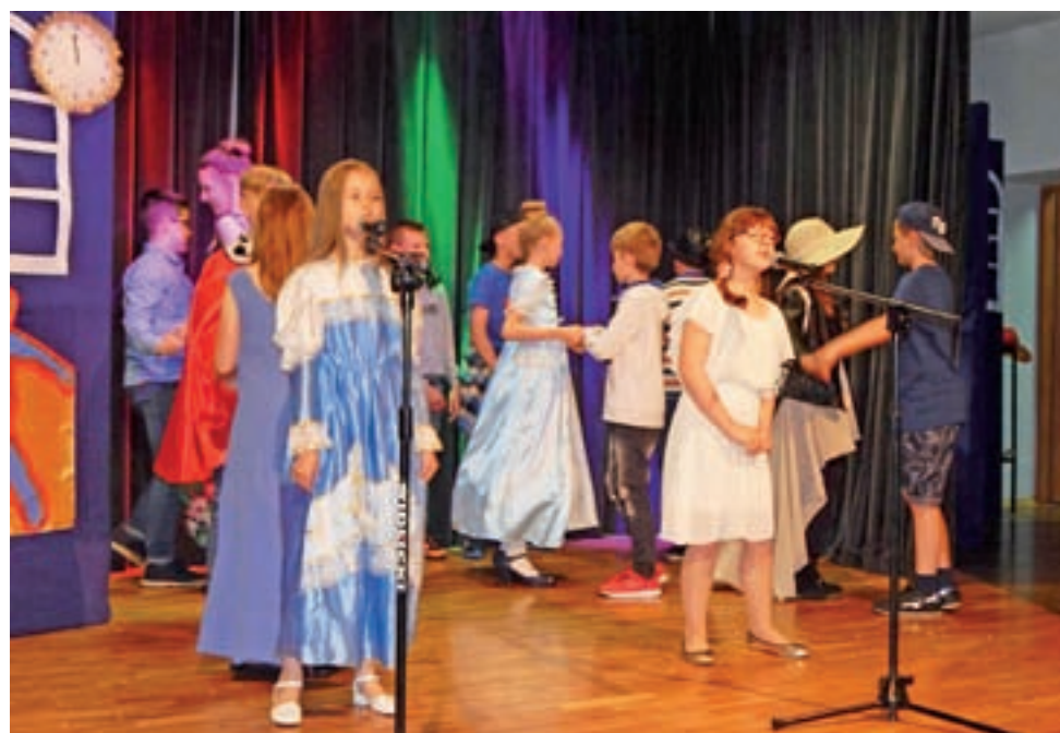
Tym razem na uroczystości dla pań z KGW wystąpili uczniowie z SP w Bąkowie Górnym.