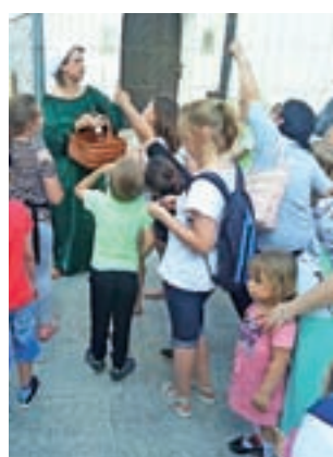
Pierwszym przystankiem była bazylika katedralna.

Uczestnicy spaceru spotkali się na Starym Rynku. Odwiedzili ważne dla historii Łowicza miejsca w centrum, do których prowadzili ich dwie mieszczki. Poznali (lub przypomnieli sobie) opowieść o figurce diabła na fasadzie bazyliki, która – według legend – skutecznie broni się przed usunięciem, mimo podejmowania wielu prób. Przy bramie prymasowskiej duch jednego z pryma-