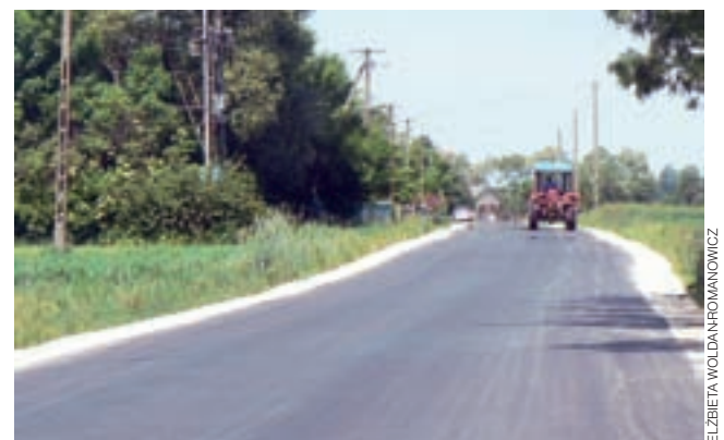
Nowa nawładka. Stan drogi Władysławów Popowski – Mięśiośnia na 31 maja.

O inwestycji, znajdującej się jeszcze przed odbiorem końco-