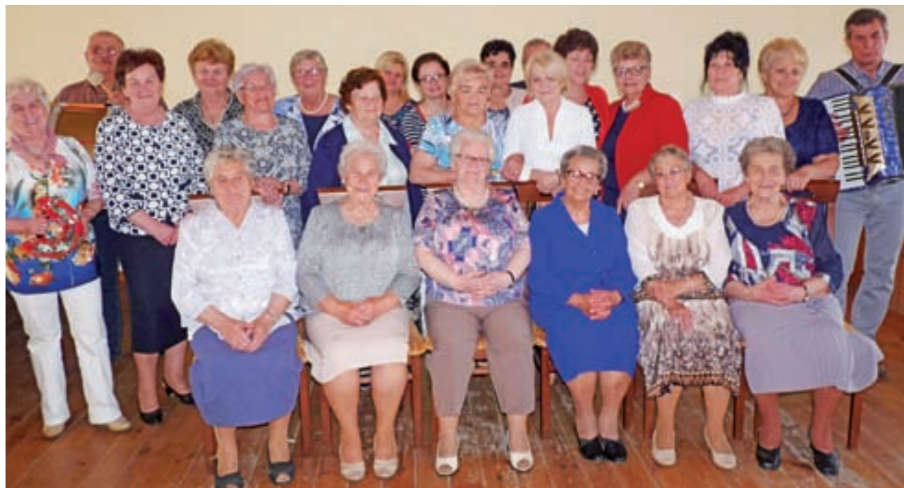
Uczestnicy jubileuszu 10-lecia Słonecznych Dębów – seniorzy i ich goście.

Każda z osób należących do koła włożyła w nie cząstkę samego siebie, swojego czasu, a nawet i trudu, bo po to, aby ktoś mógł miło spędzić czas, ktoś inny zawsze musi włożyć sporo zaangażowania.