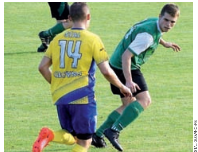
Stal wygrała bez wysiłku.