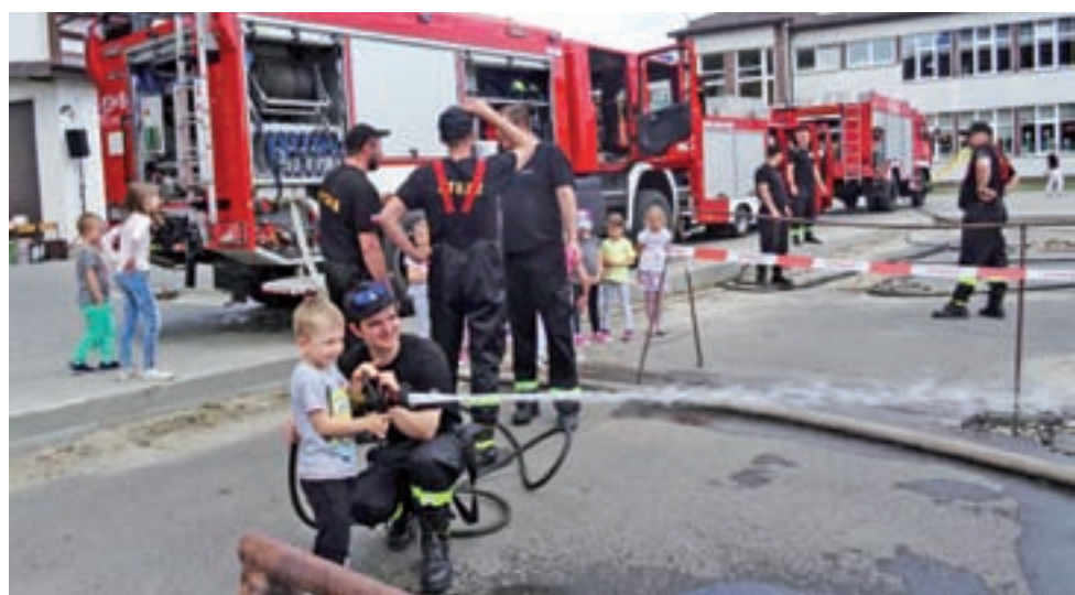
W trafianiu wodą do celu małych strażaków wspierali więksi i bardziej doświadczeni – druhowie z OSP w Domaniewicach i Reczycach.