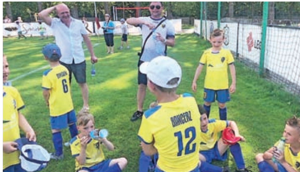
Młodzi piłkarze Strykowa mimo zmęczenia odczuwali dużą radość z osiągniętych wyników.