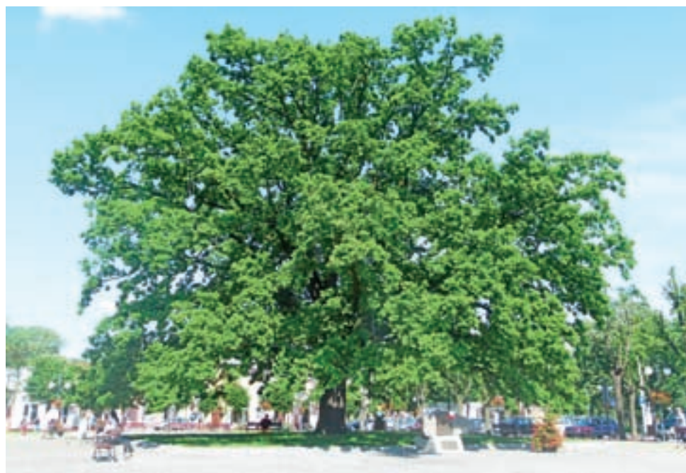
Nasz najpiękniejszy! Stuletni Dąb Wolności walczy o tytuł Drzewa Roku. Na głowieńskim Placu Wolności prezentuje się naprawdę okazale.

O tym, co jest celem konkursu, jego organizatorzy piszą tak: „Nie szukamy drzew najstarszych, najwyższych, najgrubszych, najpiękniejszych, ani najrzadszych. Szukamy drzewa najbardziej kochanego, drzewa z opowieścią, drzewa, które pobudza wyobraźnię i jednoczy ludzi”. Warto tu wspomnieć, że ambasadorami