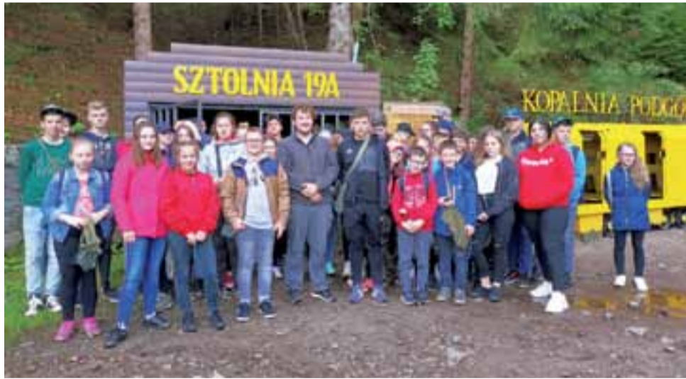
Tu wydobywano uran. Wycieczkowicze z Popowa przed nieczynną już Kopalnią Podgórze, którą zwiedzali z przewodnikiem.