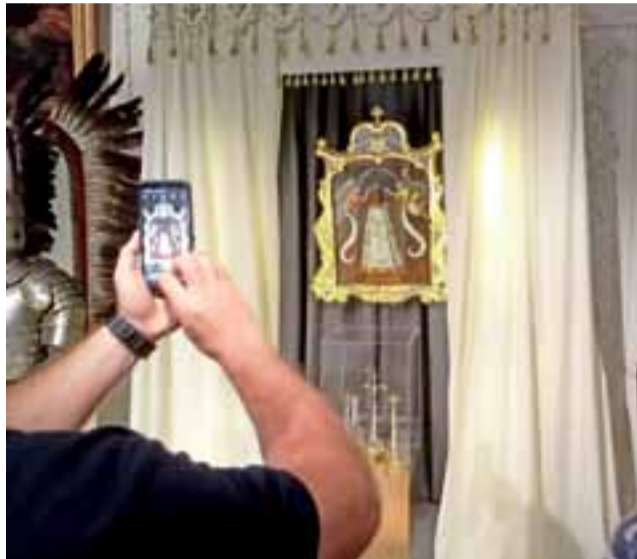
Najcenniejszym zbytkiem wystawy jest Matka Boska spod Wiednia, obraz datowany na I połowę XVII wieku.

Wyjątkowość nowej wystawy polega na tym, że Radziwiłłowie – potomkowie dawnych właścicieli nieborowskich dóbr – udostępniłi wiele swoich pamiątek, nigdy nie eksponowanych. Najcenniejszym eksponatem (ten akurat był już prezentowany) jest niepozorny wizerunek Matki Bożej (datowany na I połowę XVII wieku), który został znaleziony w 1683 r. w drugim dniu odsieczy wiedeńskiej. Przez króla Jana III Sobieskiego został on odczytany jako symbol zwycięstwa nad armią turecką, ze względu na napisy widniejące na szarfach trzymany przez anioły, odnoszące się (przypadkiem) do imienia króla. Treść tych napisów to: „In hac Imagine Mariae Victor ero Ioannes”, czyli „W tym obrazie Maryi ja Jan będę zwycięzcą” oraz „In hac Imagine Mariae Vincens Ioannes” czyli