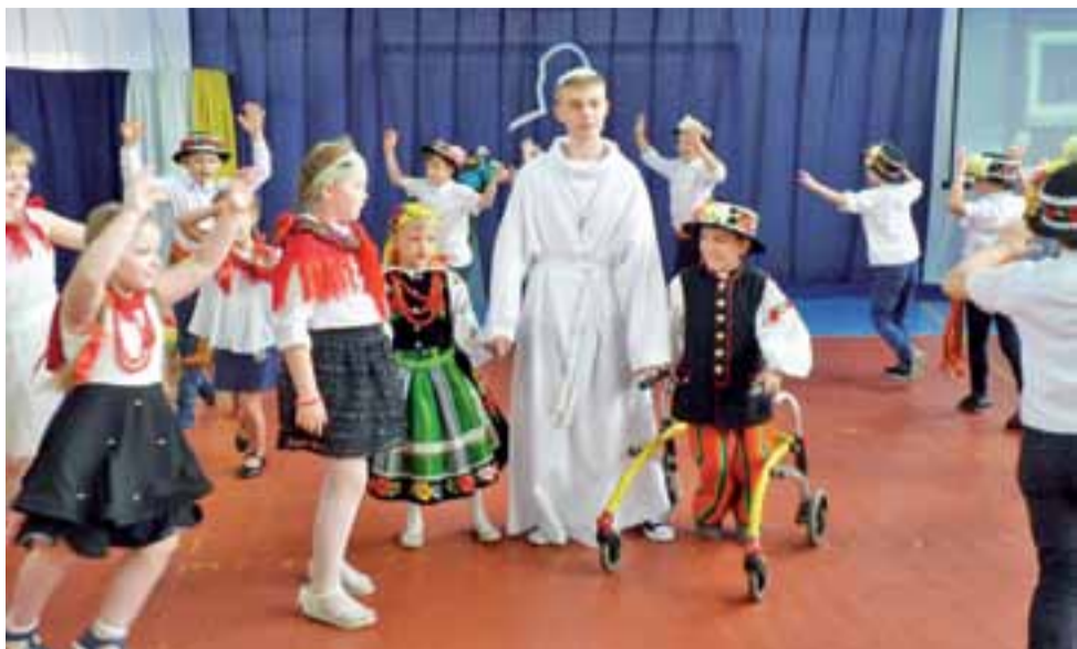
Nie zabrakło ludowego akcentu. W części artystycznej uroczystości uczniowie ubrani w stroje ludowe wzięli do tańca w kółeczku Jana Pawła II.