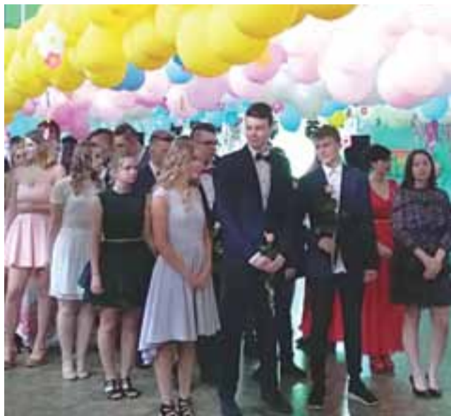
Wyjątkowa chwila. Ostatni rocznik gimnazjalistów na chwilę przed tradycyjnym polonezem.

– Dzisiejszy wieczór niech będzie czasem zabawy – powiedział burmistrz.