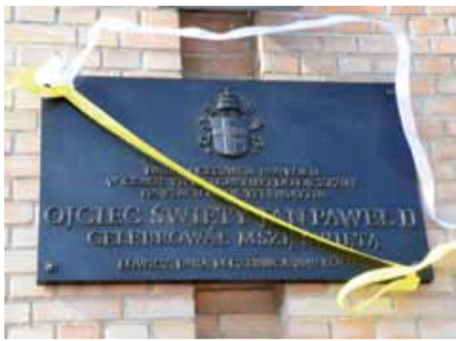
Tablica upamiętniająca wizytę Jana Pawła II w Łowiczu na frontonie kościoła Chrystusa Dobrego Pasterza.