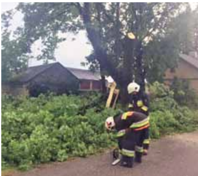
Powalone drzewa i nadłamane konary to efekty burzy, z którymi musieli się mierzyć strażacy.

W godzinach popołudniowych, kiedy na terenie Głowna i Strykowa opady deszczu były najbardziej intensywne, strażacy interweniowali wielokrotnie w sprawie powalonych drzew oraz nadłamanych konarów, wiszących nad jezdnią. Do takich interwencji doszło m.in.: w Lubiankowie i Ostrołęce, a także w Ługach, Dobrej czy Anielinie. aw