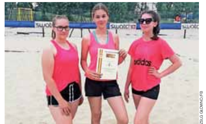
Uczennice SGP Głowno w ramach IMS zagrały bardzo dobrze.