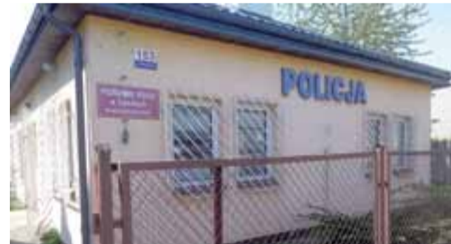
Posterunek policji przy ul. Warszawskiej w Sannikach.

Zmiany będą widoczne również z zewnątrz: budynek zostanie docieplony, wymienione zosta-