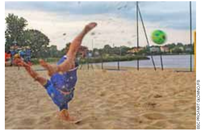
Plażowa piłka nożna w Głowniu przeżywa prawdziwy rozkwit.