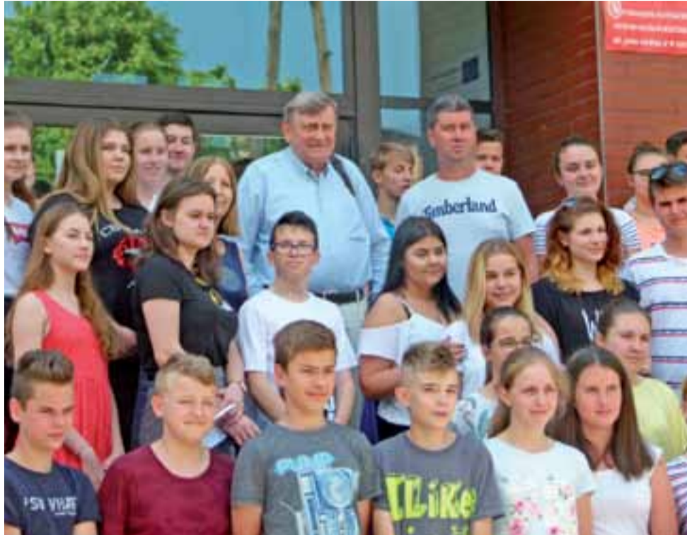
Uczniowie KLO oraz SP nr 2 w Głownie na pamiątkowej fotografii z Mirosławem Hermaszewskim.

Szkoda było czasu na sen, dlatego wolałem podziwiać. Nad Polską przelatywaliśmy w ciągu 87 sekund i było to doświadczenie niezwykle. Krzychałem, że po raz pierwszy widzę swój kraj w całości.