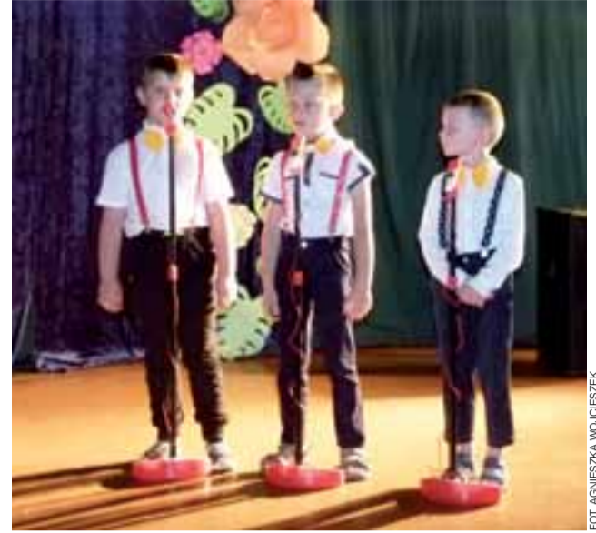
Mali dżentelmeni przekonywali, że najwięcej witaminy mają polskie dziewczyny.