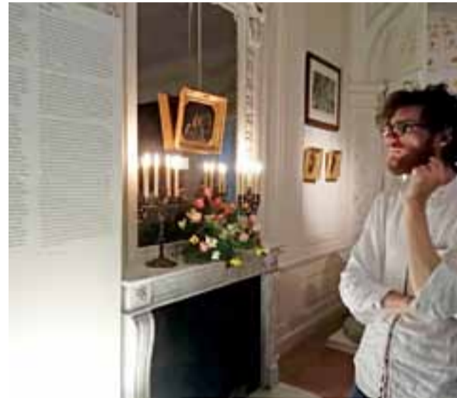
Większość obrazów i pamiątek rodzinnych tworzących wystawę nigdy nie była nigdzie eksponowana.

Obraz, który jest pod opieką Radziwiłłów od dziesięciu pokoleń, pokazywany był dotąd jedynie w 1883 i 1983 roku, podczas dwóch wystaw upamiętniających 200. i 300. rocznicę zwycięstwa pod Wiedniem. Obie te wystawy