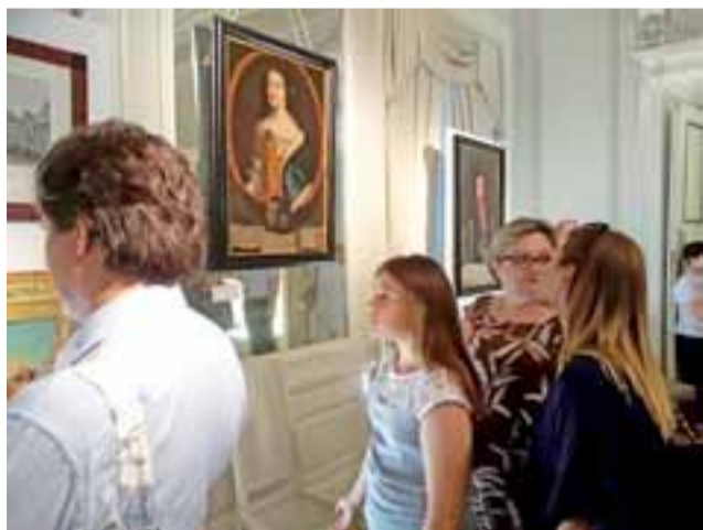
Na wystawie prezentowane są także obrazy przedstawiające Radziwiłłów. Pośrodku zdjęcia widoczny jest obraz Katarzyny z Sobieskich Radziwiłłowej.