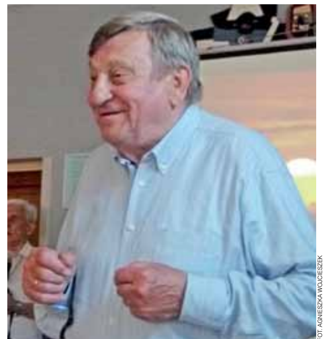
Uśmiech często gościł na twarzy prelegenta.

Kiedy po czterdziestu latach służby generał Mirosław Hermaszewski przeszedł w stan spoczyn-