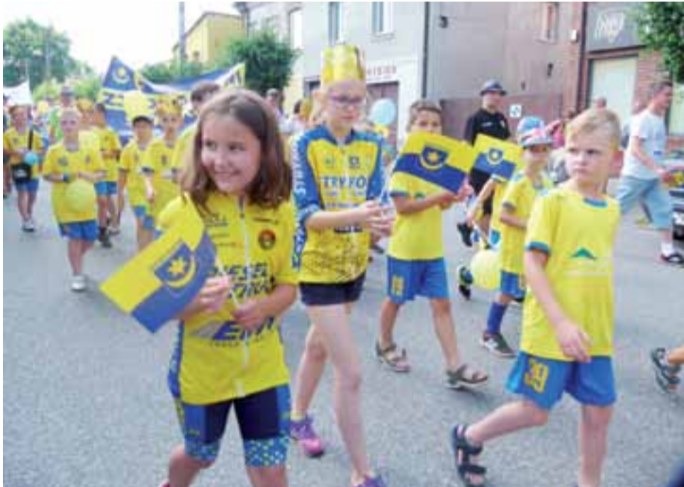
Korowód 625-lecia. Na zdjęciu młodzi sportowcy – kolarze i piłkarze ze Strykowa w barwach swoich drużyn.

Z bardzo interesującymi opowieściami i pokazami, obejmującymi walki wojów i dawne rzemiosło, przybyli do Strykowa pasjonaci rekonstrukcji historycznych z Drużyny Wojów Piastowskich Jantar z Wielkopolski, wspierani przez Wnóków Swarzędzka z Łodzi. Do tej drugiej grupy