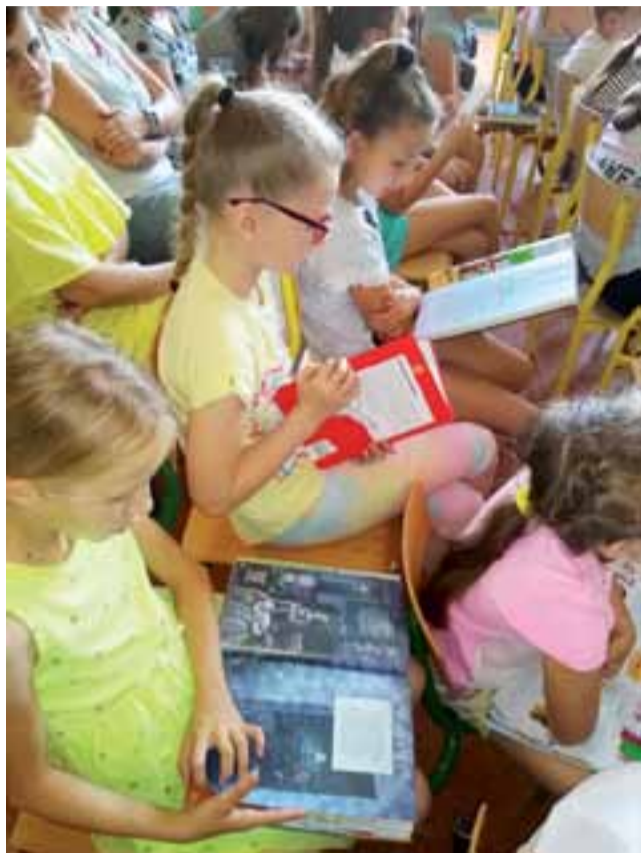
Młodzi z książką. Popowska odsłona ogólnopolskiej akcji.