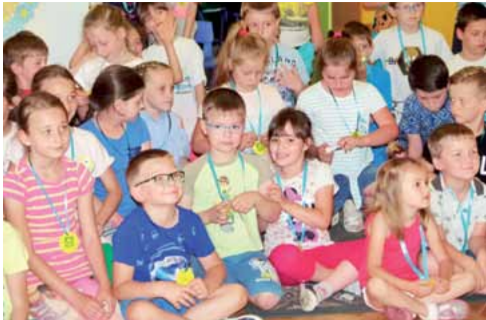
Dzieciaki na medal. Pamiątkowe medale otrzymali zarówno uczestnicy, jak i publiczność Strykowskiej Familiady.

Rywalizowały dwie drużyny, a pytania, które poprzedzono ankietami wśród mieszkańców, dotyczyły wiedzy na temat miasta i gminy Stryków. Należało m.in. wskazać jakie drzewa i jakie zwierzęta występują najczęściej w strykowskich lasach, jakie instytucje mają siedzibę w Strykowie i jakimi środkami komunikacji można