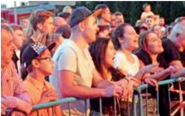
Bo jak nie my, to kto? Tak było w niedzielę, gdy na Dniach Strykowa wystąpił Mrozu.