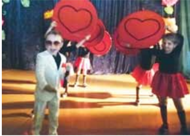
„Do zakochania jeden krok”, czyli występ małych artystów inspirowany twórczością Andrzeja Dąbrowskiego.

W trakcie części artystycznej mogliśmy podziwiać umiejętności przedszkolaków z Lubiankowa, Mąkolic, Piątku, Głowna oraz Popowa Głowieńskiego. Łącznie na scenie zobaczyliśmy 150 uczestników w 17 występach. aw