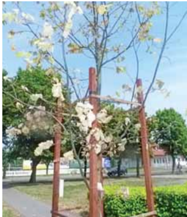
Dąb Niepodległości. Stan na 13 czerwca.