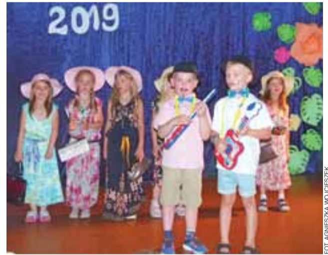
„Czerwone Gitary” zaskoczyły swoją aranżacją piosenki „Dozwolone od lat 18”.

Popów Głowieński | Zespół Szkolno-Przedszkolny