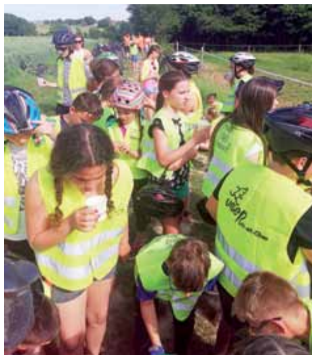
Na przystankach największym powodzeniem cieszyło się coś do picia.

Co do tego, że wyjazd, który połączył w sobie elementy edukacji przyrodniczej, historycznej, geograficznej, językowej i