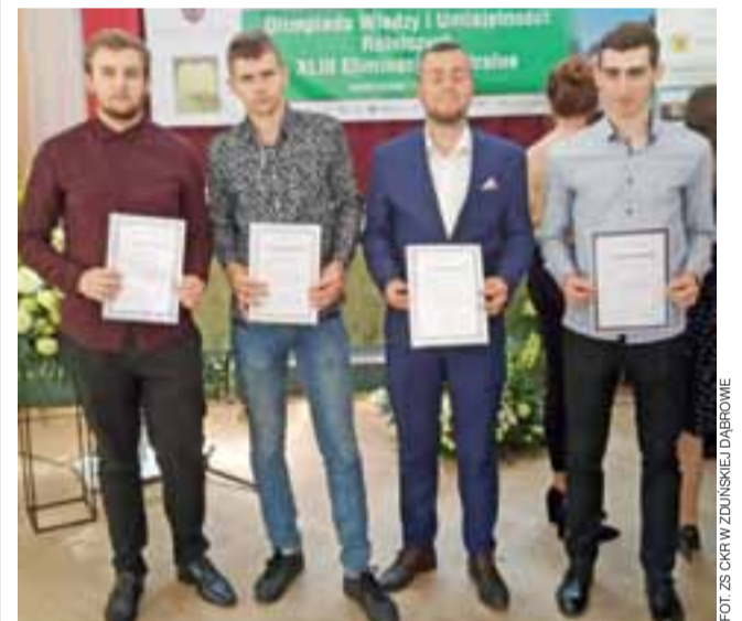
W tym roku szkoła w Zduńskiej Dąbrowie dochowała się 4 finalistów Olimpiady Wiedzy i Umiejętności Rolniczych.