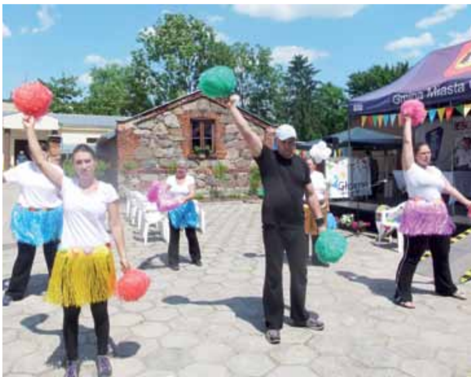
Kolorowo, wesole, rodzinie – właśnie tak było podczas tegorocznego przeglądu.

W swoim kazaniu ordynariusz mówił o tajemnicy Trójcy Świętej, o tym, że Boga Ojca, Syna i Ducha Świętego łączy miłość, bo przecież „Bóg jest miłością” – co było hasłem pielgrzymki Jana Pawła II do Polski. str. 23