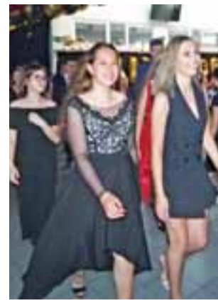
Niech żyje bal! Roześmiane uczennice na Balu Ósmych Klas w SP nr 2 w Głownie.

Swoją pierwszą imprezę – Bal Ósmych Klas – uczniowie rozpoczęli od poloneza – przepięknie zatańczonych na elegancko udekorowanym szkolnym holu. Rodzice i nauczyciele oglądający tańce nagrodzili ich brawami.