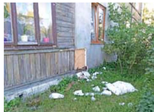
- Kawalki styropianu, będące pozostałością prowadzonej ekspertyzy zostaną usunięte w najbliższym czasie - zapewnił nas dyrektor MZK.

W opinii naszych rozmówców budynek komunalny, w którym większość z nich mieszka od urodzenia, czyli od kilkudziesięciu lat, dosłownie rozpada się na ich oczach. Winą za taki stan rzeczy obarczają jego administratora, czyli Miejski Zakład Komunalny w Głownie, który – ich zdaniem – od dekad nie prowadzi prac remontowych, w wyniku czego obiekt nie nadaje się już do użytku.