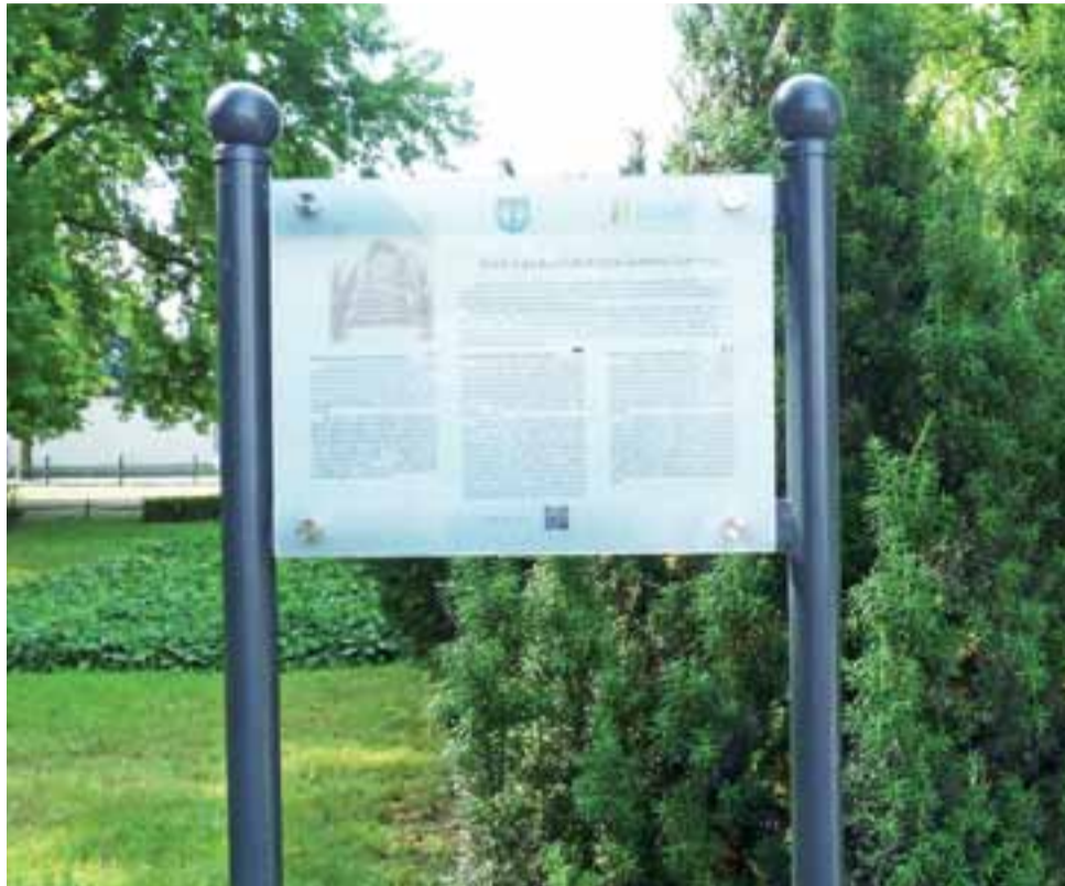
Jedna z tabliczek stanęła w alejach Sienkiewicza przy pomniku Artura Zawiszy Czarnego.

Do tematu wrócono w 2016 roku, uzupełniono dokumentację, którą rozpoczęto tworzyć w 2008 i 2009 roku, wystąpiono z ponowną prośbą o możliwość umieszczenia tablic na zabytkach. Na odpowiedź trzeba było czekać długo, ale w końcu w 2017 roku rozpoczęły się intensywne działania. Teksty, jakie miały znaleźć się na tablicach