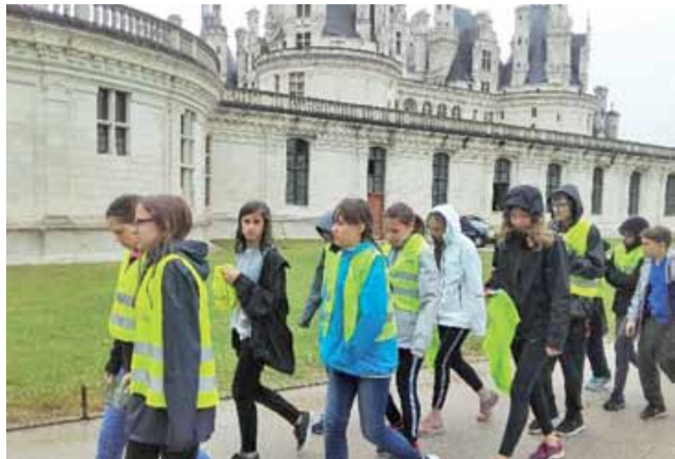
Łowicka grupa przy wielkim królewskim zamku Chambord. Jak widać: ciepło wcale tam nie było.