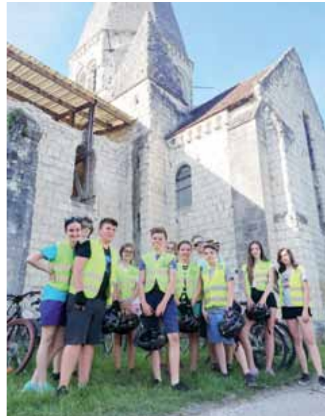
Zabytkowy kościół w trakcie odnowy – jeden z wielu przystanków na trasie.