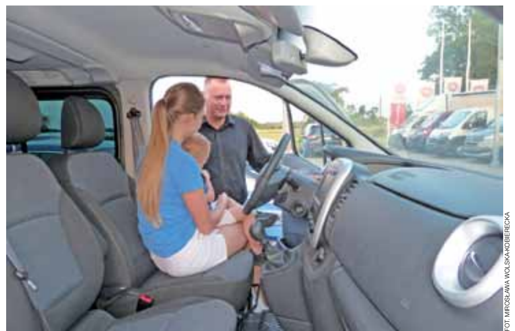
Spółka MGT oferuje sprzedaż tylko dostawczych Fiatów, stąd też „Noc cudów” nie przyciągnęła wielu klientów.

Wspomniani klienci zakupili Fiata Talento za 109 tys. zł (cena regularna wynosi 120 tys. zł) oraz Fiata Fiorino za 37 tys. zł (w tym przypadku upust wyniósł 4 tys. zł). mwk