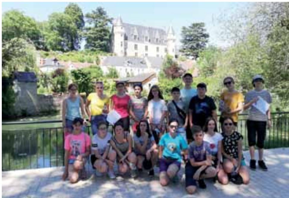
W tle zamek Montresor, należący do rodziny Reyów, obok most zaprojektowany przez Gustawa Eiffila.