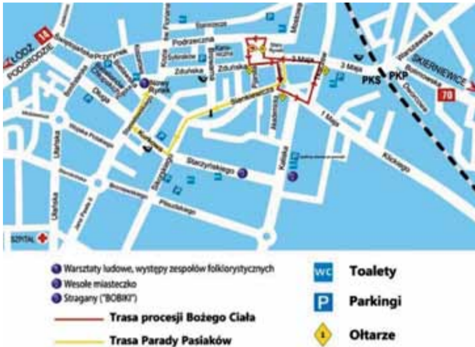
Mapka z zaznaczonymi trasami procesji oraz parady pasiaków.

Uroczystości kościelne rozpoczną się mszą świętą w bazylice katedralnej o godzinie 10.30. Po błogosławieństwie wyruszy procesja, czyli jeden z symboli Łowicza – bo choć w tym dniu procesje będą szły w całej Polsce, to ta łowicka od dawna uważana jest za unikatową i jedyną w swoim rodzaju. Trasa procesji, tak jak rok i dwa lata temu, będzie wiodła przez ulice 11 Listopada, plac Koński Targ, Tkaczew i 3 Maja. Zacznie się i zakończy na Starym Rynku. Cztery ołtarze na trasie przygotowują: ojcowie pijarzy, cech rzemiosł i repre-