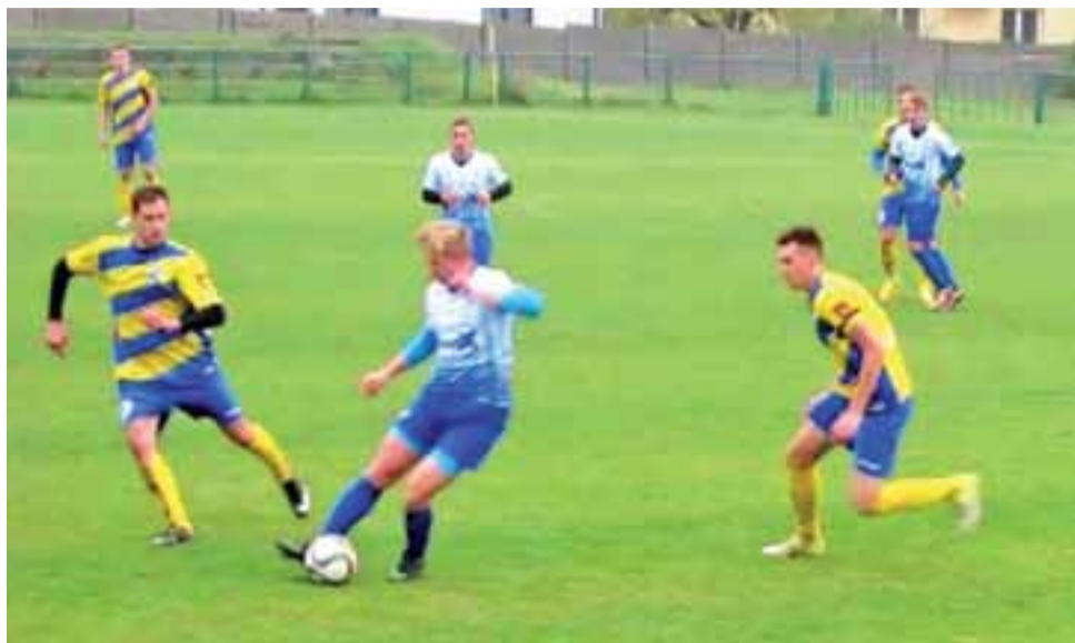
Stal Głowno (żółto-niebieskie stroje) zawsze toczyła z łódzkim SMS-em dość zacięte boje.

Ostatecznie Stal zakończyła sezon na dobrym 4. miejscu. Poza zasięgiem był mistrz ŁKS II Łódź, a dość wyraźnie odskoczyły też RTS Widzew II Łódź i Zawisza Rzgów. W kolejnym sezonie te dwie drużyny będą największymi