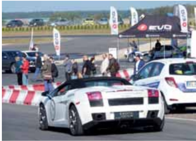
Tor Łódź podczas dnia otwartego dla dziennikarzy w 2016 roku.