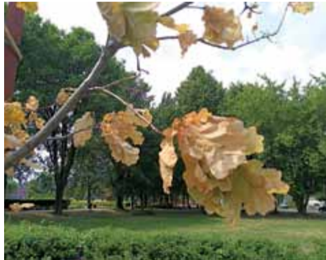
Smutny widok. Zeschnięte liście na Dębie Niepodległości.

– Tamto drzewo można było wypielegnować, skrócić, zrobić im inne korony. Zawsze drzewo wśród towarzystwa lepiej się czuje, bo one wzajemnie się oceniają. On (Dąb Niepodległości – dop. red.) prawdopodobnie był wśród drzewostanu, bo wysoko rośnie, nie ma tych gałęzi bocznych. A teraz został biedny sam na tym upa-