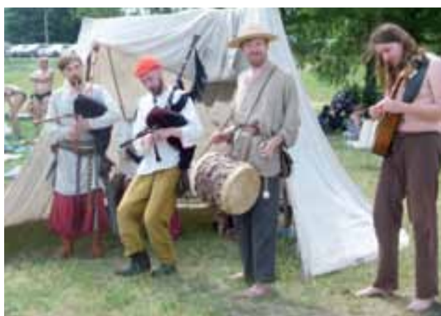
Średniowieczni grajkowie. Zespół Muzyki Dawnej Huskarł wystąpił w Strykowie grając na replikach instrumentów sprzed wieków.