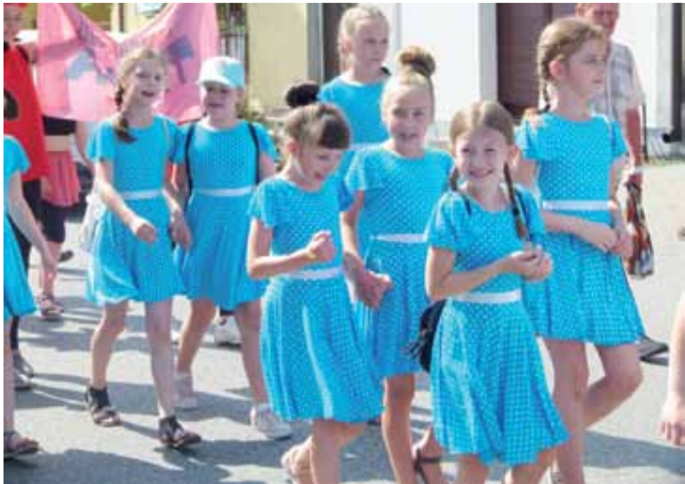
Kolorowy Korowód 625-lecia wyrusza z Placu Łukasieńskiego. Tu idą tancerki z zespołu Agat.