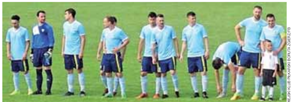
Zjednoczeni Stryków zajęli wysokie 6. miejsce w IV lidze, z czego powinni być zadowoleni sami piłkarze oraz kibice i zarząd.