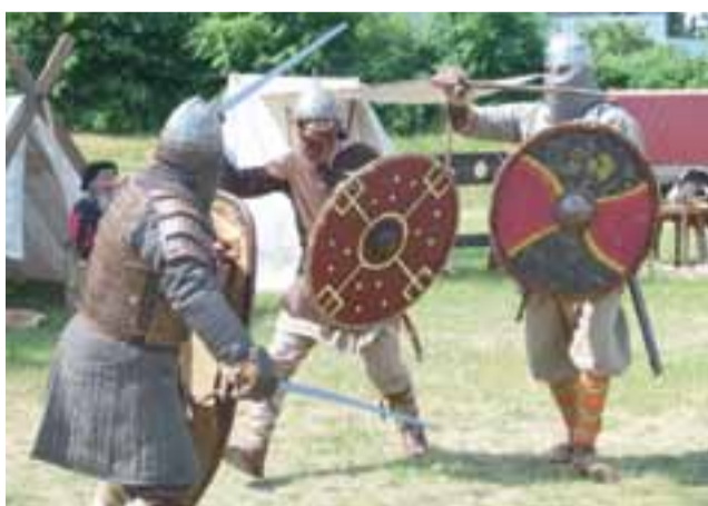
Dwóch na jednego? Pokaz walki w wykonaniu członków Drużyny Wojów Piastowskich Jantar i Wnuków Swarozycza.