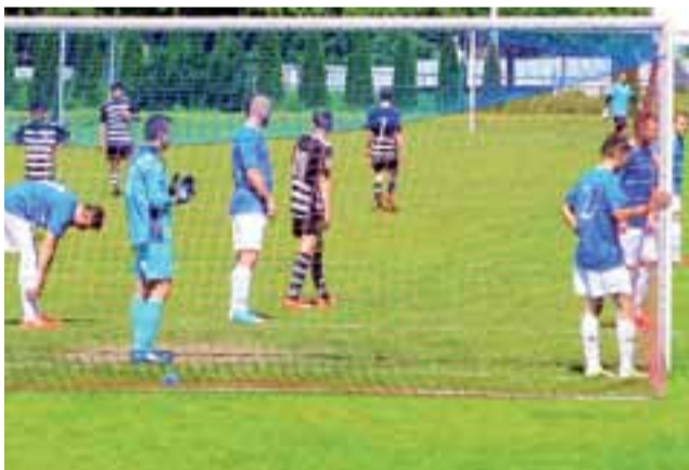
Błękitni Dmosin (niebieskie koszulki) wywalczyli podium w rozgrywkach klasy A, gr. II już po raz drugi z rzędu.

W gr. III o honor walczyli piłkarze z Głowna. Mający w trakcie sezonu spore problemy klub OSP Iskra na zakończenie rozgrywek przegrał 2:3 z LKS Świnice Warckie. Głównianie uplasowali się na przedostatnim miejscu. Iskra była zdecydowanie najsłabsza, a nie jest ostatnia w tabeli tylko dlatego, że z gr. III A-klasy wycofała się Dąbrowianka Dąbrowice. Mistrzostwo i awans do V Ligi oraz szanse rywalizacji ze Stalą Głowno wywalczyły rezerwy KS Kutno. Co ciekawe, pierwszy zespół tego klubu w przyszłym sezonie będzie grał zaledwie o jeden szczebel wyżej w IV Lidze, gdzie rywalizuje m.in. ze Zjednoczonymi Stryków. wp