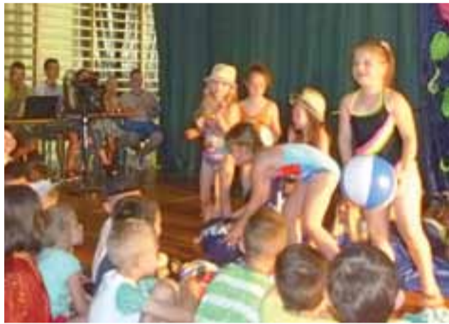
Gwarno jak plaży zrobiło się w sali podczas piosenki z repertuaru Majki Jeżowskiej.