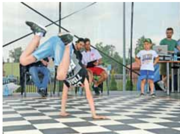
Najmłodszy uczestnik konkursu pokazywał swoje umiejętności podczas solowych występów.

W kategorii I startowało 120 uczestników (od przedszkolaków do uczniów klas III szkół podstawowych). Równorzędne wyróżnienia za indywidualne prezentacje otrzymali: Aleksander