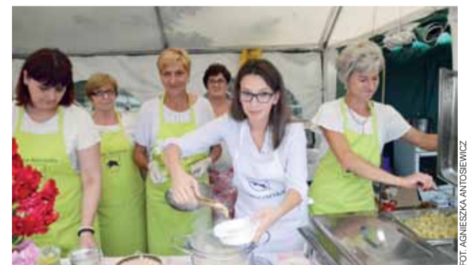
Gospodynie z KGW w Osinach miały pełne ręce roboty z wydawaniem potraw. Specjalnie na imprezę przygotowały ponad 1.000 pierogów i 400 kartaczy, a także żurek z jajkiem i kielbaską, chleb ze smalcem i ogórkiem oraz co najmniej 15 rodzajów ciast.

Zwieńczeniem atrakcji była zabawa taneczna pod gołym niebem z zespołem „Speed”. aa