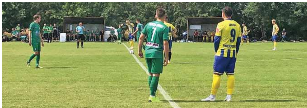
Wysoka wygrana z rywalem zza miedzy, ale też z jedną z rewelacji poprzedniego sezonu musiała ucieszyć kibiców Pelikana.