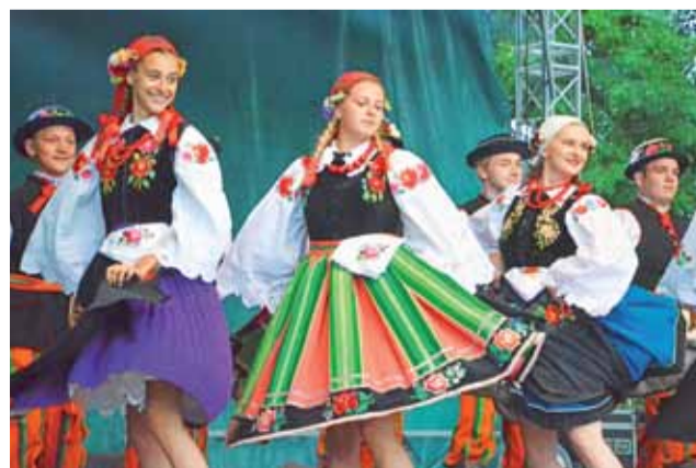
Występ Regionalnego Zespołu Pieśni i Tańca „Boczki Chelmońskie”.