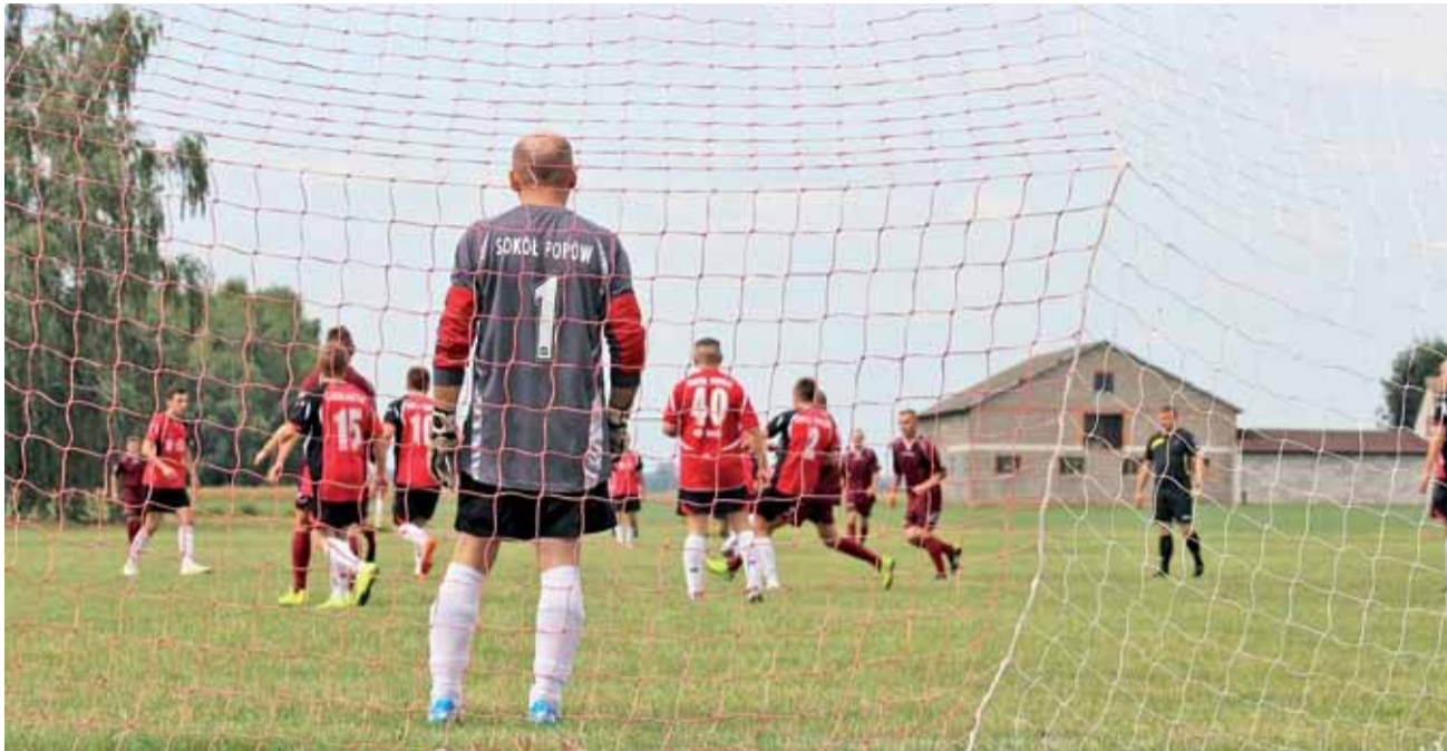
Sokół Popów (czerwone stroje) był bardzo gościnny w tegorocznym Turnieju Piłki Nożnej O Puchar Wójta Gminy Głowno.

Nie brakowało dramaturgii i zwrotów akcji, a w gr. A potrzebne były dodatkowe rzuty karny do ustalenia końcowej kolejności. Domaradzyn pokonał Piaski