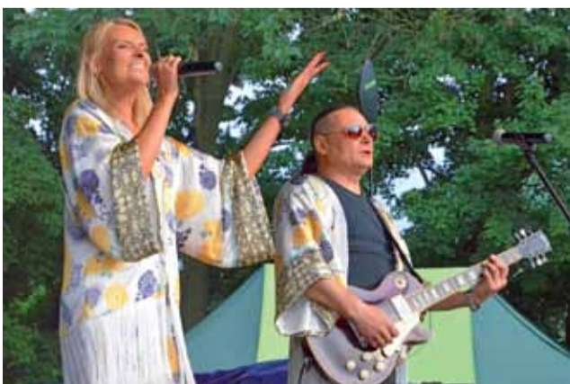
Koncert zespołu „S.O.S. Abba cover show”, który zagrał covery najpopularniejszych utworów Abby.