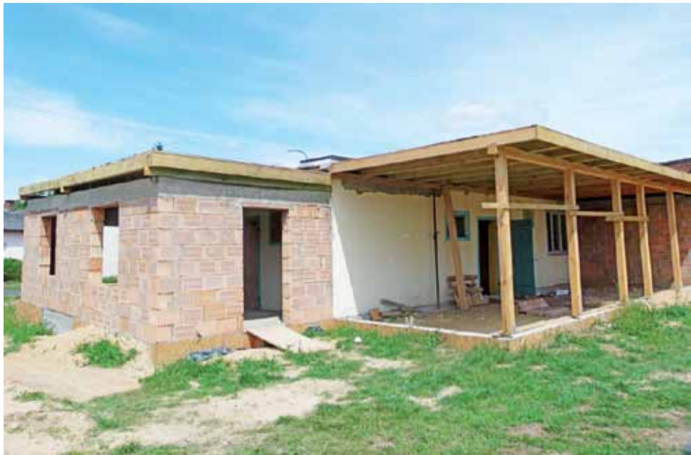
Świetlica w Szczecinie, widok od podwórka. Wykonawca dobudował m.in. przedsionek i taras.

Gmina Dmosin | Inwestycje w Szczecinie i w Ząbkach