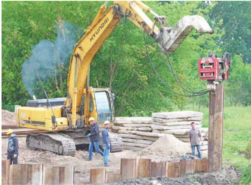
Prace przy wbijaniu ścianki szczelnej.

Wykonawcą inwestycji jest Warszawskie Przedsiębiorstwo Mostowe Mosty Sp z o.o., Budownictwo Sp. komandytowa. Zgodnie z umową, za dobrze wykonaną pracę gmina Stryków zapłaci spółce 1.798.164,06 zł. ljs