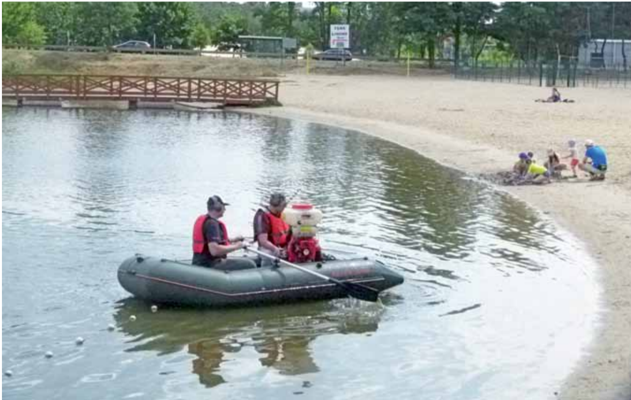
Prace polegające na aplikacji preparatu opartego na bazie wyciągu ze słomy jęczmiennej trwały w piątek, 12 lipca.

– Przyczyną rozprzestrzeniania się glonów w zalewie są pyłki drzew, będące dla nich doskonałą pożywką. Niewykluczone, że przyczyniły się do tego również prace prowadzone na pobliskim waleparku, które poruszyły dno zalewu, gdzie w dużej ilości na-