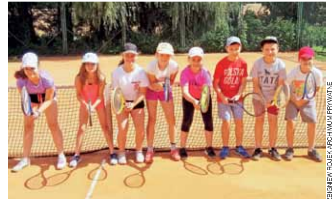
Dzieci grają w tenisa ziemnego na zajęciach Ogniska TKKF Expandor.