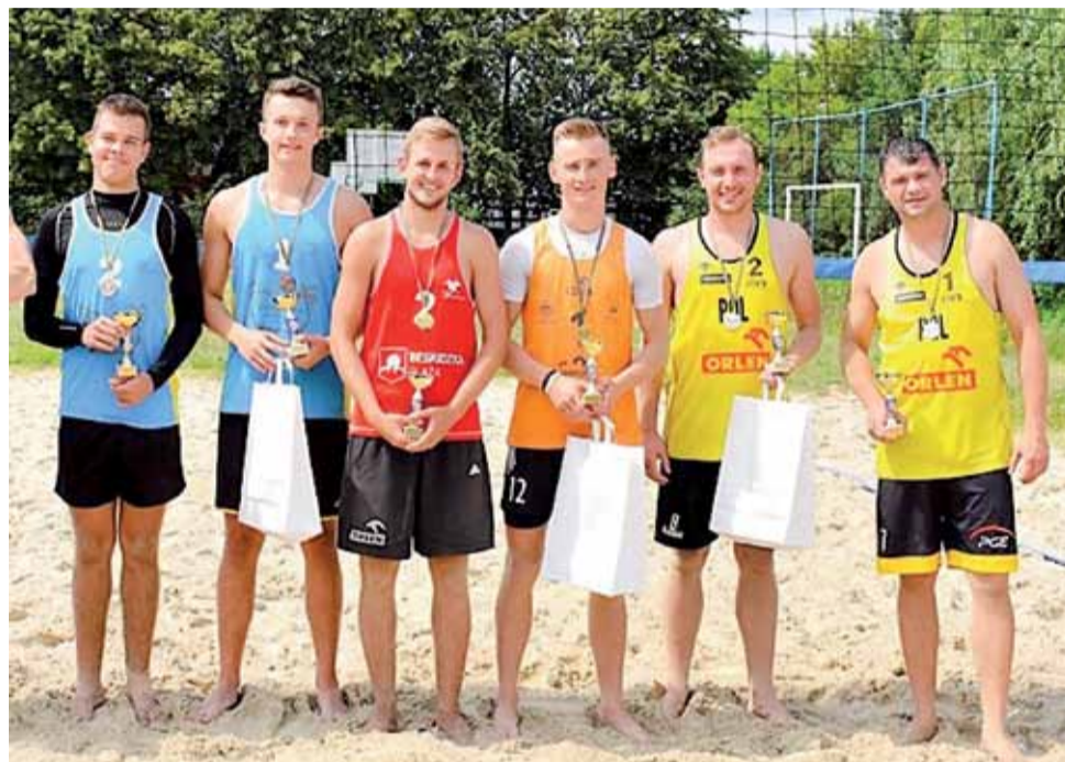
Medaliści I Turnieju Eliminacyjnego OMŁ w siatkówce plażowej. Czterech graczy z prawej to głównianie.

Od początku głównianie wiodli prym w rywalizacji, ale faworyta wskazać było niezwykle trudno. Dość powiedzieć, że późniejsi finaliści musieli walczyć w repasażach, a wiele spotkań kończyło się niewielkimi różnicami punktowymi. Ostatecznie na podium stanęły aż dwie głowienieckie pary, które spotka-