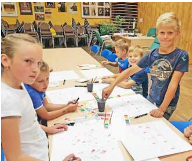
Jedne z zajęć plastycznych, które już odbyły się w ramach tegorocznej oferty Domu Kultury.

Na dziś, 18 lipca, zaplanowano zajęcia plastyczne nad zalewem. We wtorek 23 lipca w programie znalazły się zajęcia z robotyki, podczas których będzie można poznać podstawy programowania i pobawić się robotami z klocków. W czwartek, 25 lipca, na zajęciach pt. Kraina Gagatka zorganizowane zostaną warsztaty sportowo-ruchowo-kreatywne. We wtorek, 30 lipca, do Domu Kultury zawitają z kolei zdalnie sterowane modele samochodów. Zajęcia mają cha-