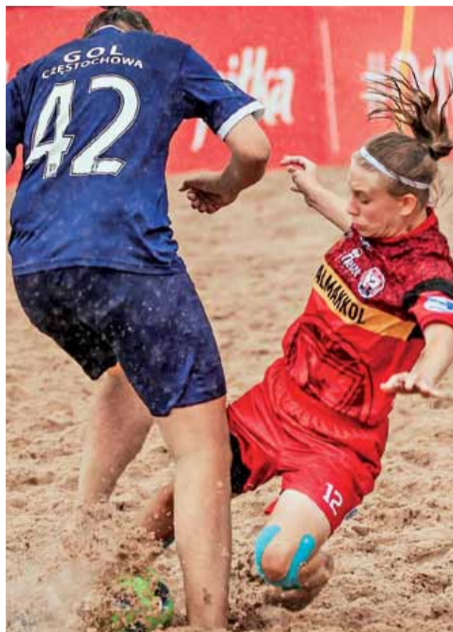
BS Pro-Fart Lejdis (czerwone stroje) w Pucharze Polski Beach Soccera dotarł aż do ćwierćfinałów, w którym uległ ISD-UJD Częstochowa 2:3.

SAN Pro-Fart trafił do grupy C, gdzie w kolejno rozegranych spotkaniach pokonał 6:1 AP Tygryski Świętochłowice przegrał z KKS Zabrze 3:4 i znowy wygrał z Red Devils Ladies Chojnice 5:3, co dało mu wyjście z 1. miejsca w grupie dzięki najlepszemu bilansowi bramek, bowiem po tyle samo punktów (6) miały jeszcze zespoły z Zabrze i Chojnic. W ćwierćfinałowym starciu na SAN Pro-Fart czekał późniejszy finalistą z ISD-UJD Częstochowy, który pokonał Pogoń po zaciętym pojedynku 3:2. Zawodniczkom Pro-Fartu pozostała walka o miejsca 5-8, która przyniosła ostatecznie 7. miejsce w Turnieju i awans do Mistrzostw Polski Kobiet w plażowej piłce nożnej.