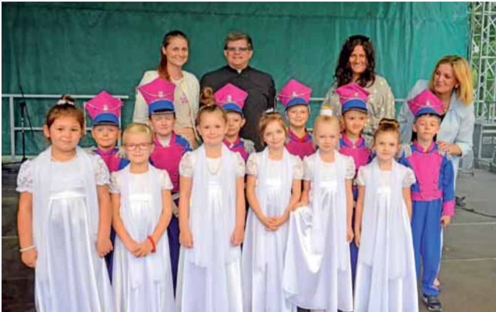
Jedną z atrakcji był polonez w wykonaniu dzieci z Przedszkola Samorządowego w Kiernozi.