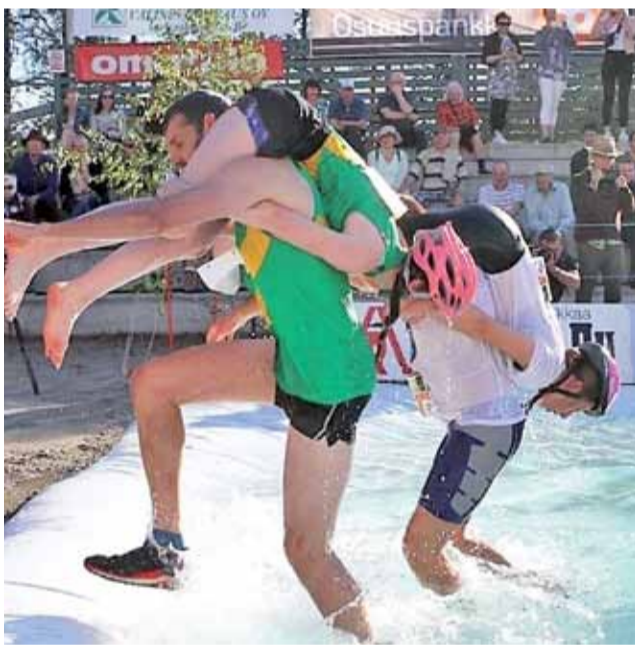
Najtrudniejszy moment biegu – skok do basenu z wodą.

Tradycja noszenia żon wywodzi się z XIX wiekowej Finlandii. Nietypowa banda Herkko Rosvo-Ronkainen rabowała wieś i podkradła żony. Bandzior zarzucał kobietę na ramiona i uciekał z nią w las. Można ją było... wykupić. Trzeba było tylko zaoferować odpowiednią ilość piwa. Obecnie to zawody znane na całym świecie, relacjonowane przez największe telewizje i przy okazji wielka atrakcja turystyczna.