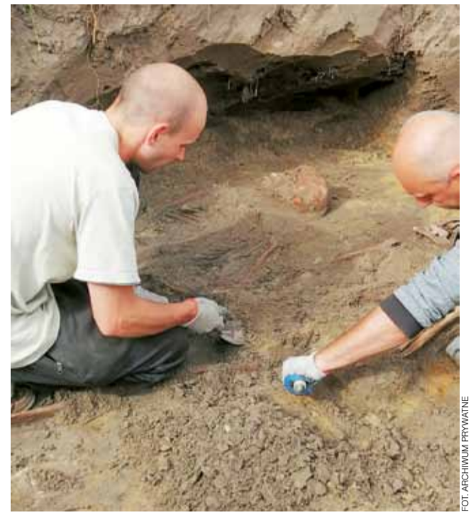
Ekshumacja ciał niemieckich żołnierzy. W tle szczątki jednego z mężczyzn zamordowanych w 1945 roku.

w domu o zamordowaniu dwóch Niemców przez Sowietów, gnany ciekawością, wybiegł na ulicę, by przekonać się czy to prawda.