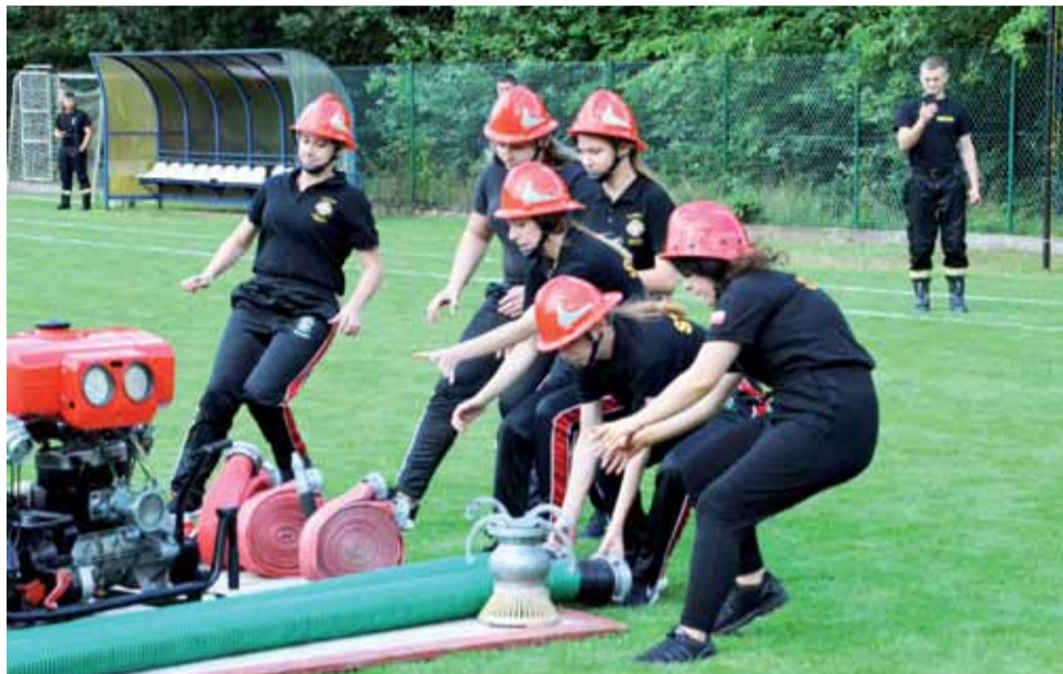
Drużny z OSP Nieborów podczas wykonywania ćwiczenia bojowego.

Najliczniej, jak co roku, była obsadzona grupa „A”, czyli zmagania sztafet męskich, w której wystartowało 14 drużyn. Najlepsi