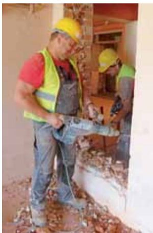
Prace wewnątrz świetlicy w Szczecinie. W ruch poszły m.in. młoty pneumatyczne.

W Szczecinie zaplanowana została przebudowa i rozbudowa obiektu dotychczas wykorzystywanego tylko częściowo. Do tej pory świetlica stanowiła część pomieszczeń budynku, gdzie kiedyś mieścił się sklep GS „SCH”, który w 2015 roku wykupiony został przez gminę. Nowy projekt pozwolił na urządzenie świetlicy łączącej w sobie dwie nowe sale: jedną na zebrania wiejskie, drugą na większe spotkania czy imprezy. Urządzone zostanie zaplecze sani-