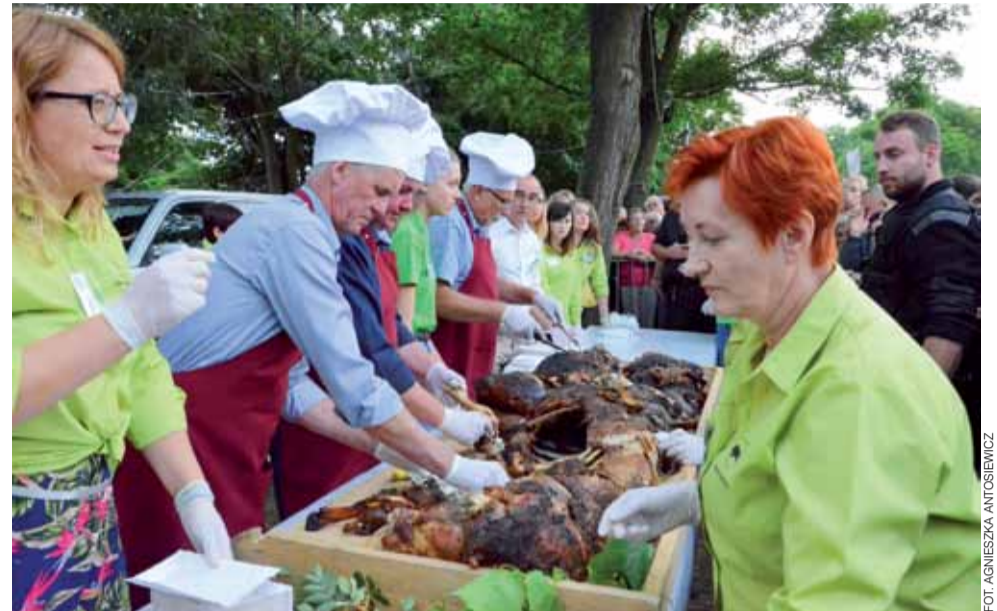
Degustacja mięsa z pieczonego dzika. Na porcje podzielono i rozdano uczestnikom imprezy 3 pieczone dziki.