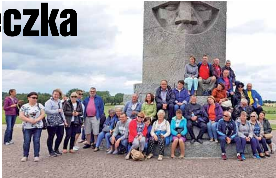
Wycieczkowicze pod grunwaldzkim Pomnikiem Zwycięstwa.

Sobotę rozpoczęło od rejsu statkiem z Rucianego Nidy przez Służę Guziankę, jeziora mazurskie z największym polskim jeziorem Śniardwy, wysiadając w Mikołajkach. Tam wycieczkowicze trafili na Festiwal Rybny, rozlokowany