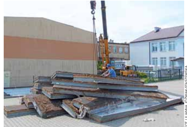
Demontaż starej konstrukcji dachu na sali gimnastycznej SP Dmosin.

Termomodernizacja szkoły polegała na wymianie kotłów wraz z instalacją co z olejowych na kotły na paliwa odnawialne typu pellet, wymianie okien, oświetlenia, dociepleniu ścian budynków, a obecnie – wymianie dachu sali gimnastycznej. Prace zostały zaplanowane na dwa lata z terminem zakończenia do 31 grudnia 2019. Obecnie wymieniana jest konstrukcja dachu sali gimnastycznej, włącznie z jego pokryciem. Wykonawca zakłada płytę warstwową. Zastąpi ona dotychczasową konstrukcję metalową, która uległa wykrzywieniu. Nowe pokrycie ma również bardziej zabezpieczyć salę przed utratą ciepła. Prace związane z dachem potrwać jeszcze około 2 tygodni. Sala zostanie odmalowana w środku. Wykonawca zapewnia, że 1 września uczniowie będą mogli rozpocząć tu rok szkolny. Pozostałe prace termomodernizacyjne idą zgodnie z założeniami.