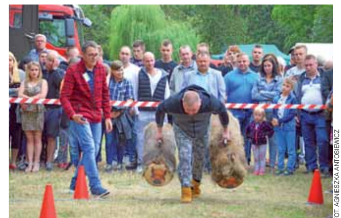
„Bieg z dzikiem” to jedna z konkurencji, w których można było rywalizować i wygrywać nagrody.