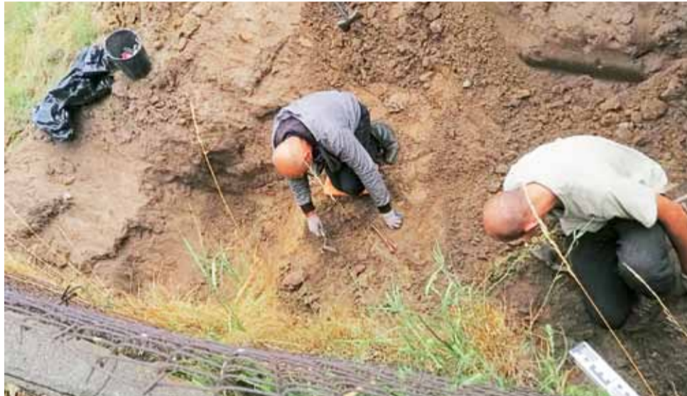
Prace zmierzające do wydobycia szczątków prowadzono za pomocą specjalistycznego sprzętu przez kilka godzin.

Na niemieckie pochodzenie mężczyzn wskazywał znaleziony przy nich nieśmiertelnik. Wątpliwości mieszkańców Mięsośni wzbudza jednak fakt, czy byli oni