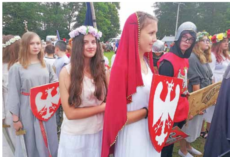
– W przyszłym roku Grunwald znów jest nasz! – zapewnijają harcerze z głowieńskiego Hufca.