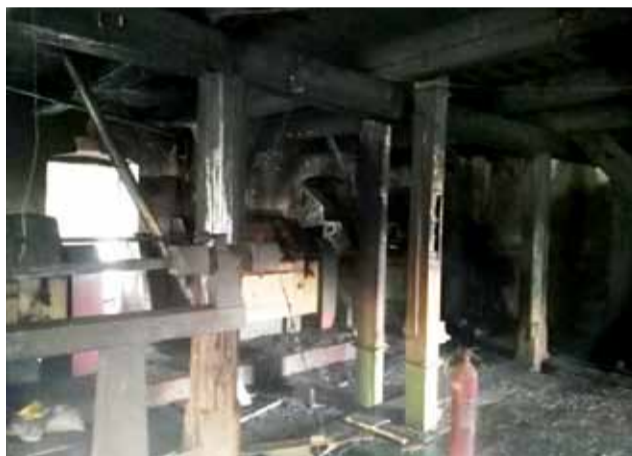
Wnętrze budynku młyna po wtorkowym pożarze.

– Szczęściem w nieszczęściu było to, że budynek był szczelny, co stosunkowo ograniczało dostęp powietrza. Dzięki temu