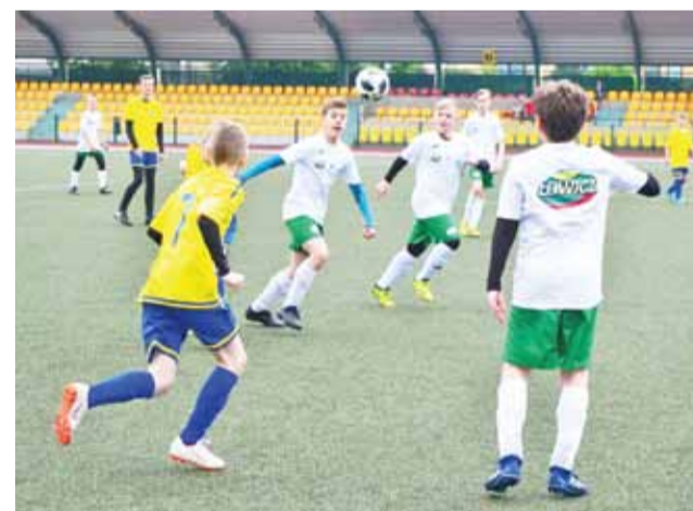
Pelikan 2006 II podczas meczu z Unią Skierniewice.