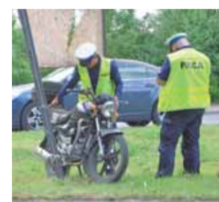
Motorowerzysta uderzył w tablicę ogłoszeniową przy ul. Mostowej w Łowiczu.

Wstępne ustalenia policji wskazują na to, że 64-letni mieszkaniec powiatu łowickiego poruszający się motorowerem Yamasaki, nie