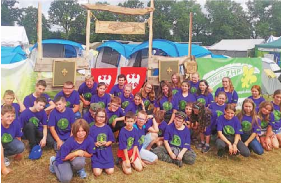
Grupa ponad 40 harcerzy z Główna i okolic reprezentowała nasz region na polach grunwaldzkich.

Dodajmy, że łowickie stroje ludowe, jakie wykorzystano podczas wydarzenia zostały udostęp-